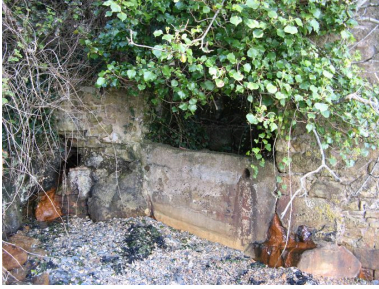
Source actuelle et bassin de la fontaine de Quéléren IVR53_20082908410NUCA