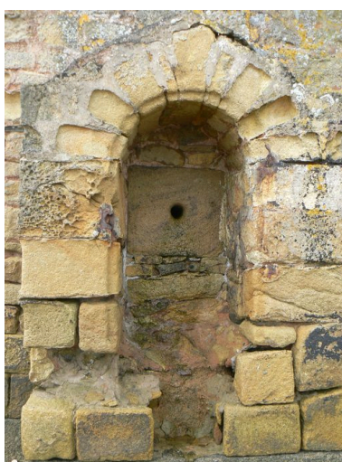
Détail de la fontaine de Quéléren IVR53_20072908962NUCA