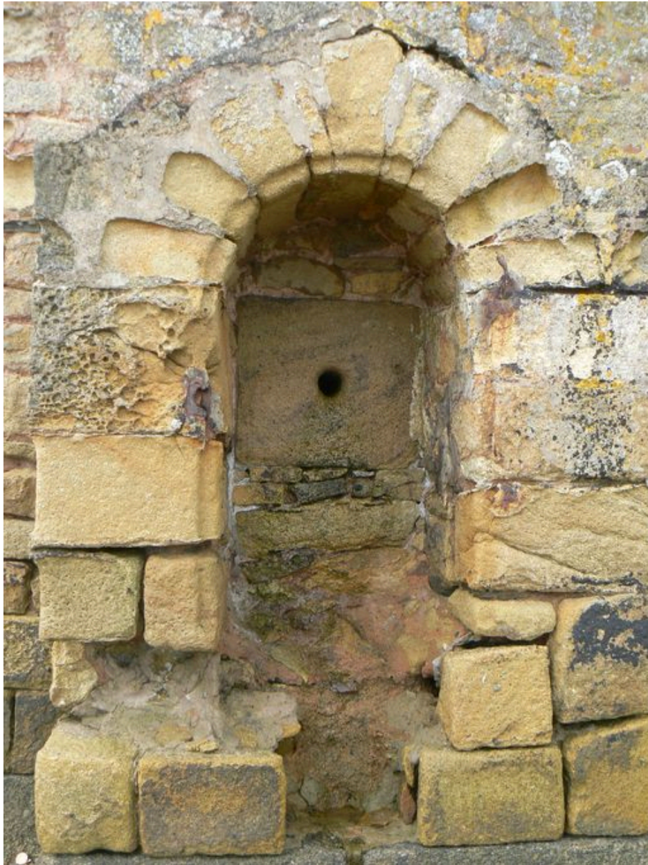
Détail de la fontaine de Quéléren