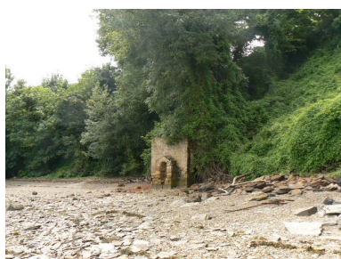
Fontaine de Quéléren sur la grève