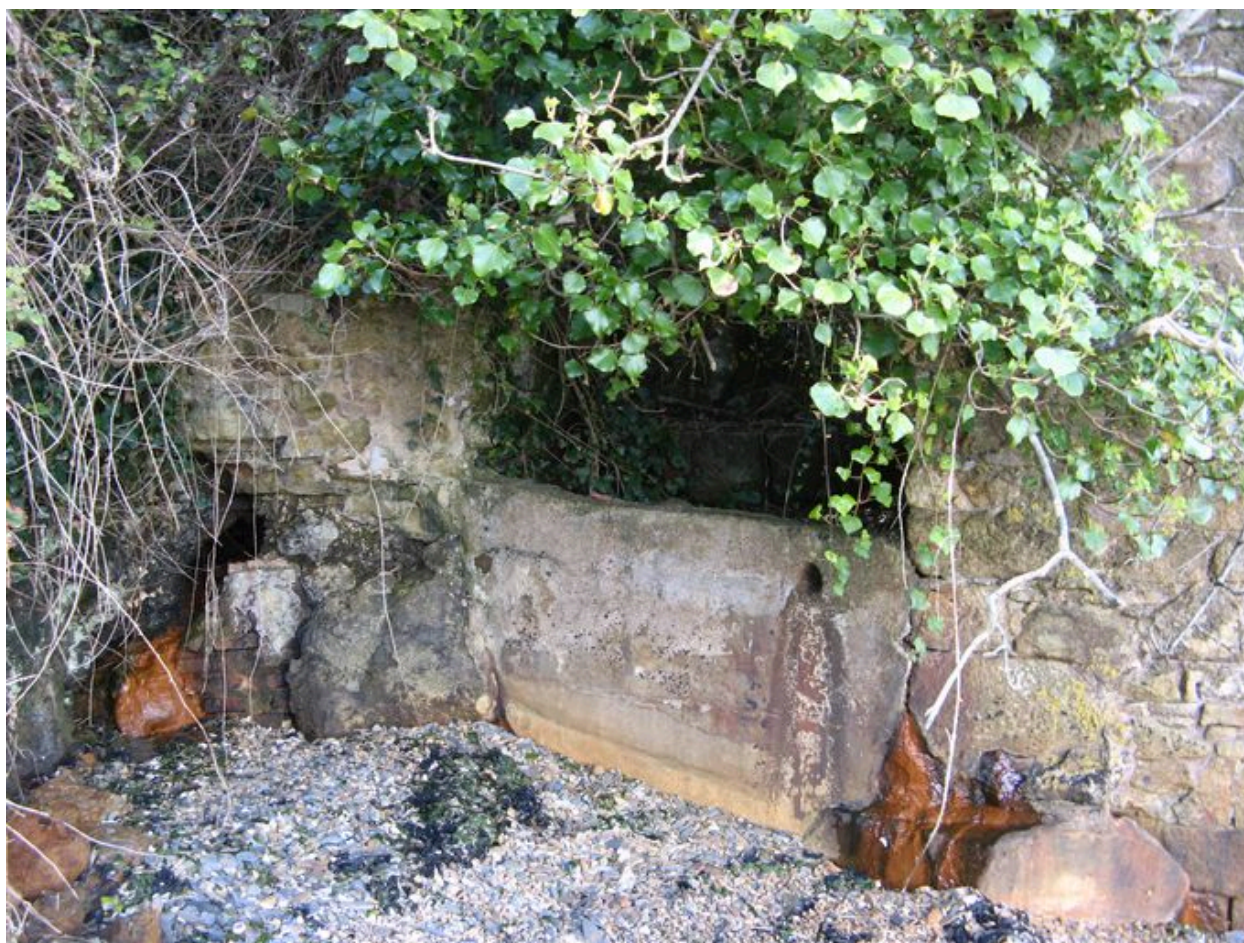
Source actuelle et bassin de la fontaine de Quéléren