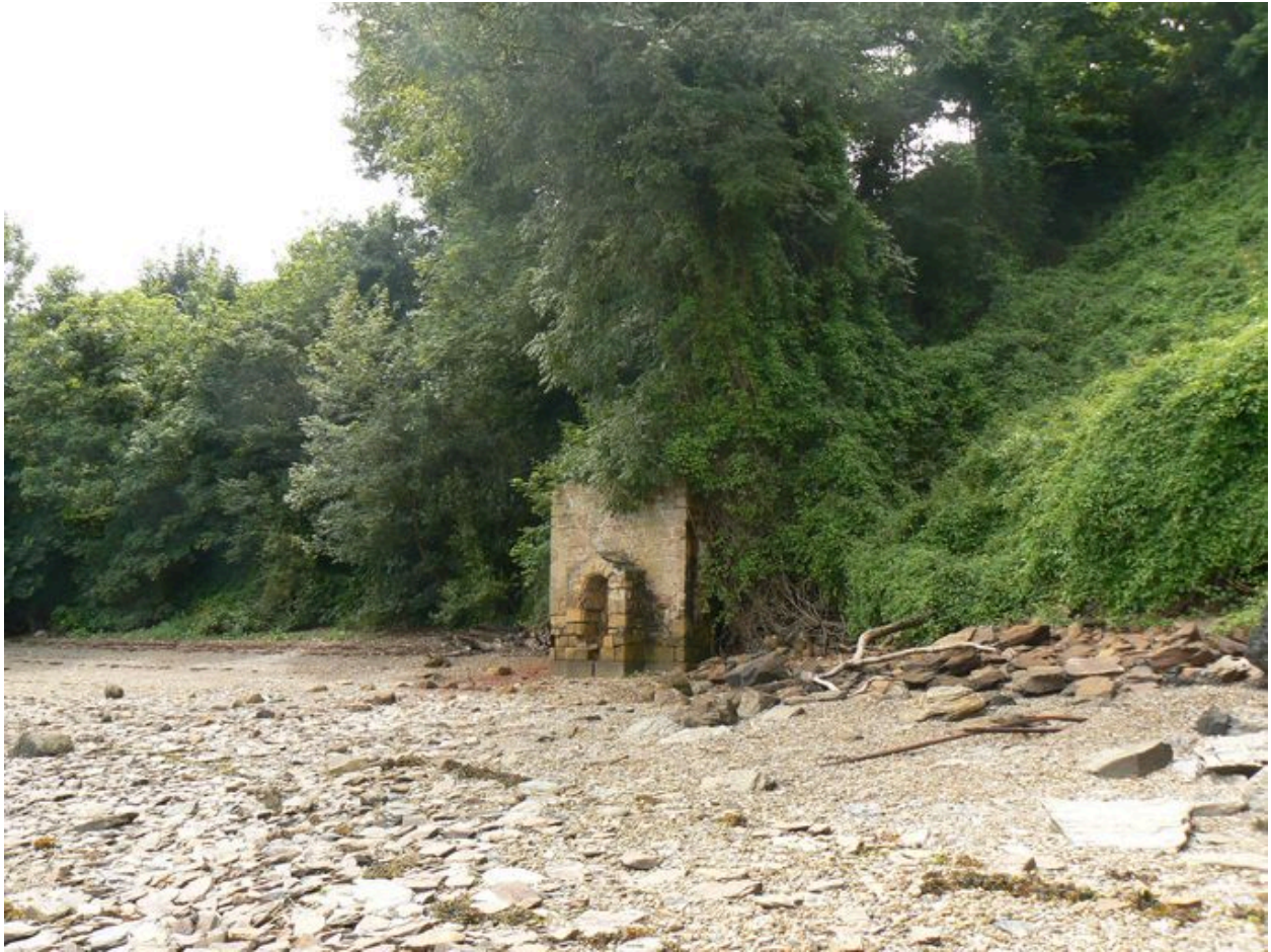
Fontaine de Quéléren sur la grève