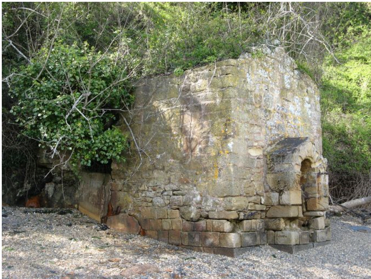
Vue latérale de la fontaine de Quéléren