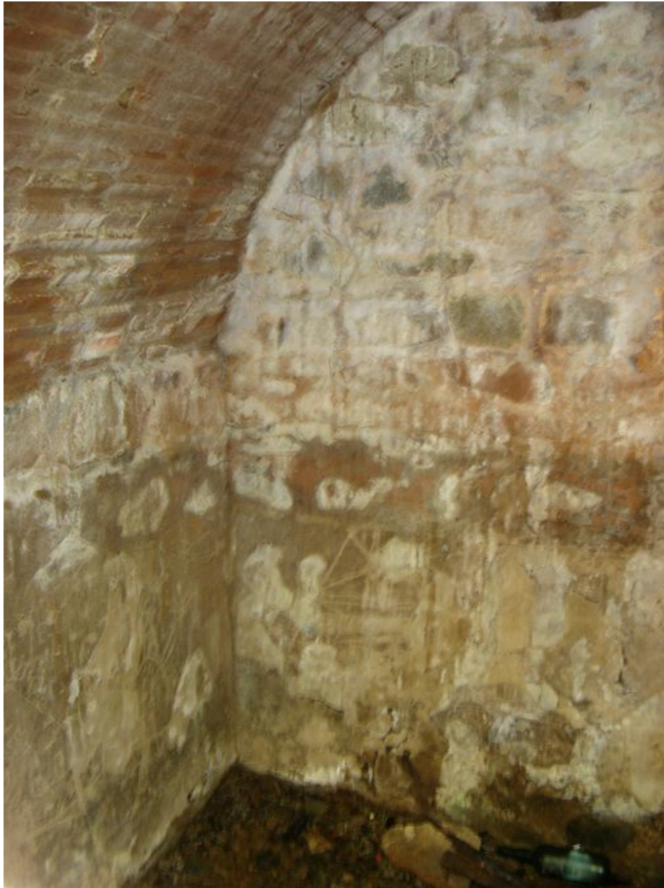
Vue intérieure de la fontaine de Quéléren