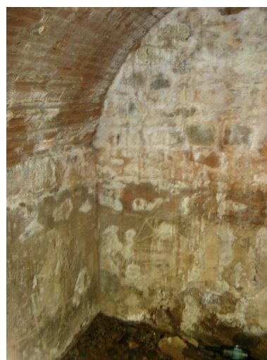
Vue intérieure de la fontaine de Quéléren IVR53_20082908386NUCA