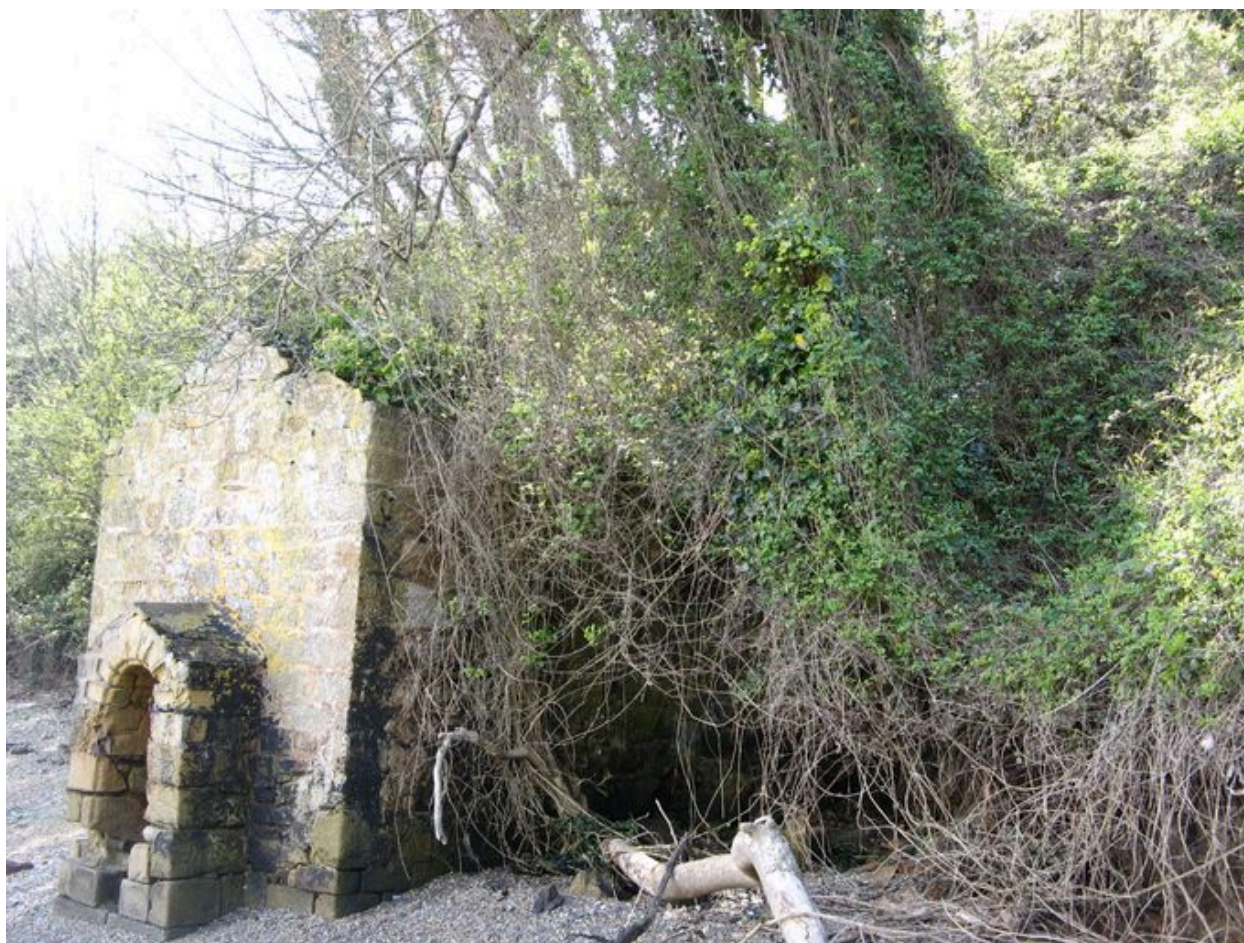
Fontaine de Quéléren menacée par la chute d'un arbre