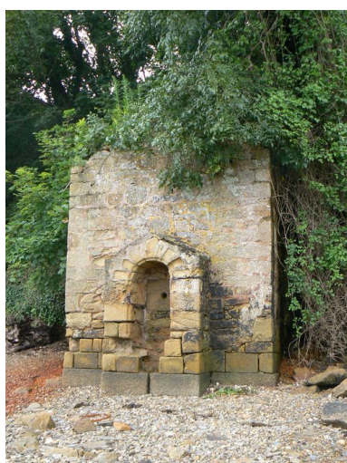
Vue générale de la fontaine de Quéléren IVR53_20072908961NUCA