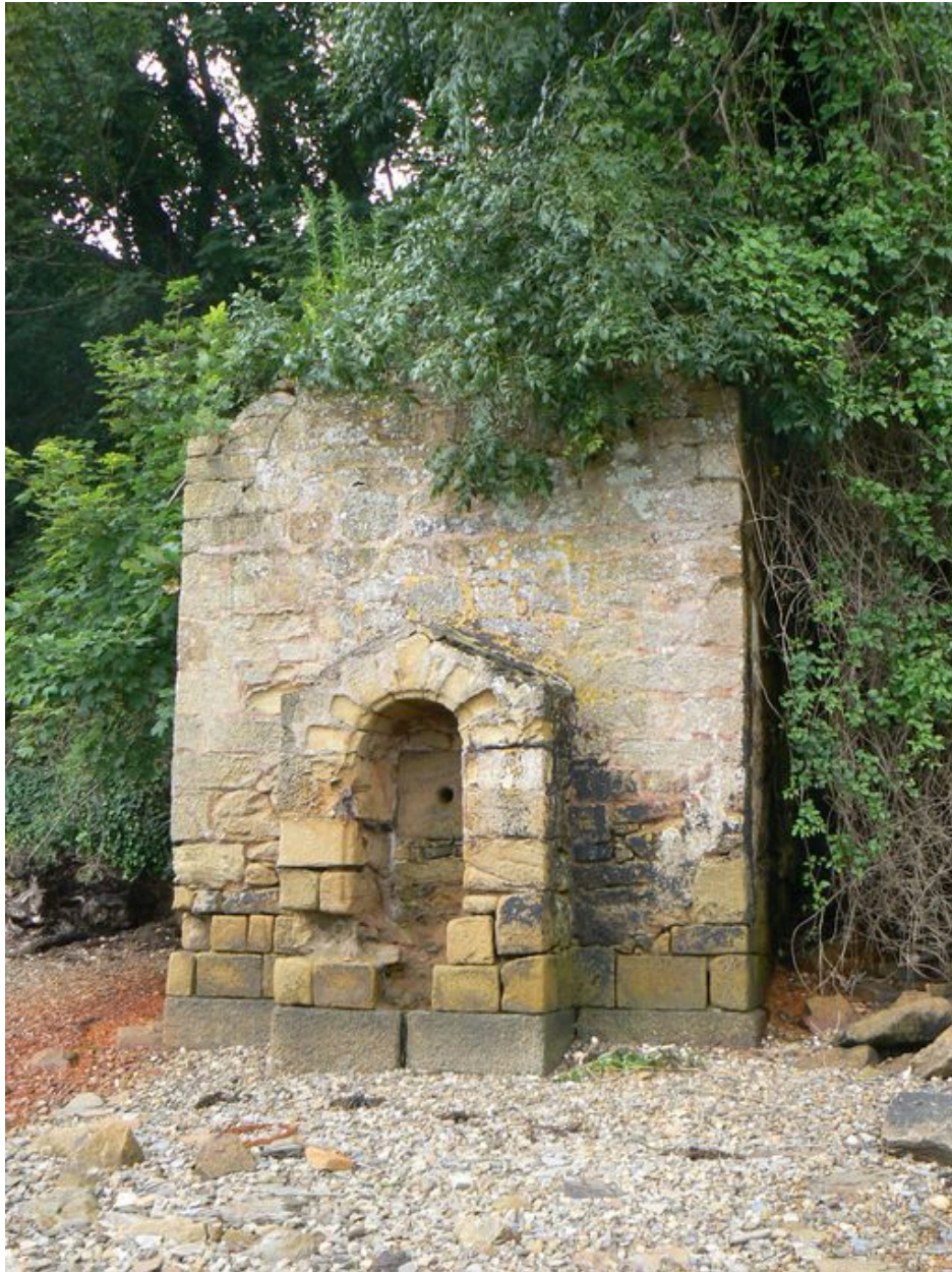
Vue générale de la fontaine de Quéléren