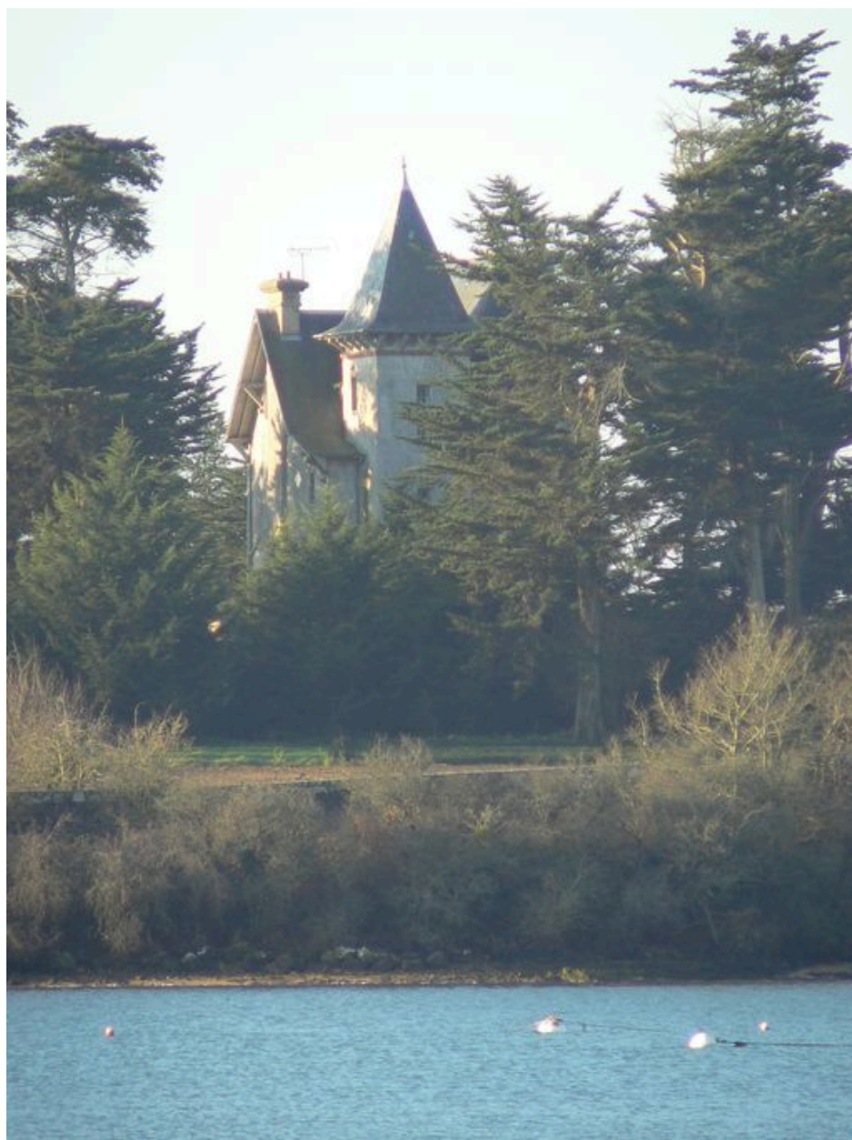
Vue générale du château de l'île de Boëdic