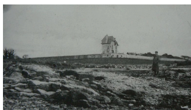
Vue ancienne du château de l'île de Boëdic au début du 20e siècle