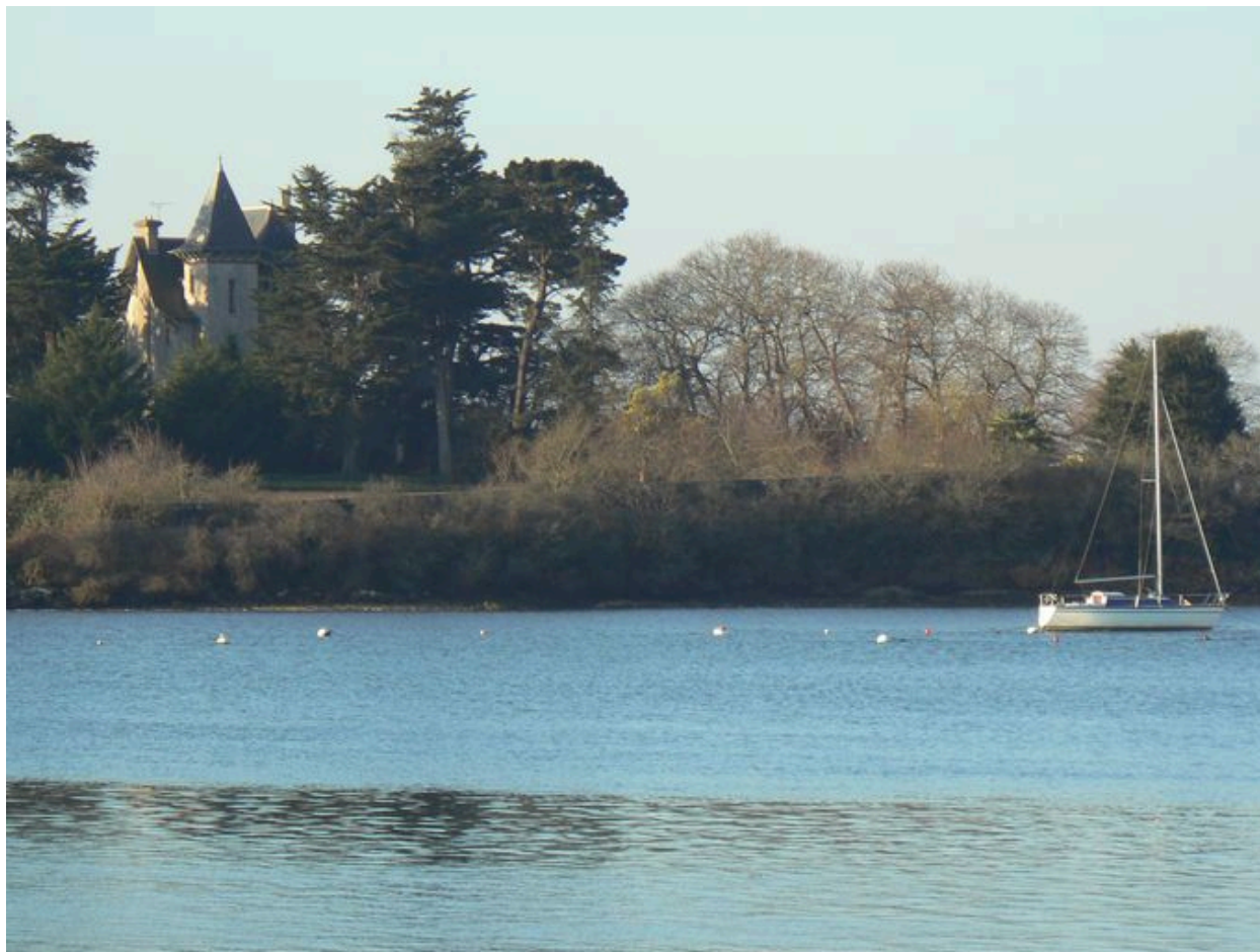
Château de l'île de Boëdic