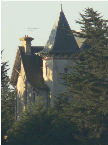
Château de l'île de Boëdic IVR53_20075605758NUCA