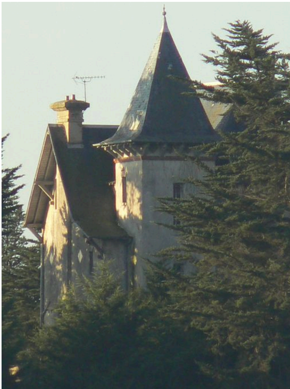
Château de l'île de Boëdic