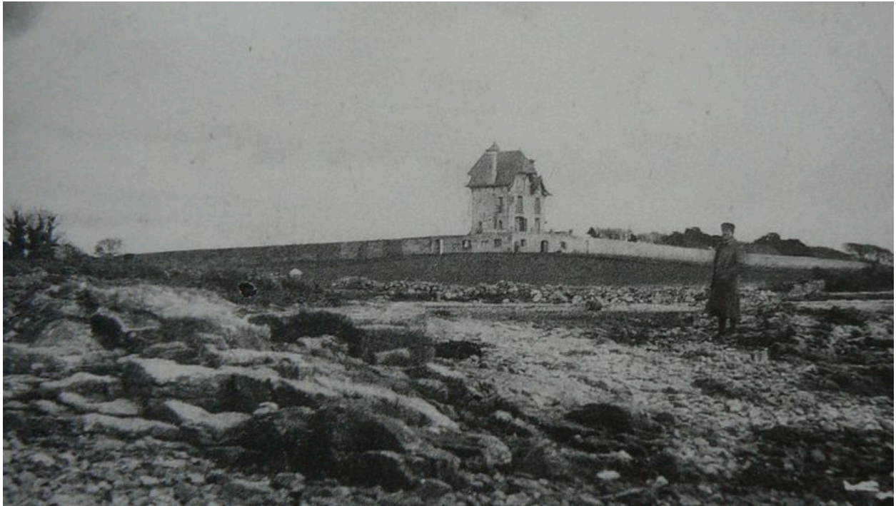
Vue ancienne du château de l'île de Boëdic au début du 20e siècle