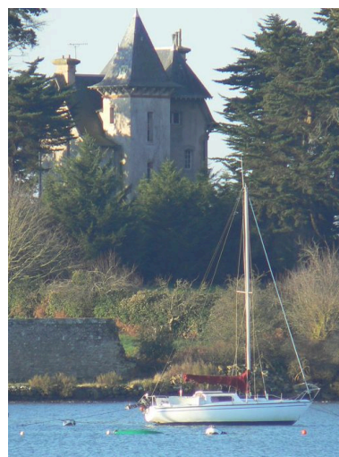
Château de l'île de Boëdic