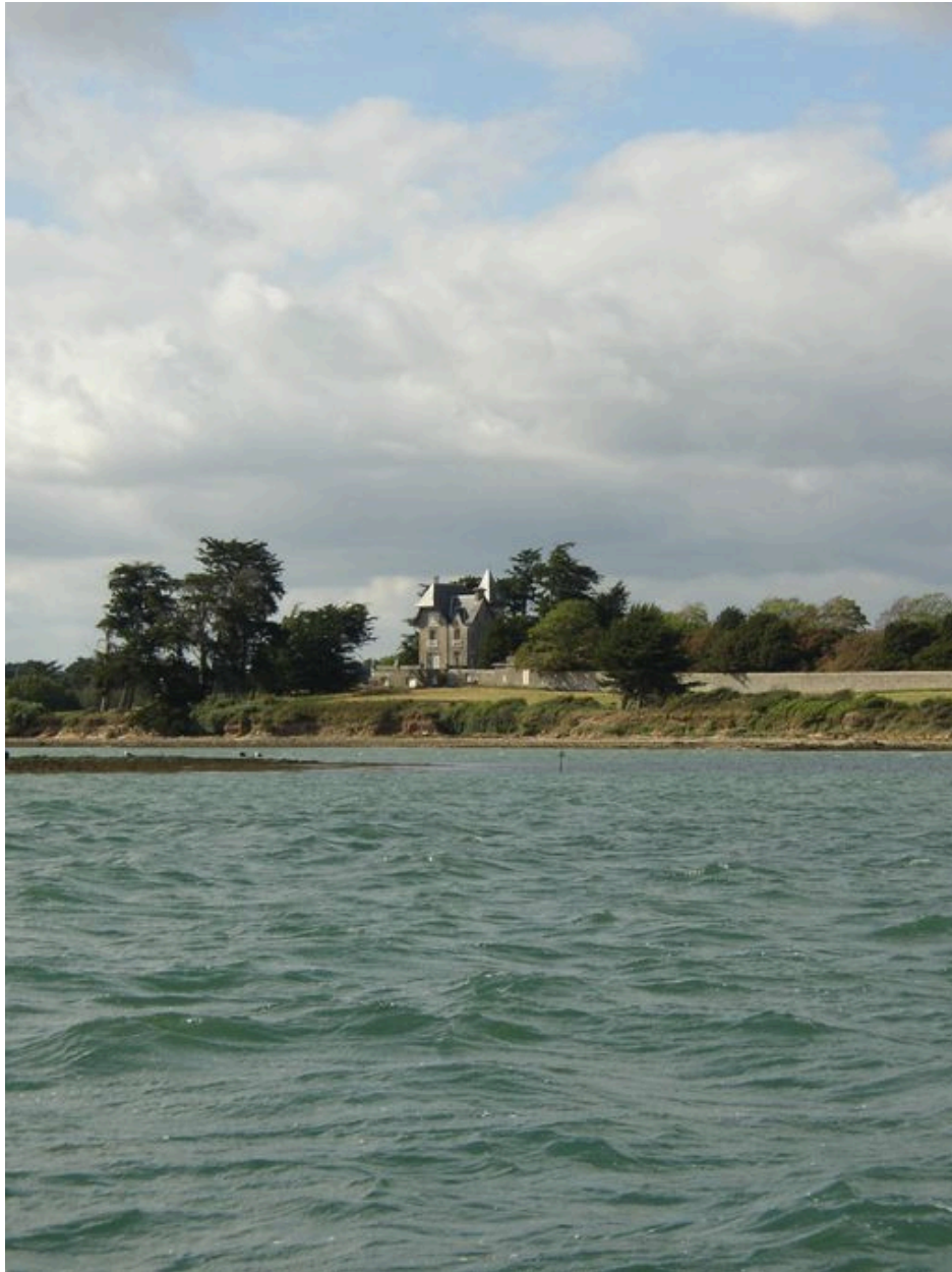
Château de l'île de Boëdic