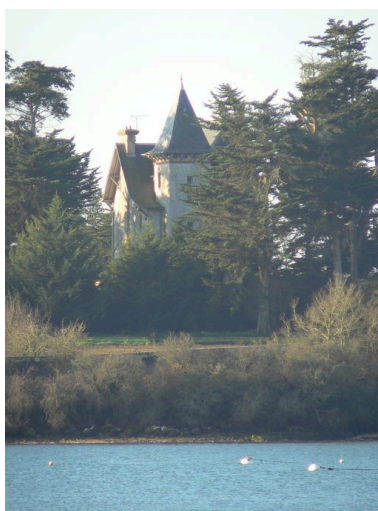
Vue générale du château de l'île de Boëdic