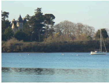
Château de l'île de Boëdic IVR53_20075605754NUCA