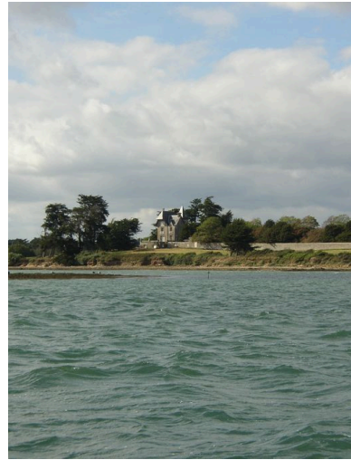
Château de l'île de Boëdic IVR53_20065606597NUCA