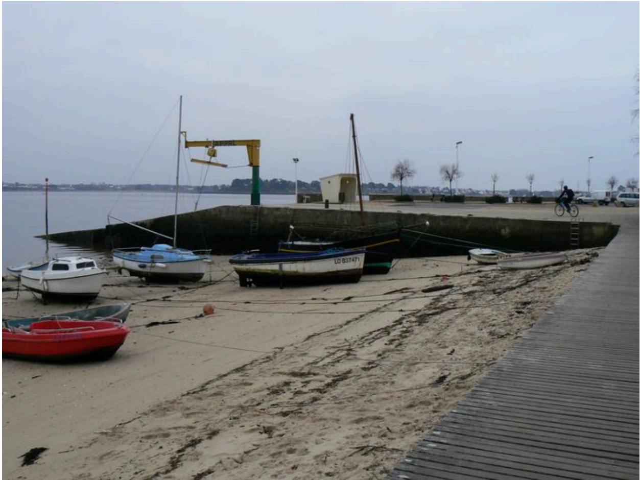
Vue générale de la cale de Kernevel