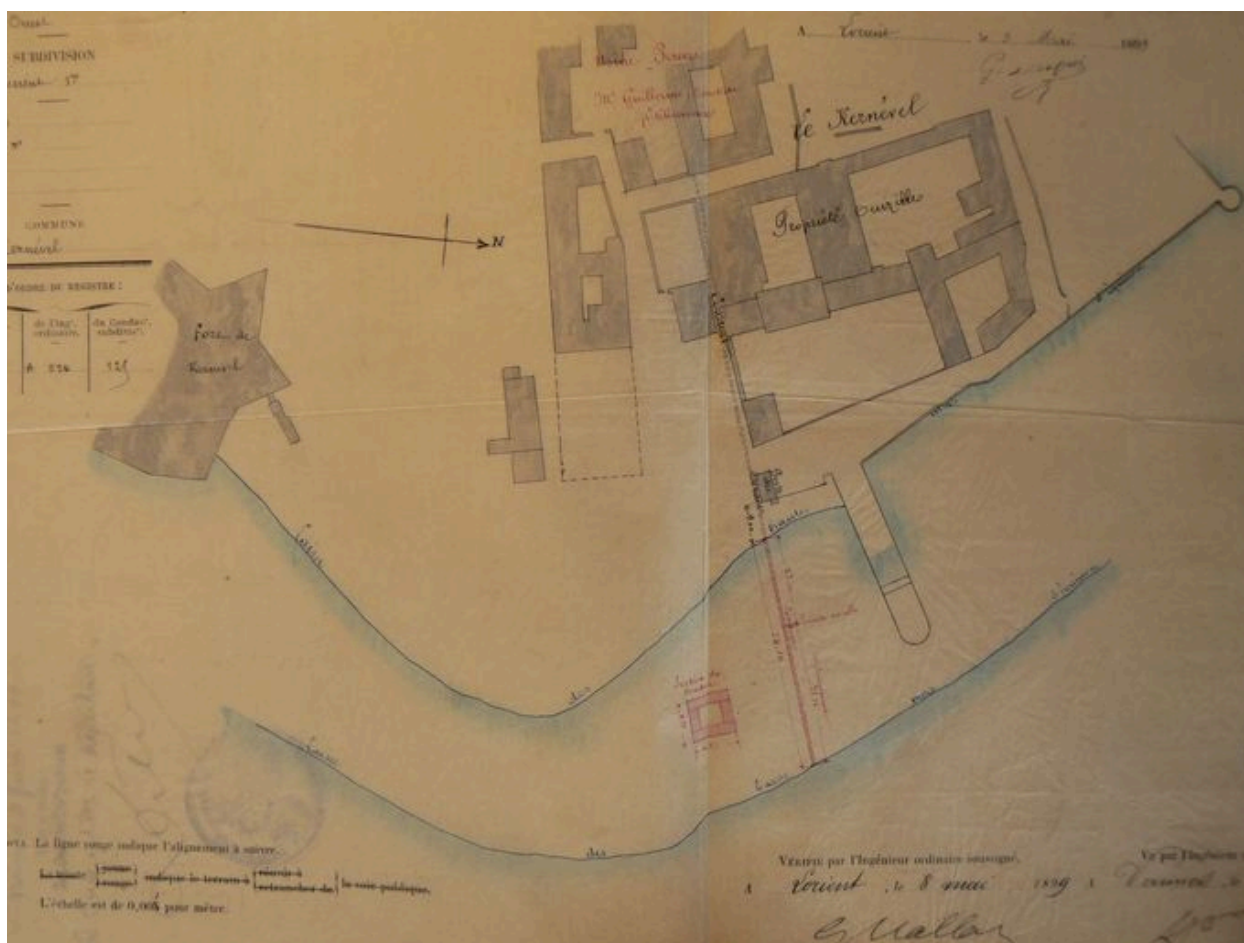
Plan de la cale de Kernevel en 1899