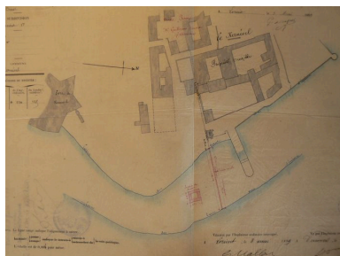
Plan de la cale de Kernevel en 1899