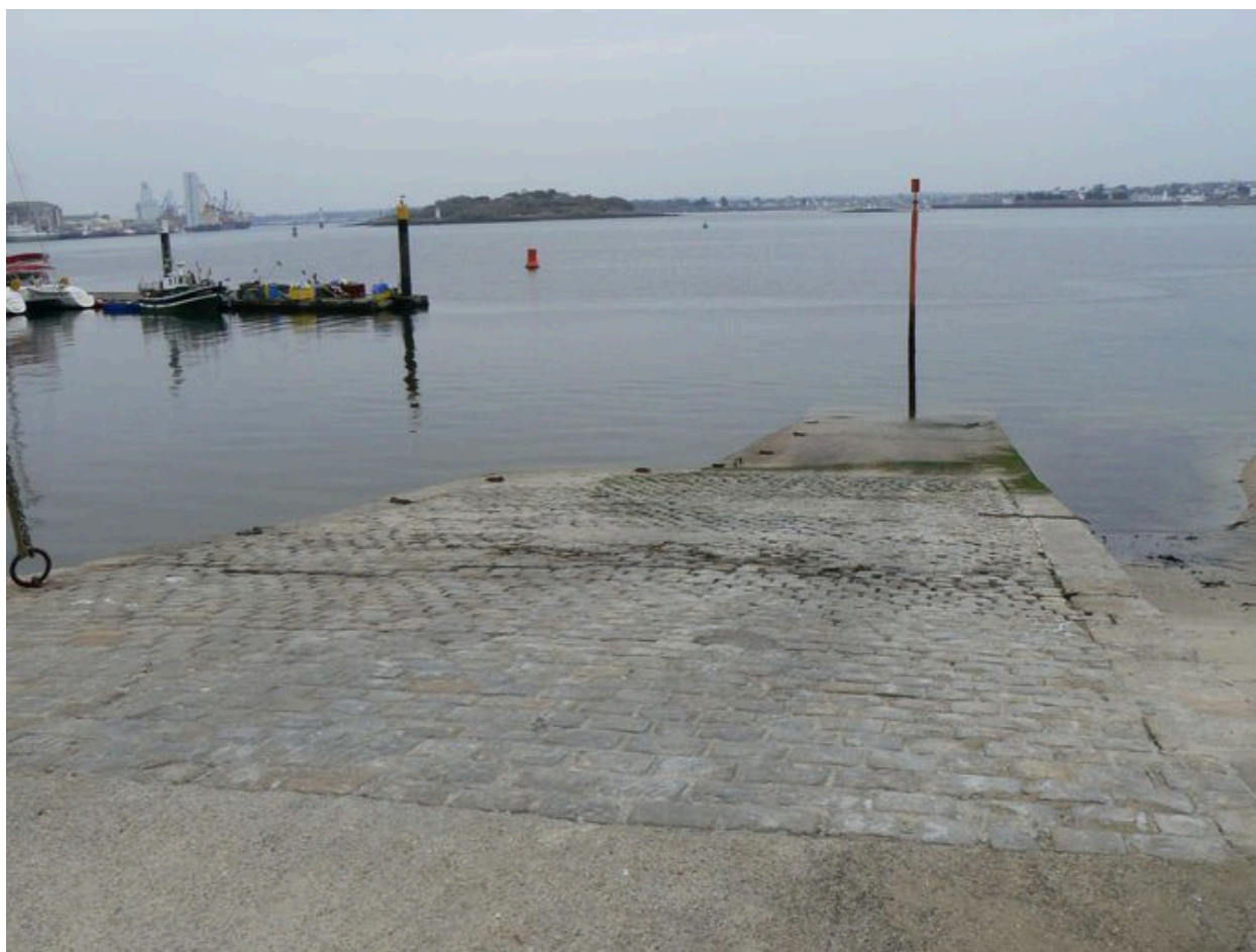
Cale de Kernevel