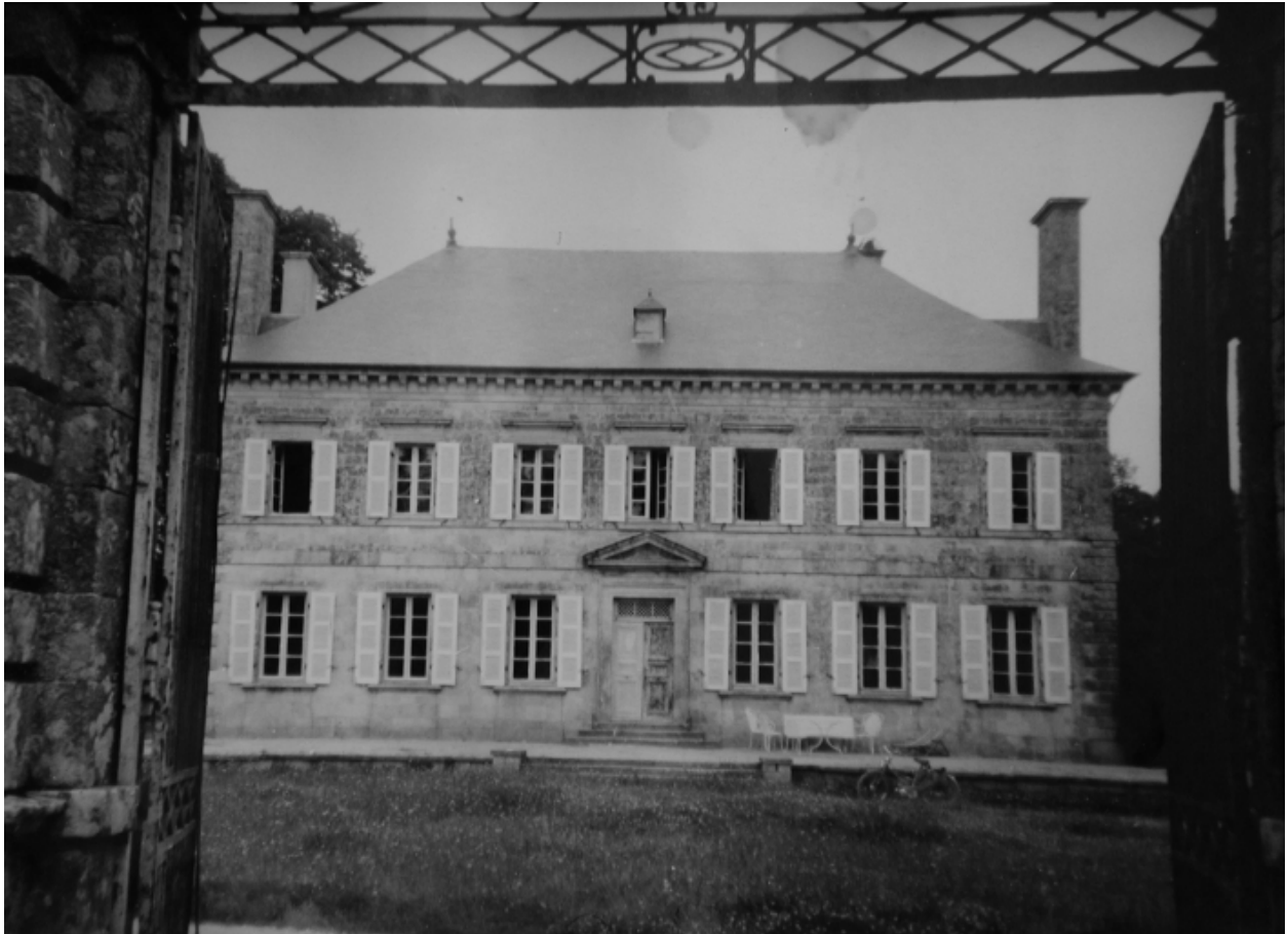
Vue rapprochée du corps de logis