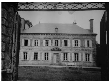
Vue rapprochée du corps de logis