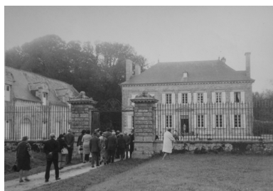
Vue générale depuis le portail d'entrée IVR53_20052904393NUCB