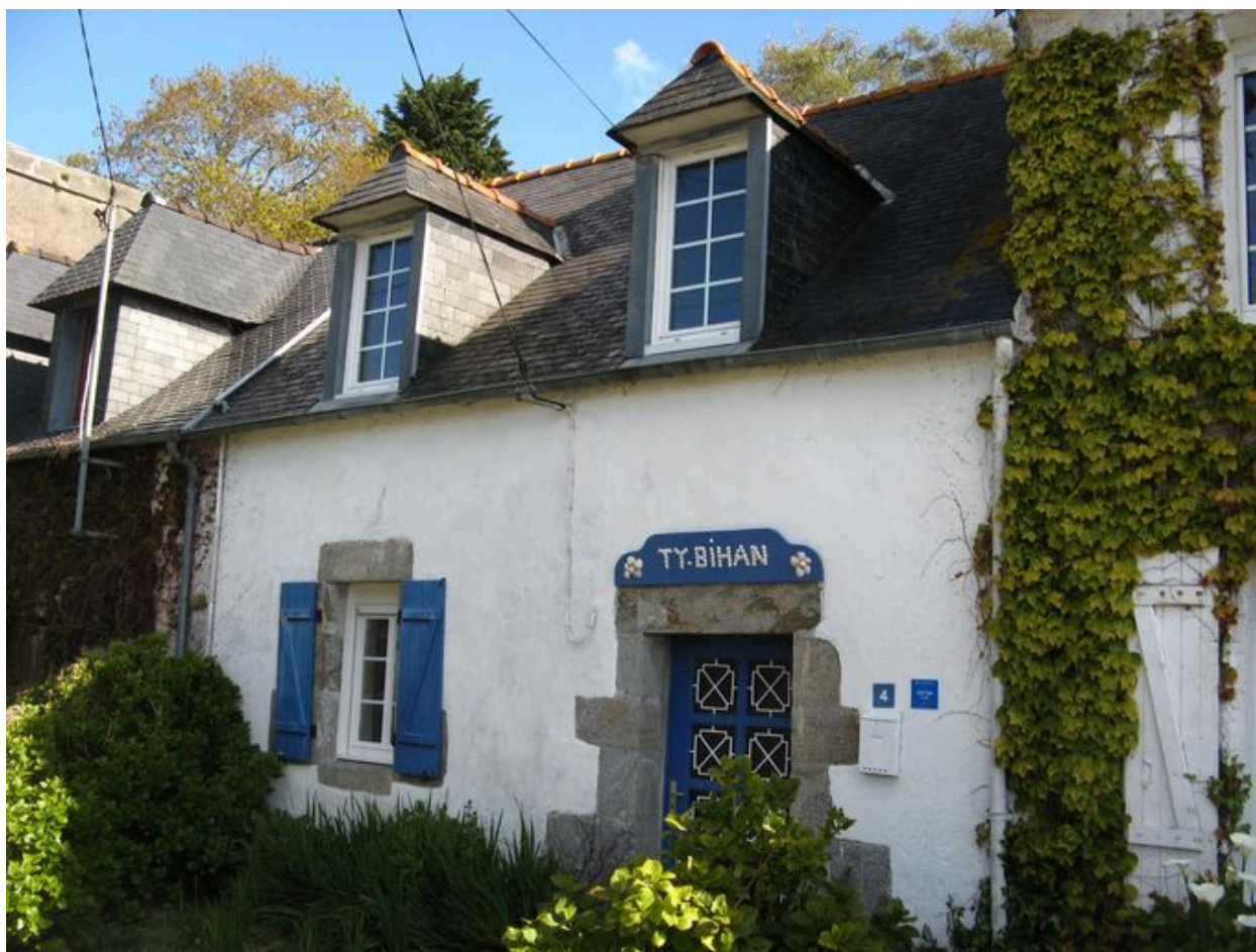
Deuxième maison de l'édifice logistique de la Marine