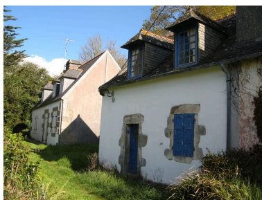
Quatrième et cinquième maisons de l'édifice logistique de la Marine IVR53_20082908395NUCA