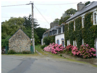
Vue générale de l'édifice logistique de la Marine devenu auberge de jeunesse