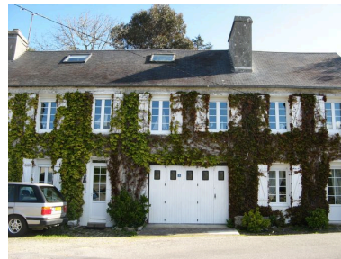
Première maison de l'édifice logistique de la Marine IVR53_20082908393NUCA