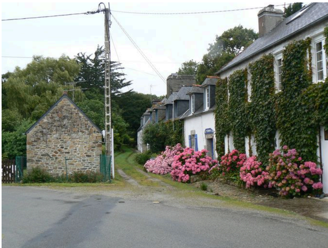
Vue générale de l'édifice logistique de la Marine devenu auberge de jeunesse