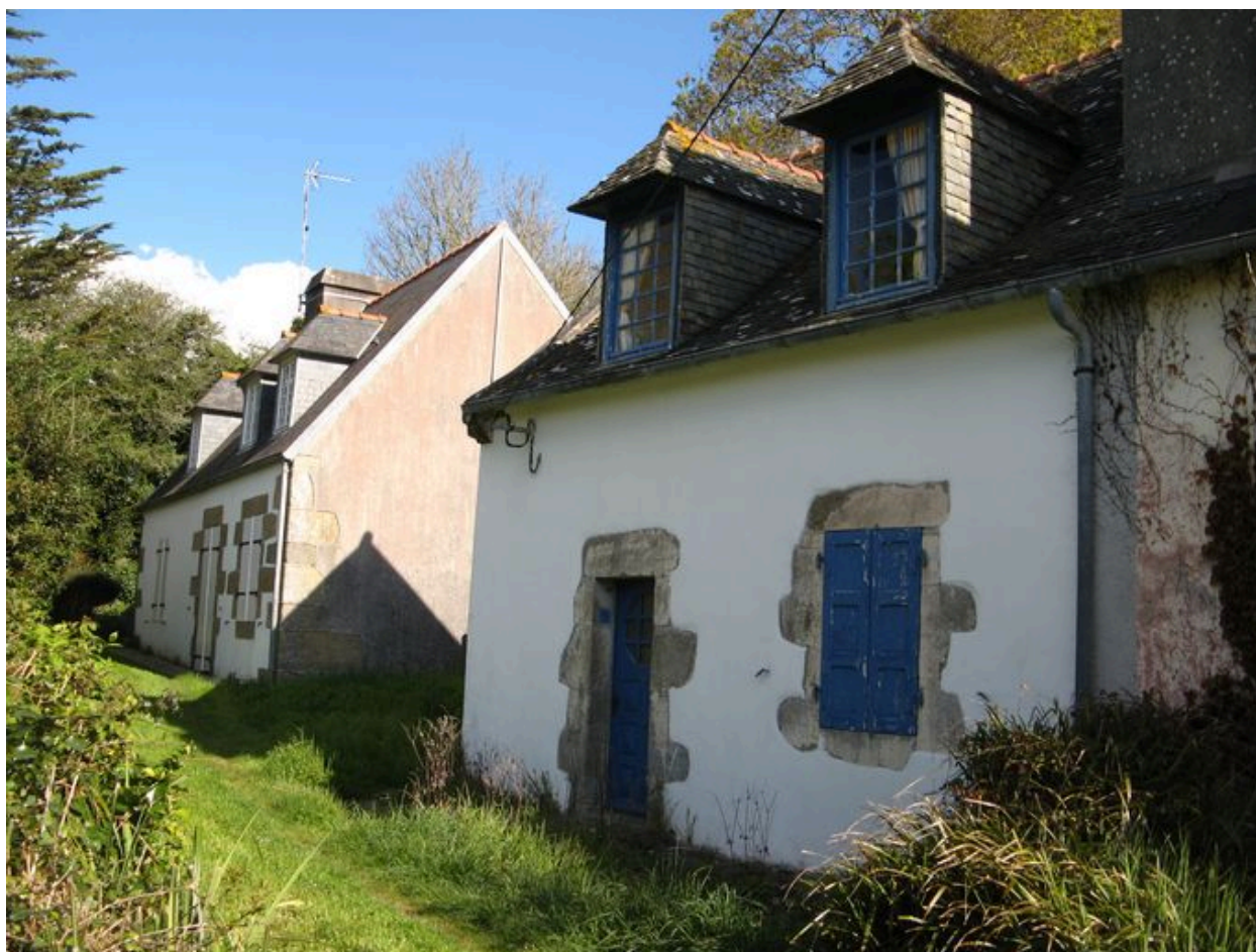
Quatrième et cinquième maisons de l'édifice logistique de la Marine