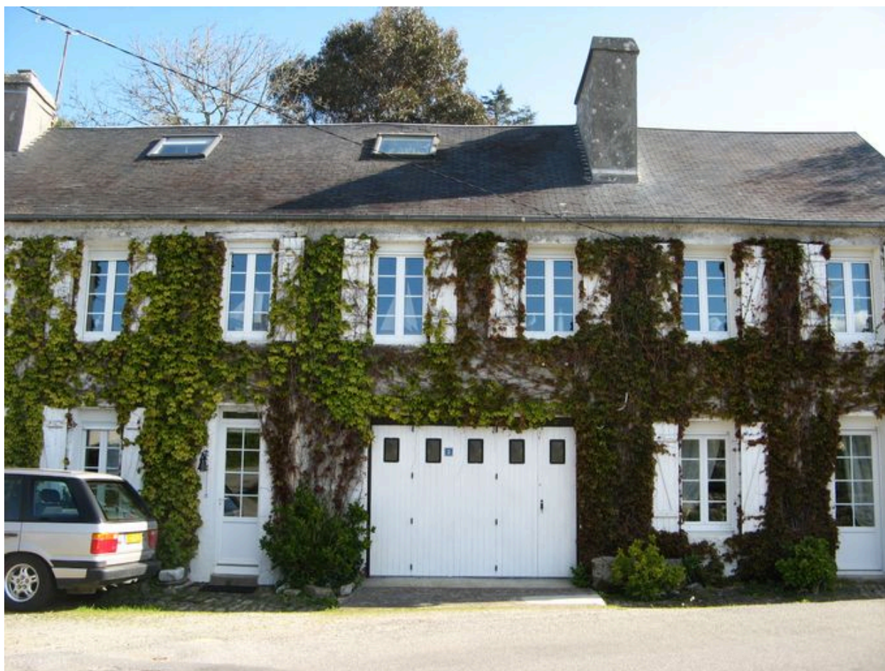
Première maison de l'édifice logistique de la Marine