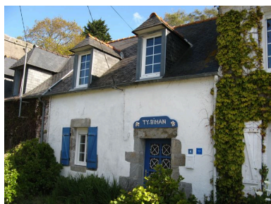
Deuxième maison de l'édifice logistique de la Marine