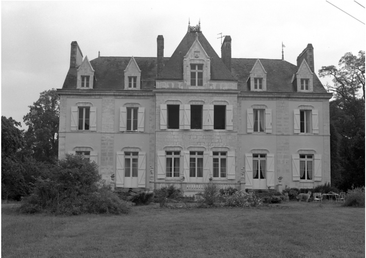
Elévation antérieure : état en 1986