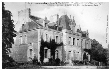
Vue générale IVR53_20045606207NUCB