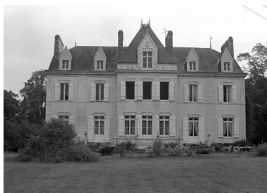
Élévation antérieure : état en 1986