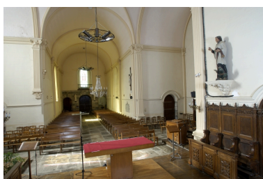
Vue intérieure prise du chœur vers la nef IVR53_20063500344NUCA