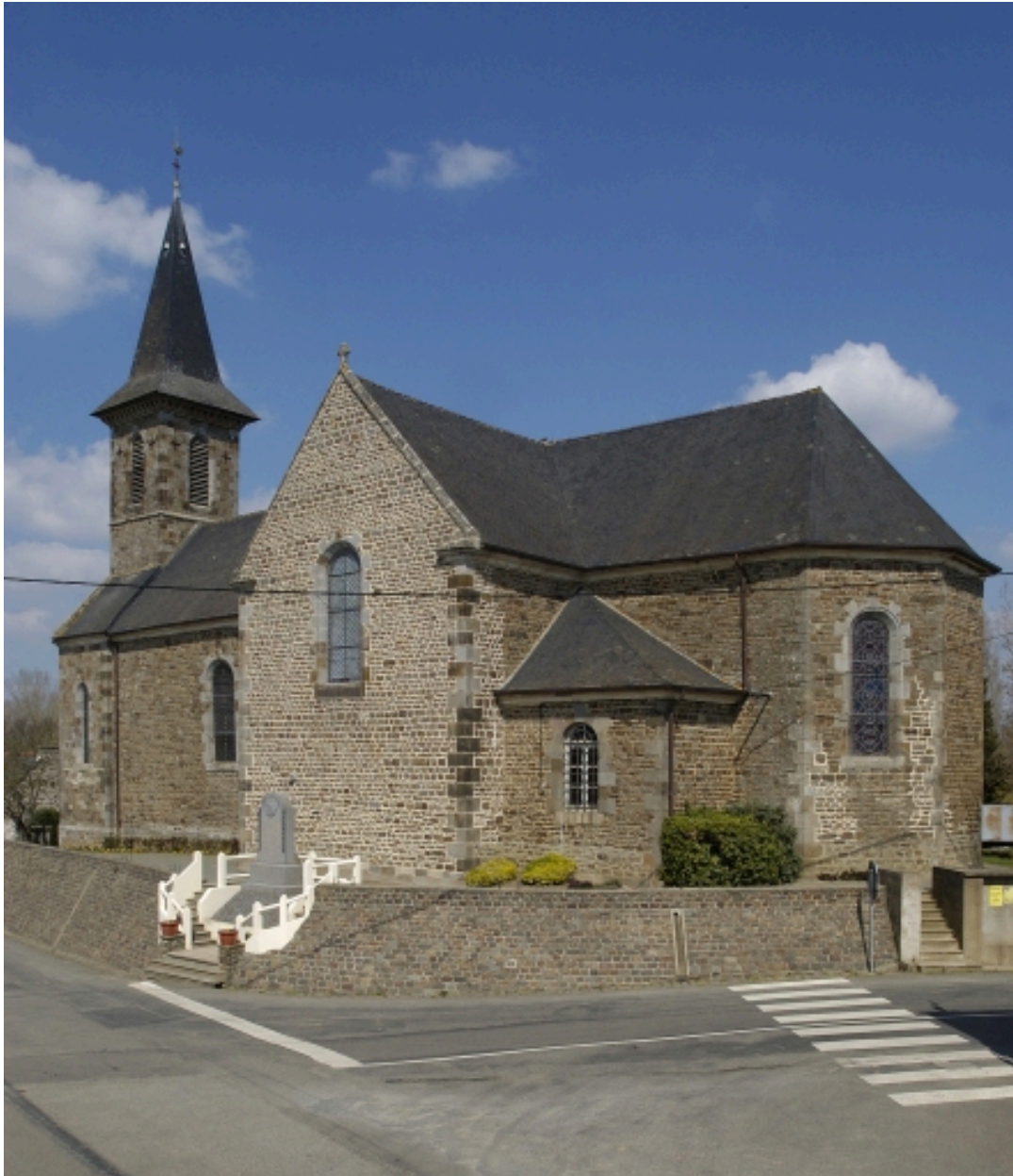
Vue générale sud-ouest