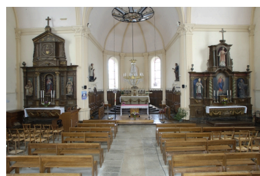
Vue intérieure, chœur et retables latéraux IVR53_20063500960NUCA