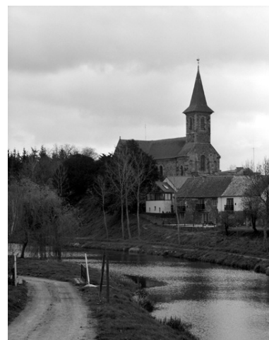
Elévation Nord : vue générale IVR53_19943500733X