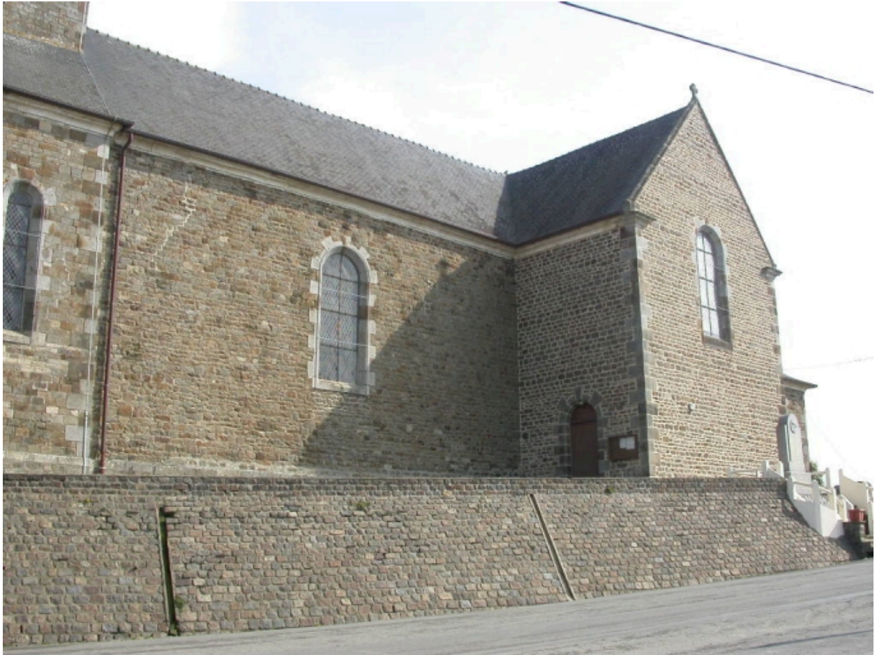
Façade sud de l'église