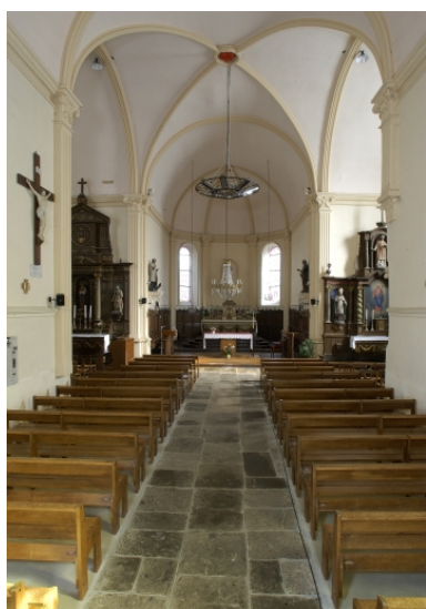
vue intérieure prise de la nef vers le chœur