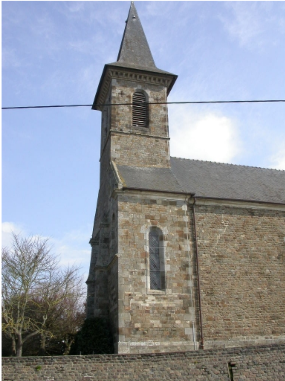
Partie ouest de l'édifice