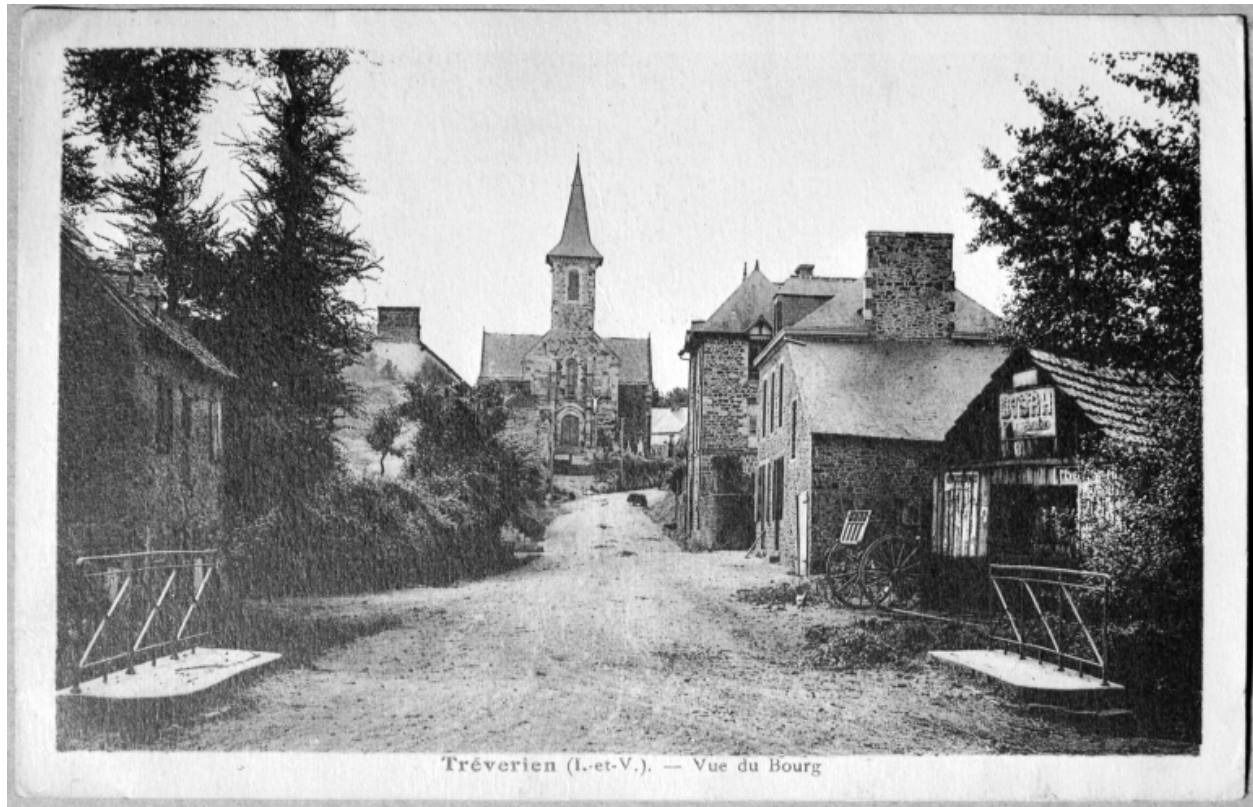
Elévation Ouest : vue générale (Carte postale ancienne, AD35 : 6Fi)