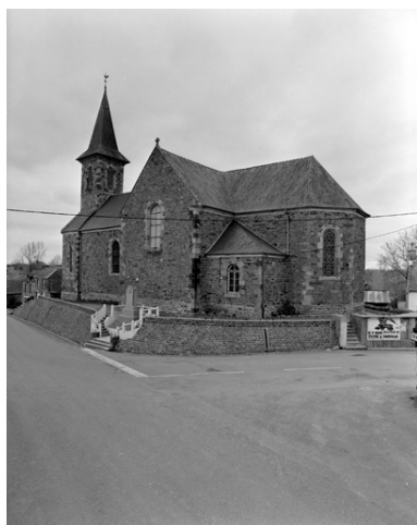
Elévation Sud : vue générale IVR53_19943500790X