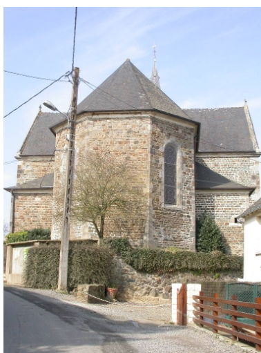
Vue est IVR53_20063505904NUCA