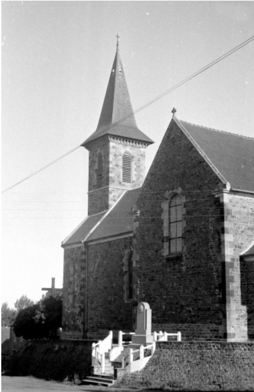
Vue sud-est de l'église en 1970