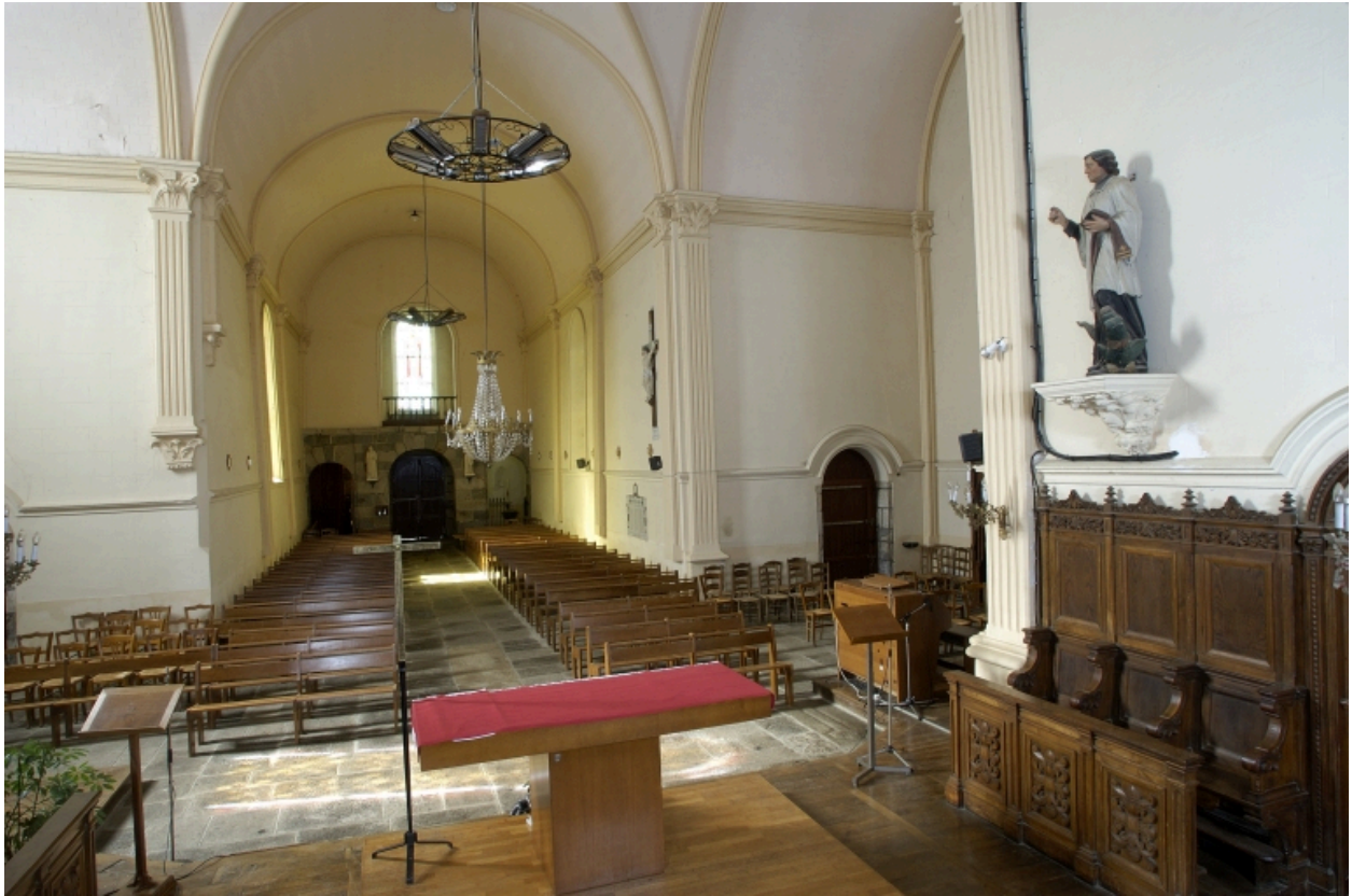
Vue intérieure prise du chœur vers la nef