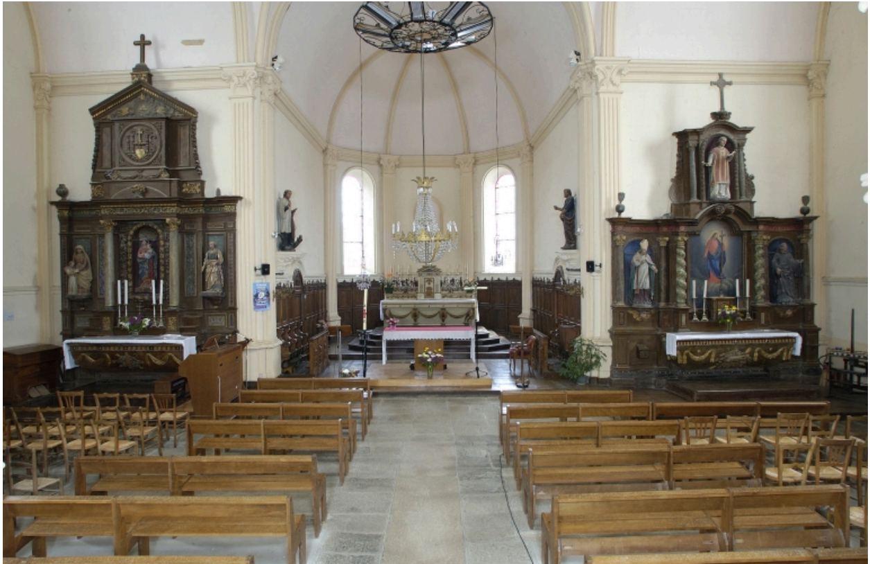
Vue intérieure, chœur et retables latéraux