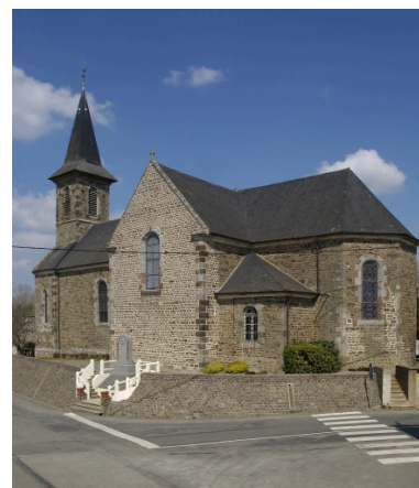
Vue générale sud-ouest IVR53_20063500520NUCA