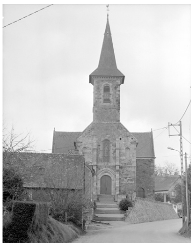
Elévation Ouest : vue générale IVR53_19943500734X