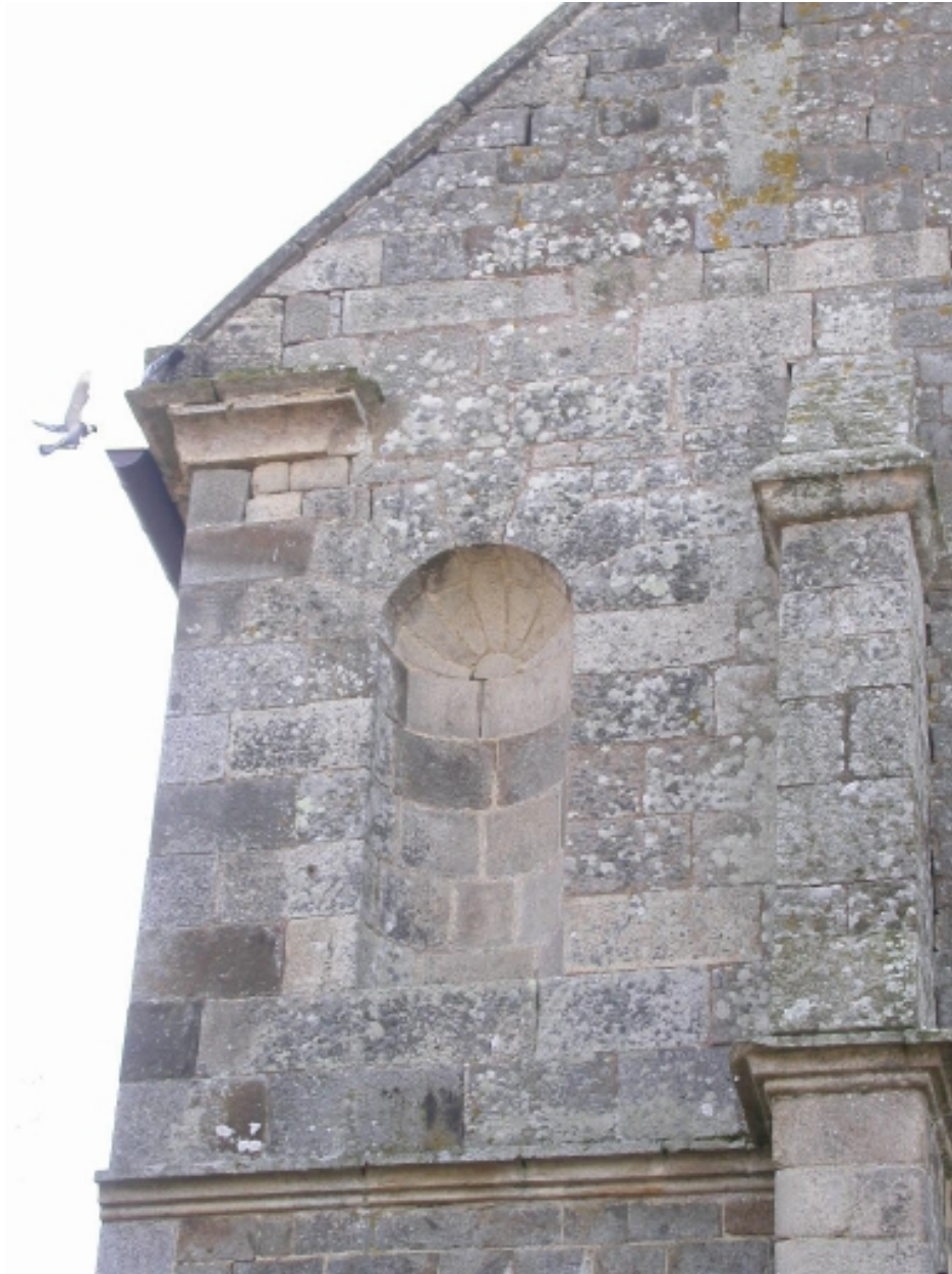
Niche de la façade ouest