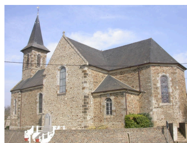
Vue sud-est IVR53_20063505905NUCA