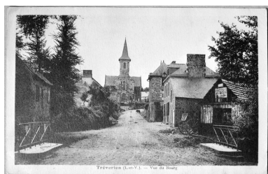
Elévation Ouest : vue générale (Carte postale ancienne, AD35 : 6Fi) IVR53_19933500935XB