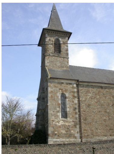
Partie ouest de l'édifice IVR53_20063505901NUCA