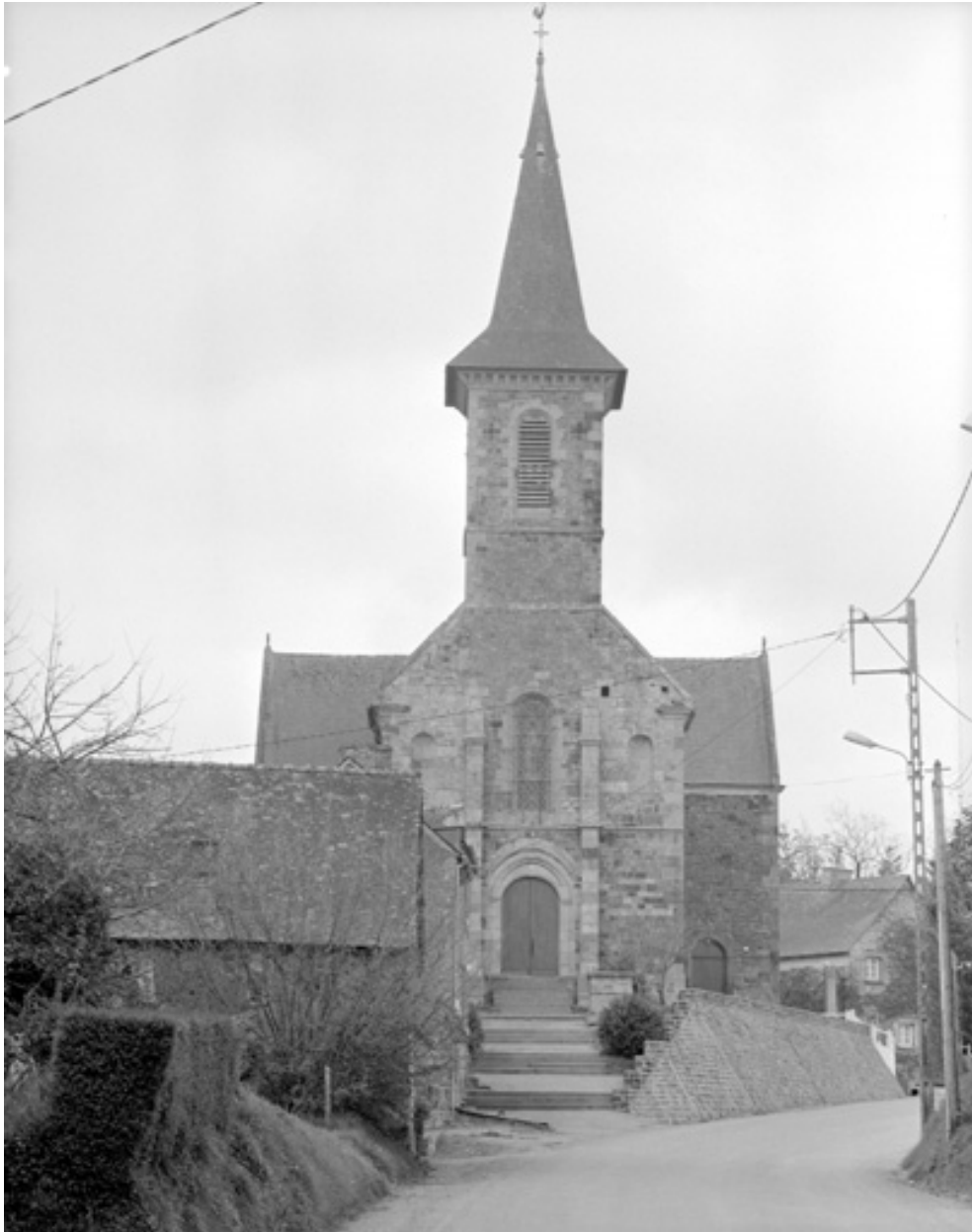
Elévation Ouest : vue générale