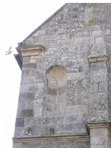
Niche de la façade ouest IVR53_20063505903NUCA