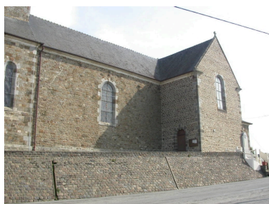
Façade sud de l'église