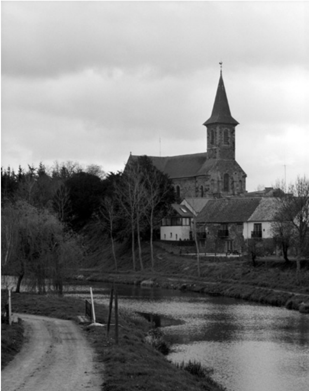
Elévation Nord : vue générale