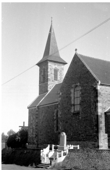
Vue sud-est de l'église en 1970