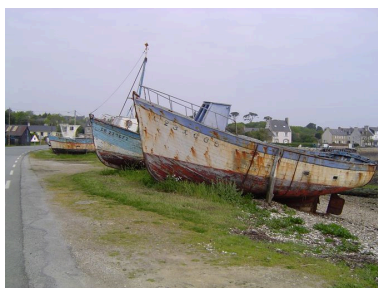
Cimetière de bateaux du Fret IVR53_20062908595NUCA