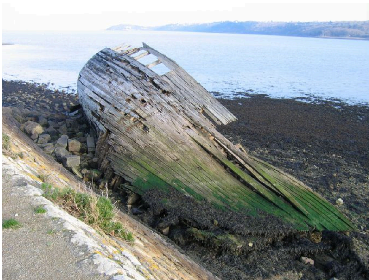
Bateau à l'abandon sur à l'amorce du Sillon