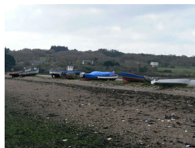
Cimetière de bateaux du Fret IVR53_20072908822NUCA