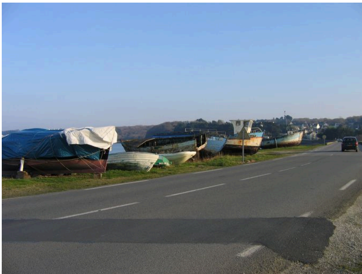
Vue générale du cimetière de bateaux du Fret