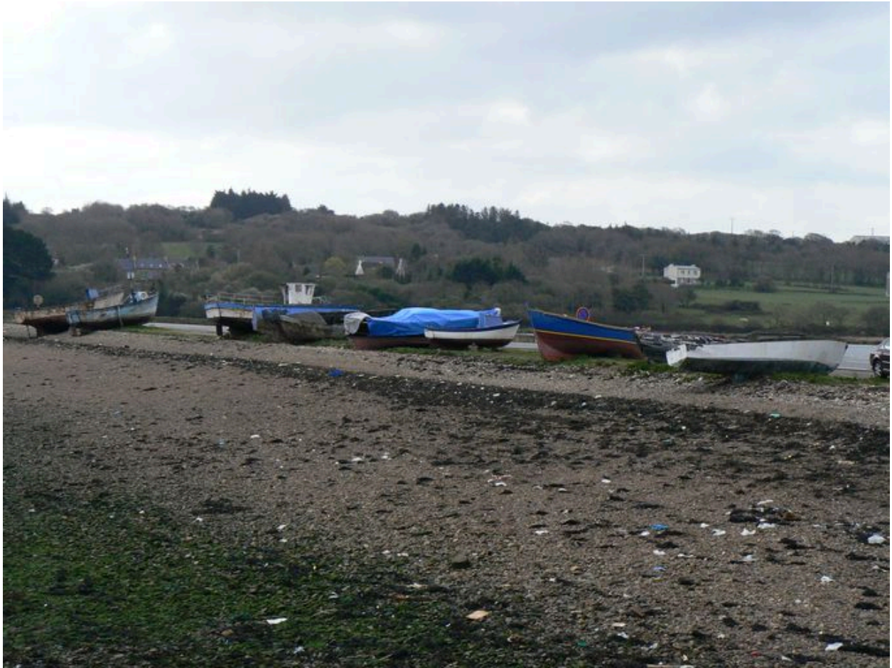
Cimetière de bateaux du Fret