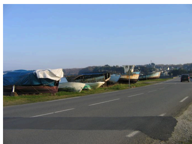
Vue générale du cimetière de bateaux du Fret IVR53_20062908563NUCA