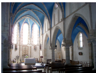
Pleuven, église paroissiale Saint-Mathurin : vue transversale sud-est IVR53_20082905954NUCA