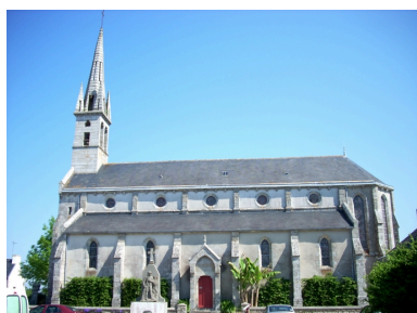
Pleuven, église paroissiale Saint-Mathurin : élévation sud IVR53_20082905953NUCA