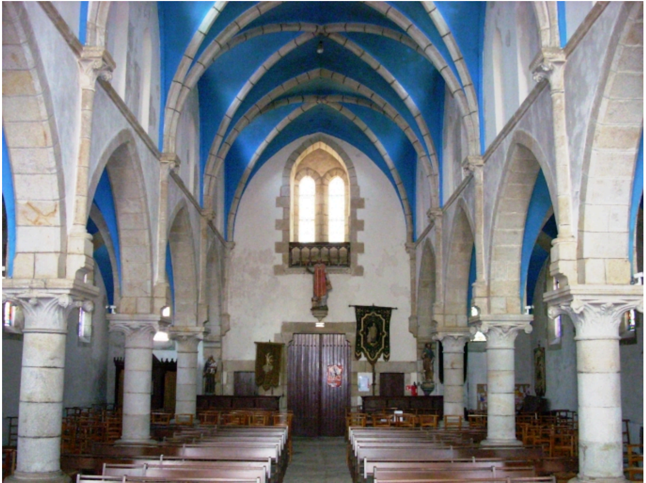
Pleuven, église paroissiale Saint-Mathurin : vue axiale ouest