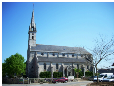
Pleuven, église paroissiale Saint-Mathurin : vue générale sud-ouest IVR53_20082905950NUCA