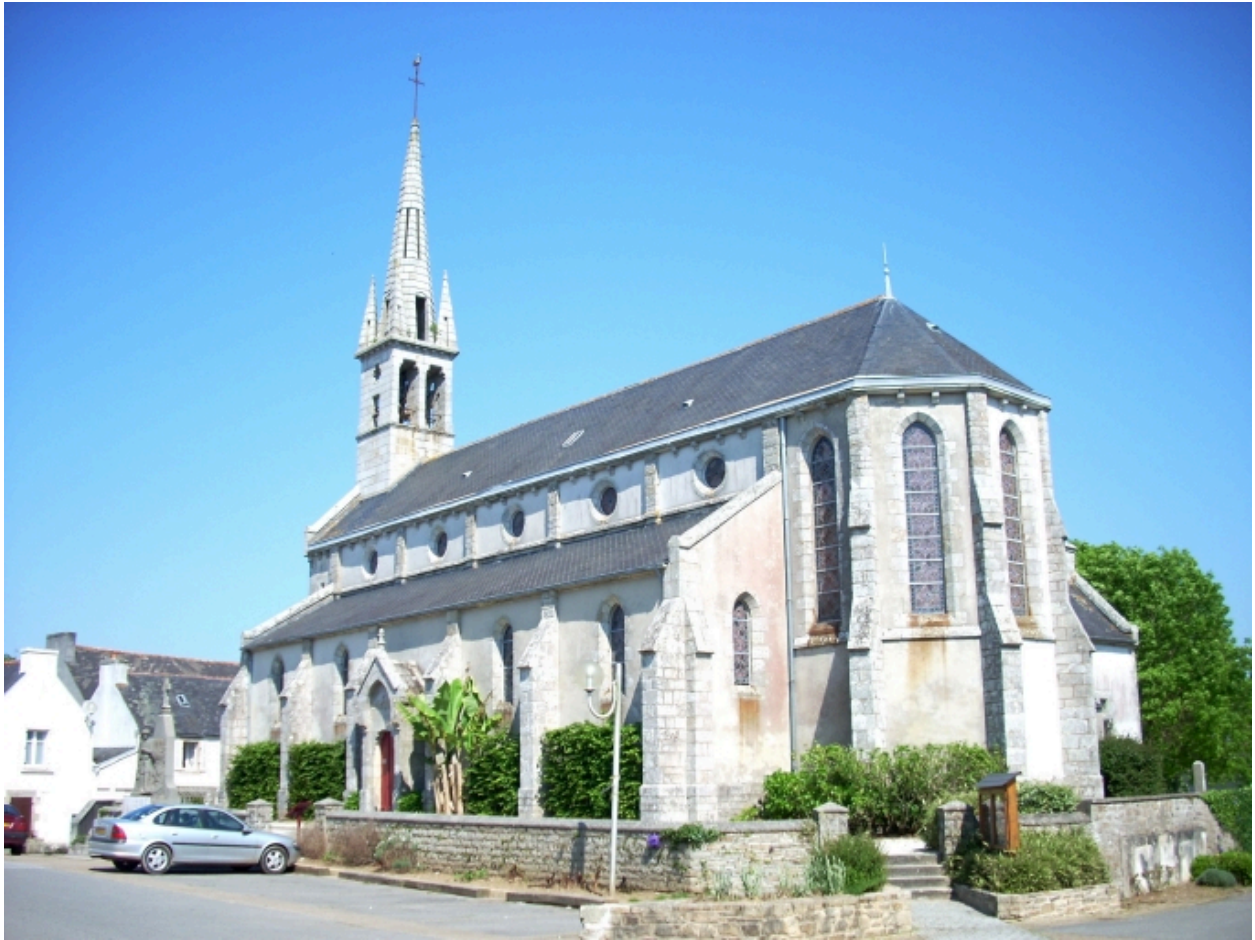
Pleuven, église paroissiale Saint-Mathurin : vue générale sud-est