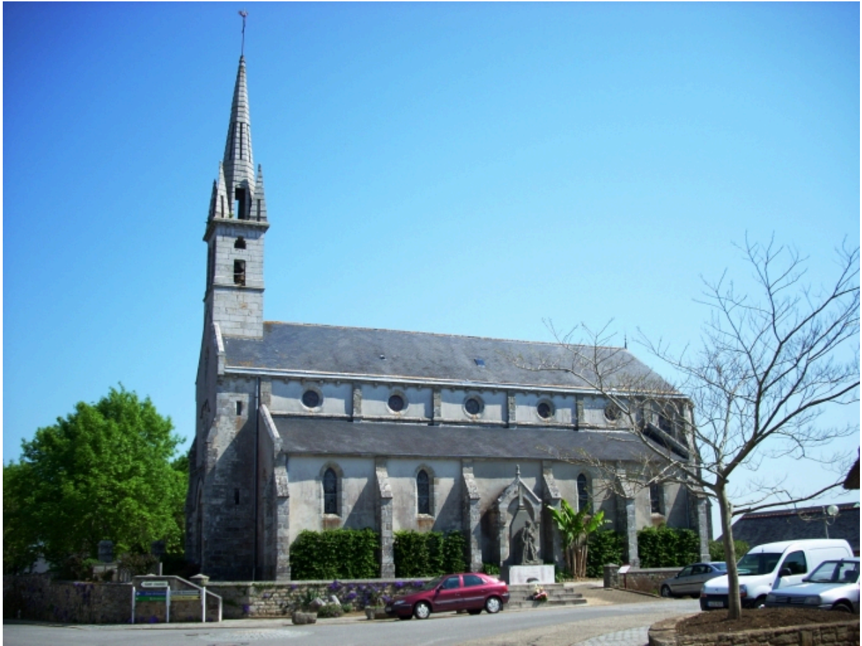
Pleuven, église paroissiale Saint-Mathurin : vue générale sud-ouest