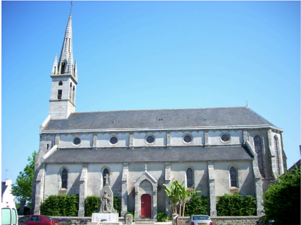
Pleuven, église paroissiale Saint-Mathurin : élévation sud