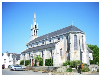
Pleuven, église paroissiale Saint-Mathurin : vue générale sud-est IVR53_20082905952NUCA