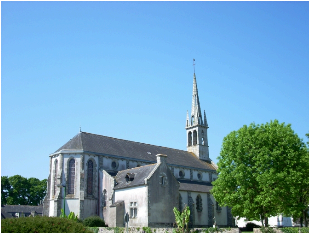
Pleuven, église paroissiale Saint-Mathurin : vue générale nord-est