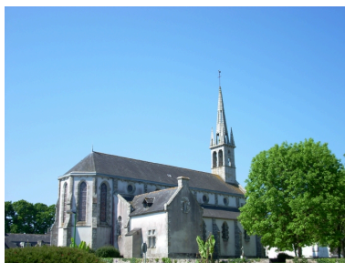
Pleuven, église paroissiale Saint-Mathurin : vue générale nord-est IVR53_20082905951NUCA