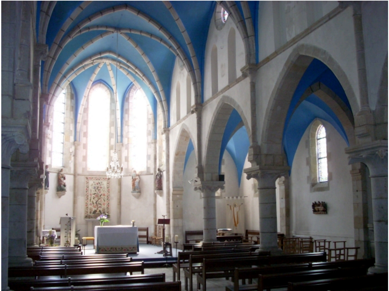
Pleuven, église paroissiale Saint-Mathurin : vue transversale sud-est