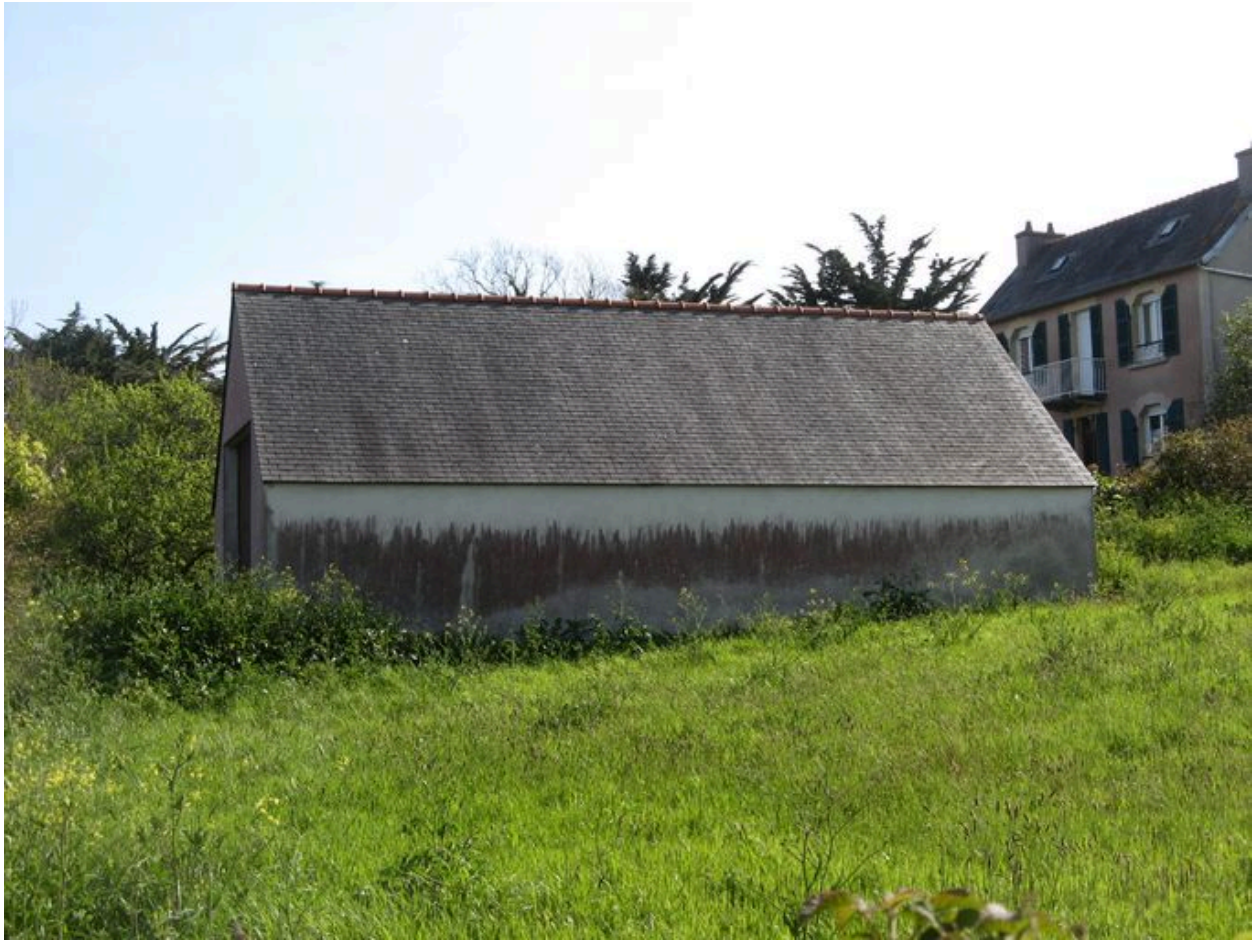
Vue latérale du chantier Laë