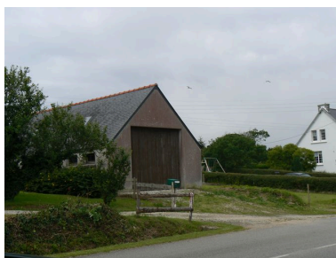
Vue générale de l'atelier de chantier naval auguste Laë IVR53_20072908969NUCA