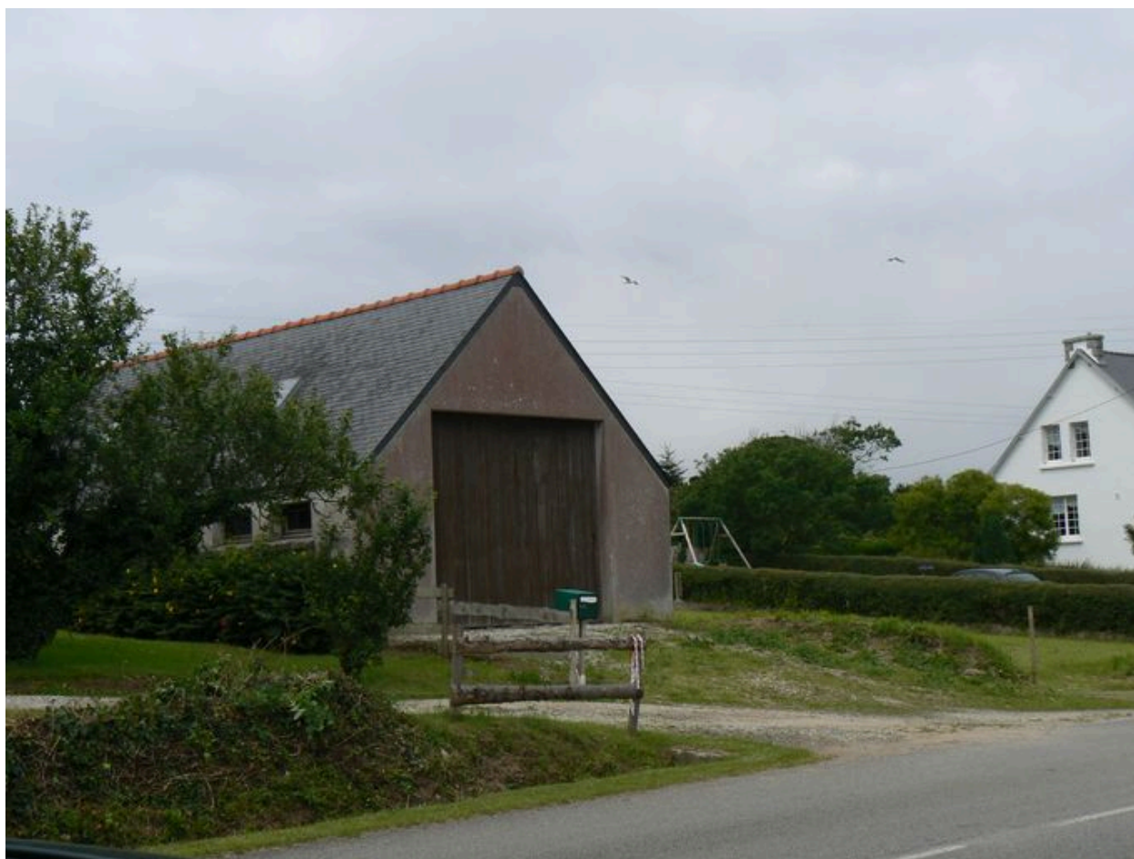
Vue générale de l'atelier de chantier naval auguste Laë