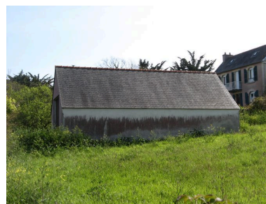
Vue latérale du chantier Laë IVR53_20082908478NUCA