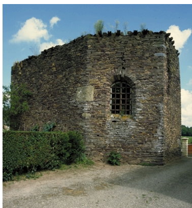
Vue générale sud-est IVR53_19993501228XA