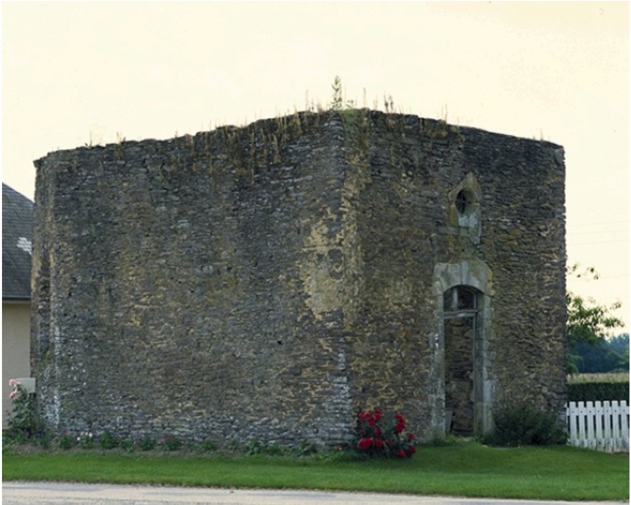
Vue générale nord-ouest