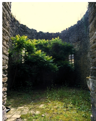
Le choeur : vue intérieure ouest, IVR53_19993501229XA