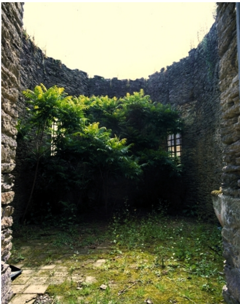
Le choeur : vue intérieure ouest