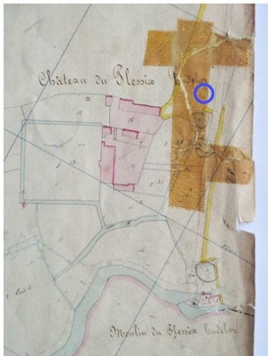
La chapelle sur le cadastre napoléonien (partie détériorée par la bande adhésive) IVR53_19993504705NUC