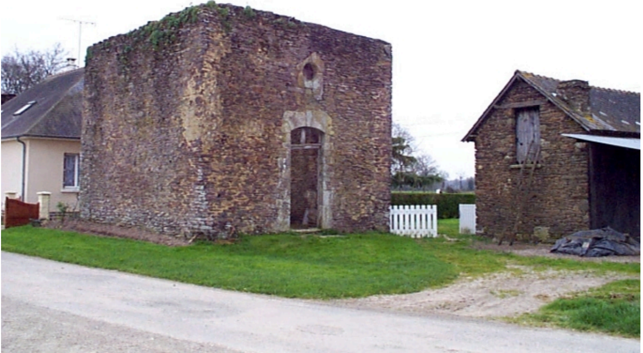
Vue générale nord-ouest