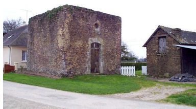
Vue générale nord-ouest IVR53_19993504740NUCA