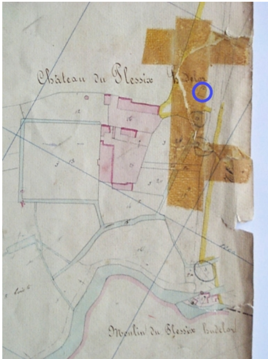
La chapelle sur le cadastre napoléonien (partie détériorée par la bande adhésive)