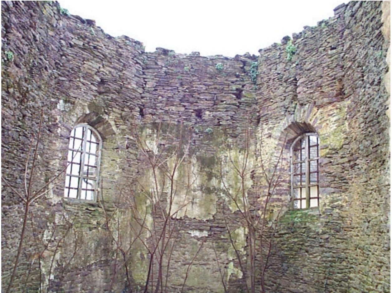
Le choeur : vue intérieure ouest