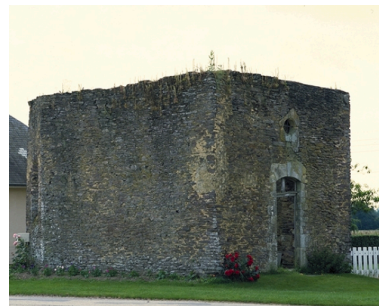
Vue générale nord-ouest IVR53_19993501227XA