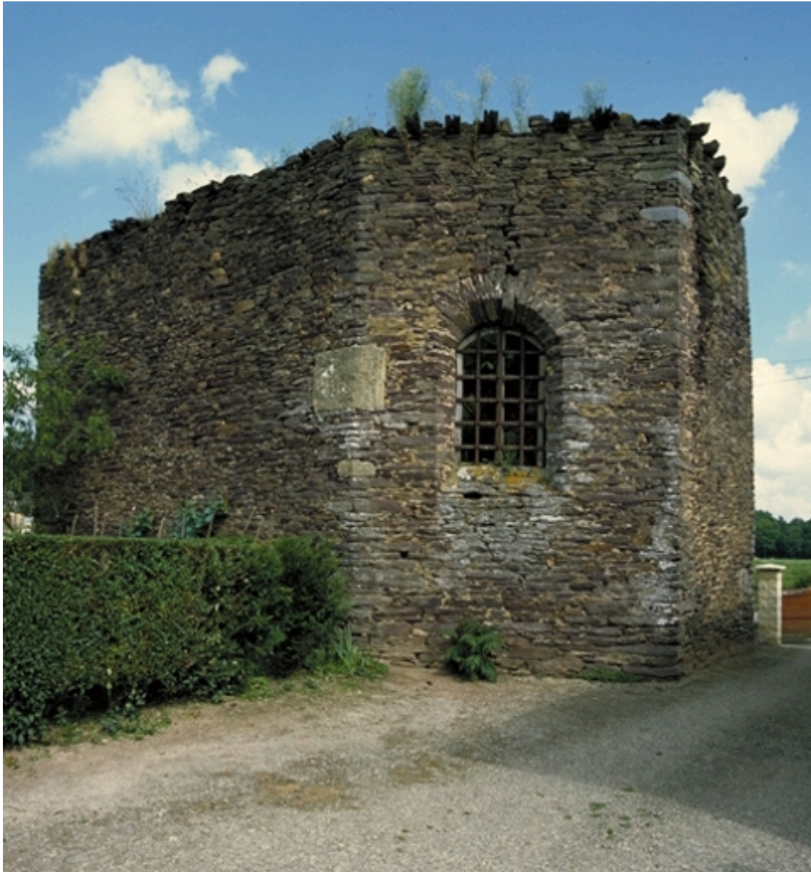
Vue générale sud-est