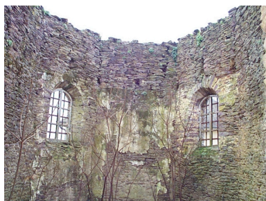
Le choeur : vue intérieure ouest IVR53_19993504739NUCA