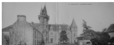
Vue générale sur la cour IVR53_20052904388NUCB