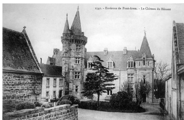
Vue générale depuis la cour centrale IVR53_20042905603NUCB