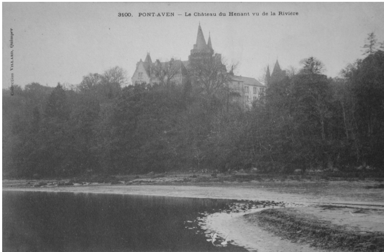
Vue depuis la rivière