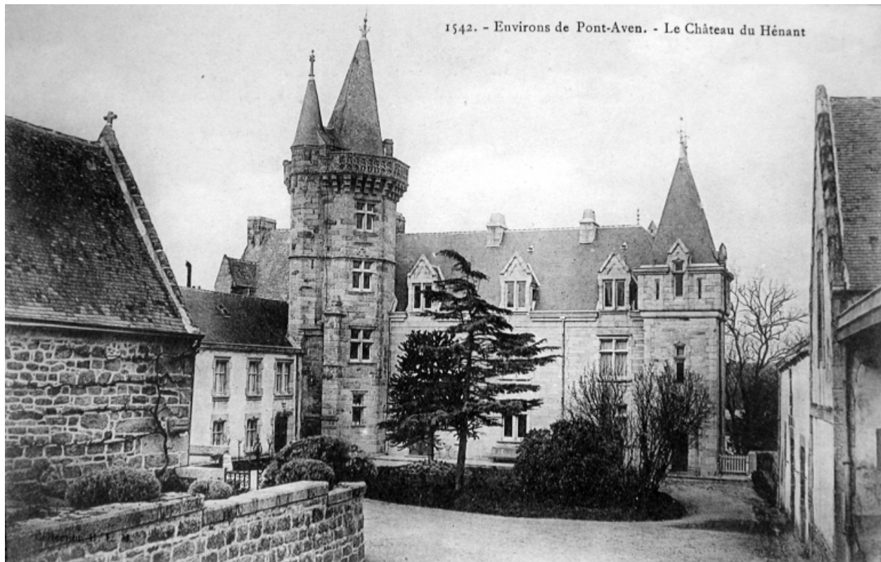
Vue générale depuis la cour centrale