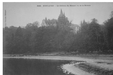
Vue depuis la rivière