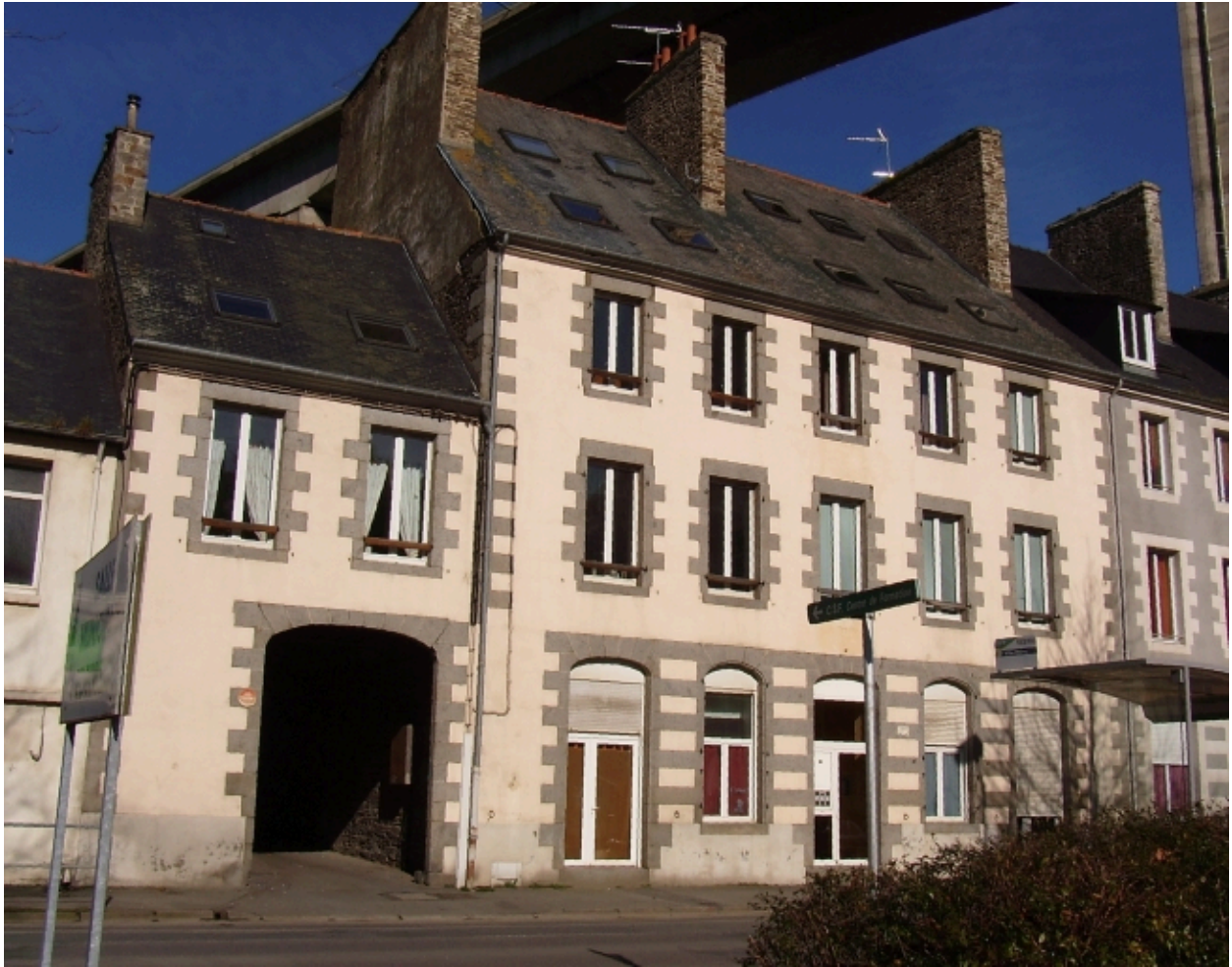
Vue générale, élévation principale