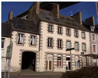
Vue générale, élévation principale