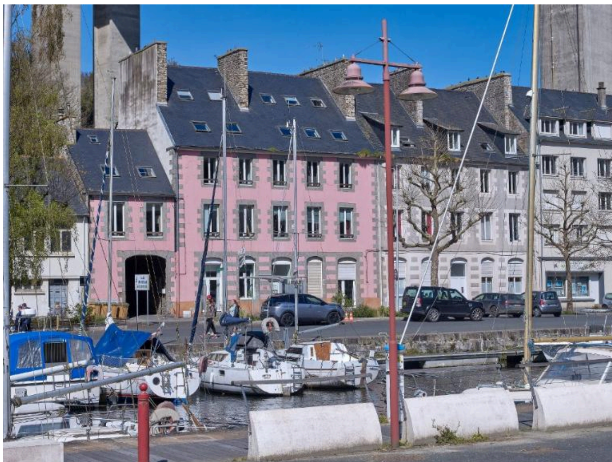
Maisons d'armateur au port du Légué