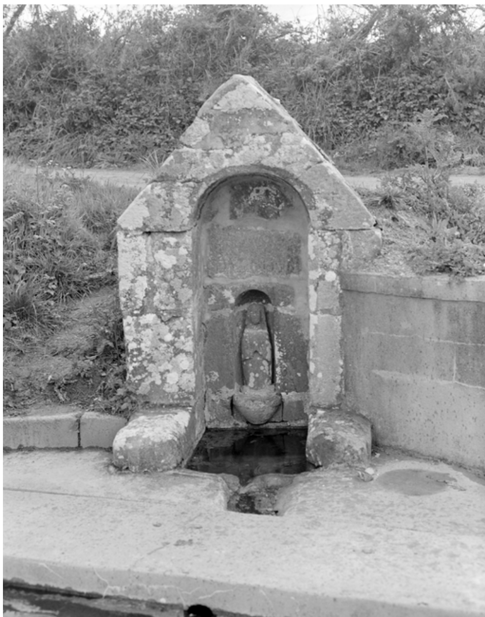
Fontaine, vue rapprochée sud, voute et statuette de saint Goulien. (1983)