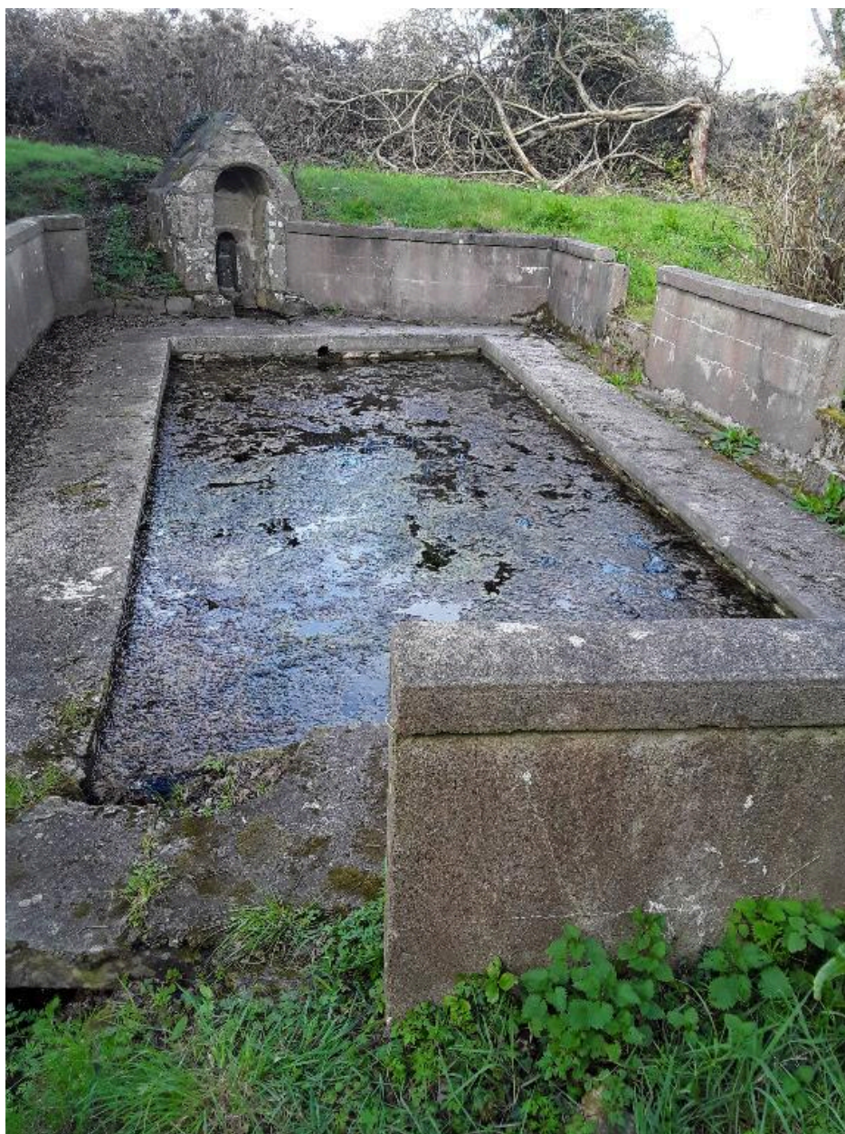
Fontaine et lavoir, vue générale sud. (2018)