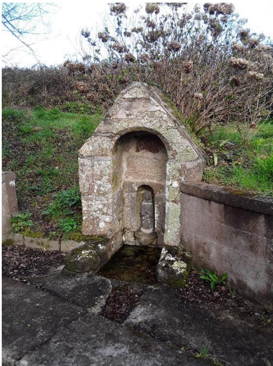
Fontaine, vue rapprochée sud, voute et statuette de saint Goulien. (2018)