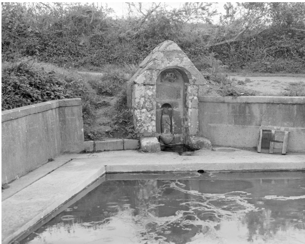
Fontaine et lavoir, vue générale sud. (1983)