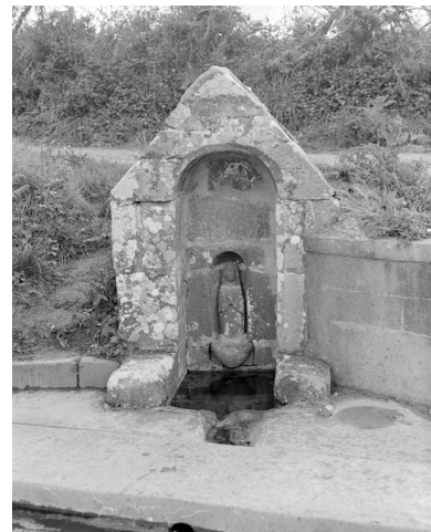
Fontaine, vue rapprochée sud, voue et statuette de saint Goulien. (1983) IVR53_19832901068X