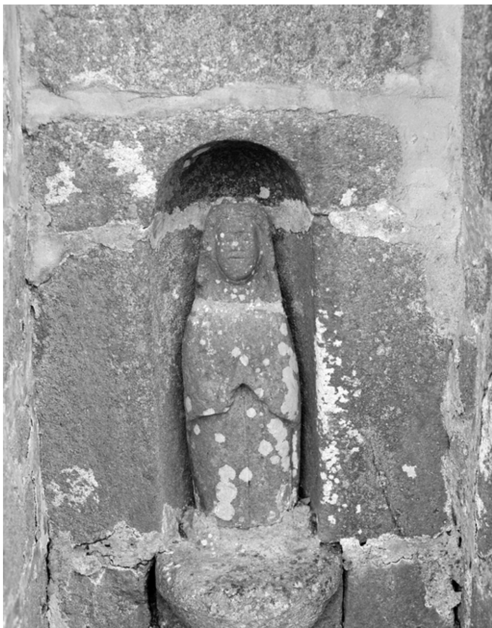
Vue générale de la statue de saint Goulien (1983)