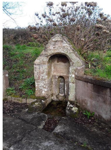
Fontaine, vue rapprochée sud, voute et statuette de saint Goulien. (2018)