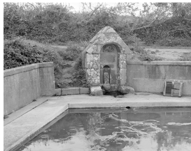
Fontaine et lavoir, vue générale sud. (1983) IVR53_19832901067X