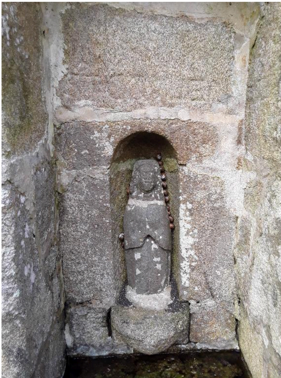
Vue générale de la statue de saint Goulien (2018)