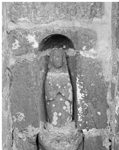
Vue générale de la statue de saint Goulien (1983)