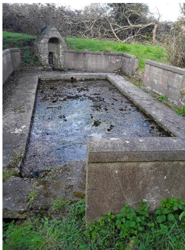
Fontaine et lavoir, vue générale sud. (2018) IVR53_20182905412NUCA