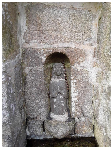
Vue générale de la statue de saint Goulien (2018) IVR53_20182905413NUCA