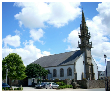
Ploumoguier, église paroissiale : vue générale nord-ouest