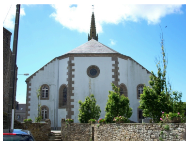
Ploumoguier, église paroissiale : élévation est