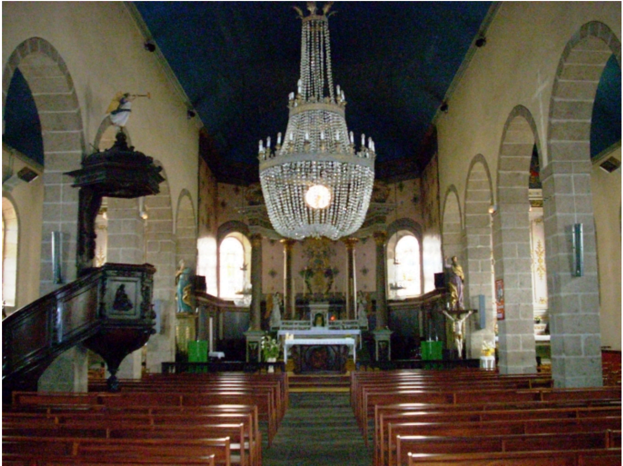
Ploumogueur, église paroissiale : vue axiale est