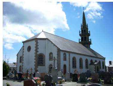
Ploumoguier, église paroissiale : vue générale nord-est