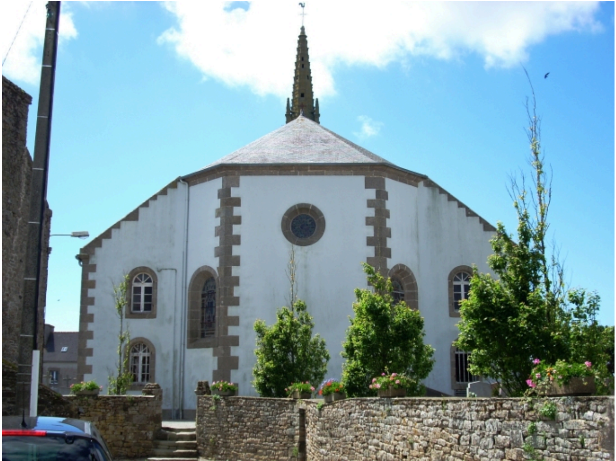
Ploumogueur, église paroissiale : élévation est