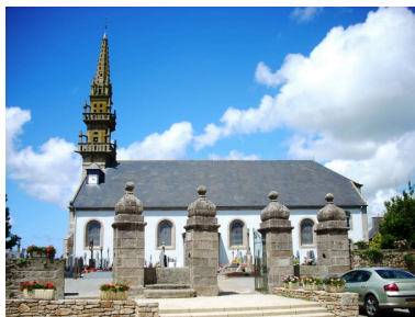
Ploumoguier, église paroissiale : élévation sud