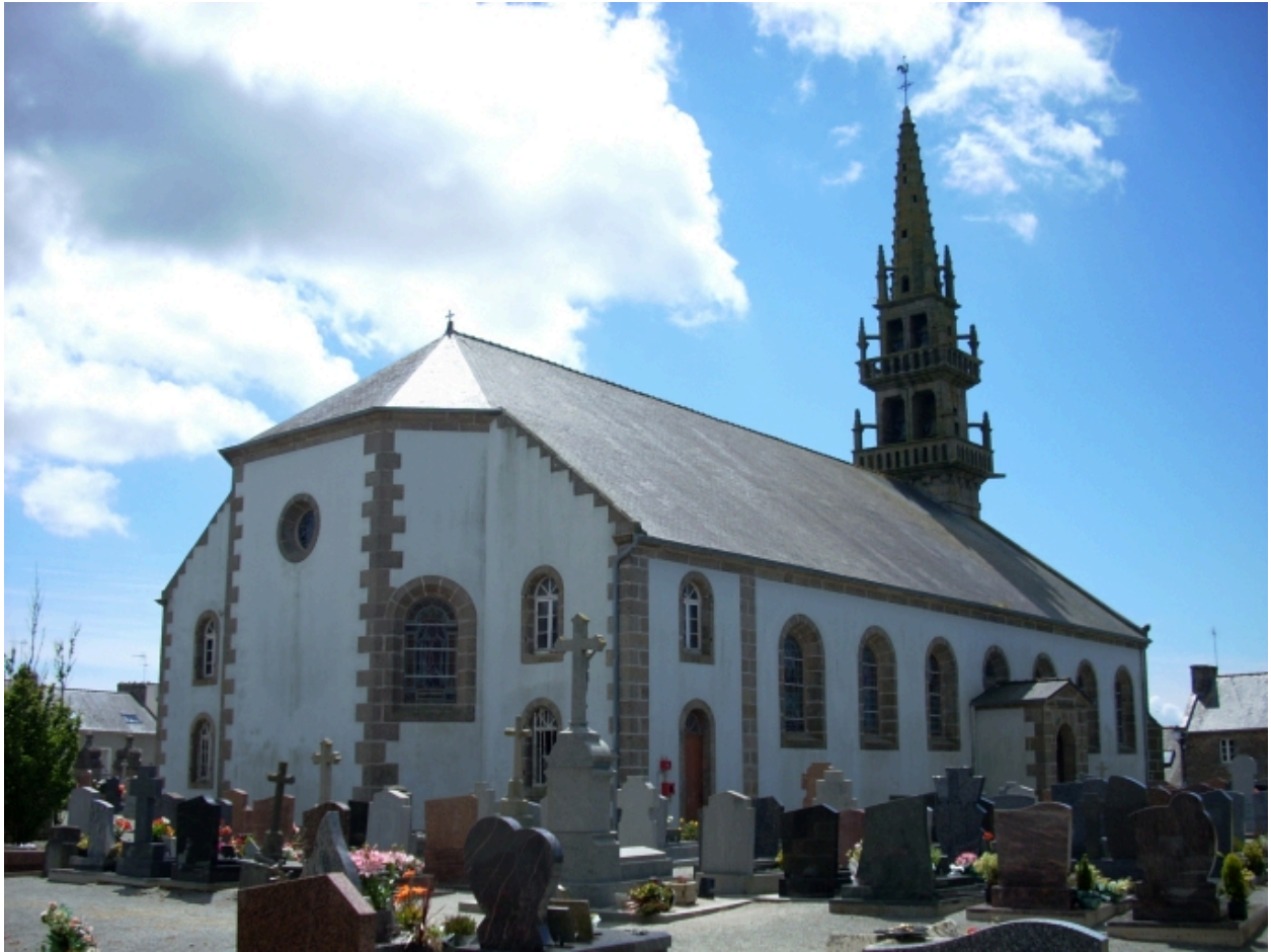
Ploumogueur, église paroissiale : vue générale nord-est