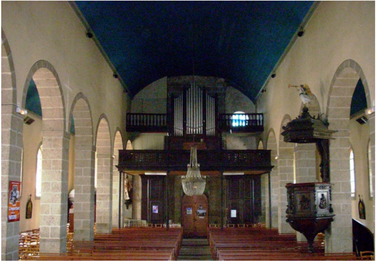
Ploumoguier, église paroissiale : vue axiale ouest