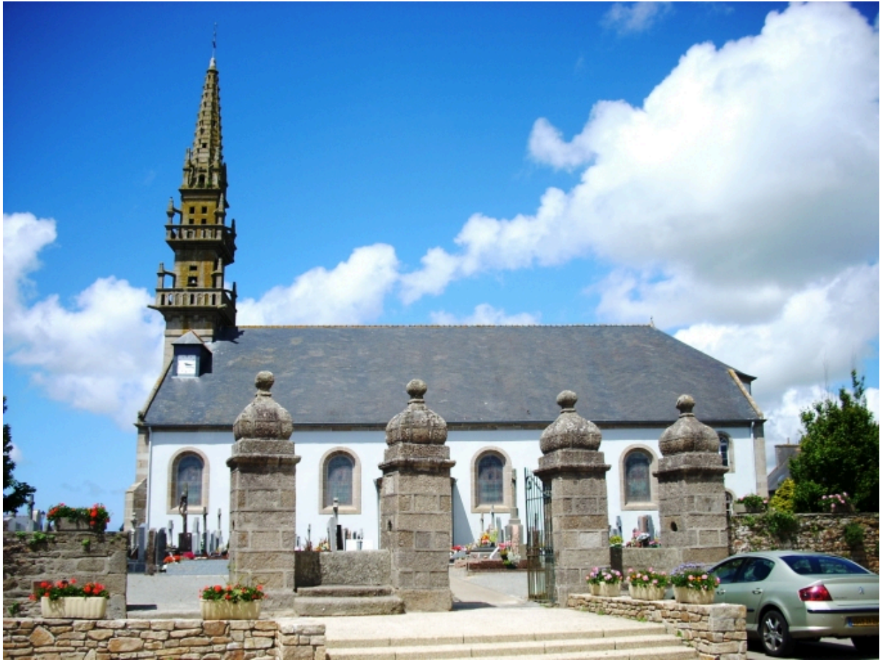
Ploumoguer, église paroissiale : élévation sud