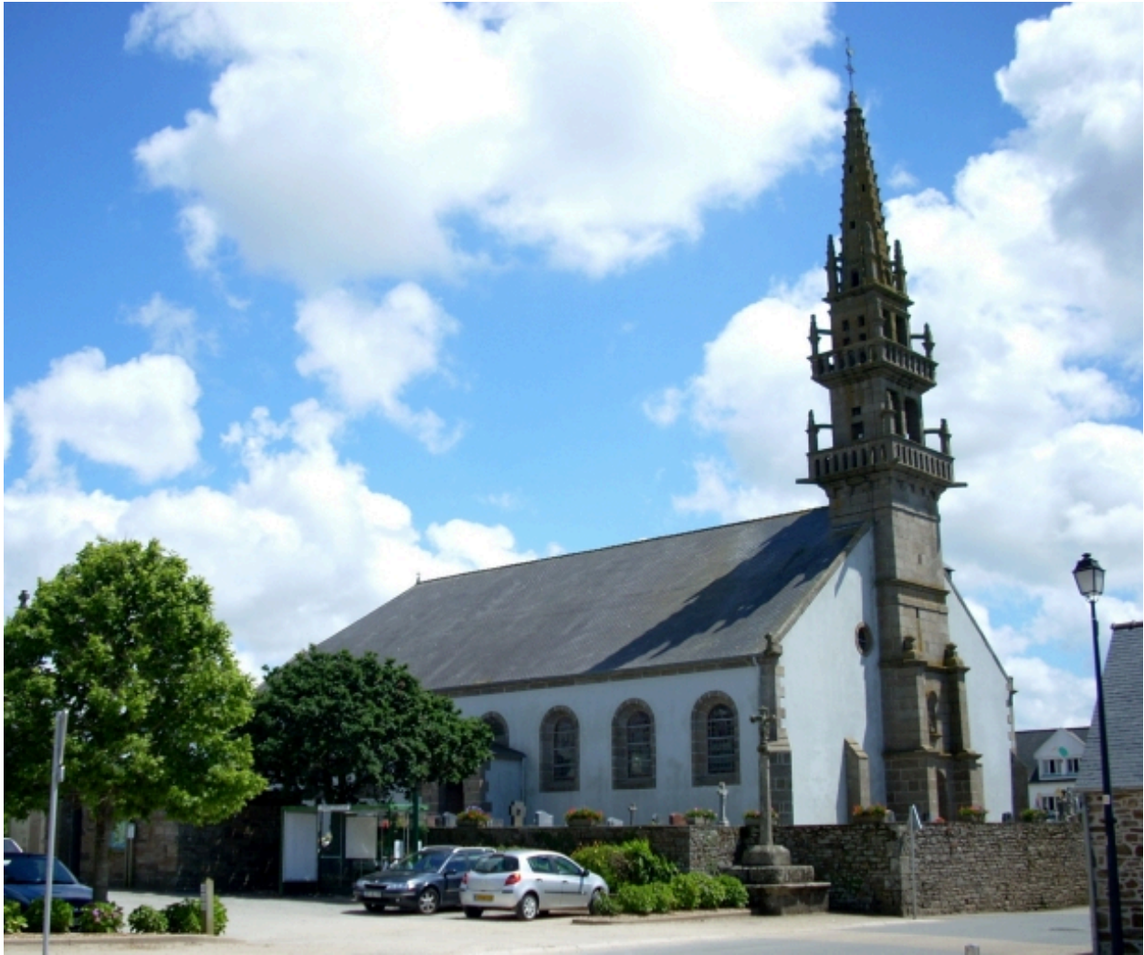
Ploumogueur, église paroissiale : vue générale nord-ouest