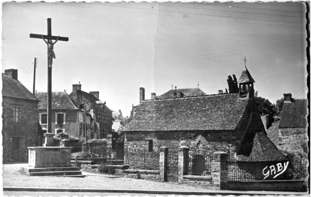
Le calvaire et la chapelle Sainte-Agathe sans le mur d'enceinte : vue générale