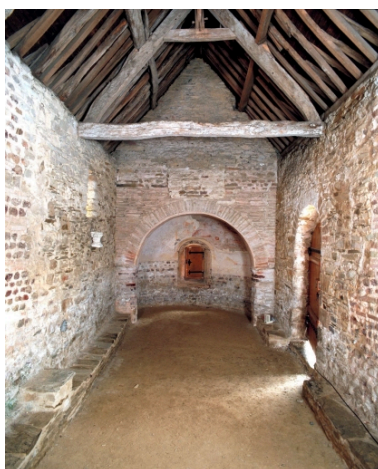
Vue intérieure prise de la nef vers le chœur IVR53_20013501845XA