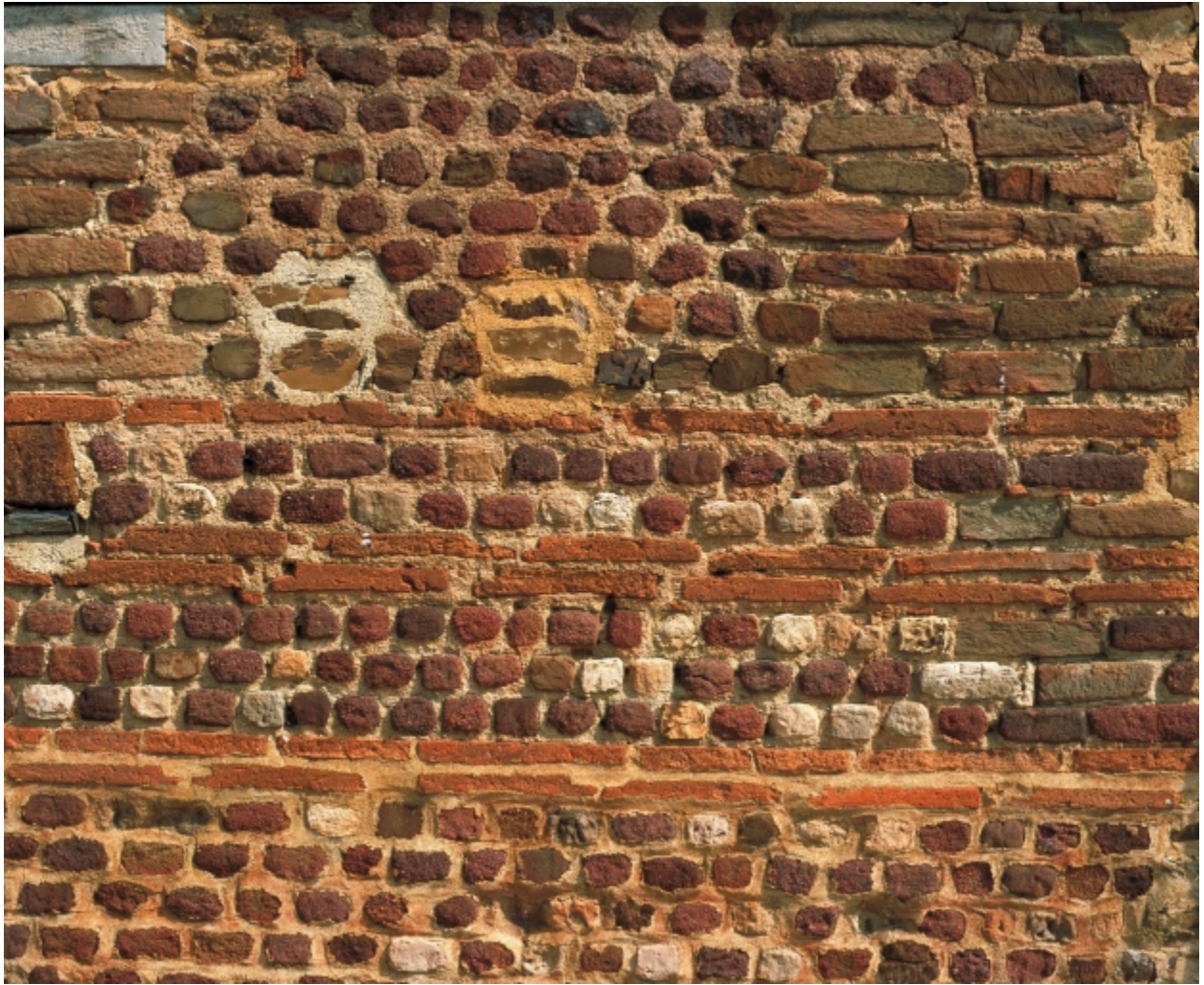
Détail de l'appareil