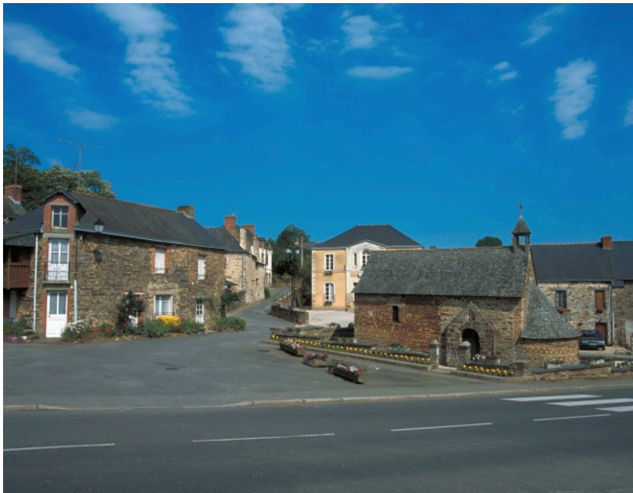
Vue de situation sud-est