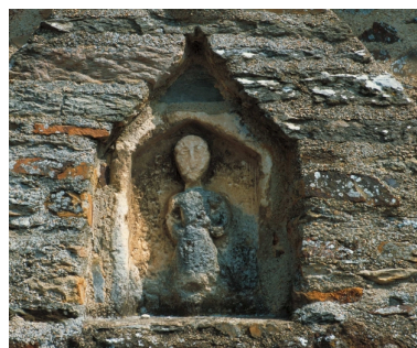
Façade sud : détail de la niche du portail sud