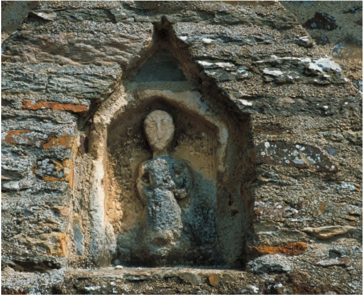
Façade sud : détail de la niche du portail sud