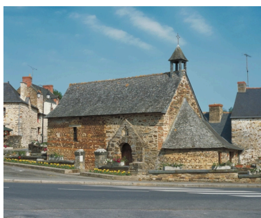
Vue générale sud-est IVR53_20013501807XA