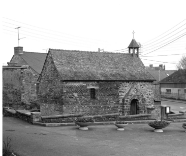
Vue générale sud-ouest IVR53_19933500092X