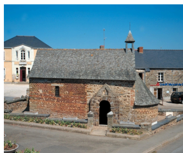
Vue générale sud-sud-est IVR53_19953500247XA