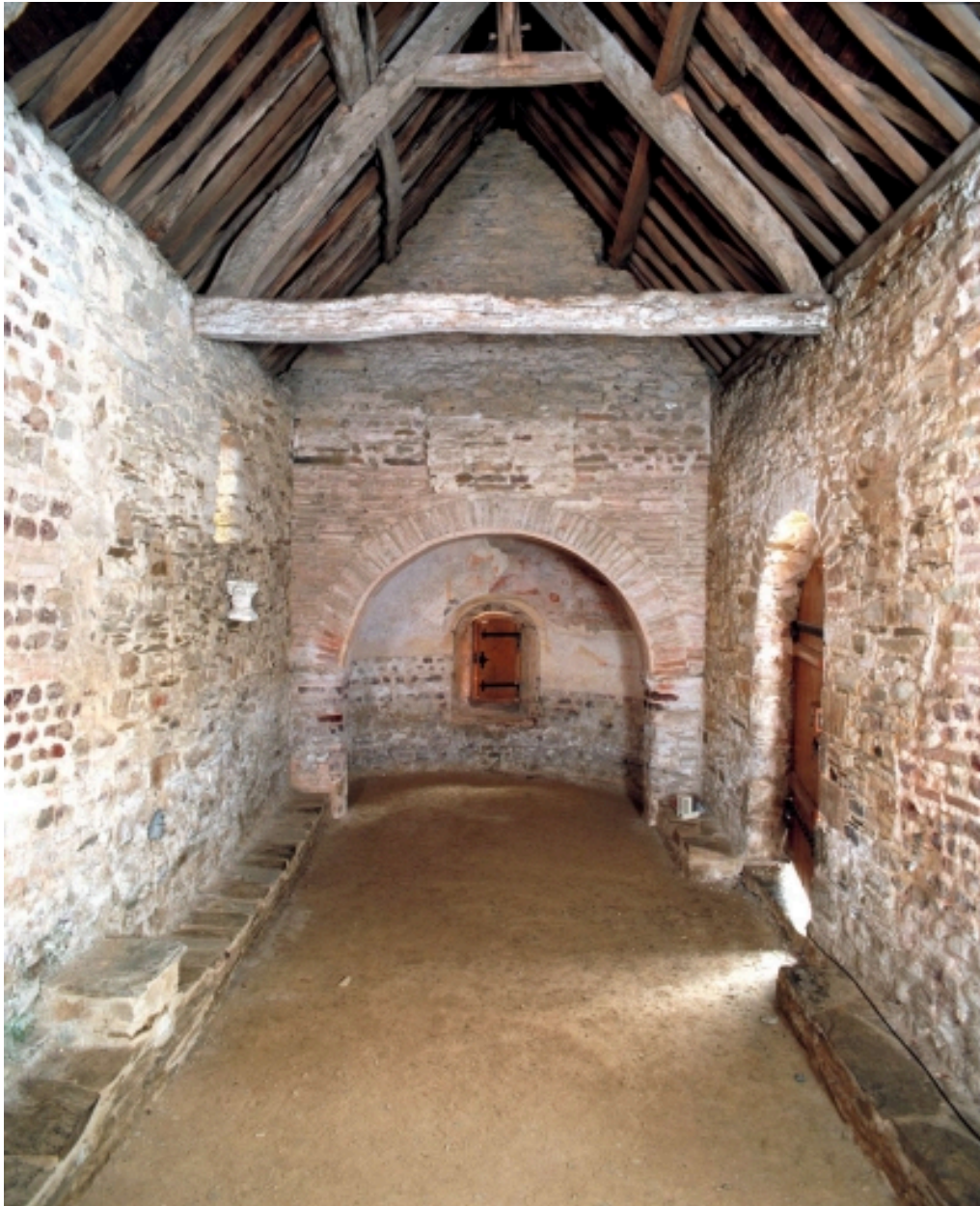
Vue intérieure prise de la nef vers le chœur