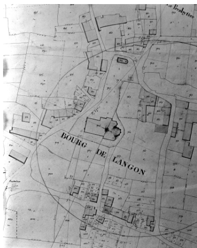
Extrait cadastral de 1842