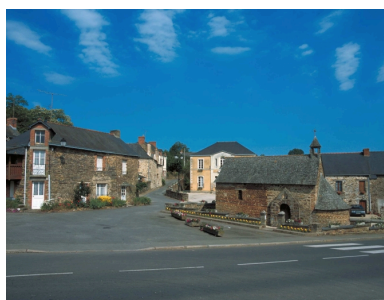
Vue de situation sud-est IVR53_20013501814XA