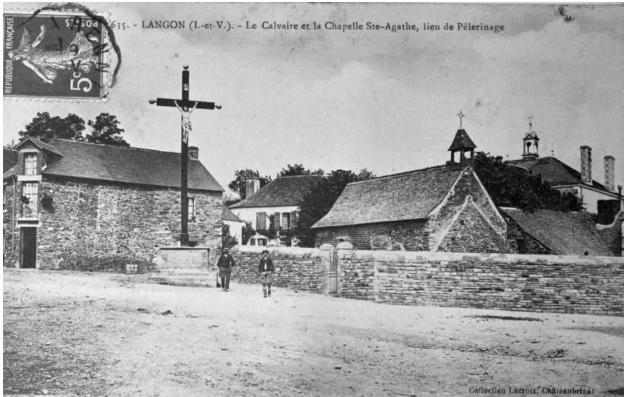
Le calvaire, le mur d'enceinte et la chapelle Sainte-Agathe : vue générale