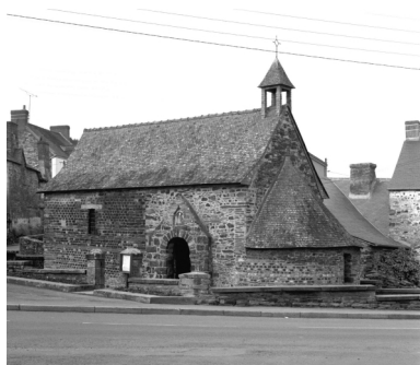
Vue générale sud-sud-est, IVR53_19933500093X