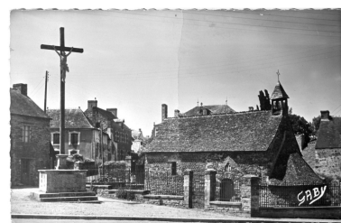
Le calvaire et la chapelle Sainte-Agathe sans le mur d'enceinte : vue générale IVR53_19943500792X