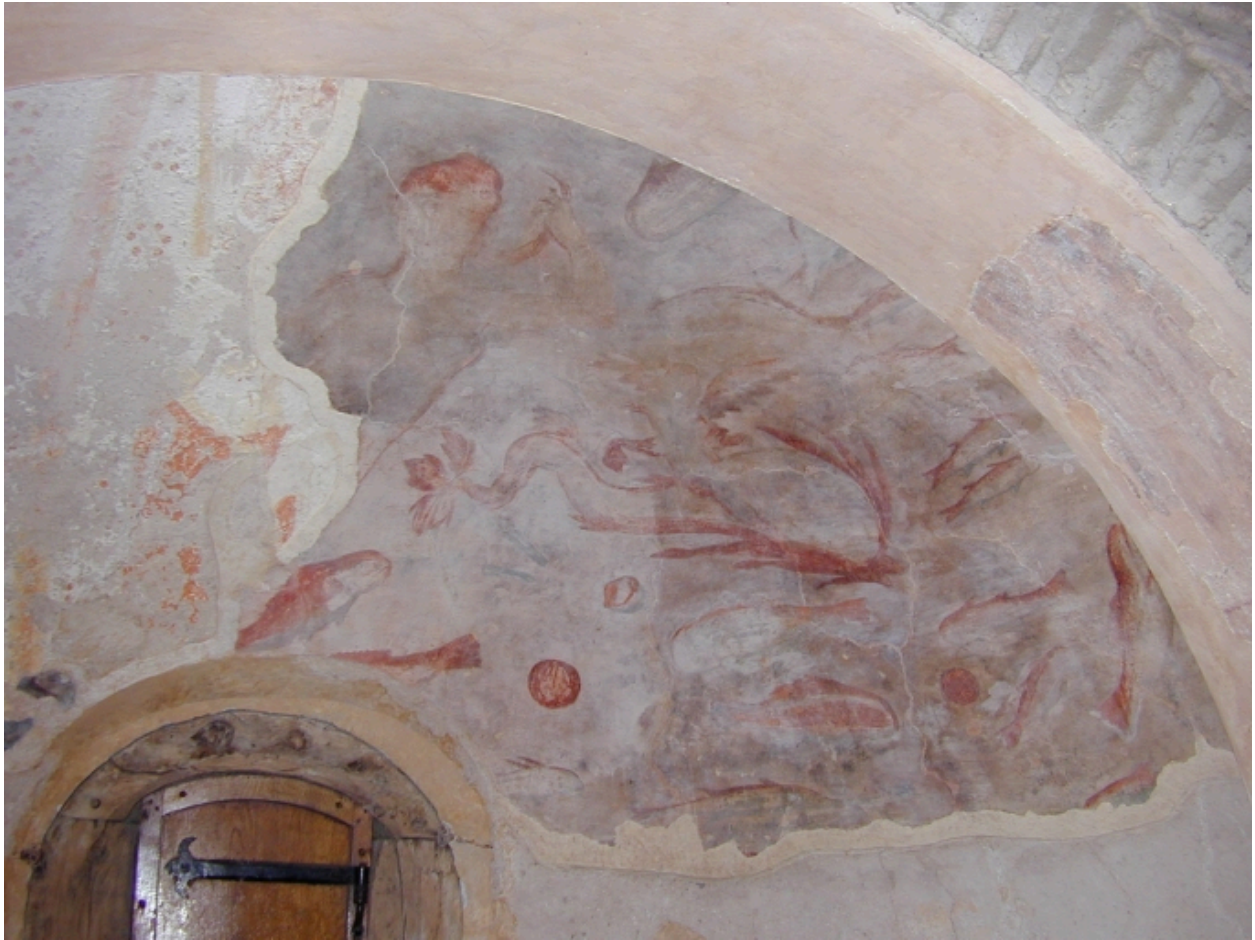
Vue intérieure, fresque de l'abside