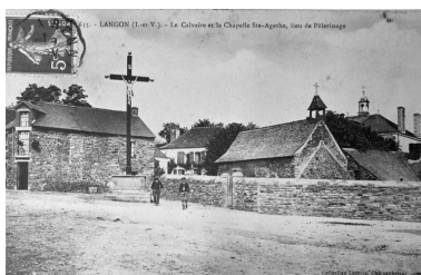
Le calvaire, le mur d'enceinte et la chapelle Sainte-Agathe : vue générale IVR53_19943500791X