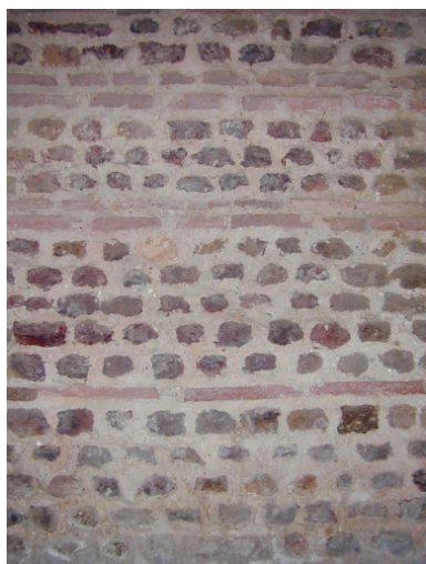
Vue intérieure, détail, appareillage du mur sud IVR53_20013510120NUCA