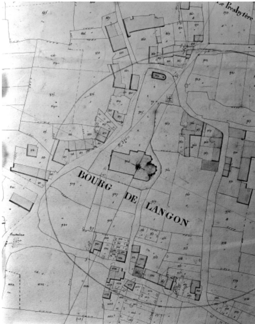
Extrait cadastral de 1842