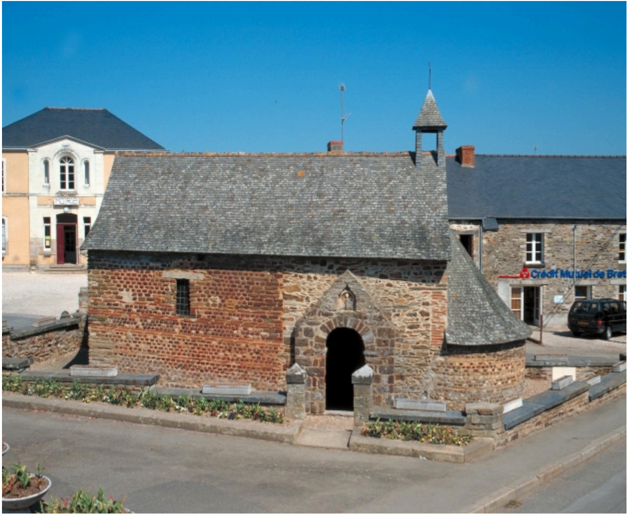
Vue générale sud-sud-est