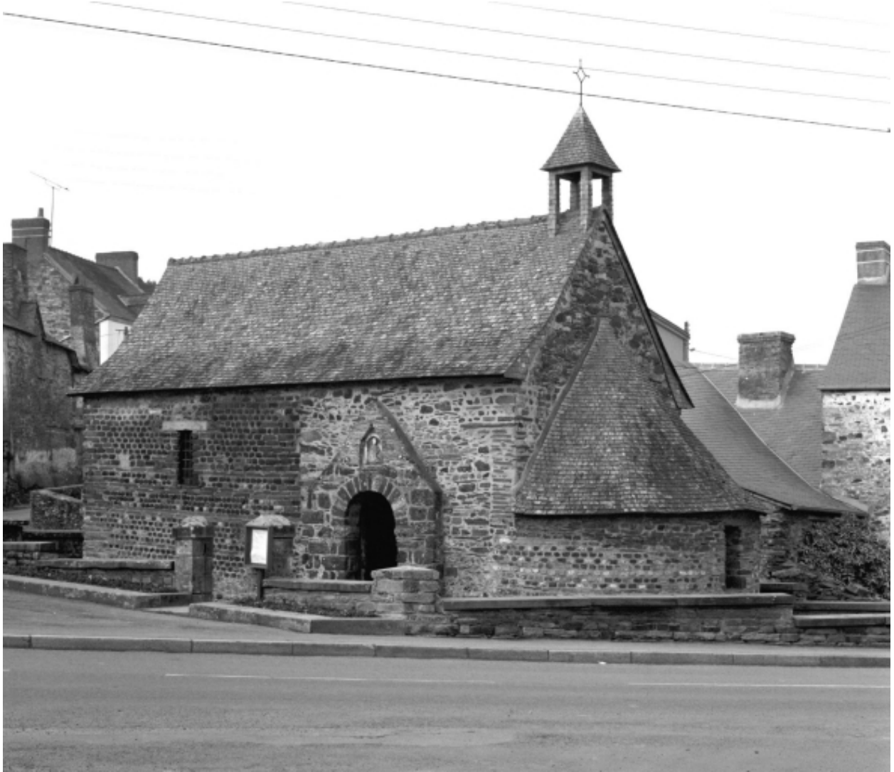
Vue générale sud-sud-est