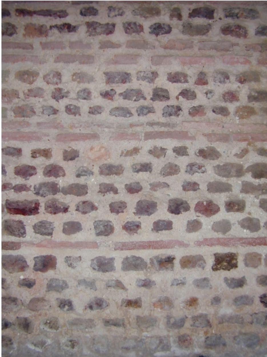
Vue intérieure, détail, appareillage du mur sud