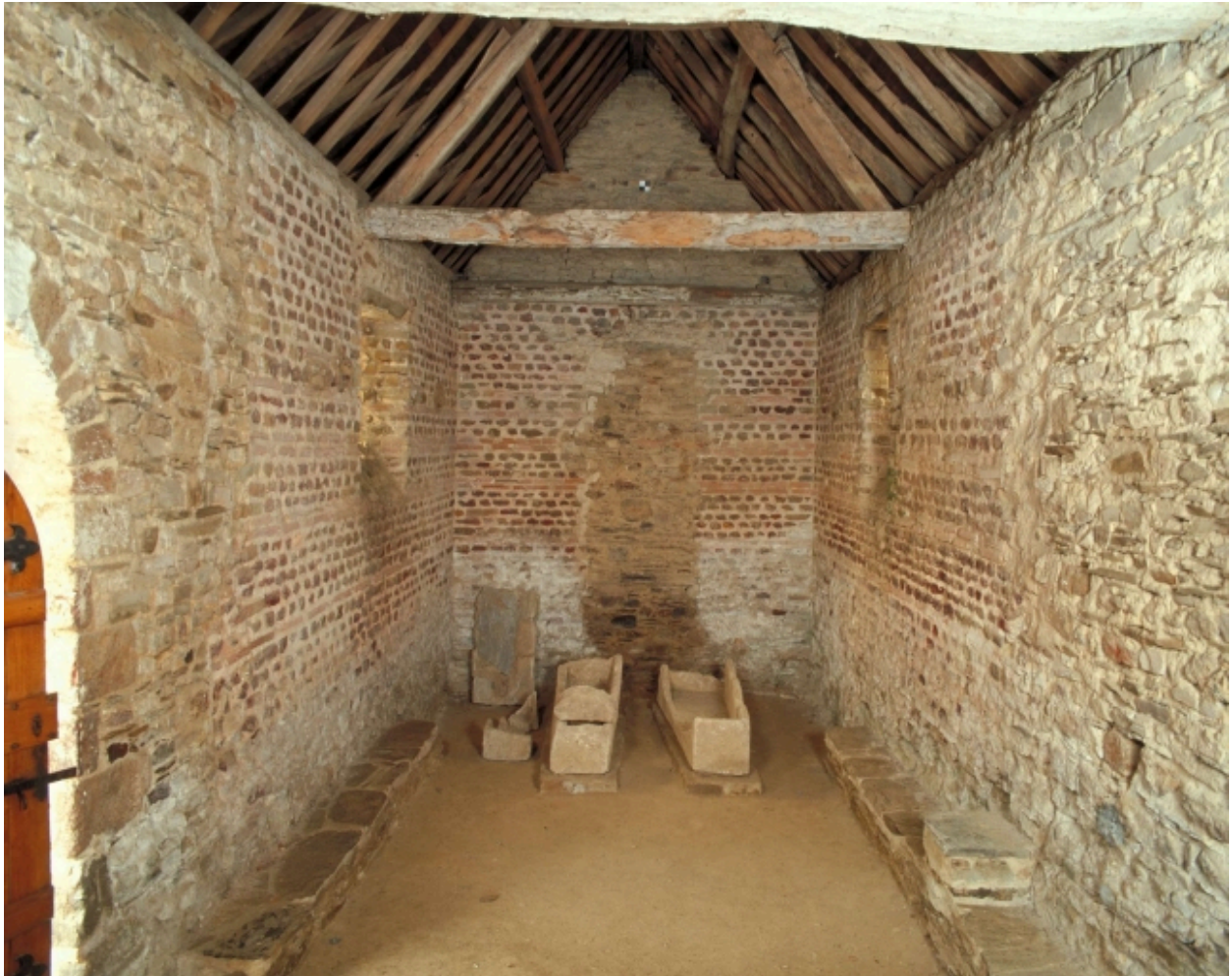
Vue intérieure prise du chœur vers la nef