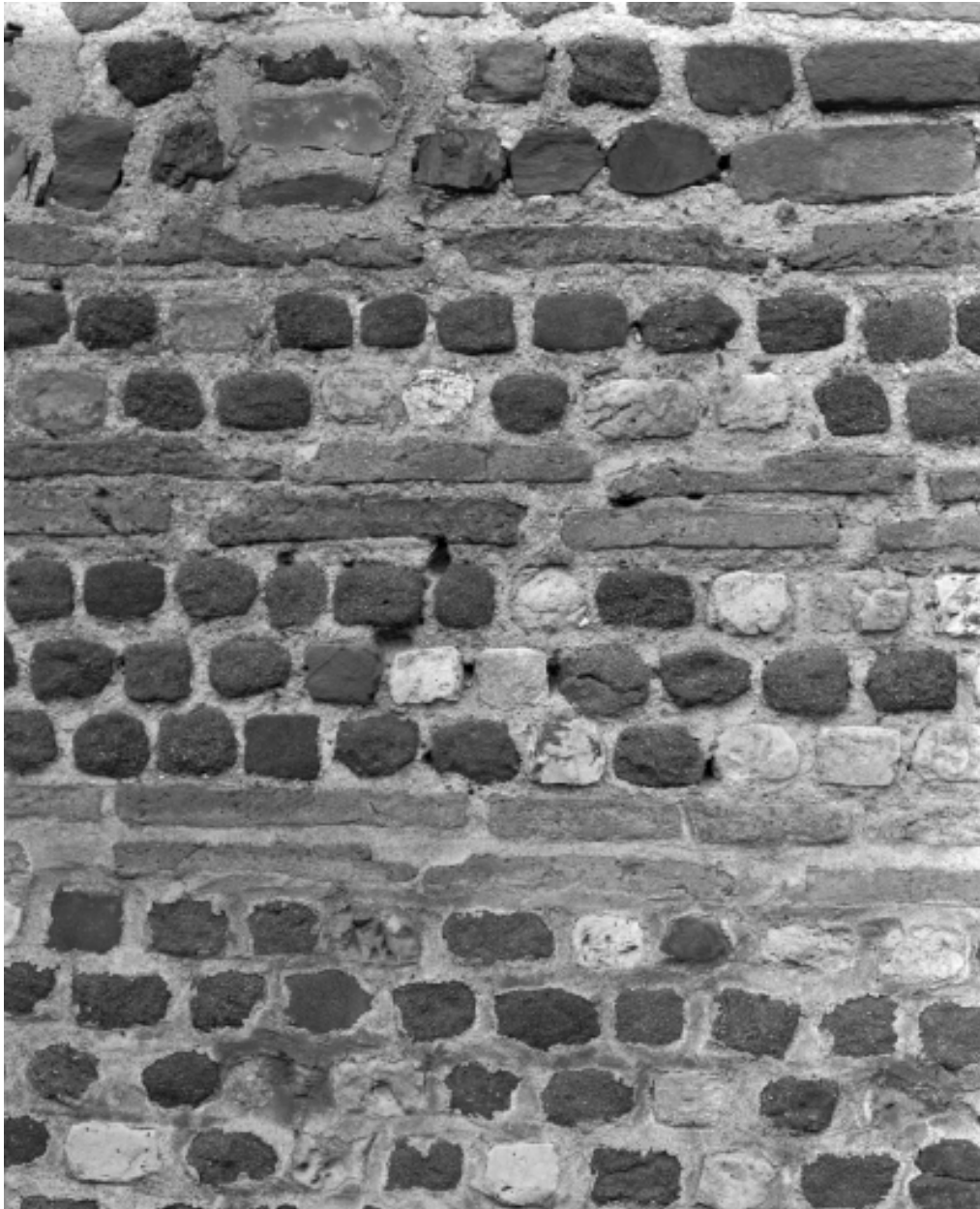
Détail de l'appareil