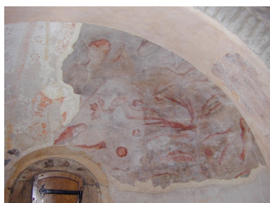
Vue intérieure, fresque de l'abside IVR53_20013510121NUCA