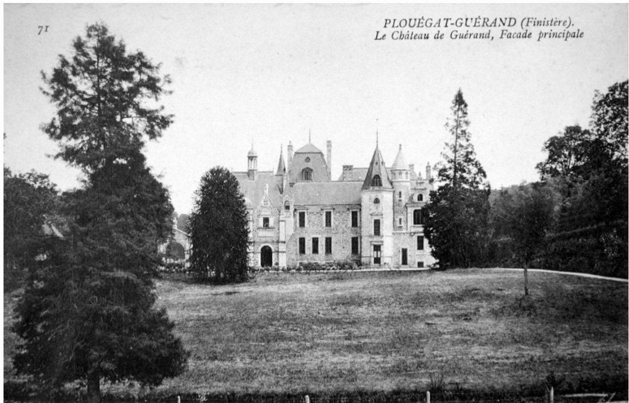
Vue de situation sur la façade principale