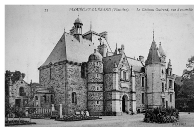
Vue rapprochée sur la façade principale du côté de la chapelle