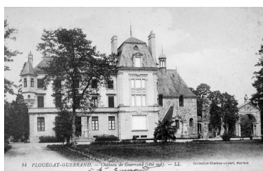
Vue rapprochée sur la façade postérieure