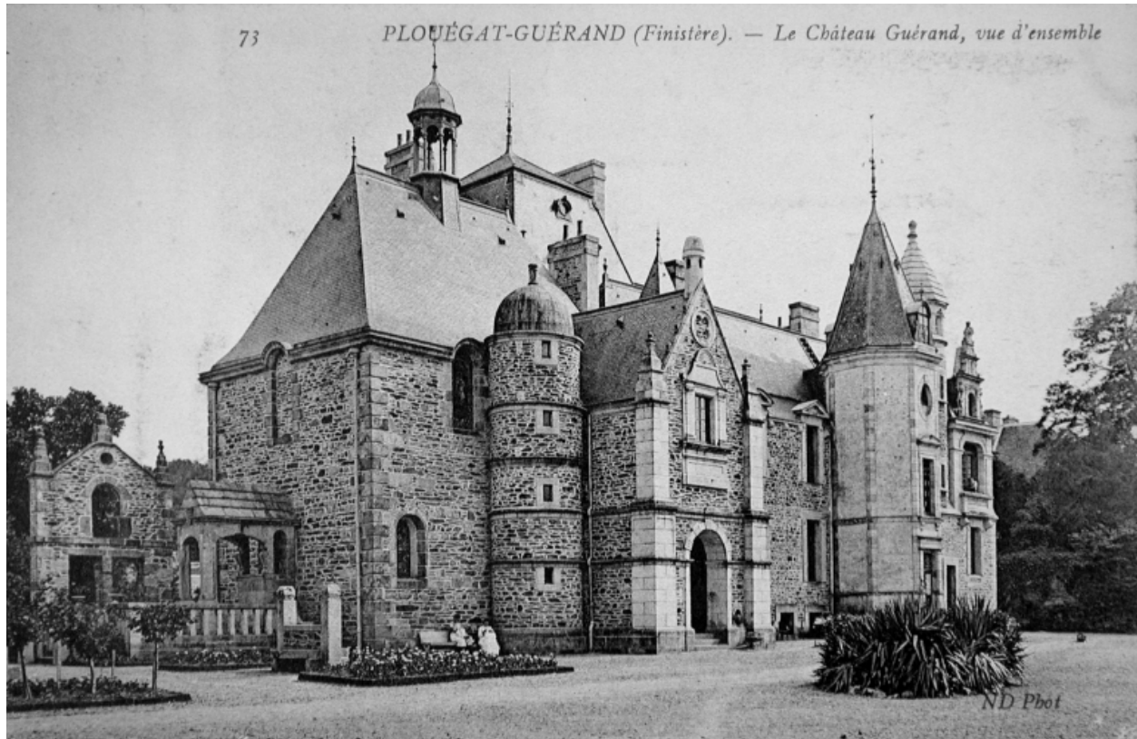
Vue rapprochée sur la façade principale du côté de la chapelle