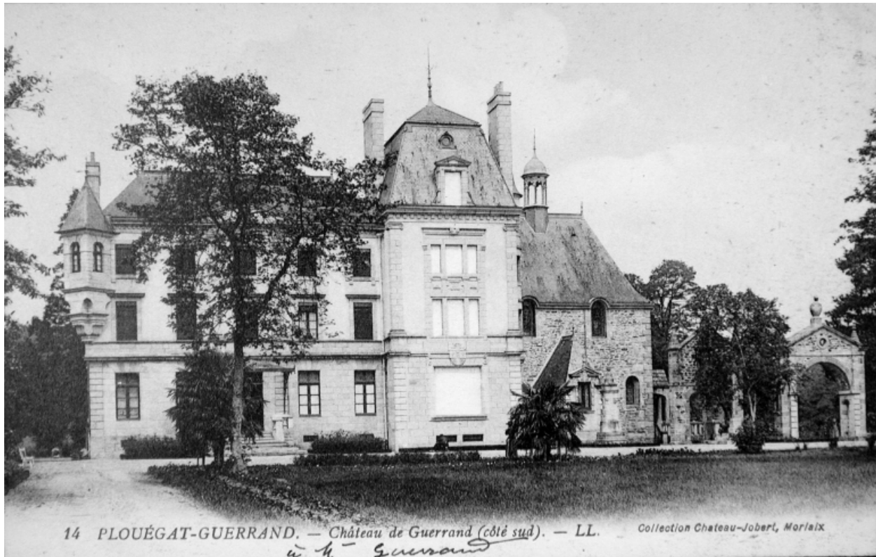
Vue rapprochée sur la façade postérieure