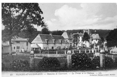
Vue de situation sur la façade postérieure et les parties agricoles IVR53_20042905569NUCB