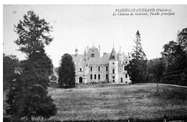
Vue de situation sur la façade principale IVR53_20042905555NUCB