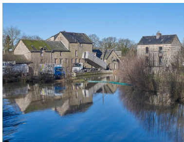
Vue du moulin/minoterie de Roudun par les voyageurs