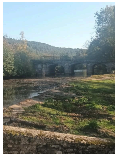
Pont de Roudun