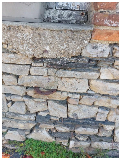
Fer à cheval incrusté dans le parement de la façade principale