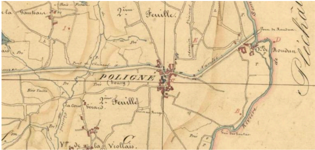
Extrait du cadastre Napoléonien de 1784, le bourg de Poligné