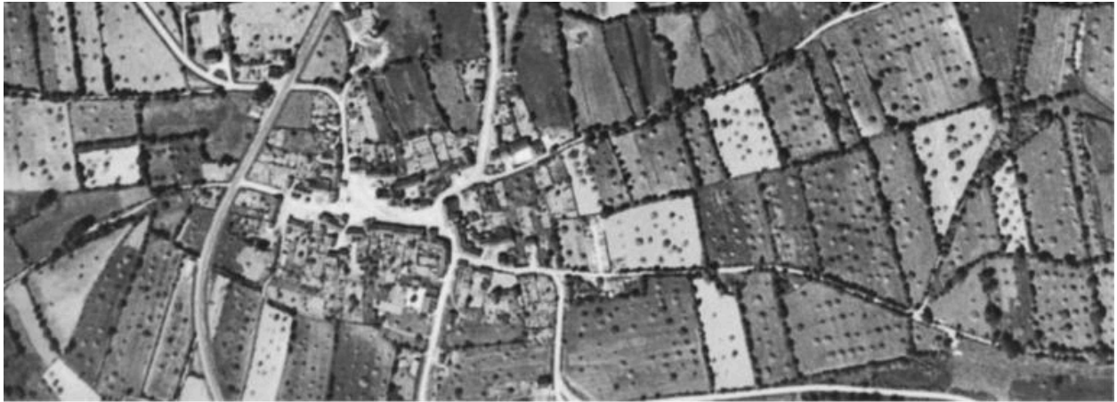
vue aérienne de 1948 du bourg de Poligné