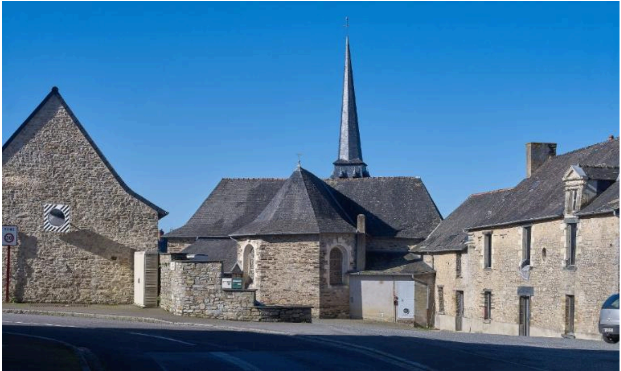
Vue de l'église Saint-Donatien et Saint-Rogatien par les voyageurs