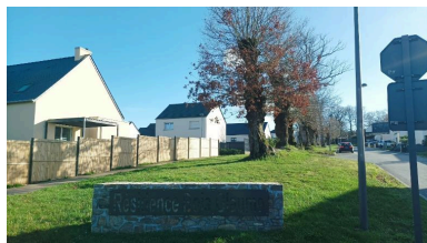
Lotissement, Résidence Bois Glaume IVR53_20263510391NUCA