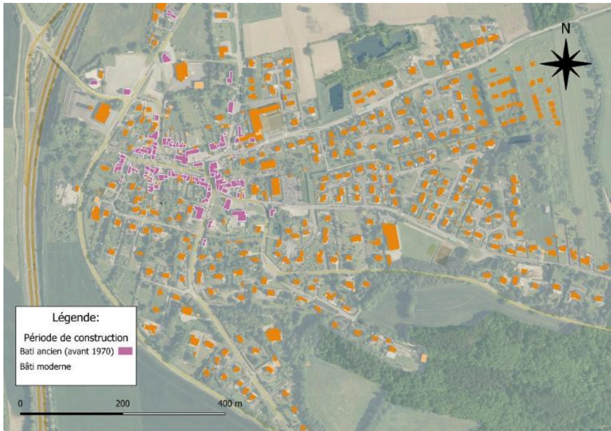
Carte des implantations après 1970 bourg de Poligné

IVR53_20263510389NUDA Auteur de l'illustration : Jézéquel Tom (c) Région Bretagne tous droits réservés