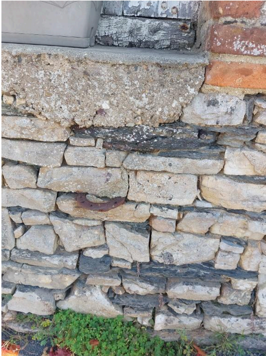
Fer à cheval incrusté dans le parement de la façade principale