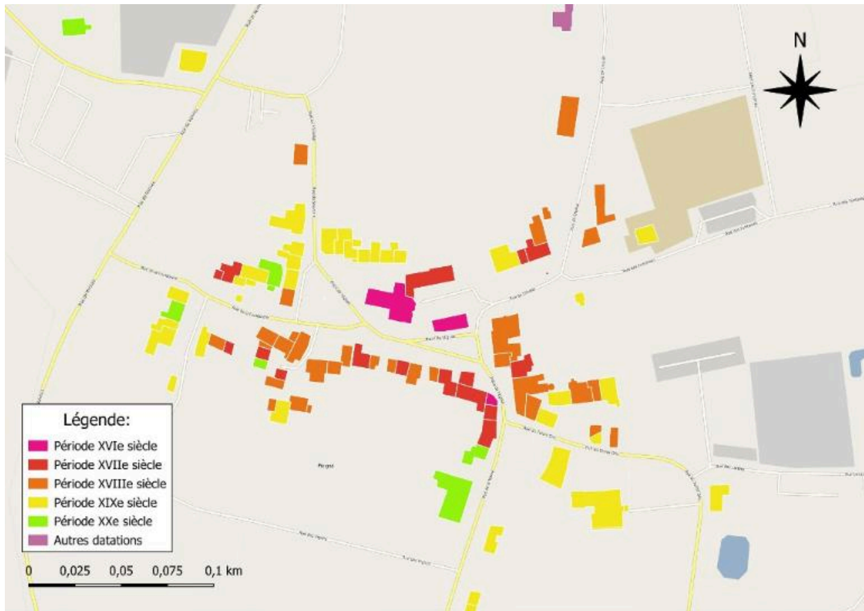
Carte de datation du bourg de Poligné

IVR53_20263510395NUDA Auteur de l'illustration : Jézéquel Tom (c) Université de Rennes 2 tous droits réservés