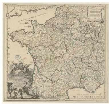
Carte des relais de poste en Bretagne en 1748