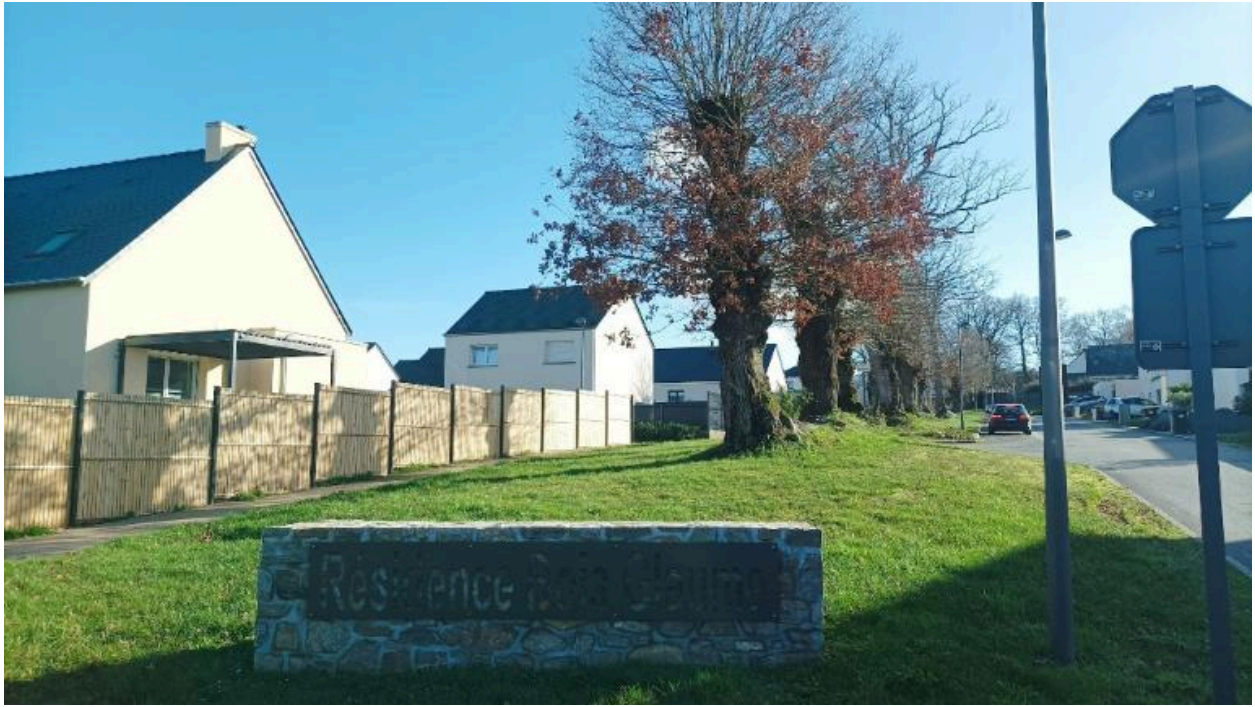
Lotissement, Résidence Bois Glaume

IVR53_20263510391NUCA Auteur de l'illustration : Jézéquel Tom (c) Université de Rennes 2 tous droits réservés