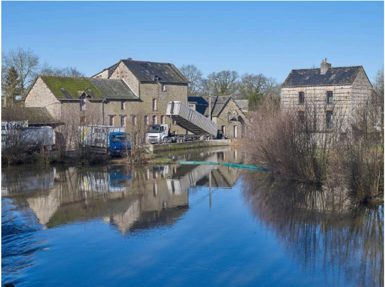
Vue du moulin/minoterie de Roudun par les voyageurs