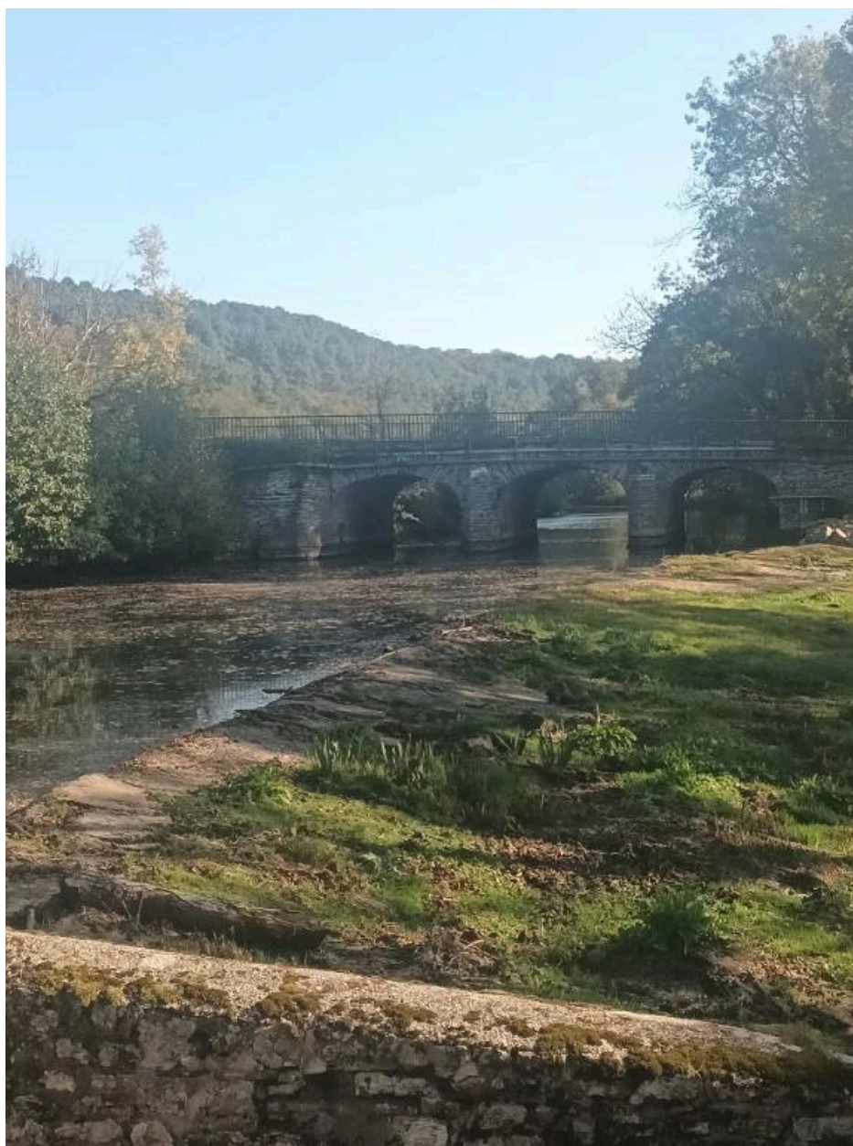
Pont de Roudun