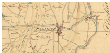
Extrait du cadastre Napoléonien de 1784, le bourg de Poligné IVR53_20263510383NUCA