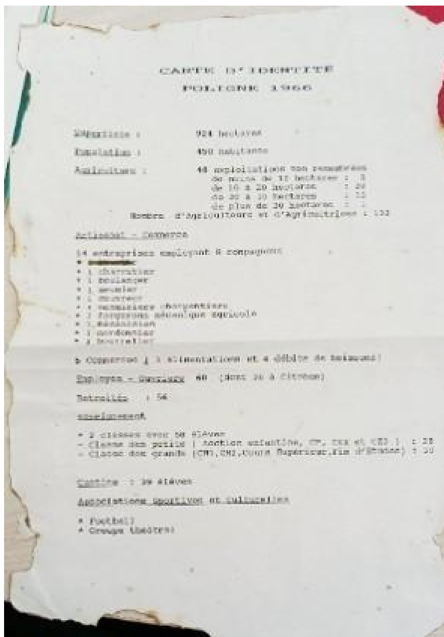
Carte d'identité de Poligné 1966