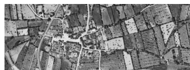
vue aérienne de 1948 du bourg de Poligné