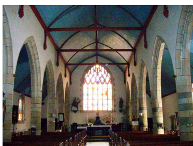
Landeleau, église paroissiale Saint-Théleau : vue axiale est