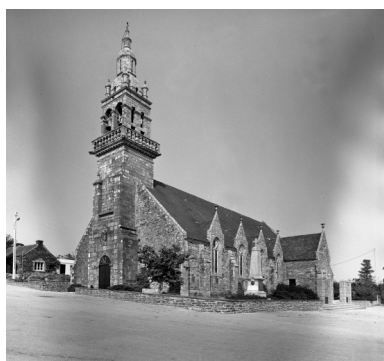
Landeleau, église paroissiale Saint-Théleau : vue générale sud-ouest, état en 1966 IVR53_19662900590V