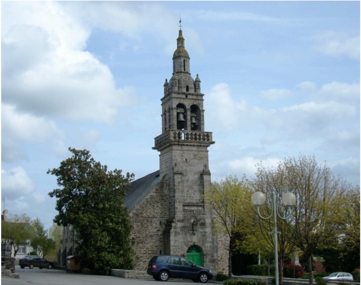
Landeleau, église paroissiale Saint-Théleau : vue générale ouest