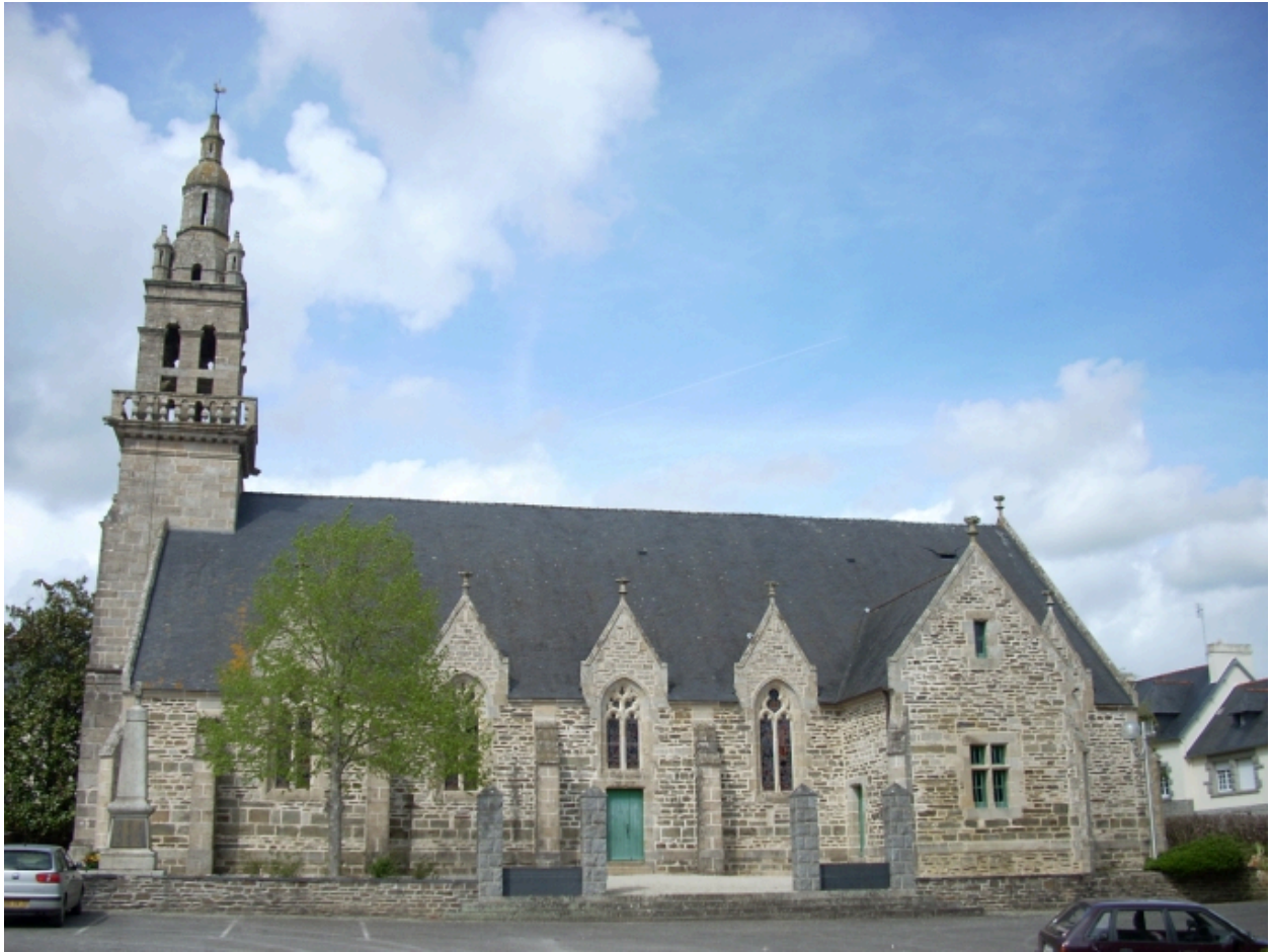
Landeleau, église paroissiale Saint-Théleau : élévation sud