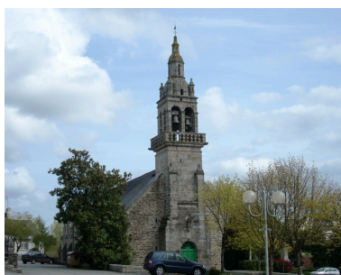
Landeleau, église paroissiale Saint-Théleau : vue générale ouest IVR53_20082905557NUCA