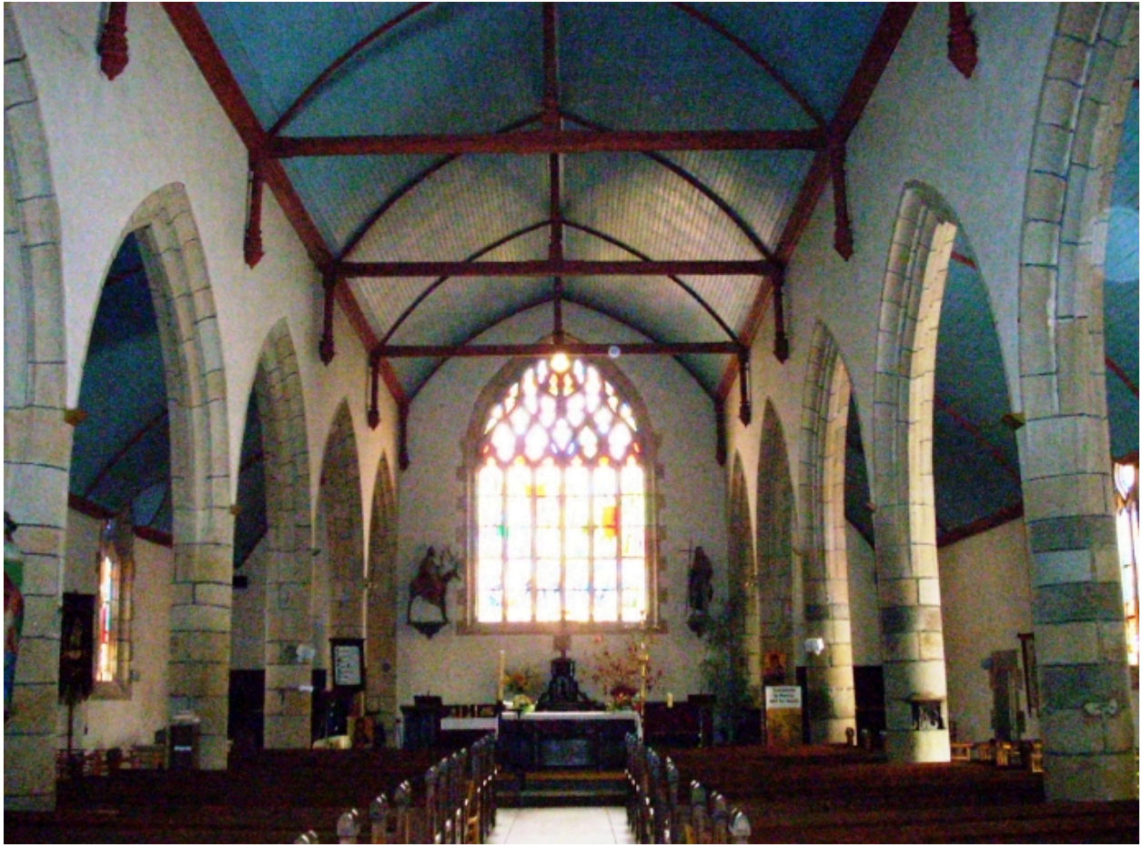
Landeleau, église paroissiale Saint-Théleau : vue axiale est