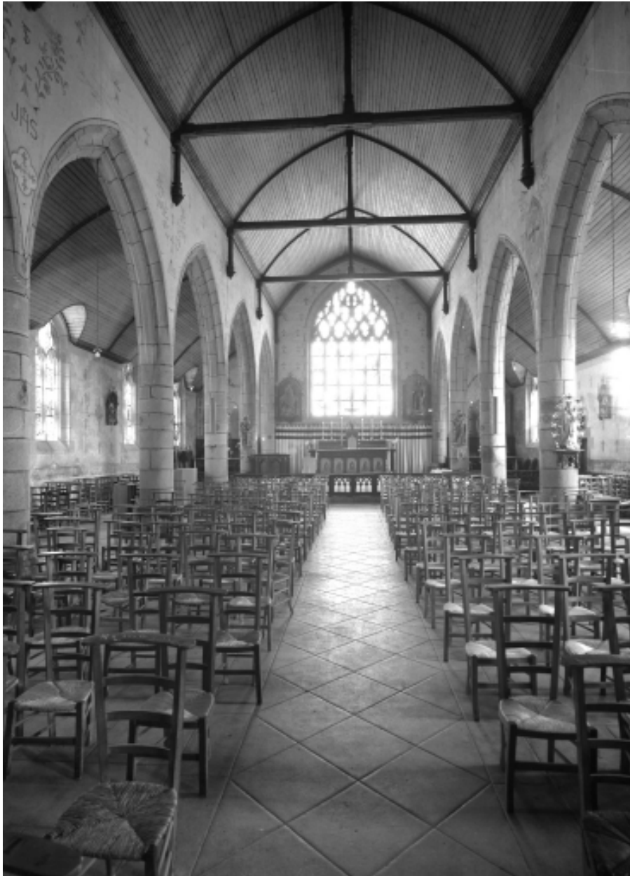
Landeleau, église paroissiale Saint-Théleau : vue axiale est, état en 1966