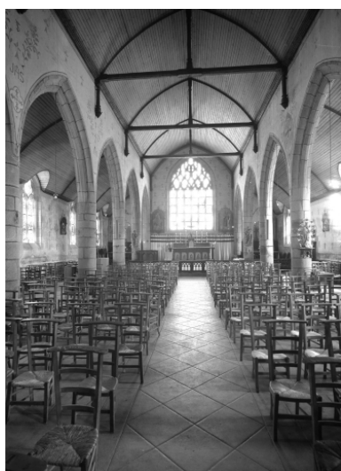
Landeleau, église paroissiale Saint- Théleau : vue axiale est, état en 1966 IVR53_19662900598V