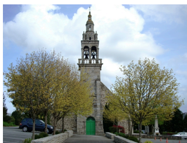
Landeleau, église paroissiale Saint-Théleau : élévation ouest IVR53_20082905559NUCA