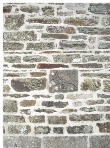
Landeleau, église paroissiale Saint- Théleau : détail du gros oeuvre IVR53_20082905561NUCA