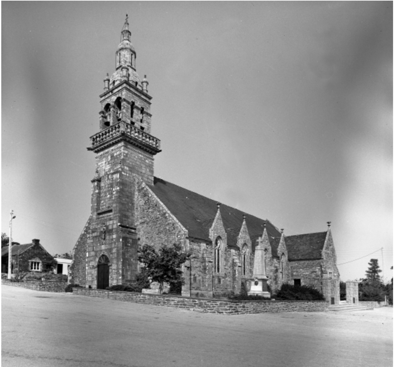
Landeleau, église paroissiale Saint-Théleau : vue générale sud-ouest, état en 1966