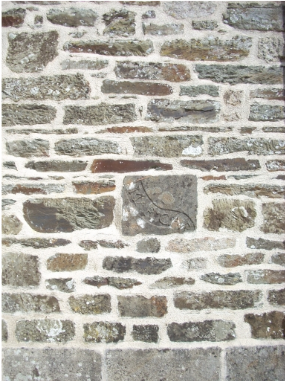
Landeleau, église paroissiale Saint-Théleau : détail du gros oeuvre