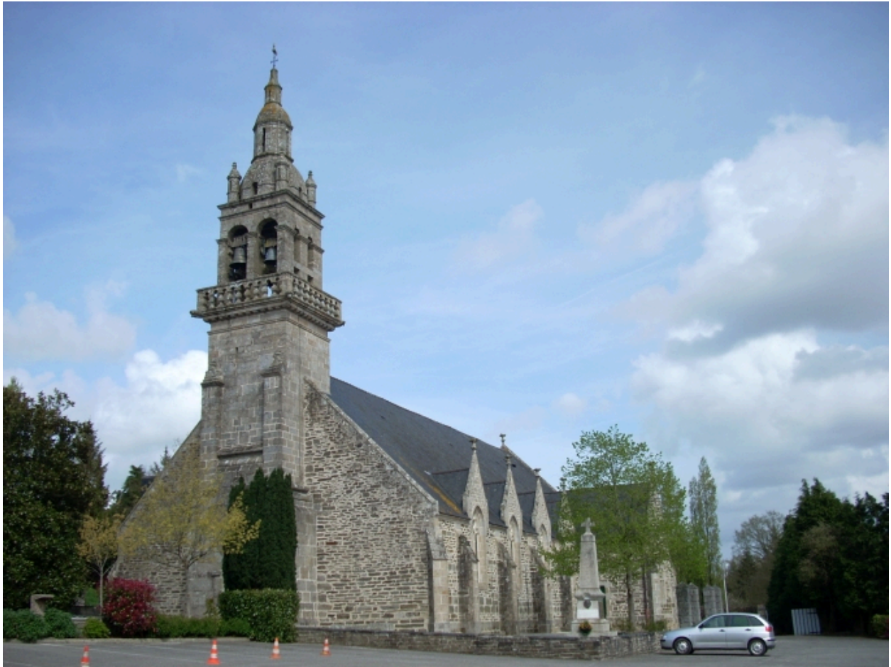
Landeleau, église paroissiale Saint-Théleau : vue générale sud-ouest