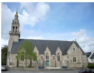
Landeleau, église paroissiale Saint-Théleau : élévation sud IVR53_20082905560NUCA