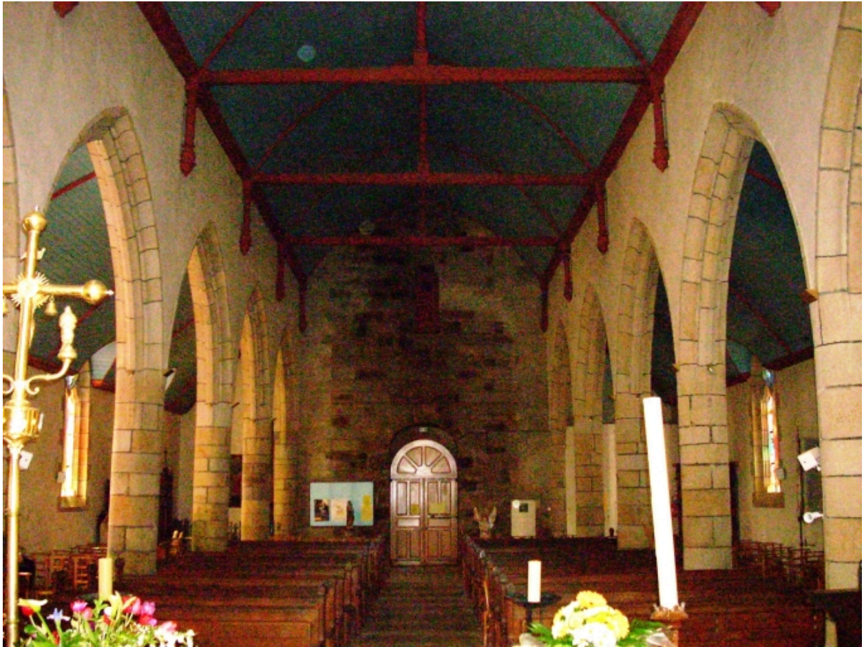
Landeleau, église paroissiale Saint-Théleau : vue axiale ouest