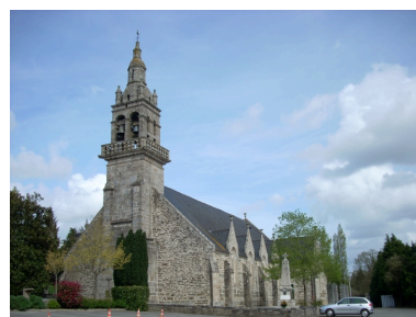
Landeleau, église paroissiale Saint-Théleau : vue générale sud-ouest IVR53_20082905558NUCA