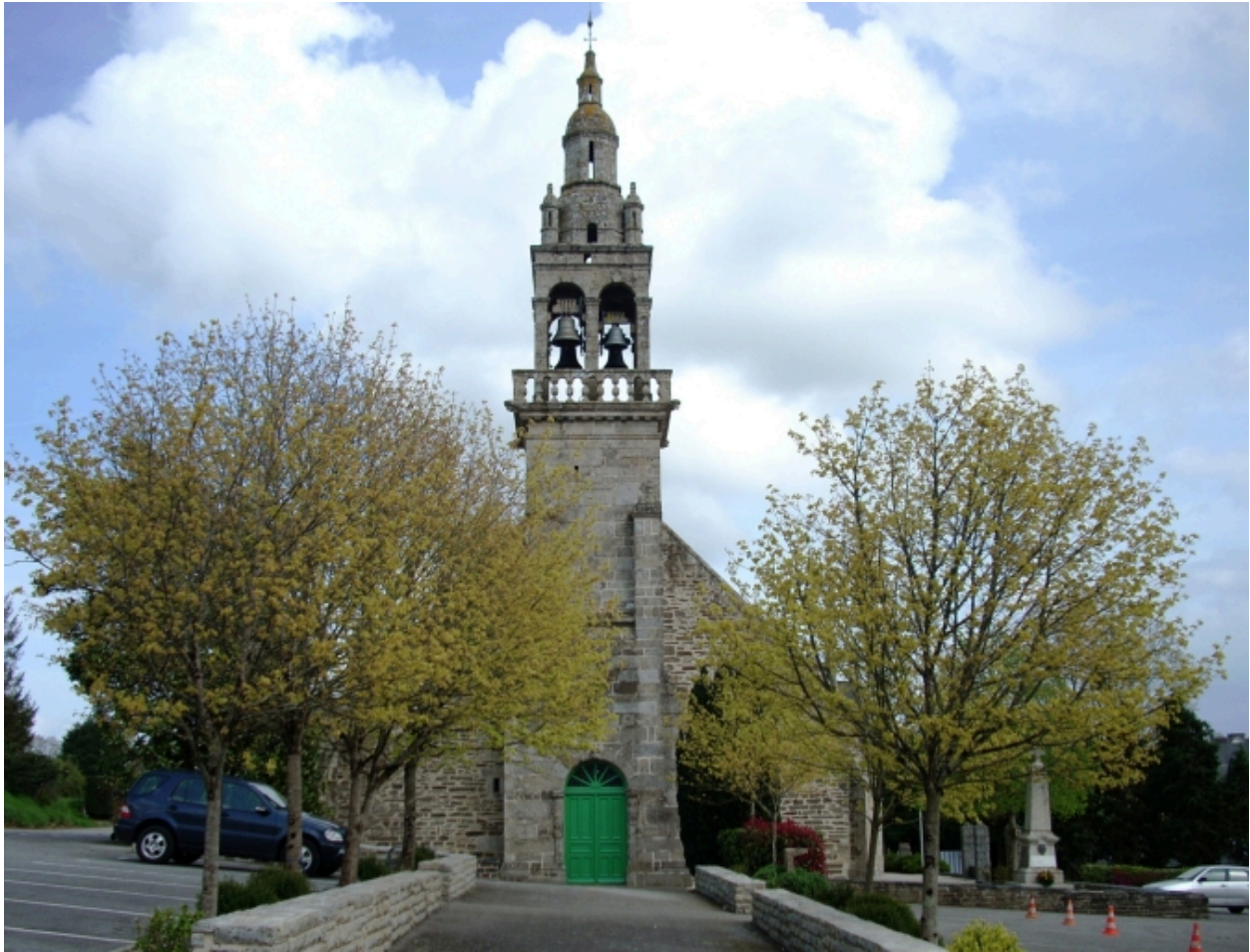
Landeleau, église paroissiale Saint-Théleau : élévation ouest