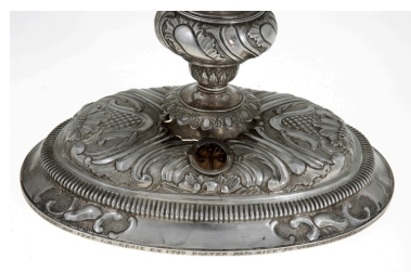
Croix-reliquaire : détail du pied IVR53_20045600188NUCA