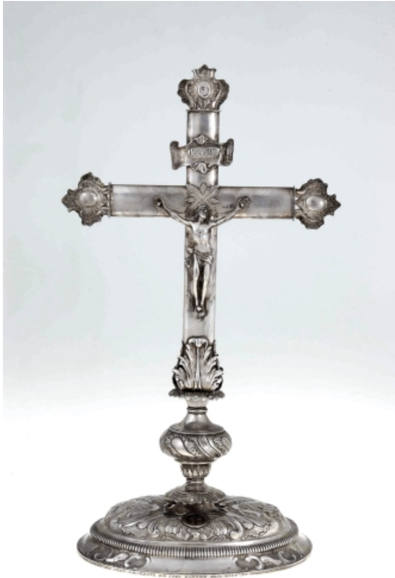
Croix-reliquaire : vue générale de face