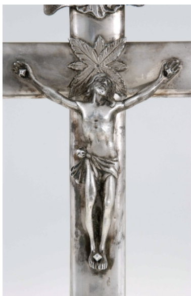
Croix-reliquaire : détail du Christ IVR53_20045600190NUCA