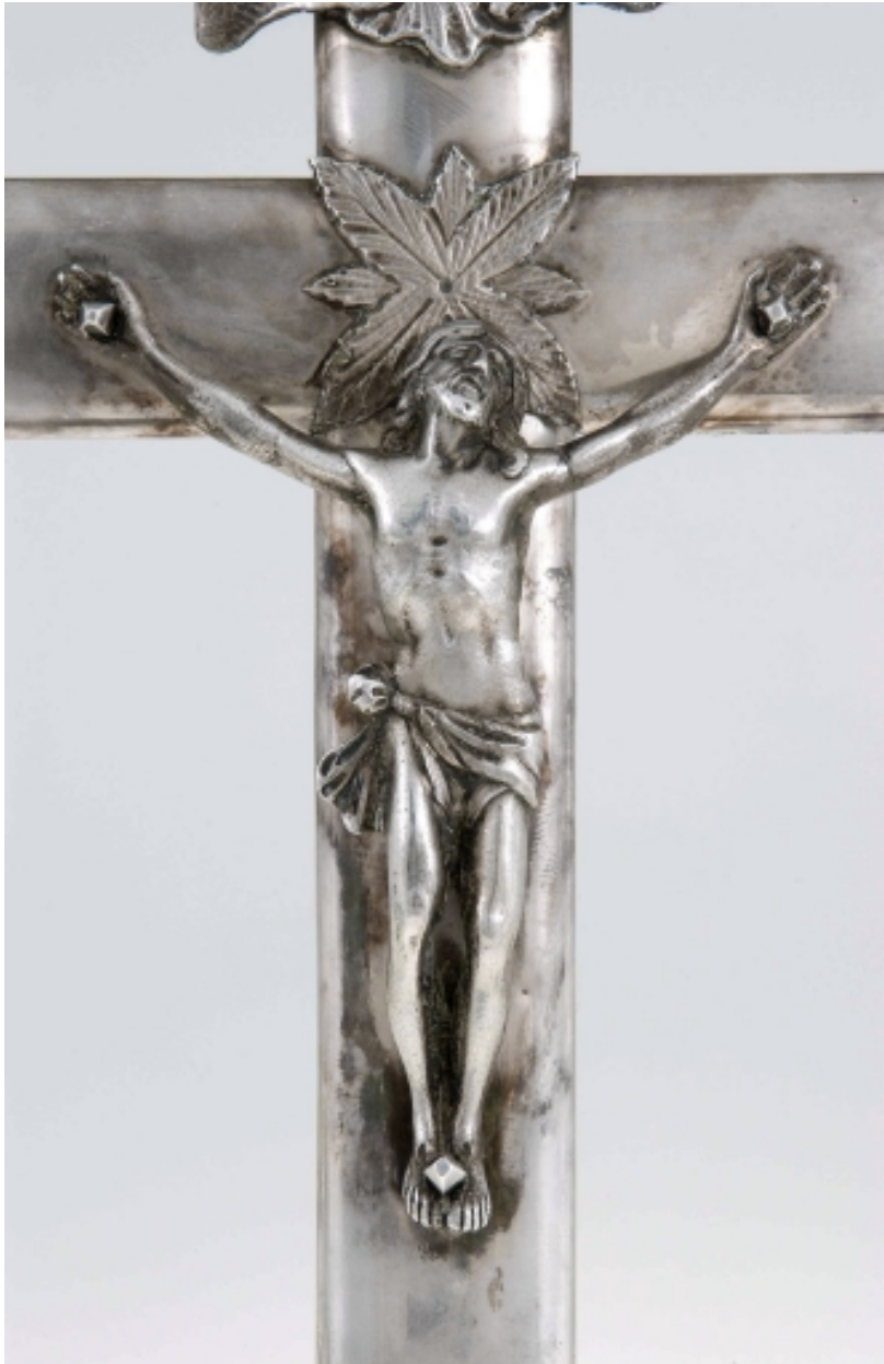
Croix-reliquaire : détail du Christ