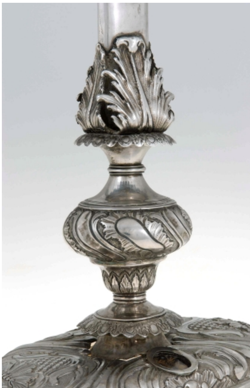
Croix-reliquaire : détail du noeud