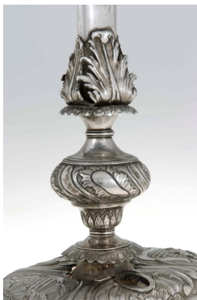
Croix-reliquaire : détail du noeud