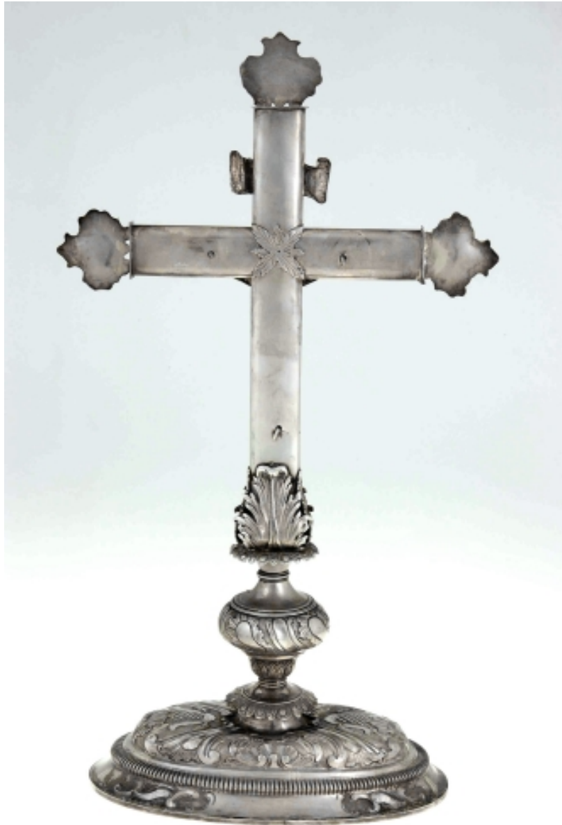
Croix-reliquaire : vue générale de dos