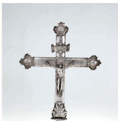
Croix-reliquaire : vue générale de face