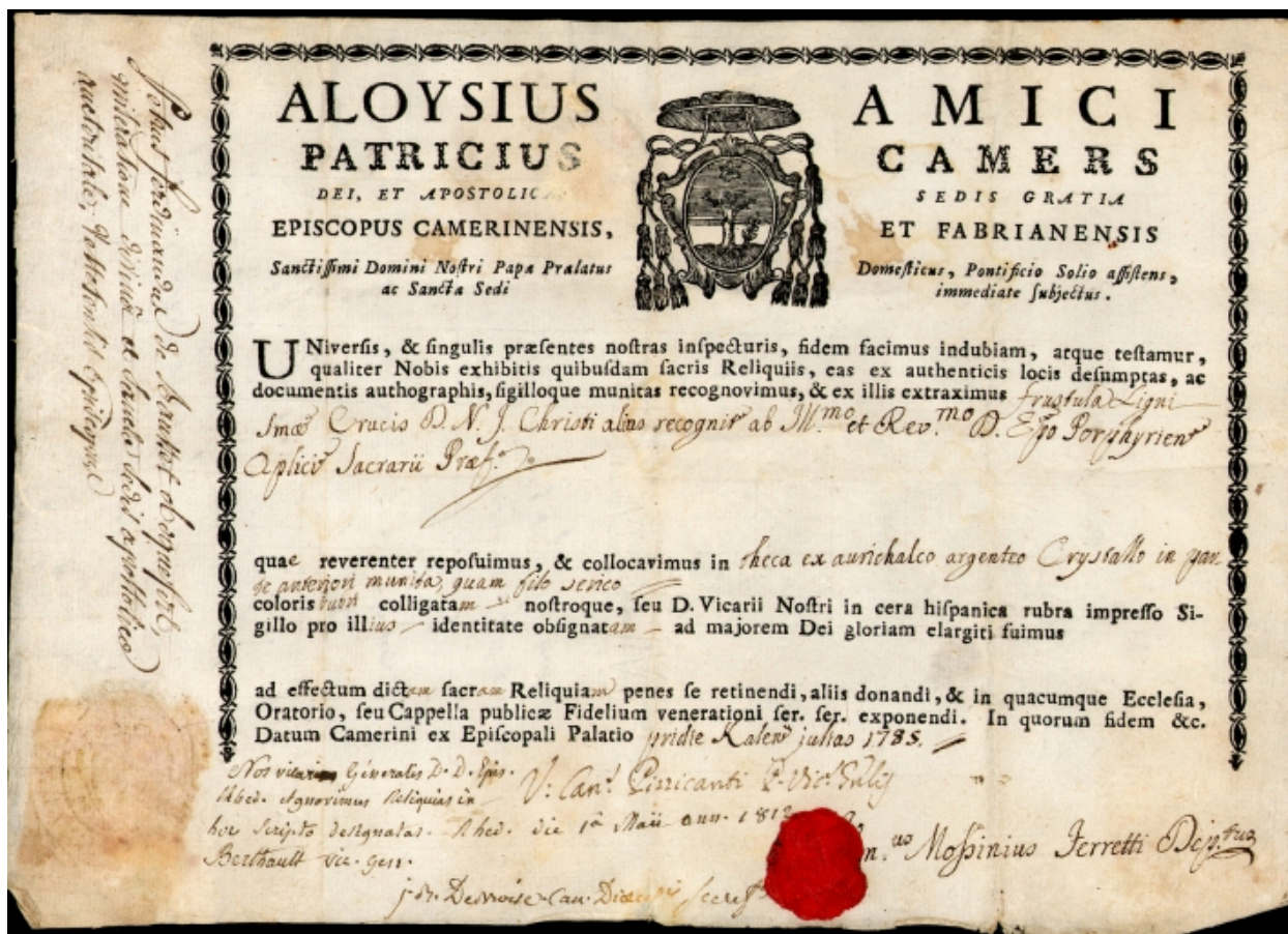
Croix-reliquaire : authentique des reliques