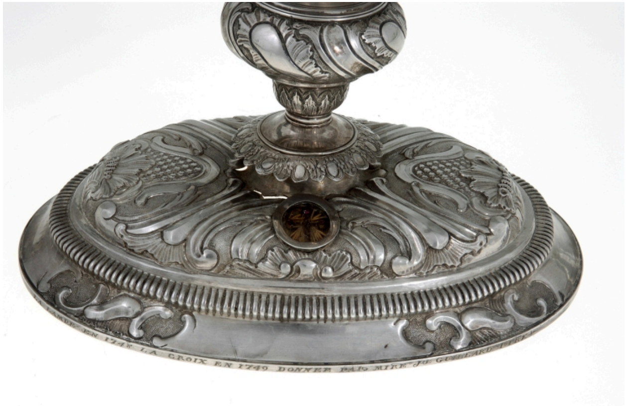
Croix-reliquaire : détail du pied