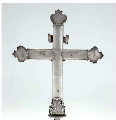
Croix-reliquaire : vue générale de dos IVR53_20045600187NUCA