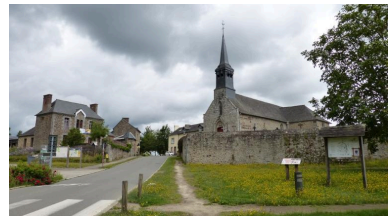
Vue générale sud de Bazouges- sous-Hédé (Hédé-Bazouges)