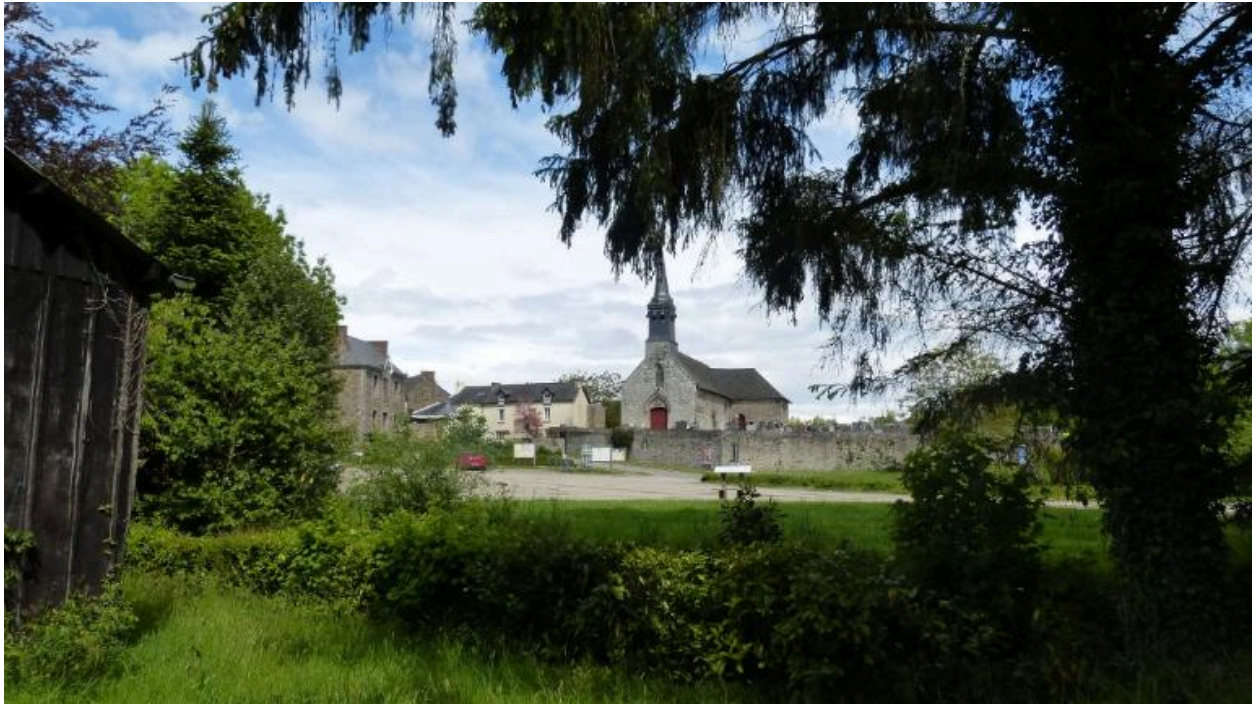
Vue d'ensemble de Bazouges-sous Hédé (Hédé-Bazouges)