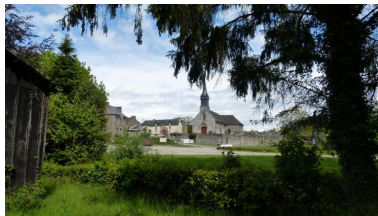
Vue d'ensemble de Bazouges- sous Hédé (Hédé-Bazouges) IVR53_20253510305NUCA