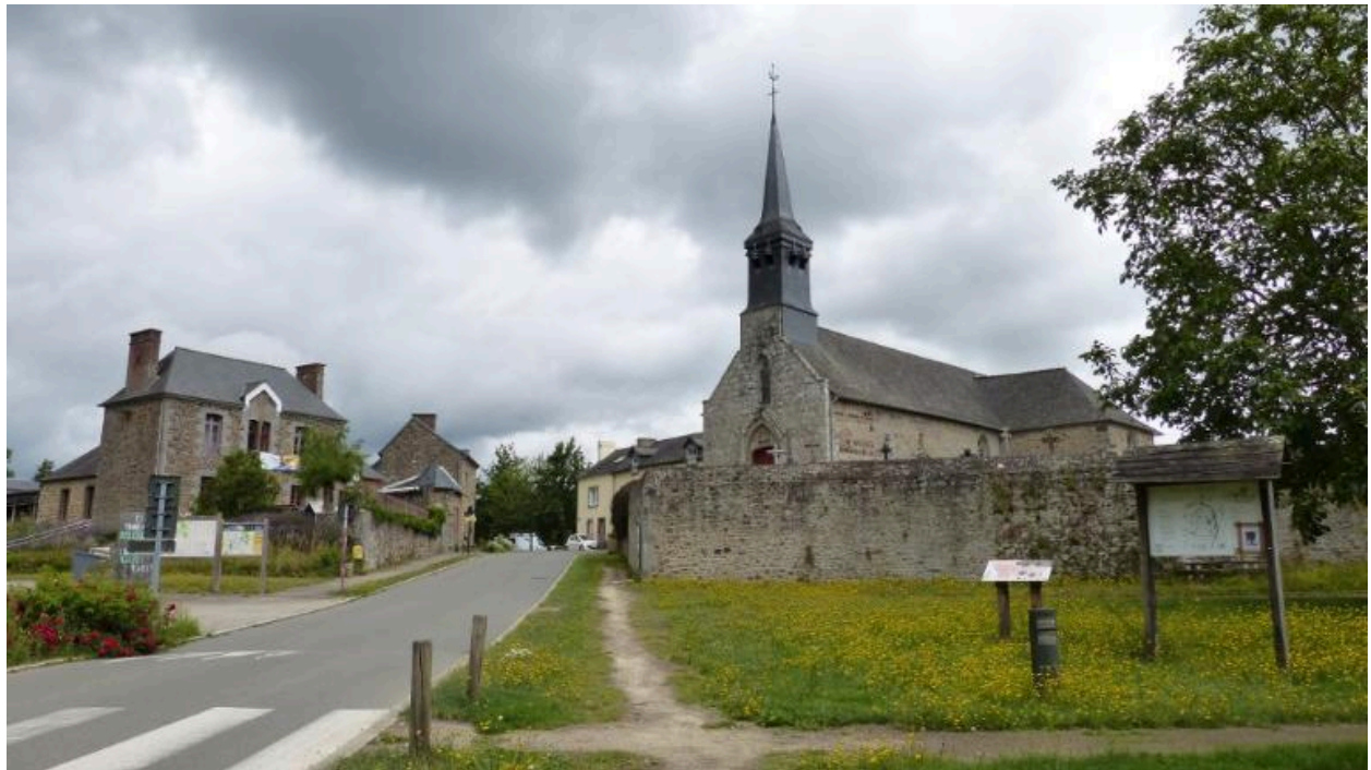
Vue générale sud de Bazouges-sous-Hédé (Hédé-Bazouges)