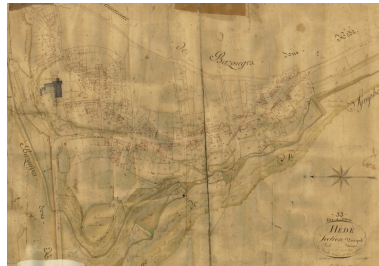
La ville sur le cadastre de 1835