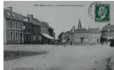
Place de la Mairie IVR53_20053519244NUCA