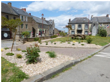
Vue générale, place de la mairie (Hédé-Bazouges)