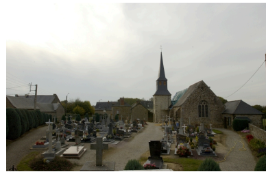
Le village de Saint-Symphorien