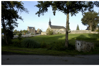
Le village de Bazouges-sous-Hédé IVR53_20053502897NUCA