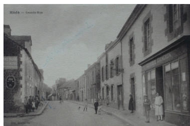
La Grande Rue