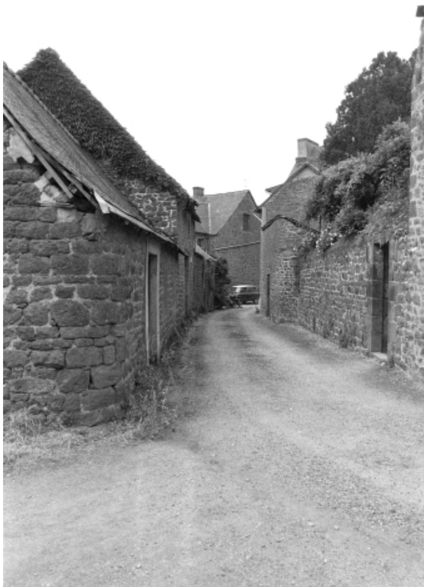
Ruelle de la Fonderie