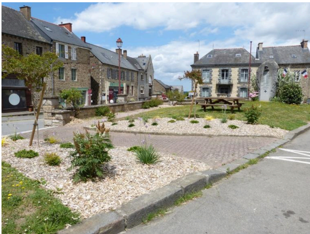
Vue générale, place de la mairie (Hédé-Bazouges)