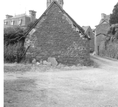
La ruelle de la Fonderie en 1975 IVR53_19753501075Z