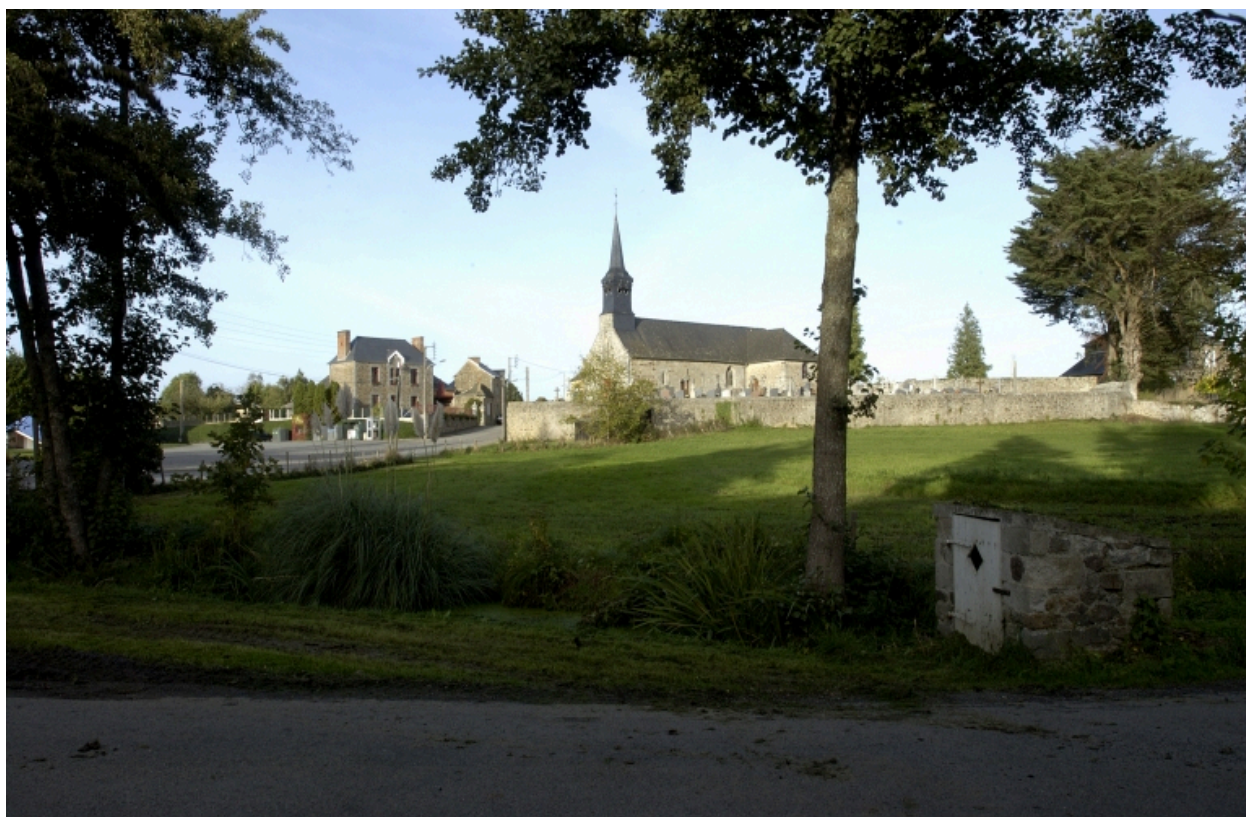
Le village de Bazouges-sous-Hédé