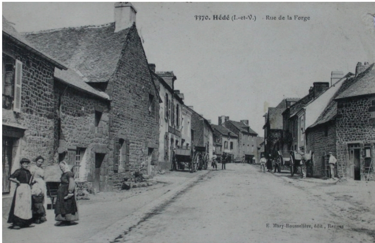
La rue des Forges