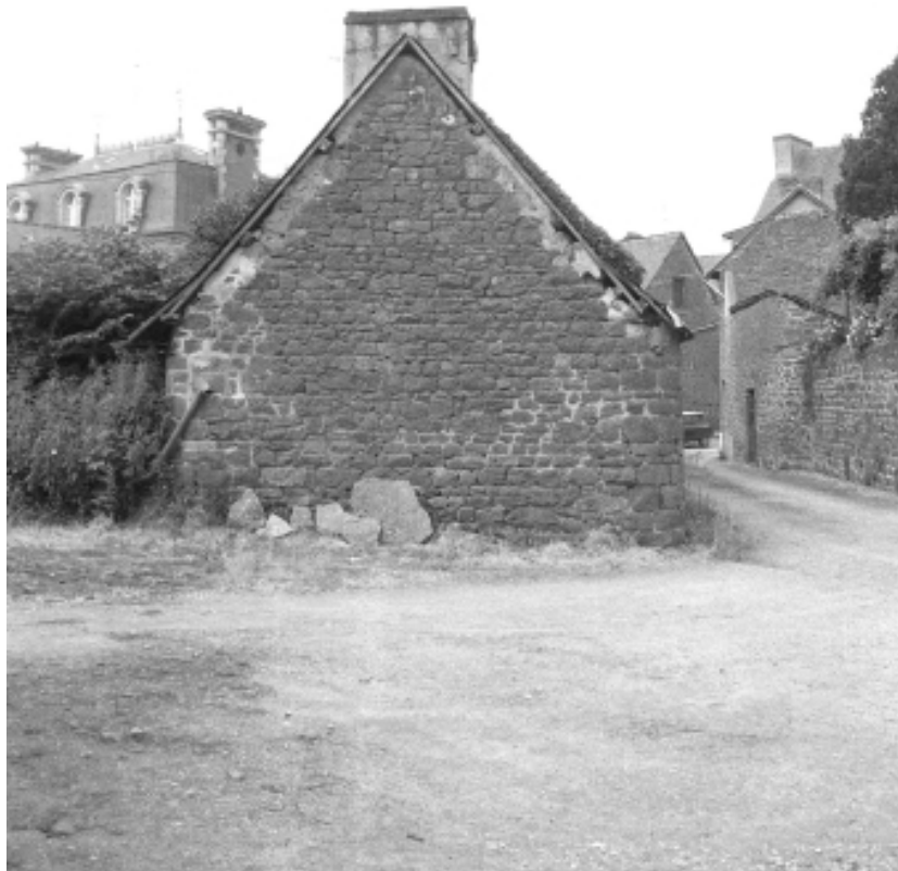
La ruelle de la Fonderie en 1975