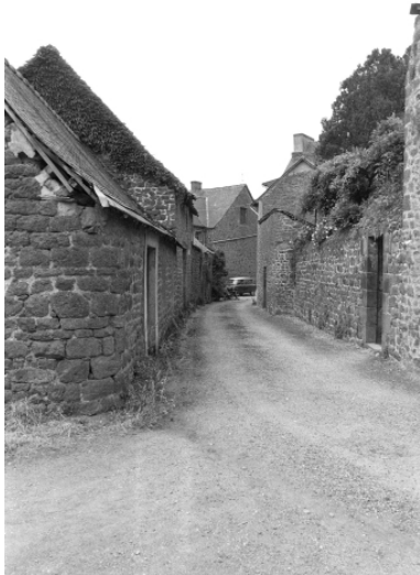
Ruelle de la Fonderie IVR53_19753501076Z