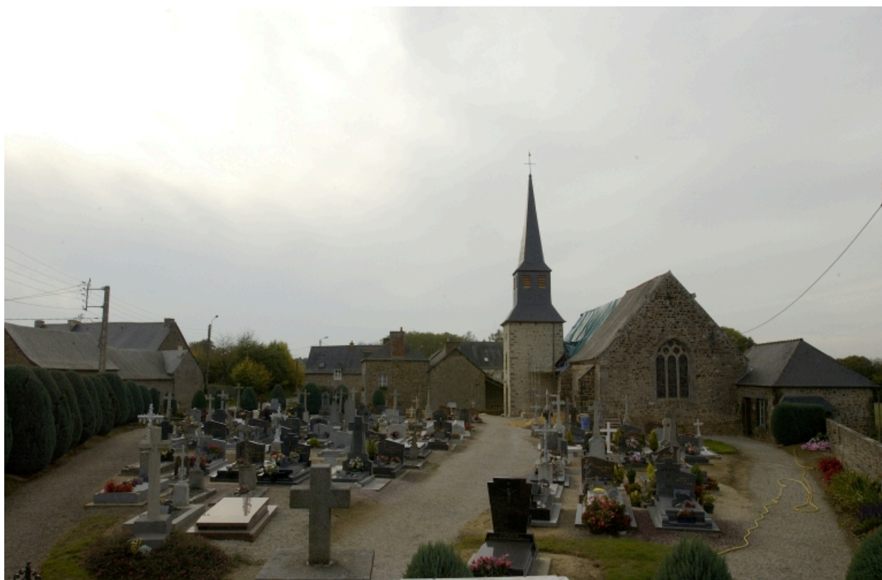
Le village de Saint-Symphorien