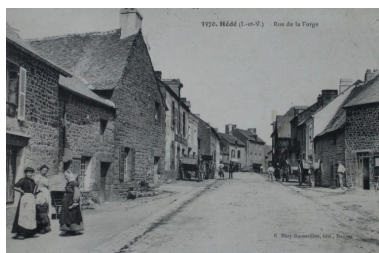
La rue des Forges