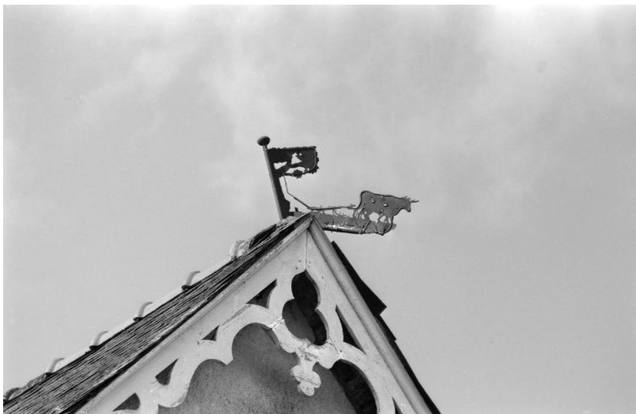
Monvoisin – girouette des communs