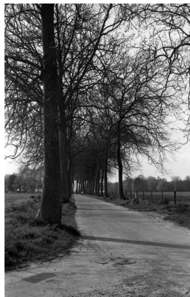
Monvoisin site - Voie bordée d'arbres (I.N.R.A)