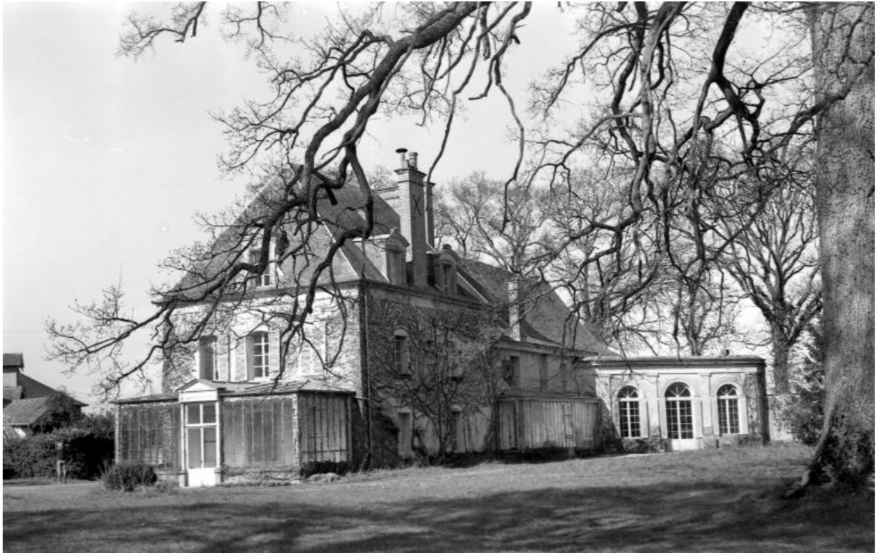
Monvoisin – vue générale latérale prise du fond du parc