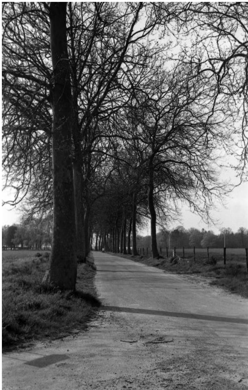
Monvoisin site - Voie bordée d'arbres (I.N.R.A)