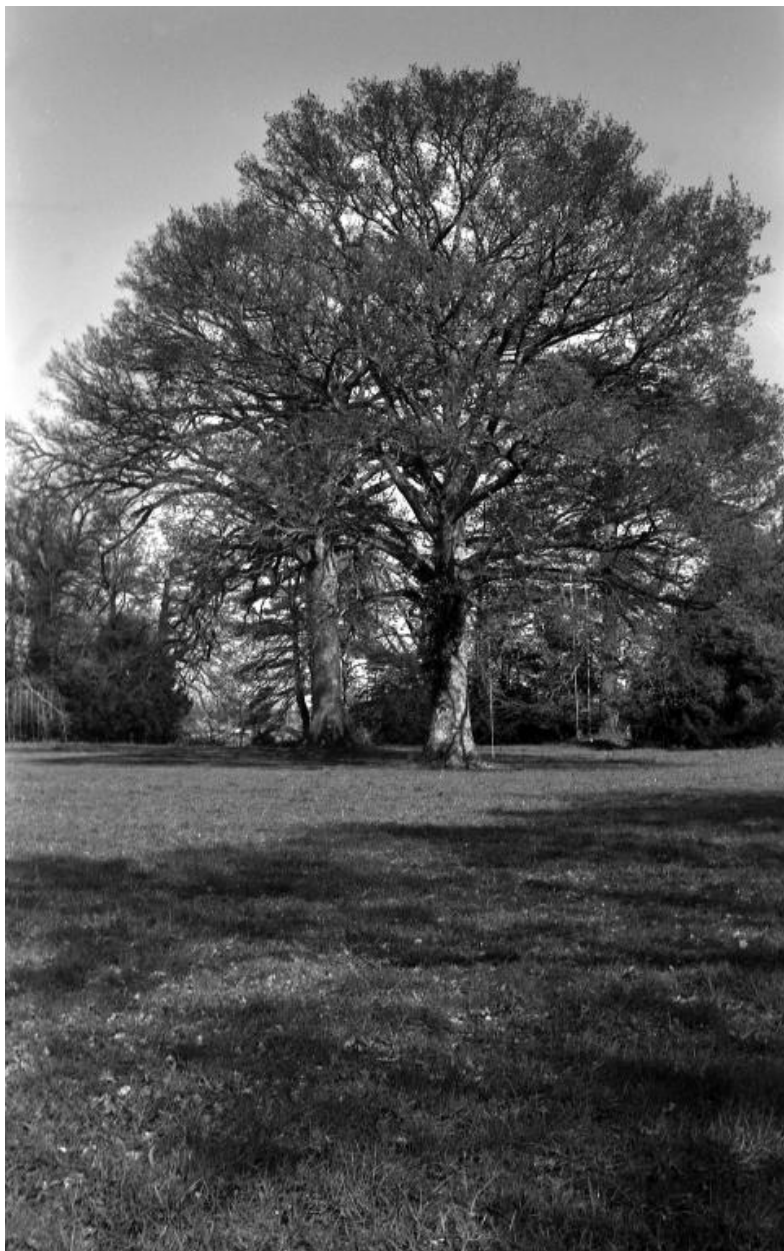
Monvoisin – site, chêne du parc