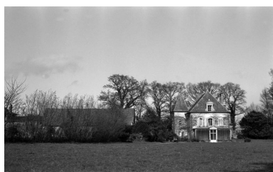
Monvoisin – site, arbres du parc, IVR53_19753506068Z