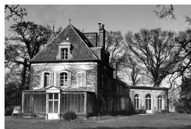
Vue générale IVR53_19753501230Z