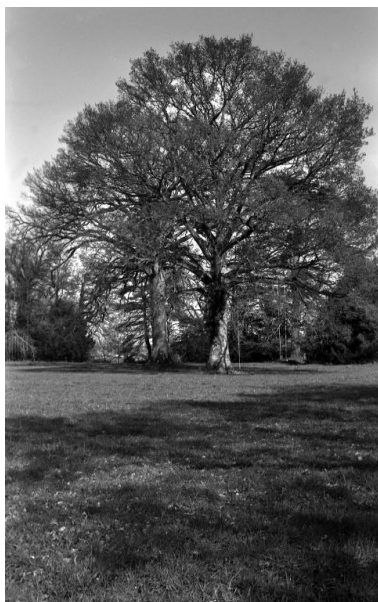
Monvoisin – site, chêne du parc, IVR53_19753506069Z