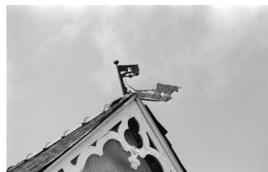
Monvoisin – girouette des communs IVR53_19753506071Z