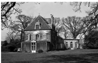
Monvoisin – Vue générale latérale prise du fond du parc