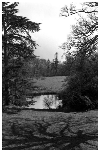
Monvoisin – château, pièce d'eau, IVR53_19753506065Z