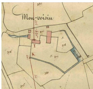
Le Manoir de Monvoisin sur le cadastre de 1829 IVR53_20173505222NUCA