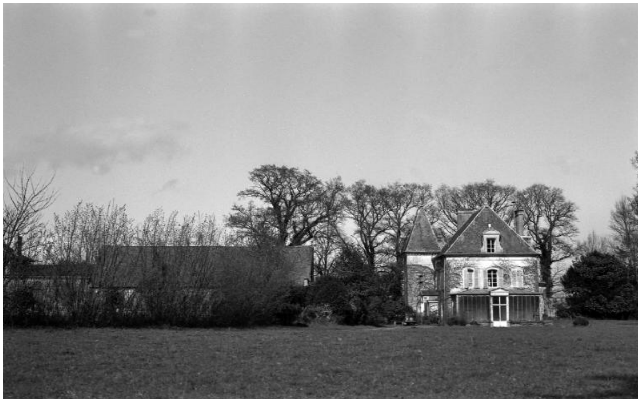
Monvoisin – site, arbres du parc