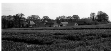
Monvoisin - Vue de situation IVR53_19753506212Z