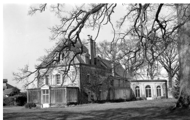
Monvoisin – vue générale latérale prise du fond du parc IVR53_19753506067Z