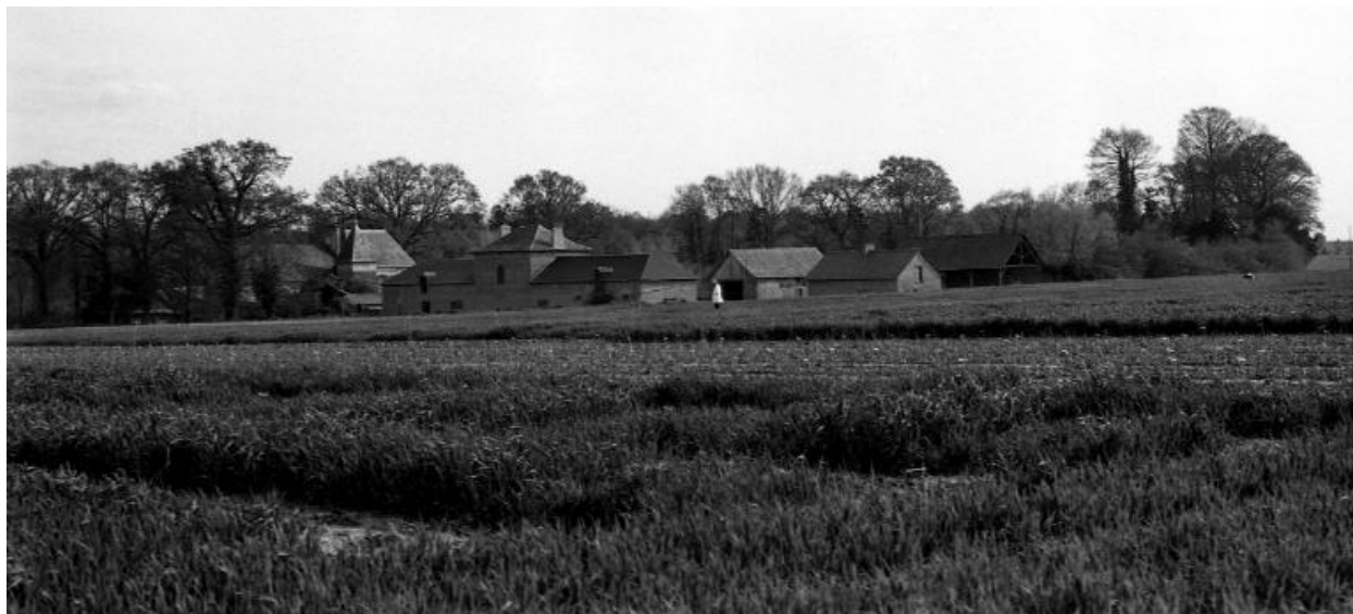
Monvoisin - Vue de situation