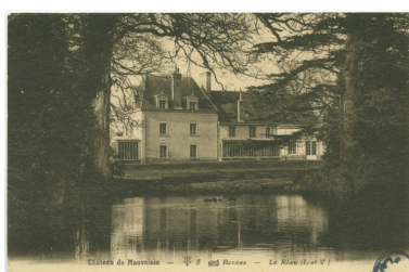
Château de Monvoisin IVR53_20173505231NUCB