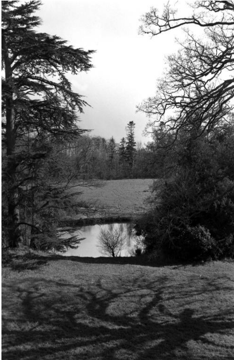
Monvoisin – château, pièce d'eau