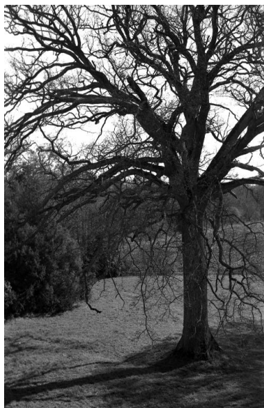
Monvoisin – arbres du parc IVR53_19753506066Z