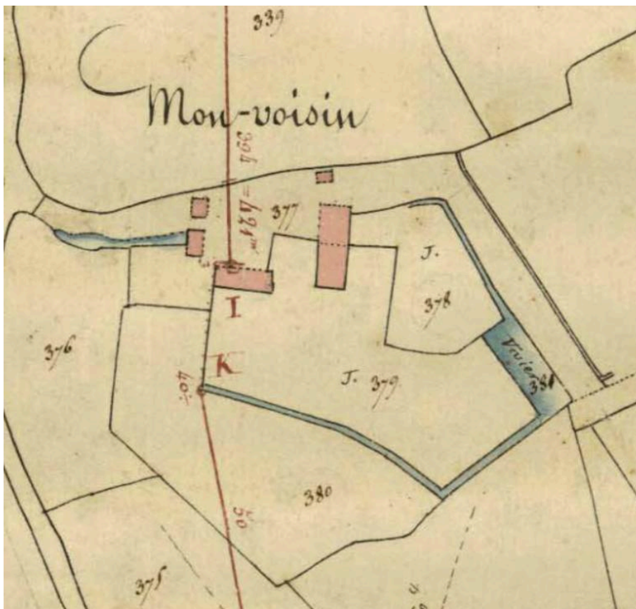
Le Manoir de Monvoisin sur le cadastre de 1829