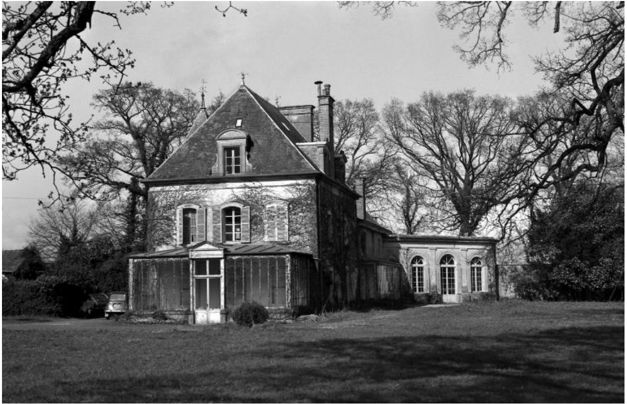
Monvoisin – Vue générale latérale prise du fond du parc