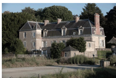
Vue générale sur la Rance IVR53_20162200809NUCA