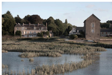
Vue de situation IVR53_20162200810NUCA