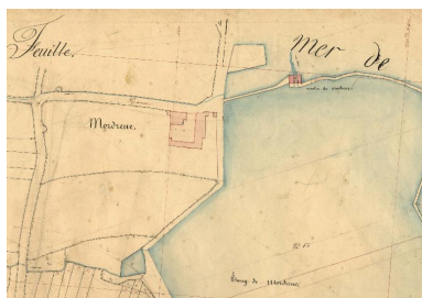
Extrait du cadastre de 1844