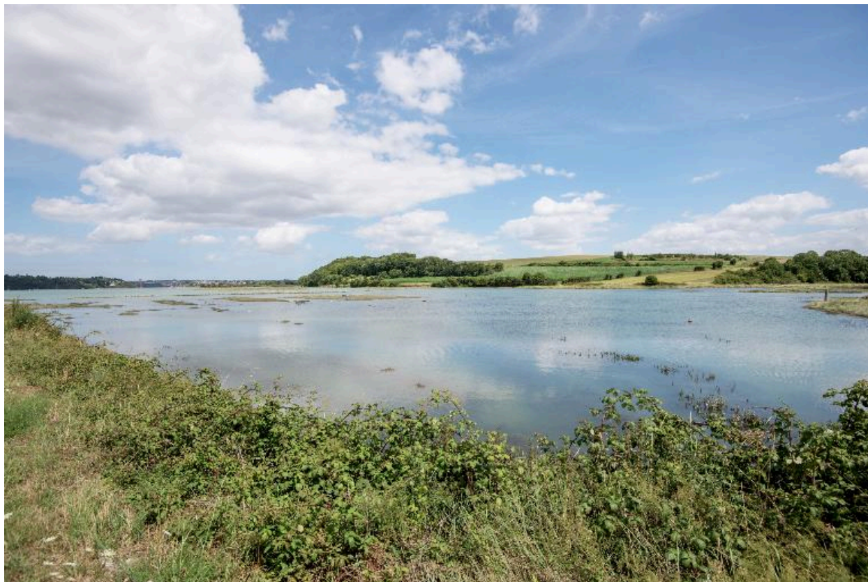
La plaine de Mordreuc