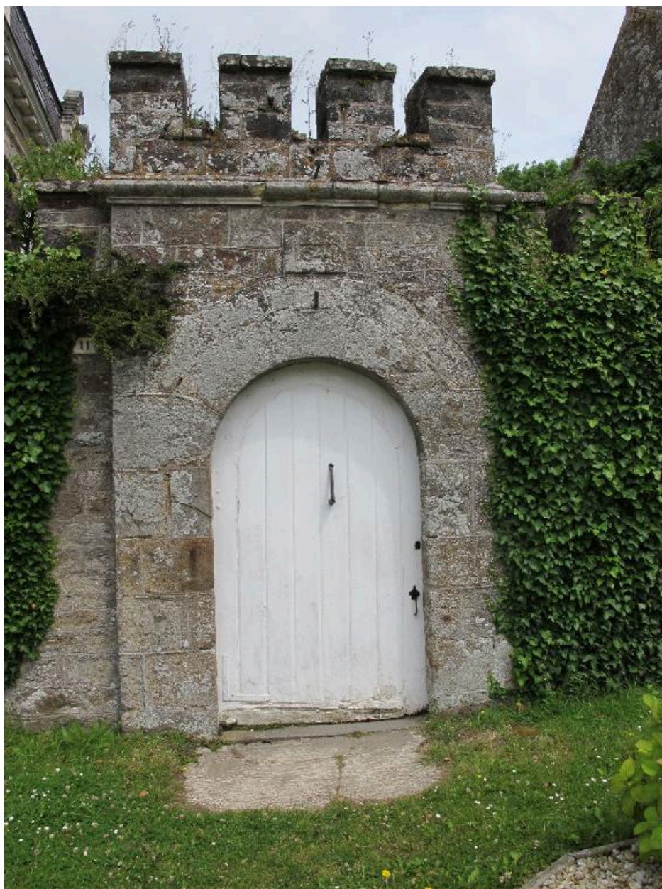
Le portail, avec la date portée de 1641