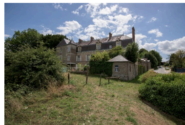
Vue sur la Rance, façade arrière, avec pavillon d'angle, mur avec ahah.