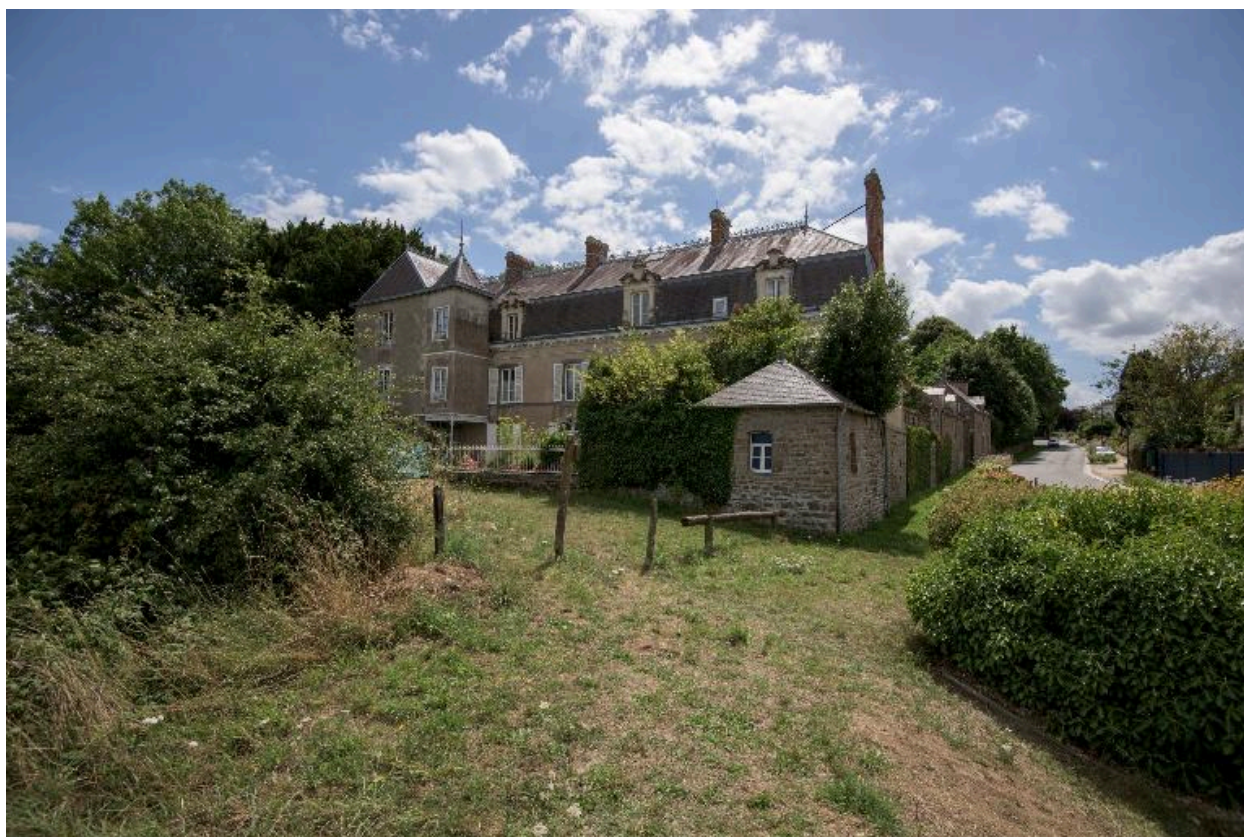
Vue sur la Rance, façade arrière, avec pavillon d'angle, mur avec ahah.