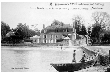
Vue générale : côté Rance, carte postale ancienne