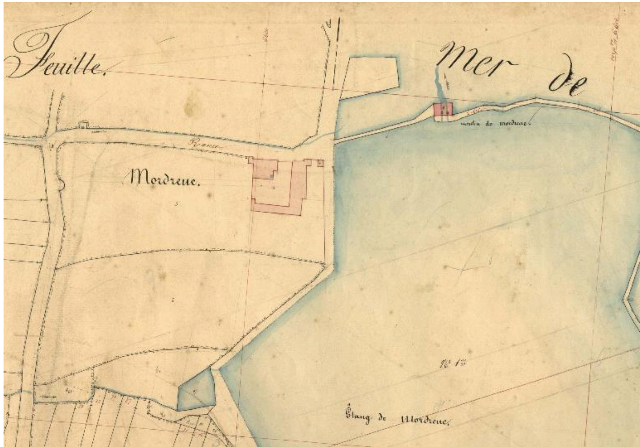
Extrait du cadastre de 1844