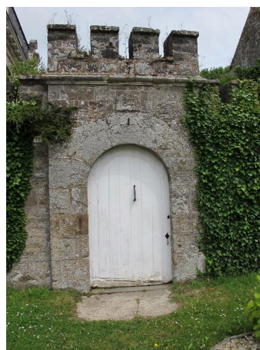
Le portail, avec la date portée de 1641