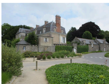
Vue prise de trois quart, logis, enclos, portail, cellier IVR53_20162206941NUCA