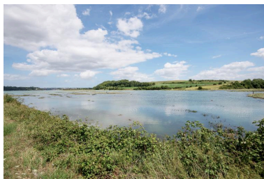
La plaine de Mordreuc IVR53_20152200786NUCA