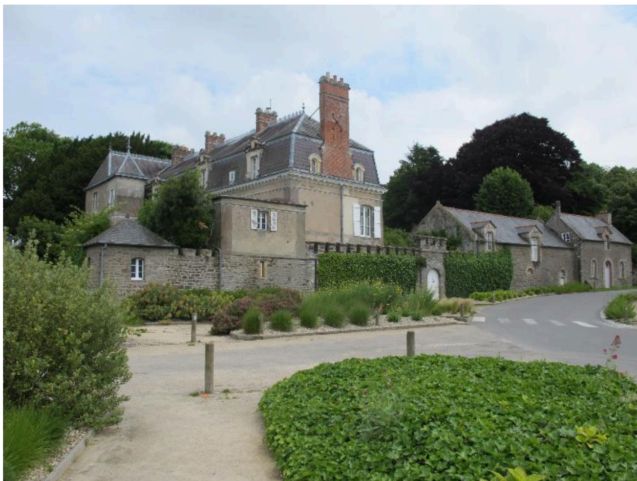
Vue prise de trois quart, logis, enclos, portail, cellier