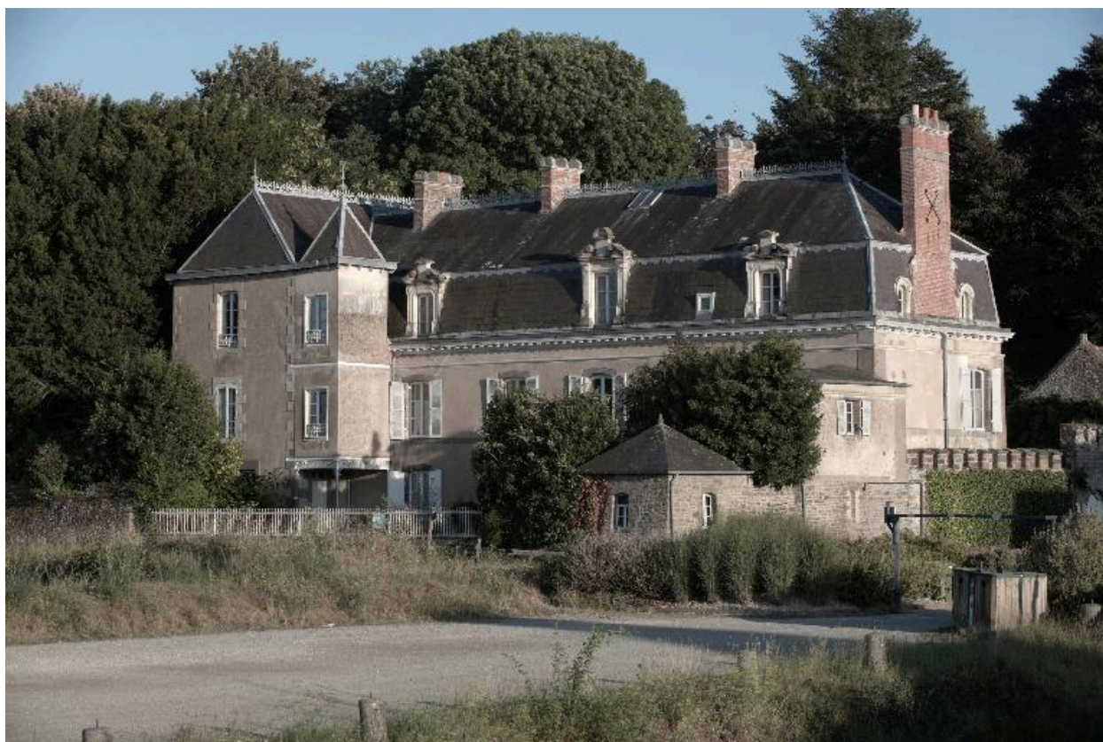
Vue générale sur la Rance