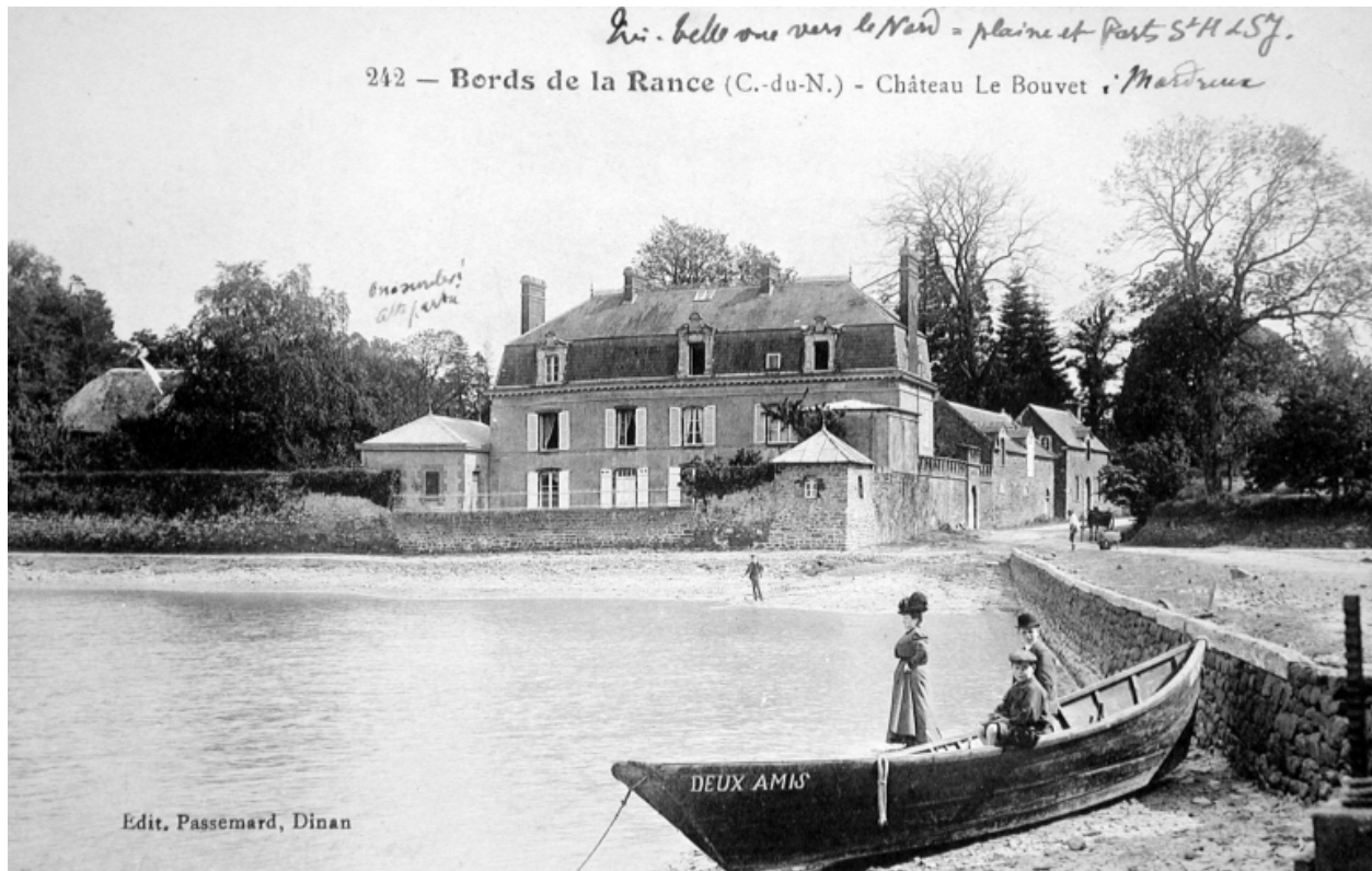
Vue générale : côté Rance, carte postale ancienne