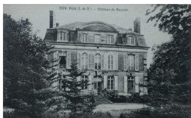
Le château sur une carte postale ancienne IVR53_20053519250NUCA