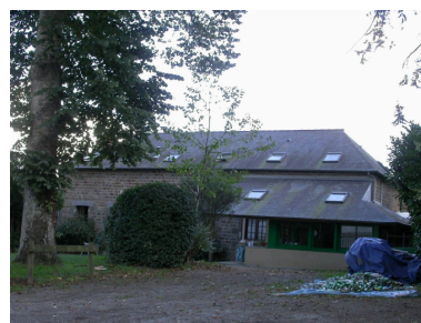
Bâtiment de la ferme du château IVR53_20053519077NUCA