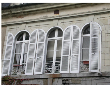
Détail des baies de l'étage de la façade sud IVR53_20053519076NUCA