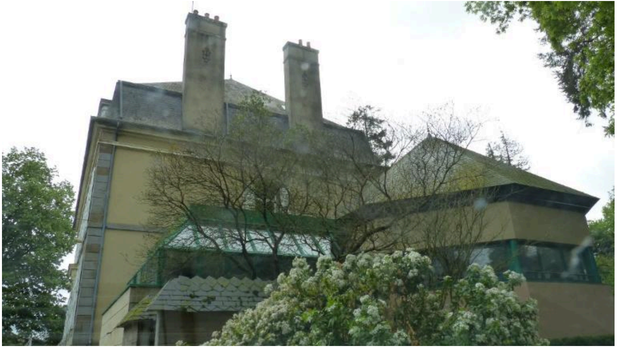
Vue générale ouest, Beauvoir (Hédé-Bazouges)