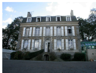
Vue nord