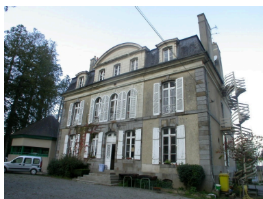
Vue sud-est IVR53_20053519075NUCA