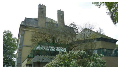
Vue générale ouest, Beauvoir (Hédé-Bazouges) IVR53_20243531500NUCA