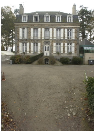
Vue générale nord IVR53_20053503176NUCA