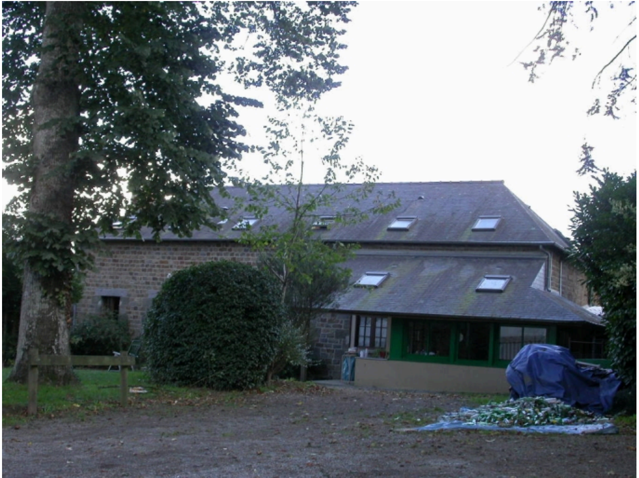
Bâtiment de la ferme du château