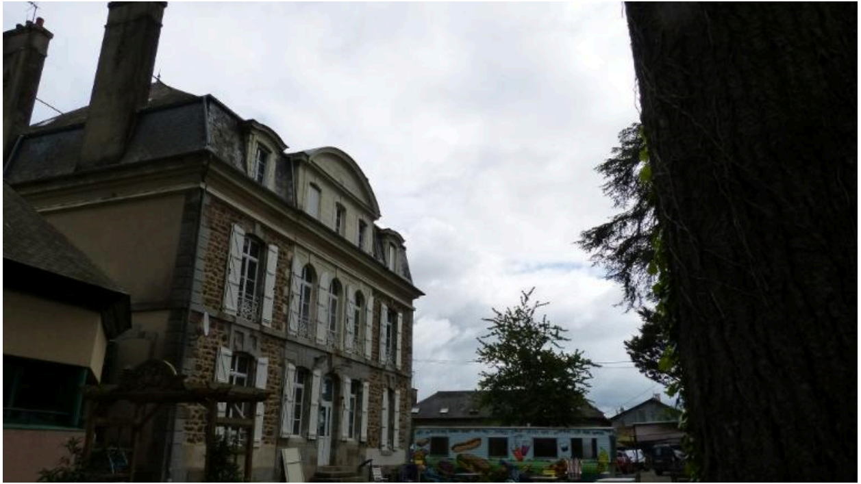
Vue générale nord, Beauvoir (Hédé-Bazouges)