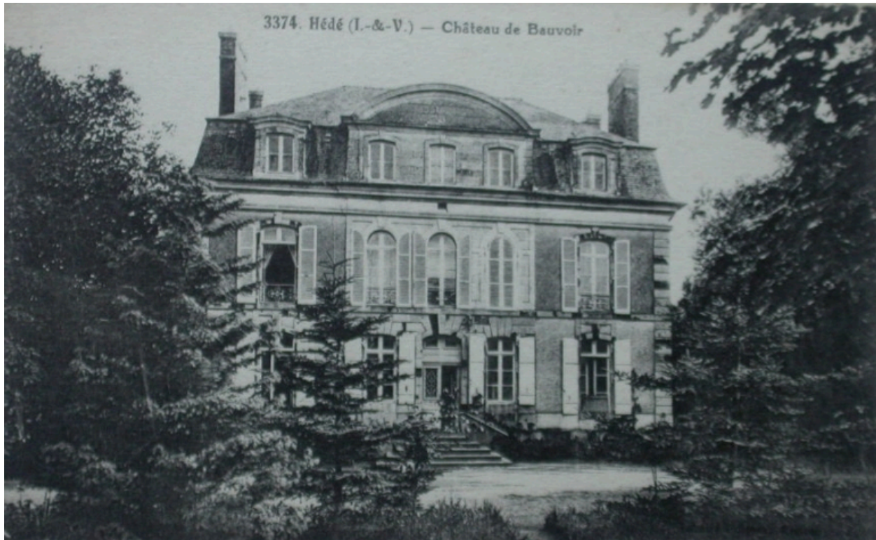
Le château sur une carte postale ancienne