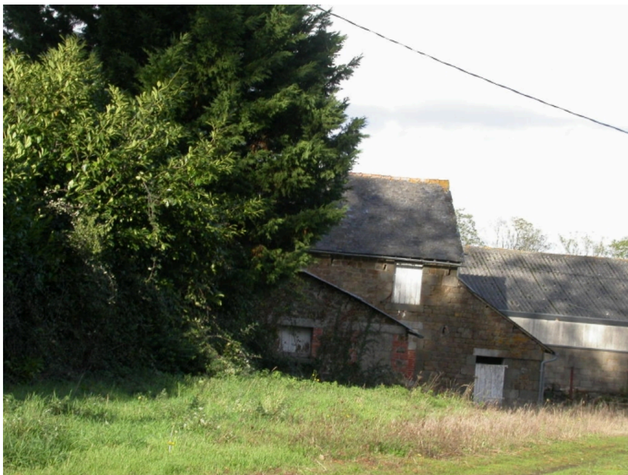
Ferme du château