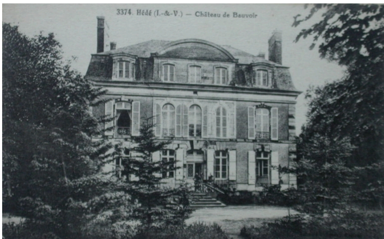
Le château sur une carte postale ancienne