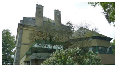
Vue générale ouest IVR53_20243531500NUCA