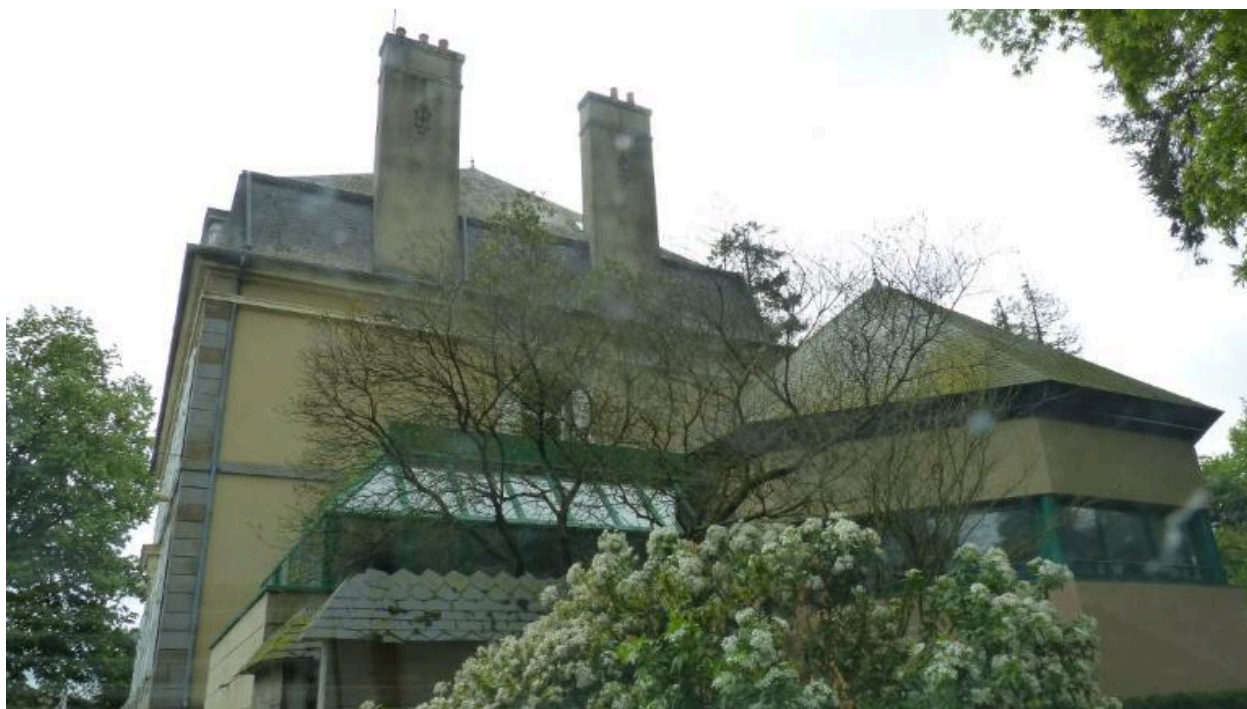
Vue générale ouest