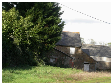
Ferme du château IVR53_20053519078NUCA