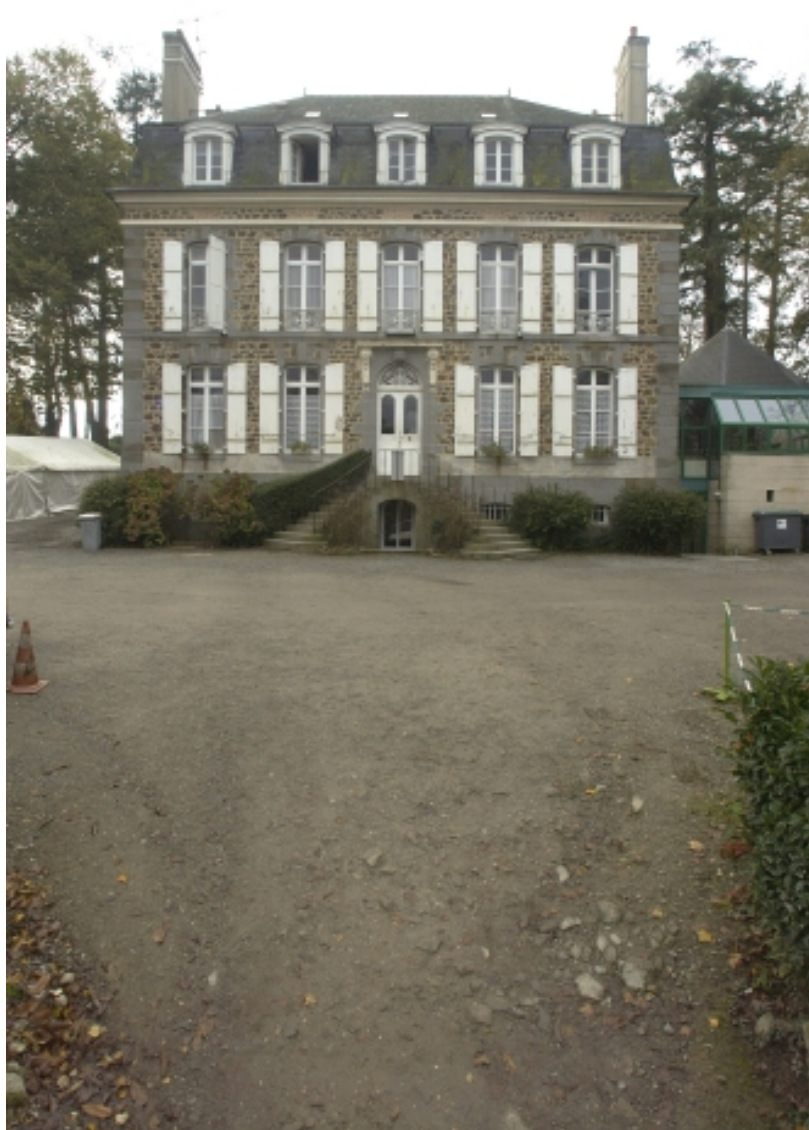
Vue générale nord