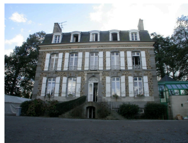
Vue nord IVR53_20053519074NUCA