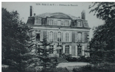
Le château sur une carte postale ancienne