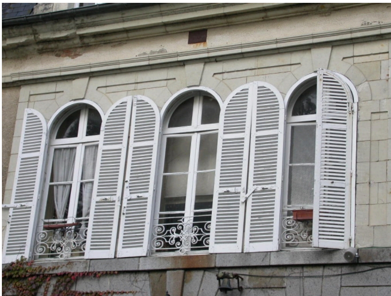
Détail des baies de l'étage de la façade sud