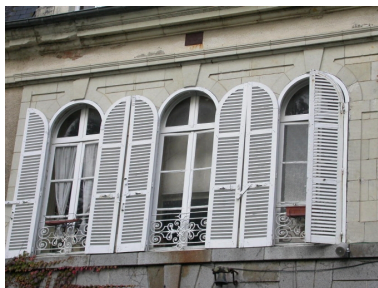
Détail des baies de l'étage de la façade sud