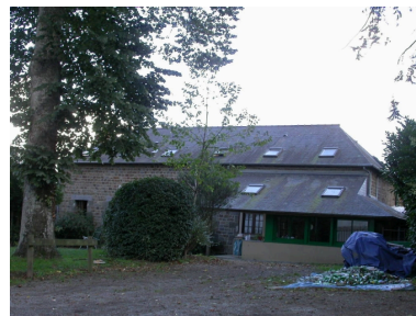
Bâtiment de la ferme du château IVR53_20053519077NUCA