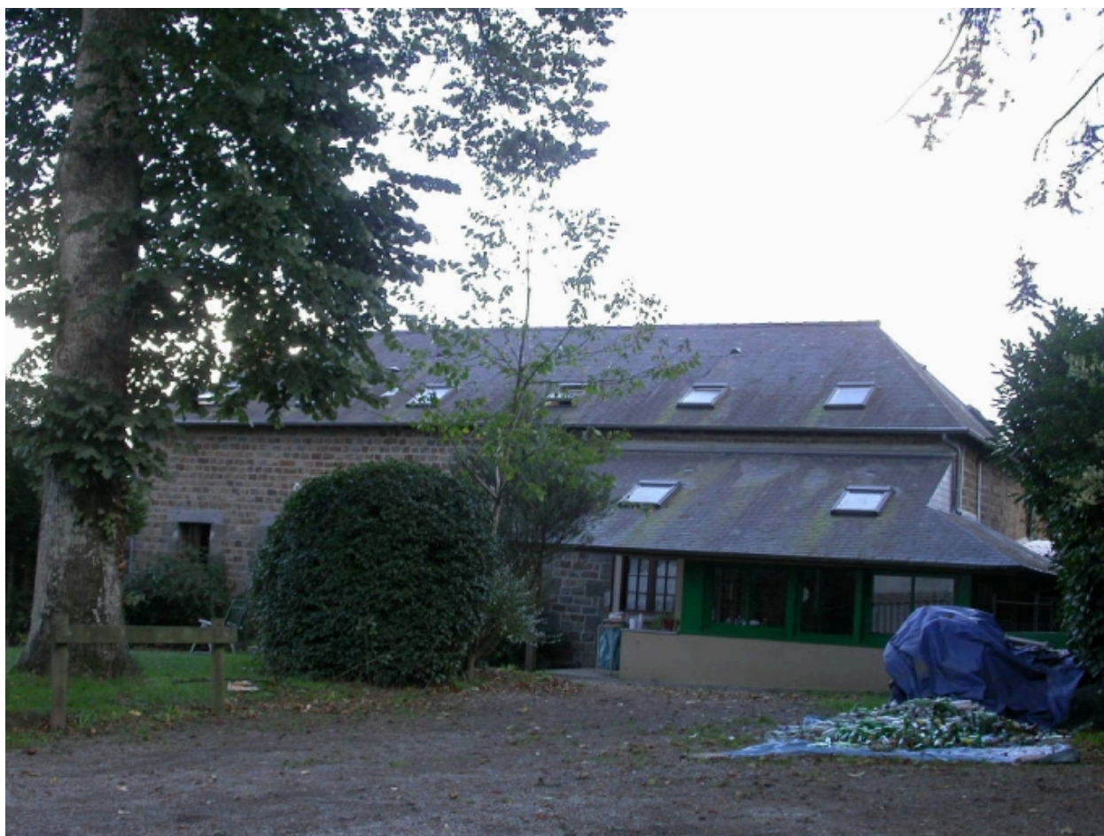
Bâtiment de la ferme du château