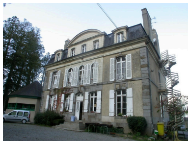
Vue sud-est IVR53_20053519075NUCA