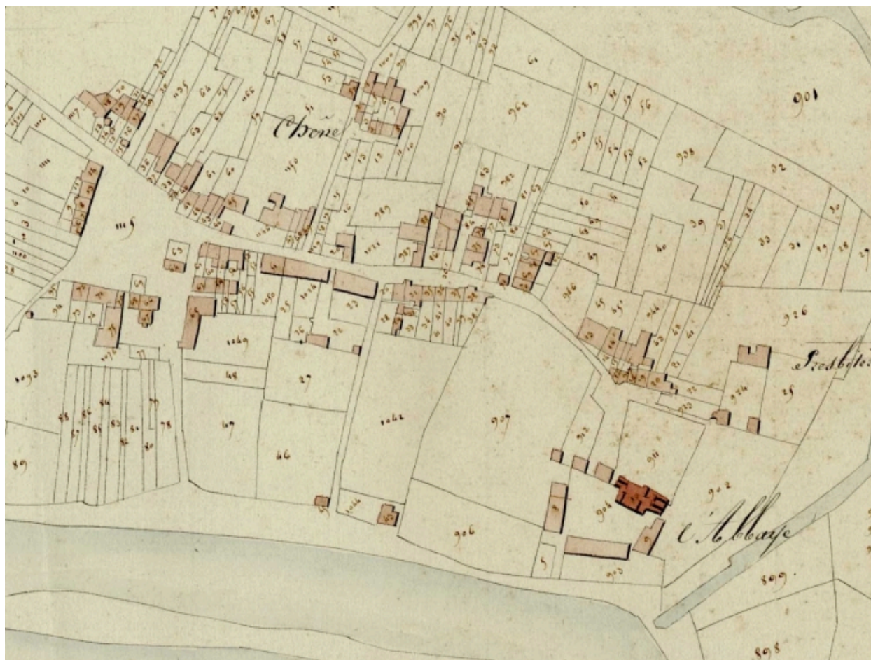
En sombre, l'église sur le cadastre de 1818