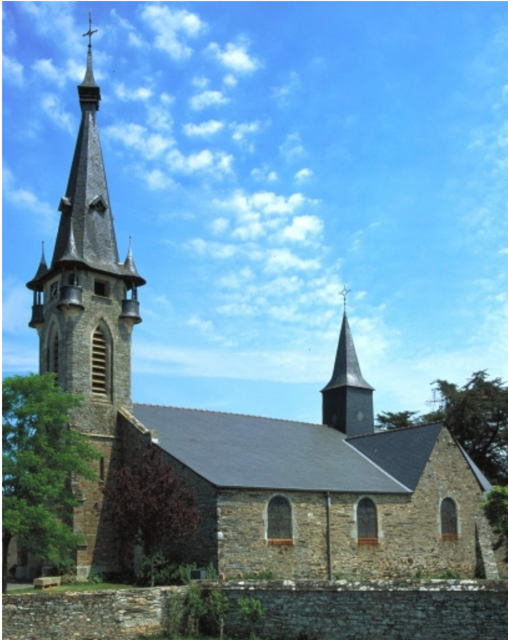
Vue générale sud ouest