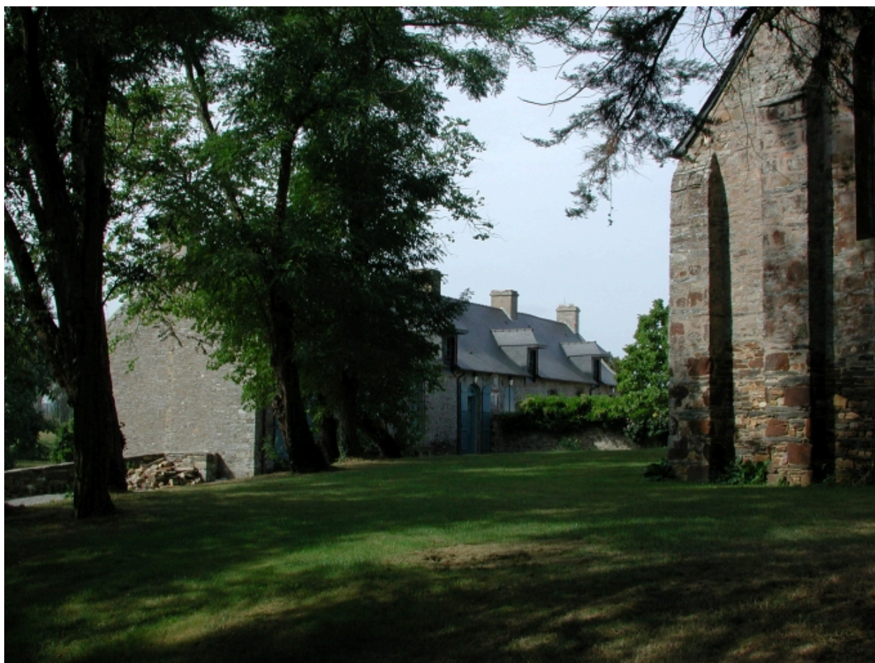
Vue partielle du chevet roman