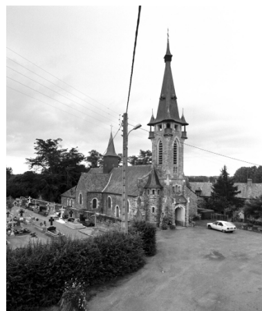
Vue générale nord-ouest IVR53_19943501737X