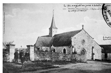
L'église et la cimetière au début du 20e siècle IVR53_19933500528X