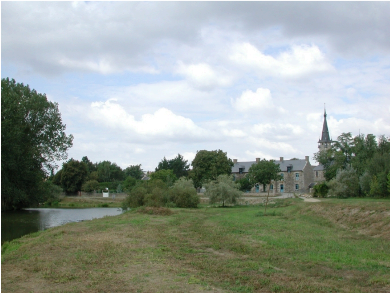
Vue de situation sud est