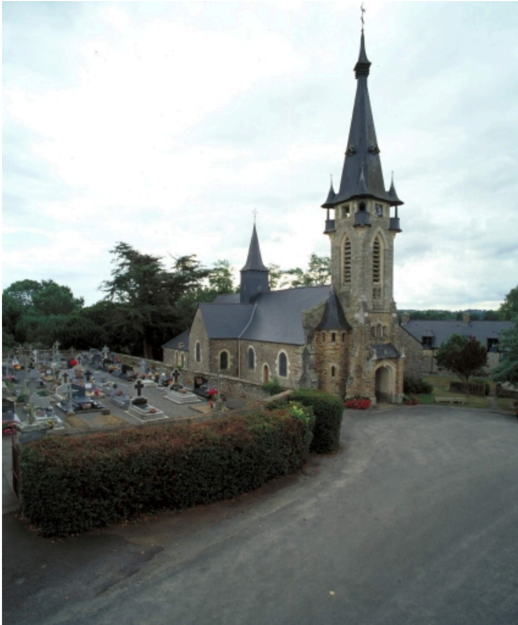
Vue générale nord ouest