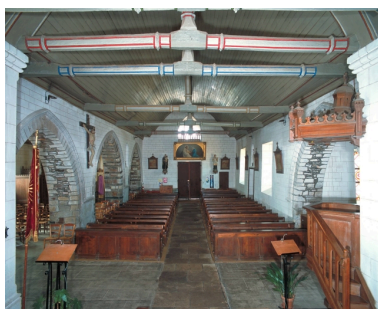
Vue intérieure prise du chœur vers la nef IVR53_20013501295XA