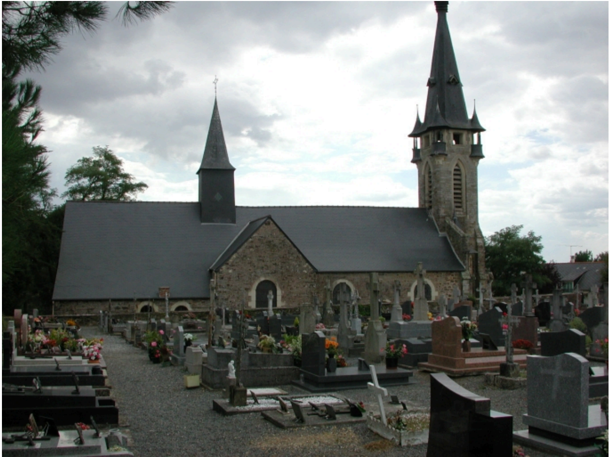
Vue générale nord