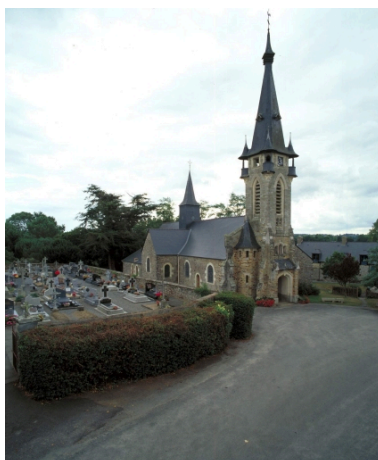
Vue générale nord-ouest IVR53_20013501915XA