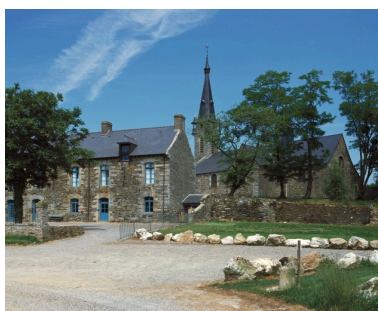
Vue de situation sud est IVR53_20013501834XA