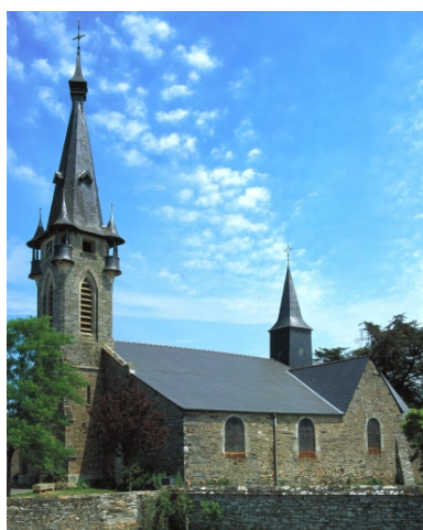
Vue générale sud ouest IVR53_20013501833XA