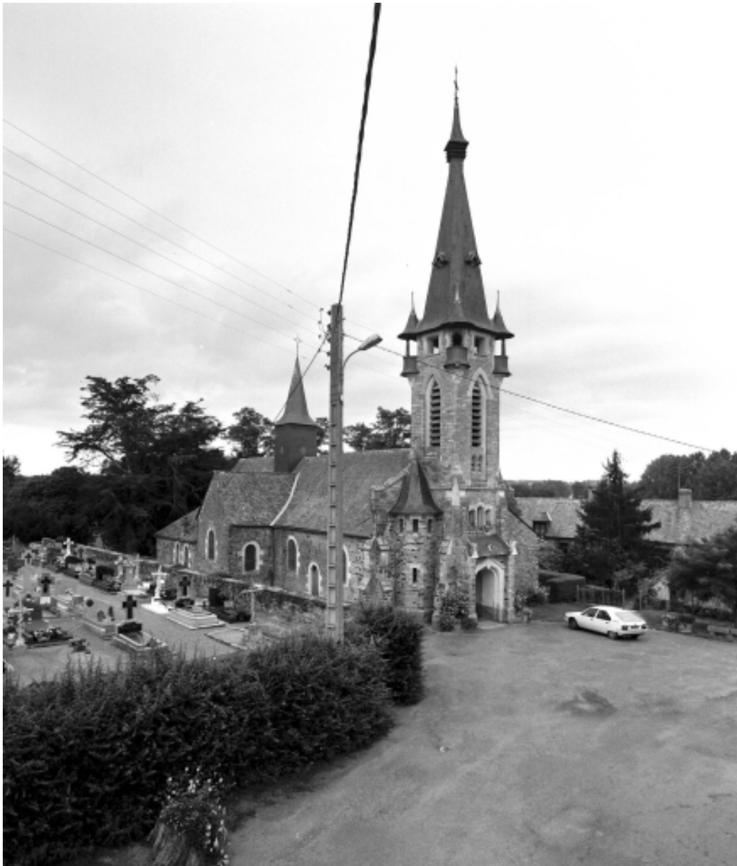
Vue générale nord ouest