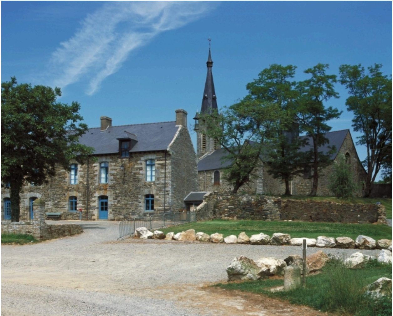
Vue de situation sud est