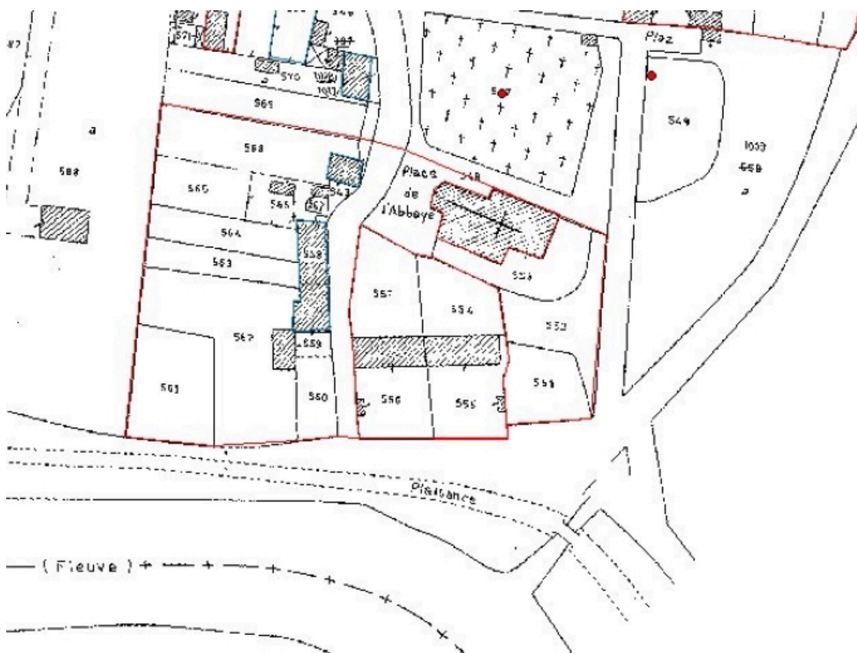
Situation sur le plan cadastral actuel