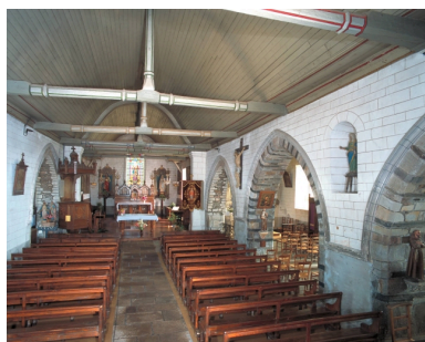
Vue intérieure prise de la nef vers le chœur IVR53_20013501294XA