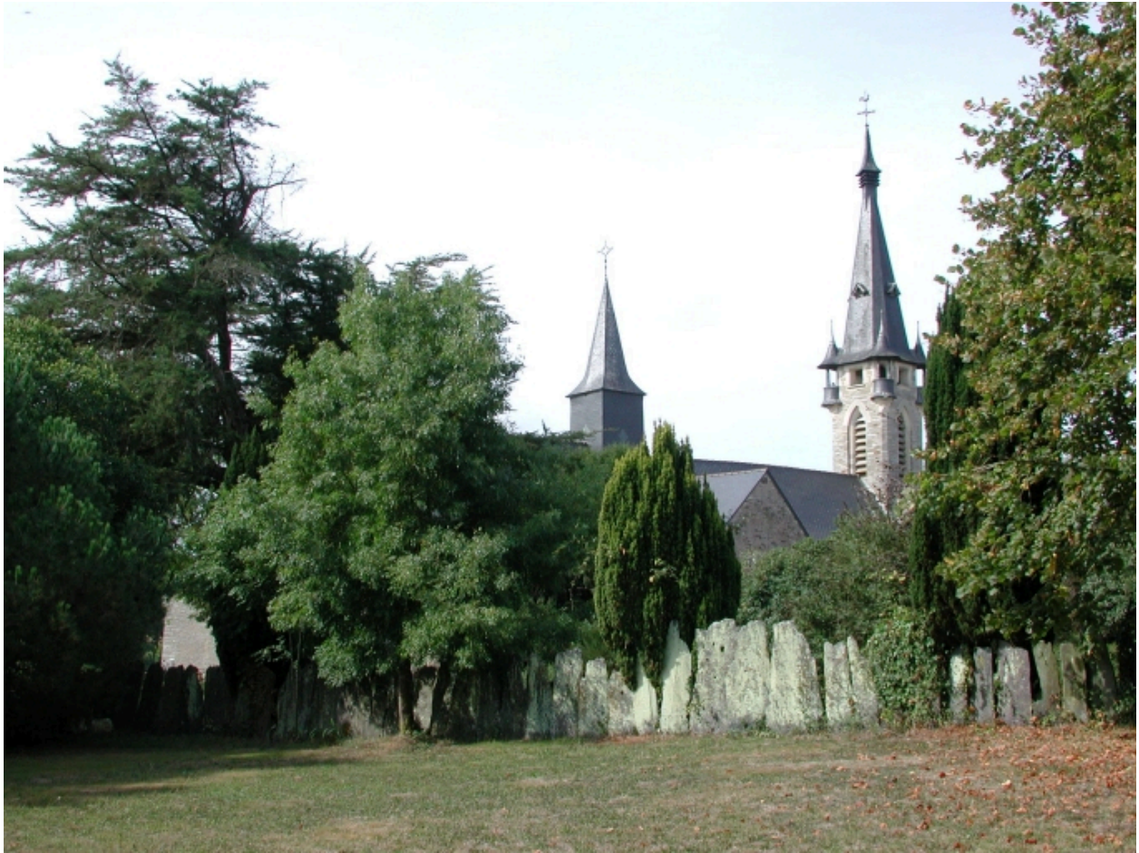
Vue partielle nord est