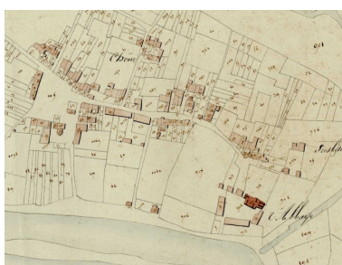
En sombre, l'église sur le cadastre de 1818