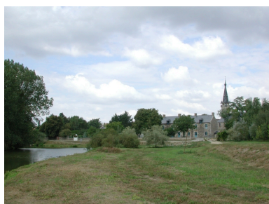
Vue de situation sud est IVR53_20013514051NUCA