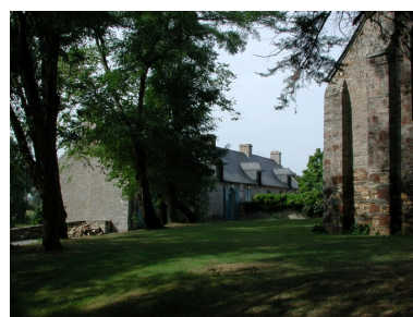
Vue partielle du chevet roman IVR53_20013514032NUCA