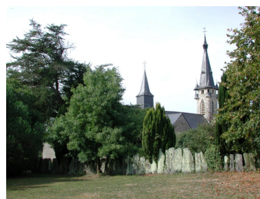
Vue partielle nord est IVR53_20013514031NUCA