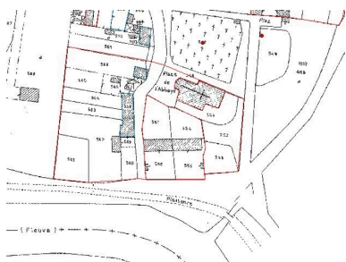
Situation sur le plan cadastral actuel