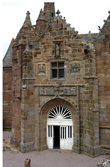
Porche sud, vue générale IVR53_20072200250NUCA