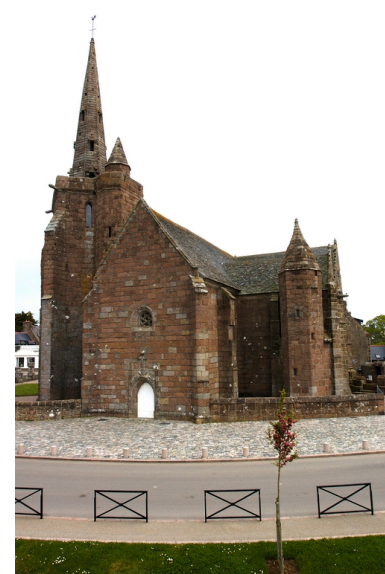
Vue générale depuis l'ouest IVR53_20072200253NUCA