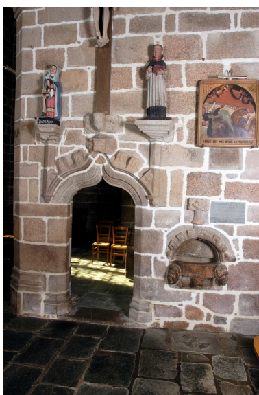
Porte de la chapelle de Lannion