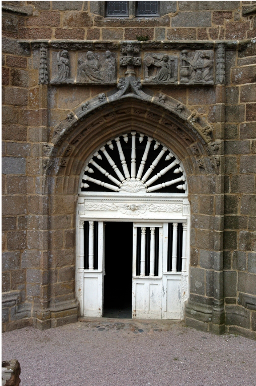
Porche sud, vue rapprochée