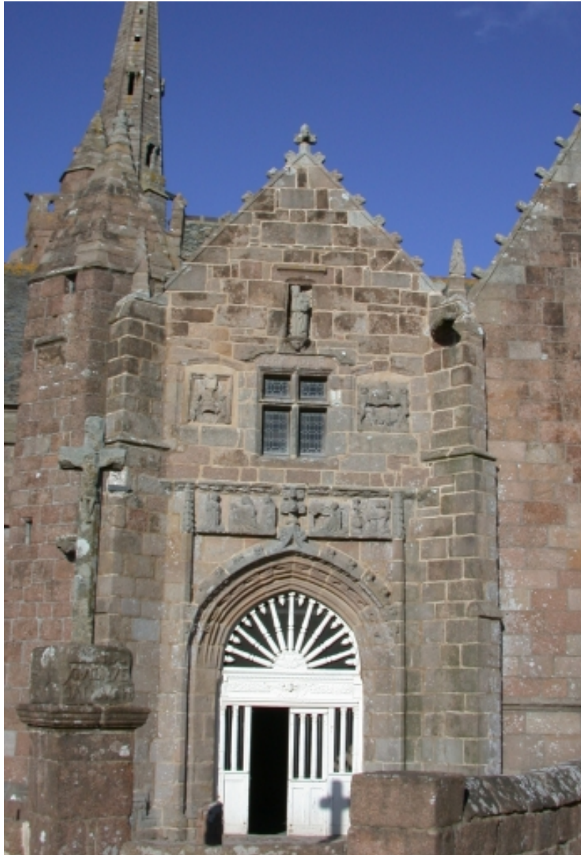
Porche sud, vue générale