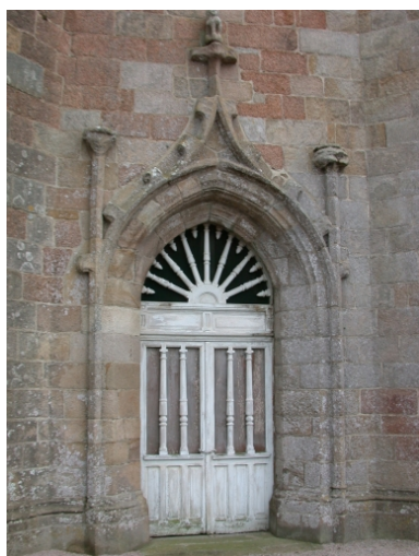
Tour-porche, portail IVR53_20072205652NUCA