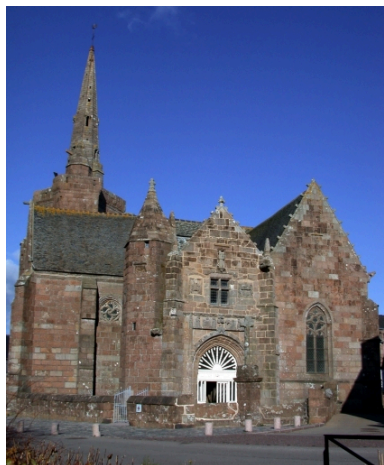
Vue générale (élévation sud)