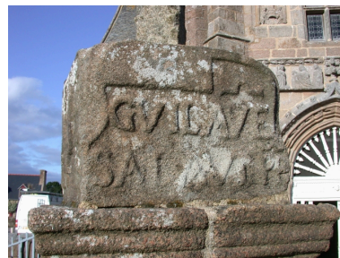
Croix (socle) IVR53_20072205585NUCA