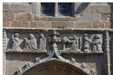
Porche sud : l'Annonciation et la Déploration du Christ IVR53_20072200247NUCA