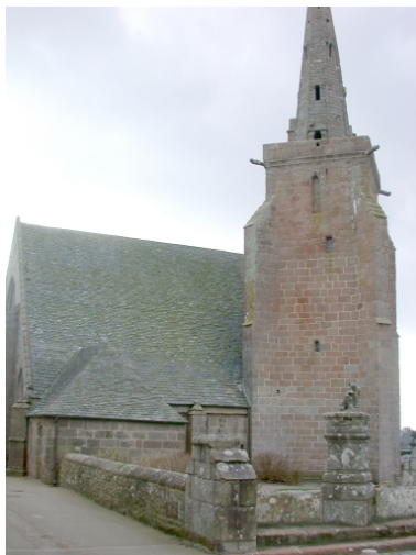
Vue générale (élévation nord) IVR53_20072205647NUCA

La Messelière, vers le 1er quart du 20ème siècle (AD 22) IVR53_20062206516NUCB