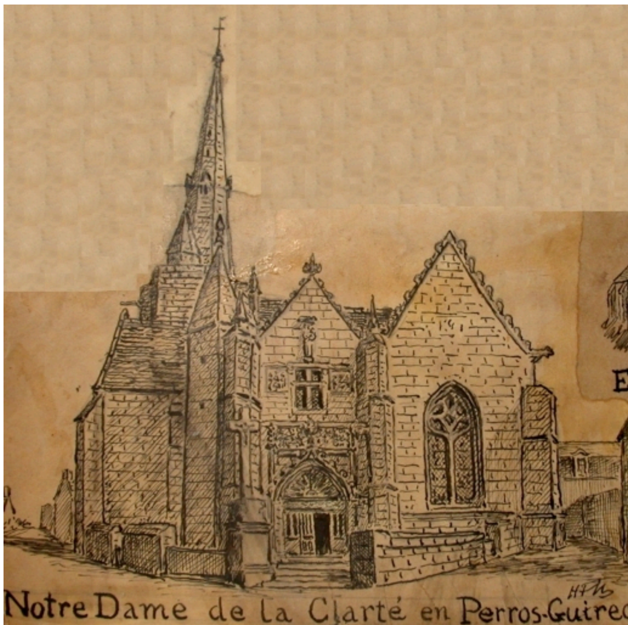
Vue générale, d'après croquis du vicomte Henri Frotier de La Messelière, vers le 1er quart du 20ème siècle (AD 22)