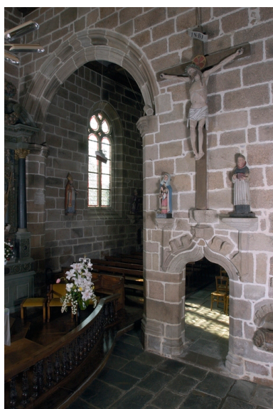
Vue générale de la chapelle de Lannion IVR53_20072200246NUCA