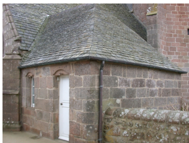
Sacristie IVR53_20072205650NUCA