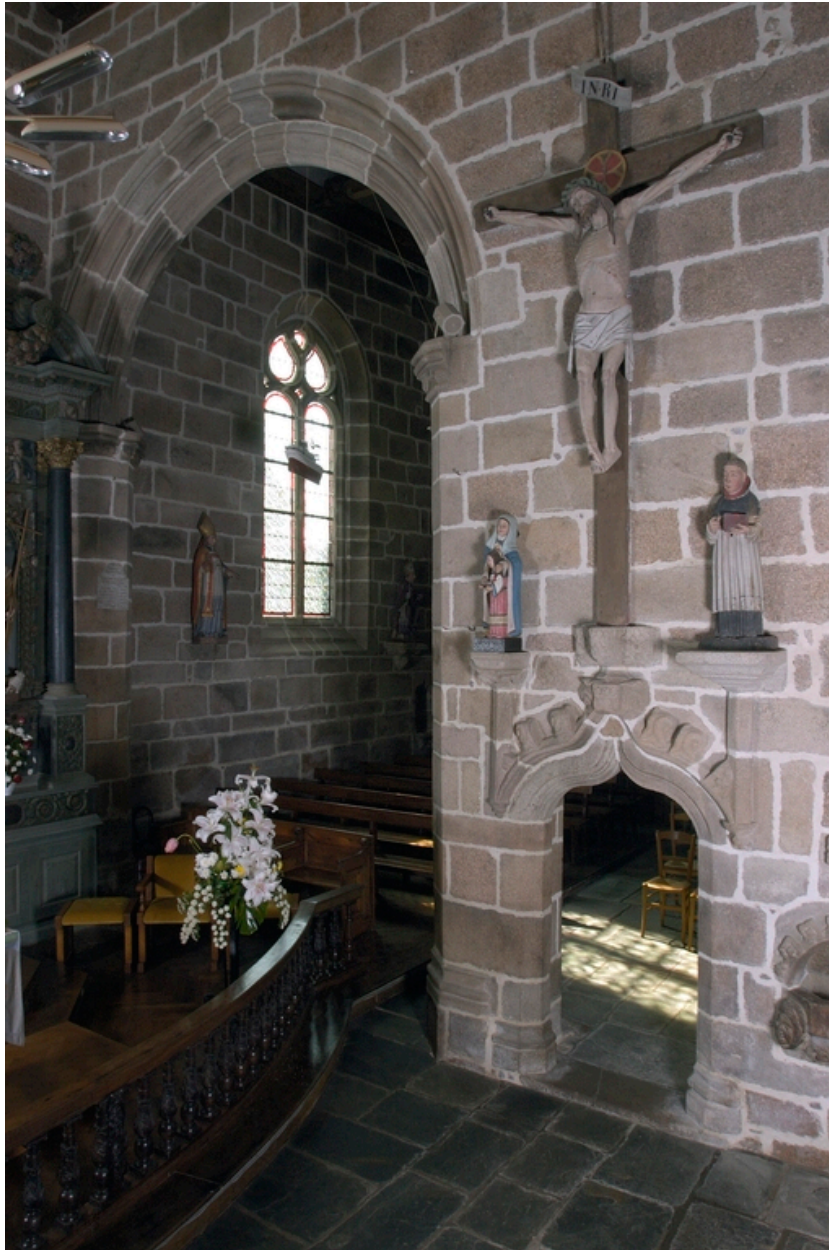
Vue générale de la chapelle de Lannion