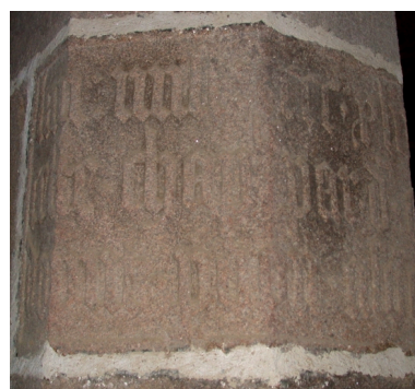
Inscription en caractères gothiques