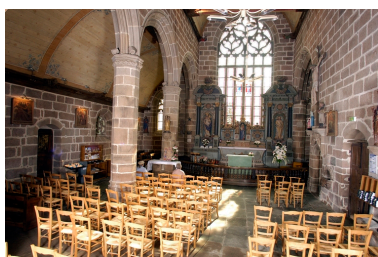
Vue générale vers le chœur IVR53_20072200244NUCA