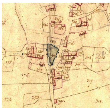
Extrait du cadastre de 1819 (AD 22) Phot. Le Grand, Autr. Alexandre-Joseph Le Grand