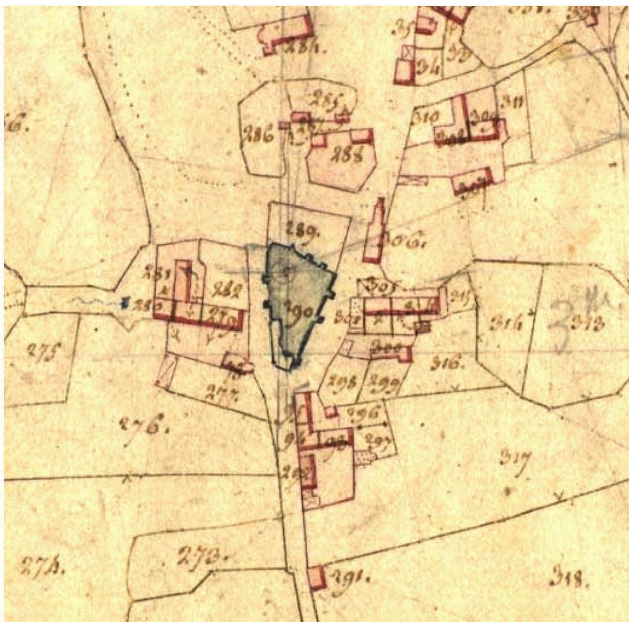
Extrait du cadastre de 1819 (AD 22)