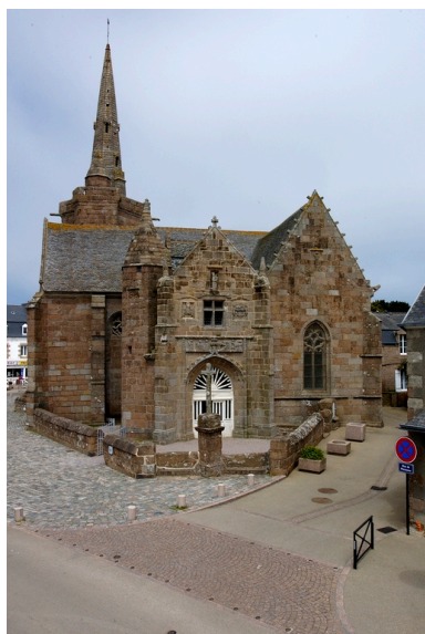
Vue générale du front sud IVR53_20072200249NUCA