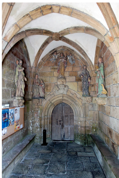
Porche sud, intérieur