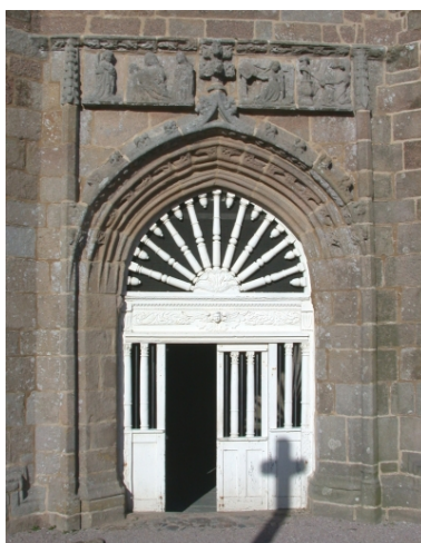
Porche sud (détail) IVR53_20072205582NUCA