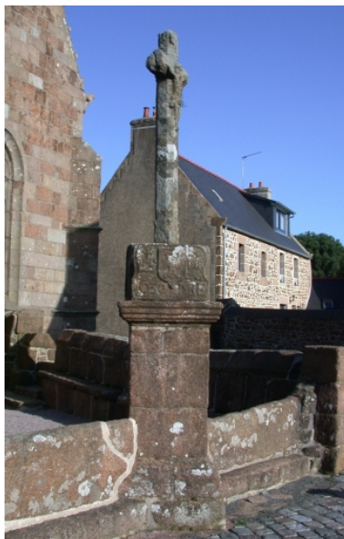
Croix (vue générale) IVR53_20072205584NUCA