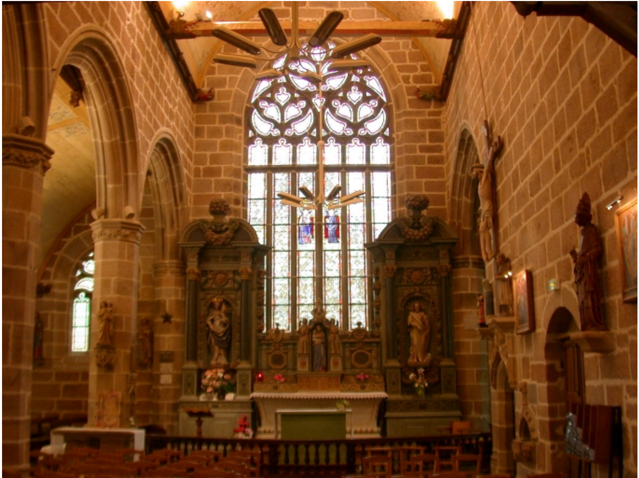
Espace intérieur : vue vers le chevet