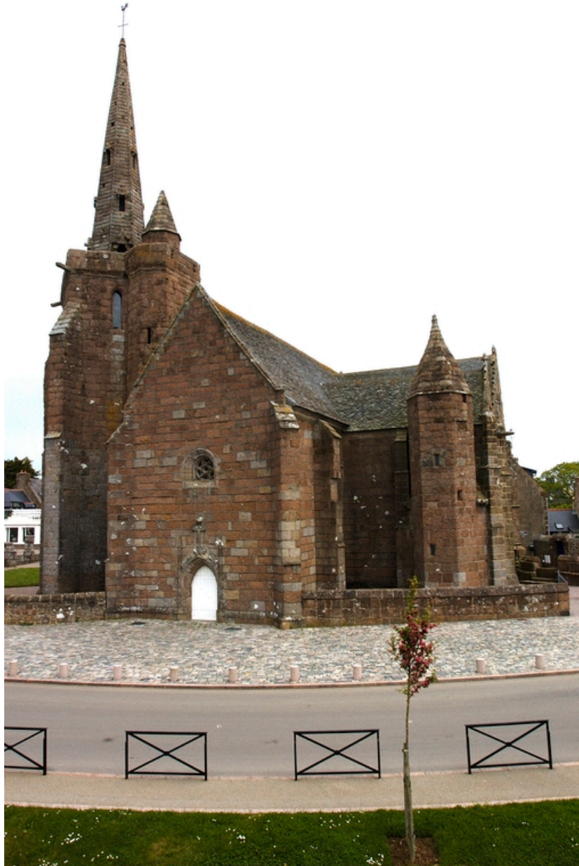
Vue générale depuis l'ouest