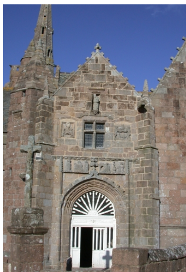
Porche sud, vue générale IVR53_20072205581NUCA