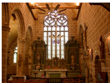
Espace intérieur : vue vers le chevet