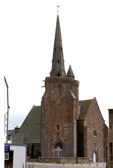
Vue générale du clocher IVR53_20072200255NUCA

La Messelière, vers le 1er quart du 20ème siècle (AD 22) IVR53_20062206516NUCB