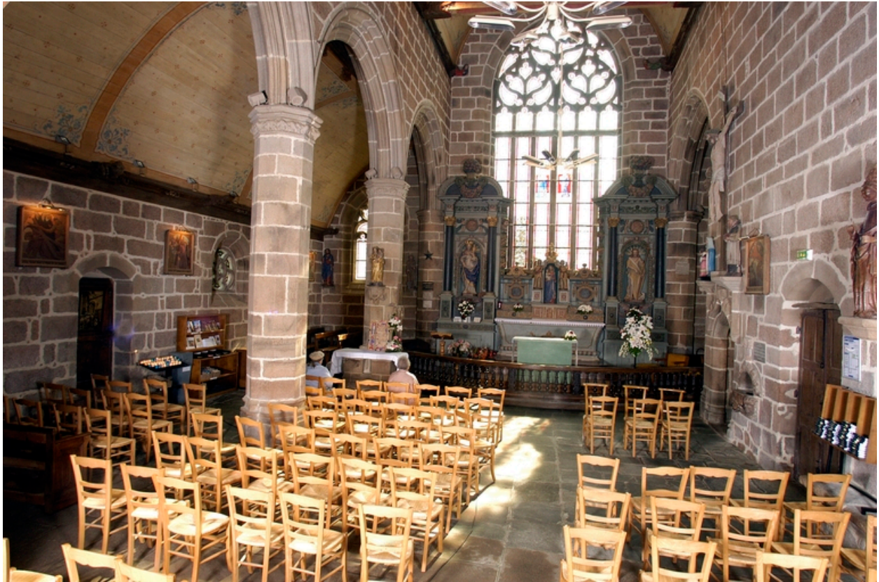
Vue générale vers le chœur