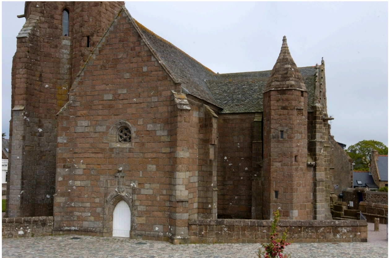
Vue générale depuis l'ouest