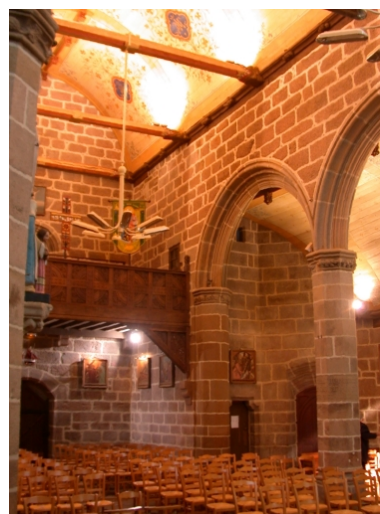
Espace intérieur : vue vers le bas de la nef et sa tribune IVR53_20062206906NUCA