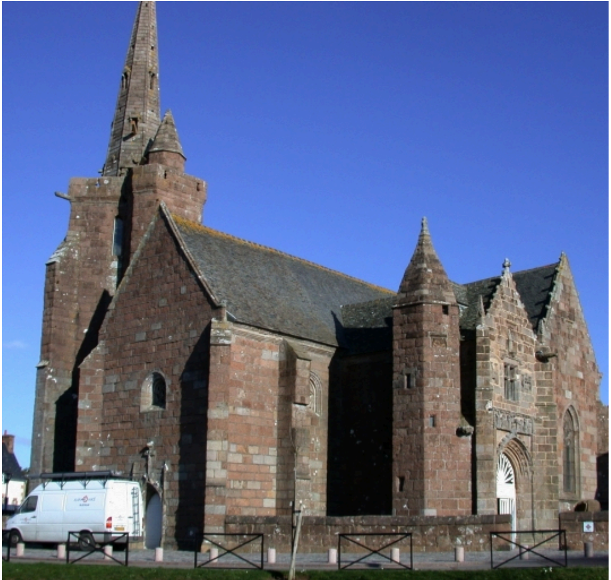
Vue générale (élévation sud-ouest)