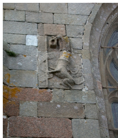
Chevet, armes de Rolland IV de Coëtmén IVR53_20072205648NUCA