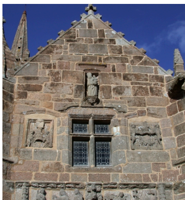
Porche sud (détail) IVR53_20072205583NUCA