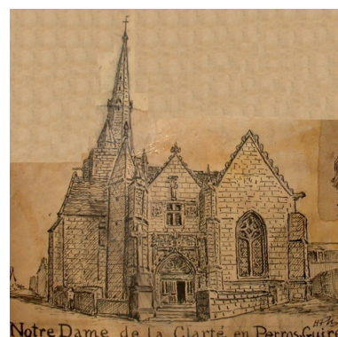
Notre Dame de la Clarté en Perros-Guirec Vue générale, d'après croquis du vicomte Henri Frotier de