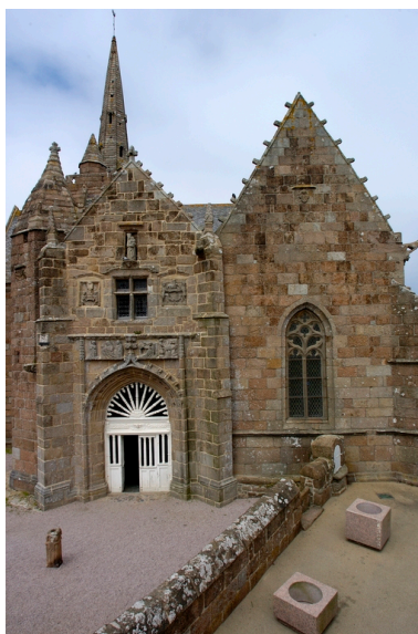
Vue du porche sud et de la chapelle de Lannion IVR53_20072200252NUCA