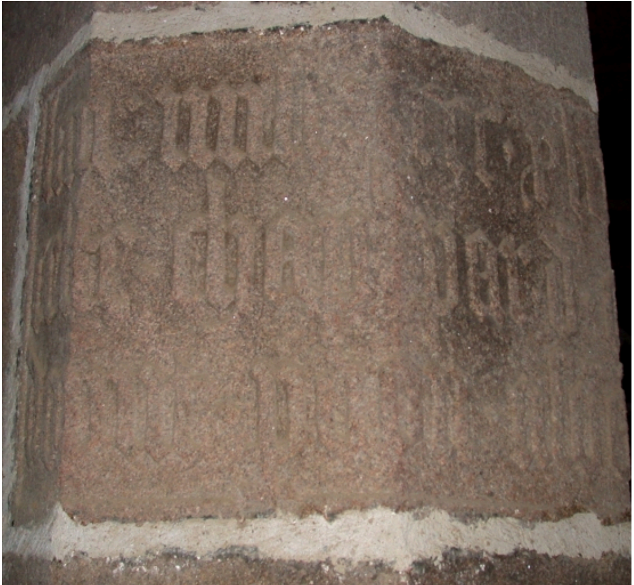
Inscription en caractères gothiques