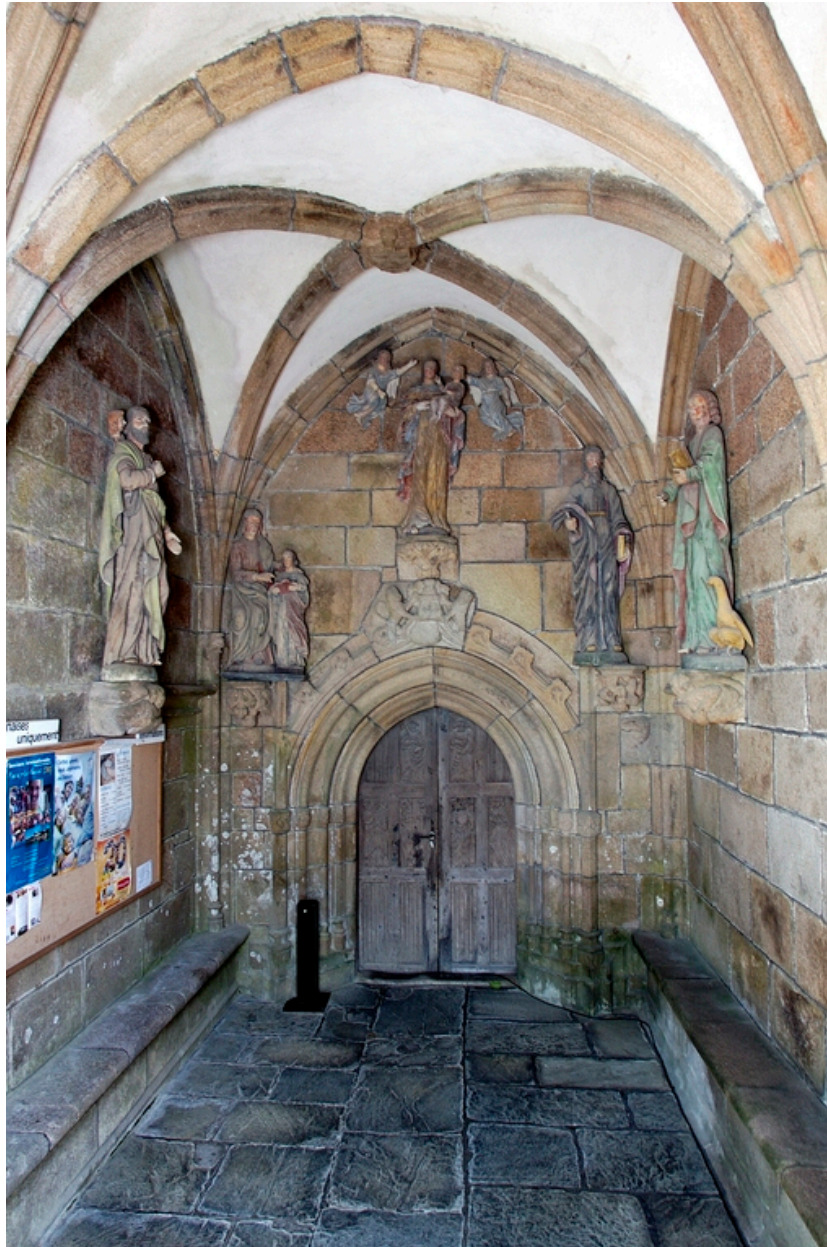
Porche sud, intérieur