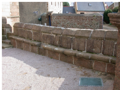
Mur de clôture, banc intérieur IVR53_20072205653NUCA