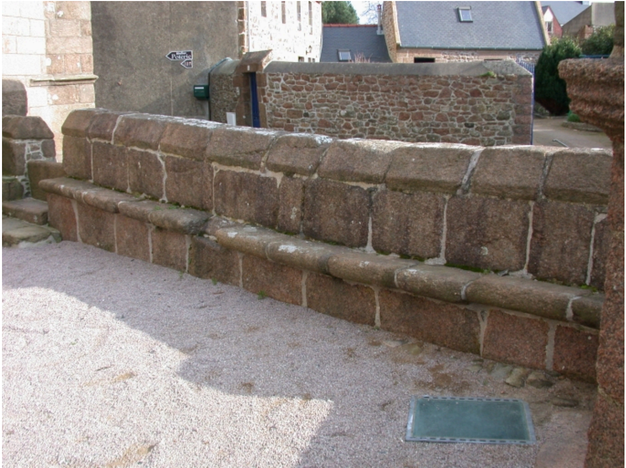
Mur de clôture, banc intérieur