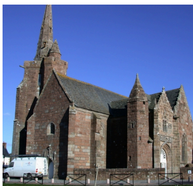
Vue générale (élévation sud-ouest)