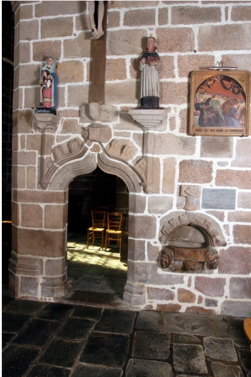
Porte de la chapelle de Lannion