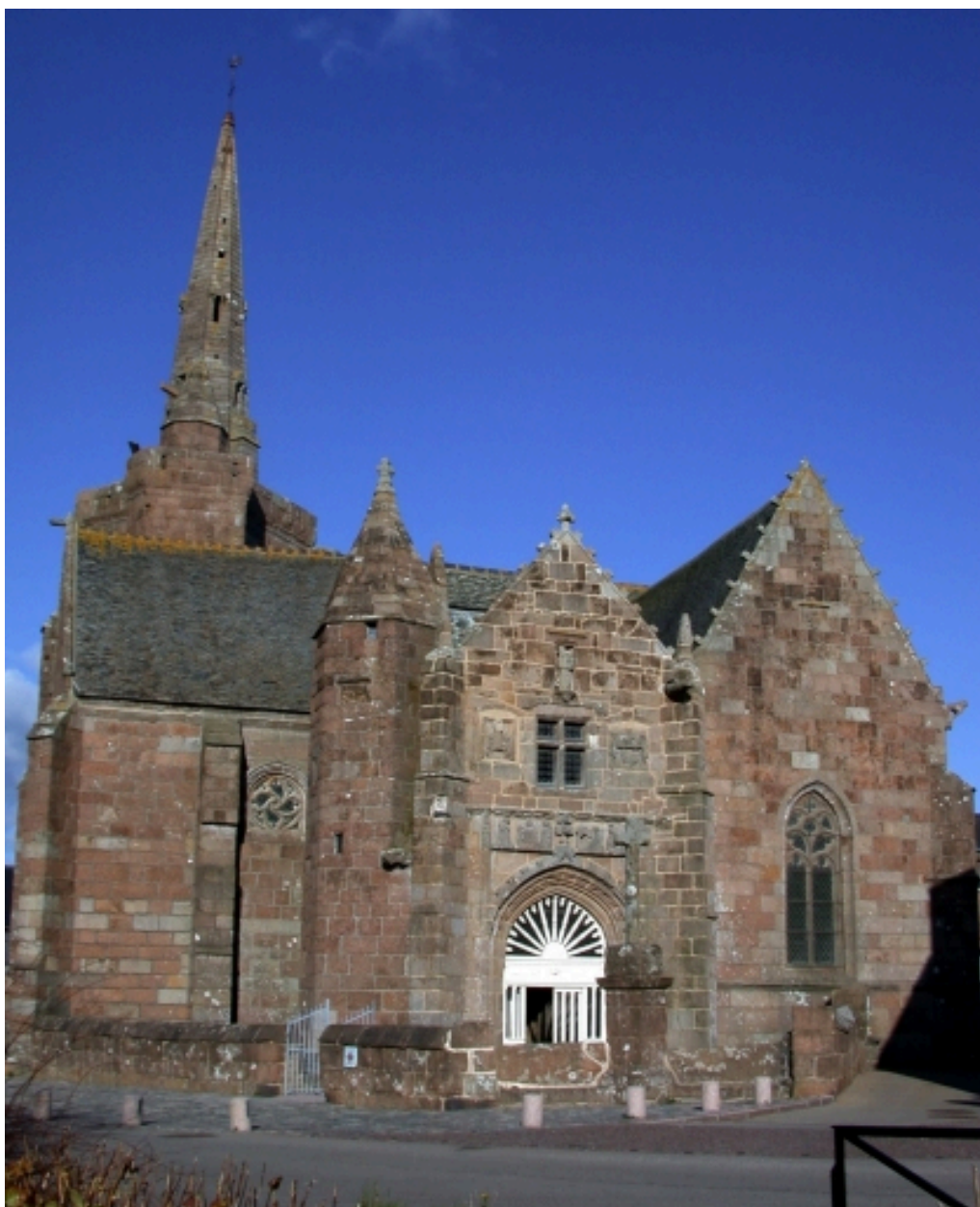
Vue générale (élévation sud)