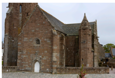
Vue générale depuis l'ouest IVR53_20072200254NUCA