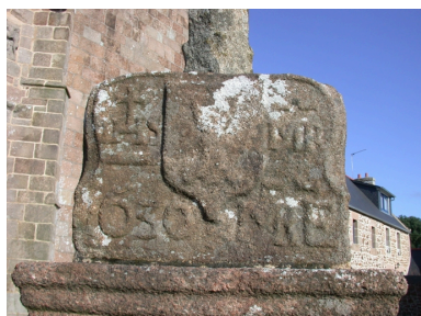
Croix (socle)