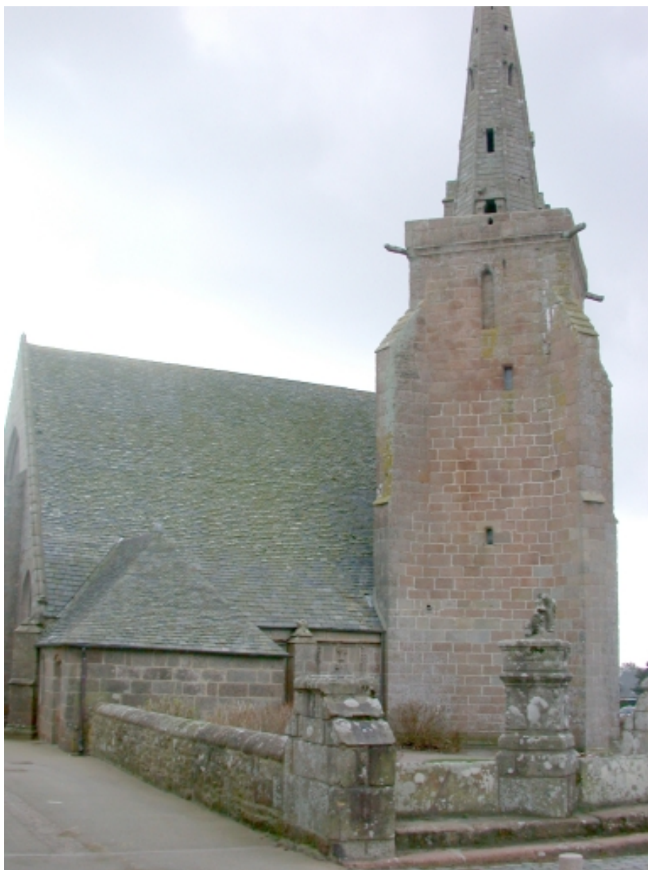
Vue générale (élévation nord)