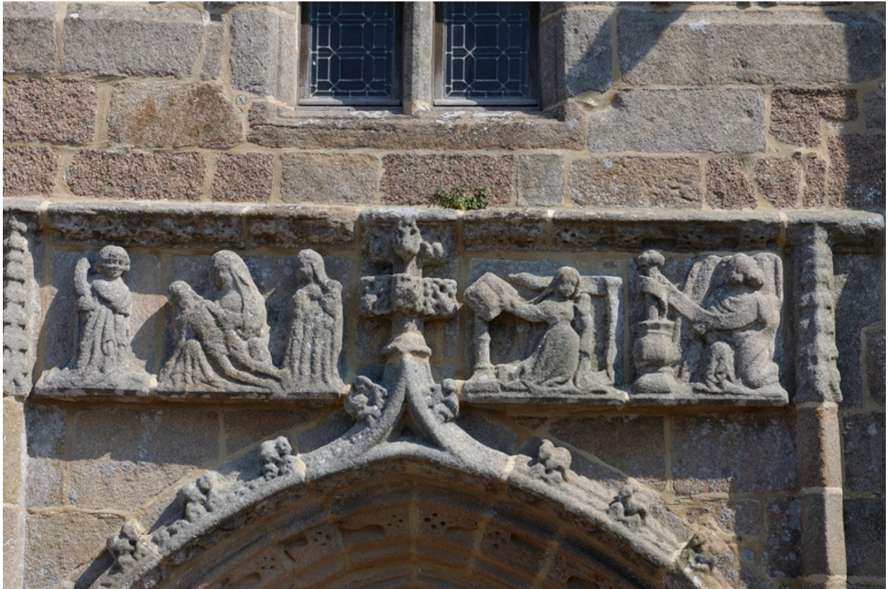
Porche sud : l'Annonciation et la Déploration du Christ