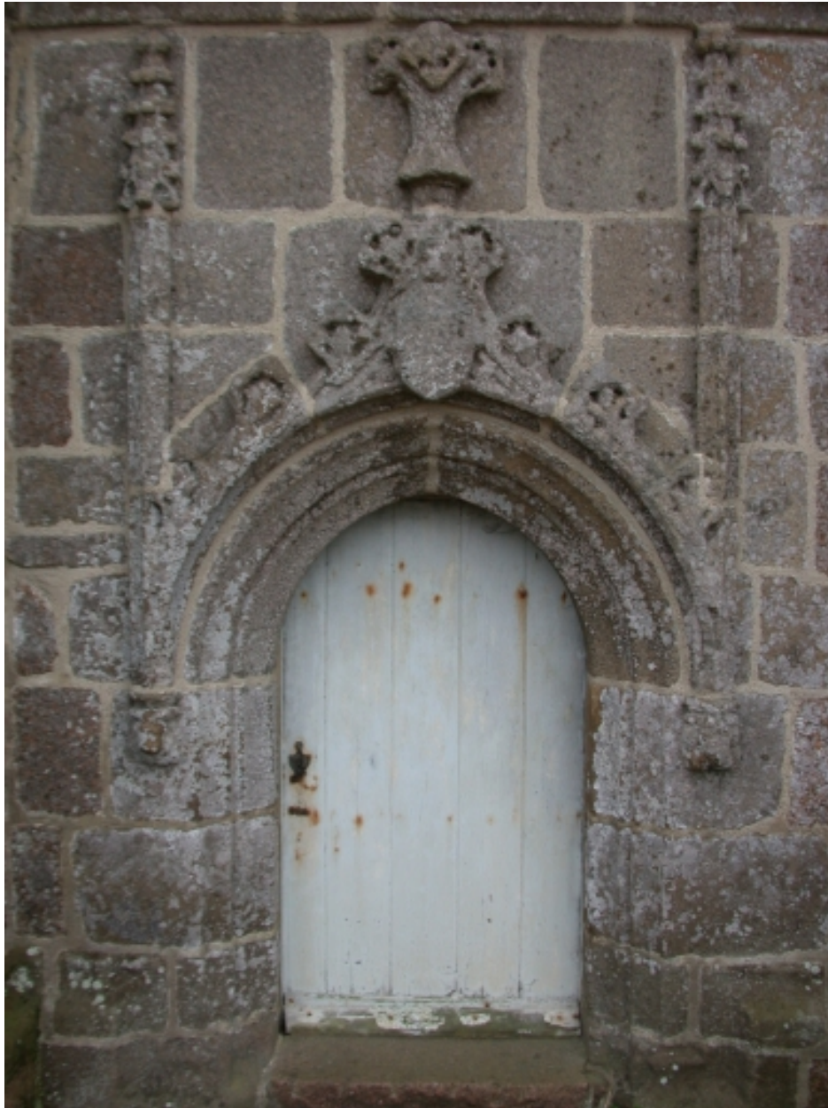
Elévation nord, porte