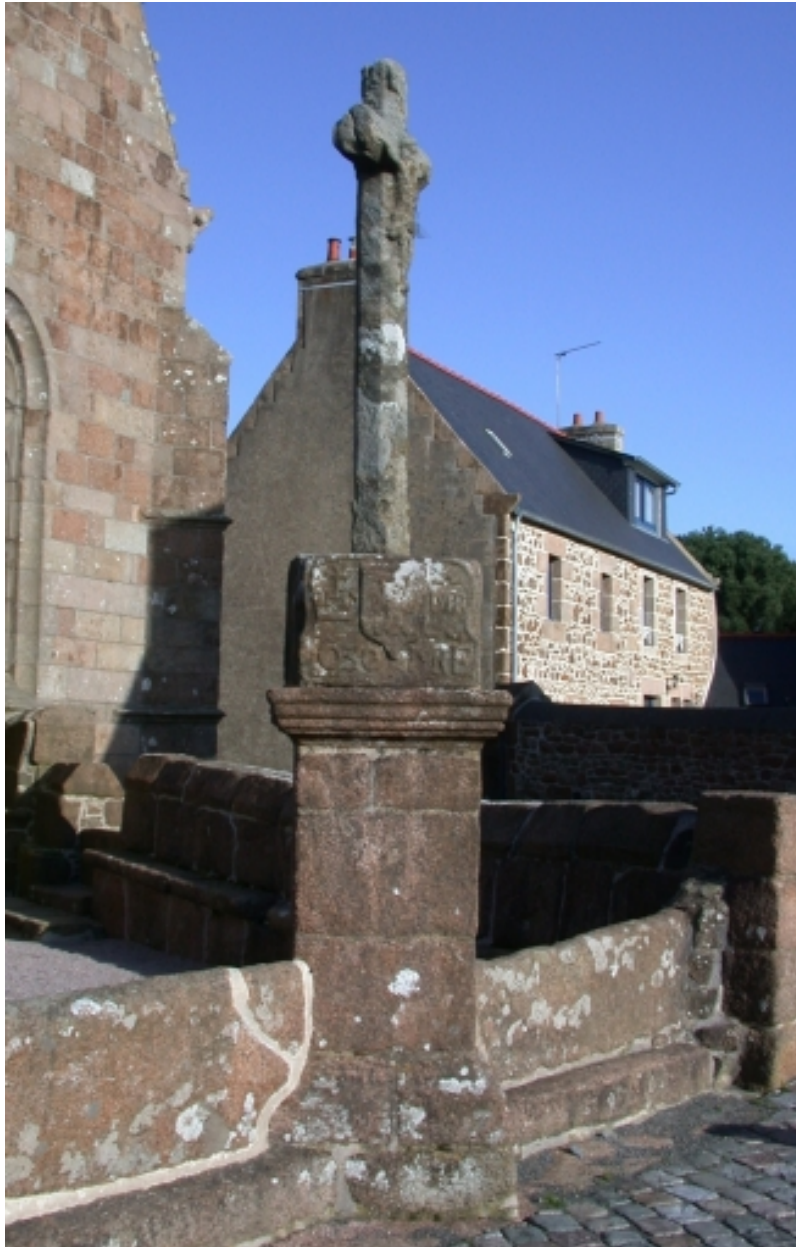
Croix (vue générale)