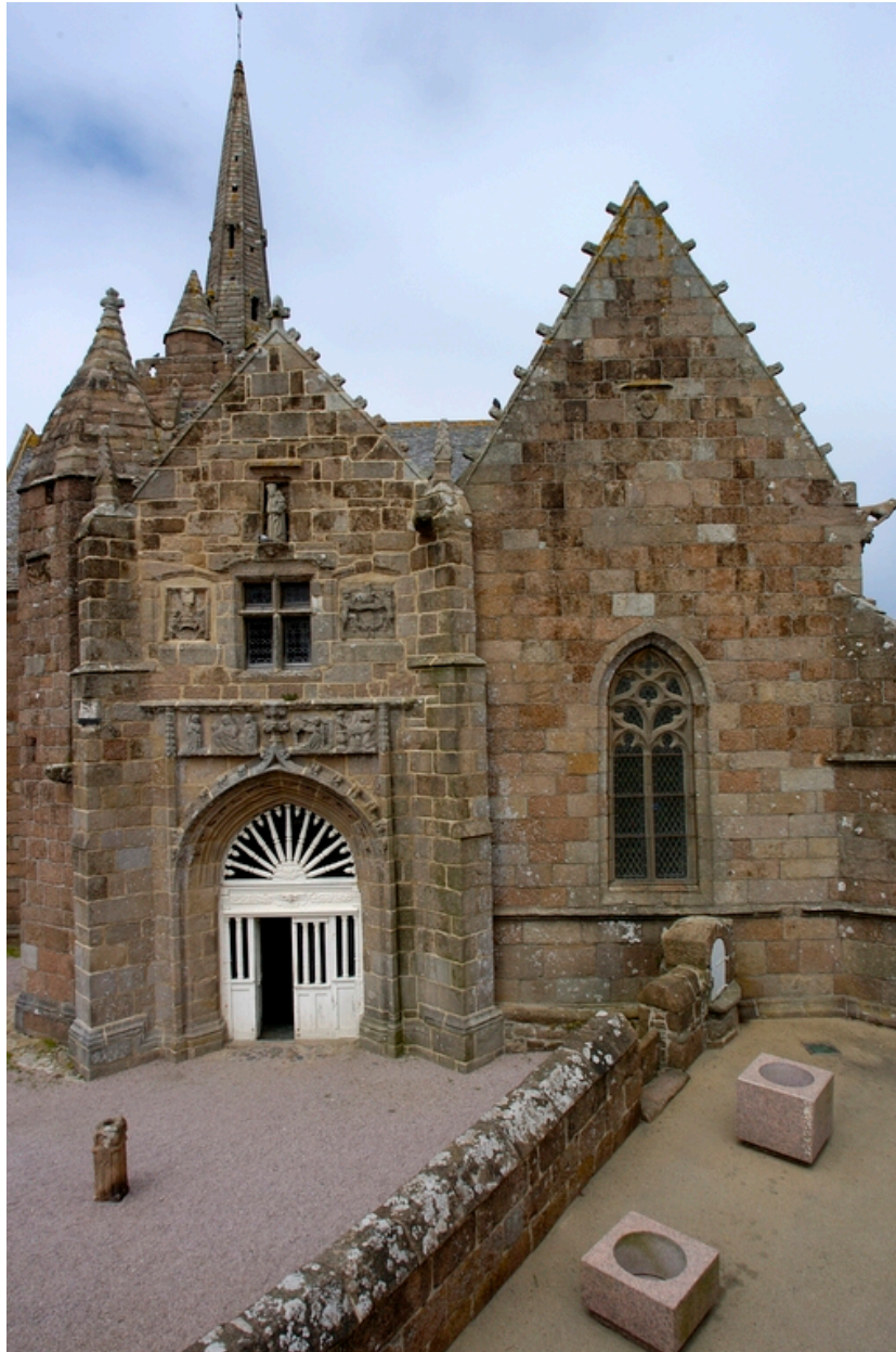
Vue du porche sud et de la chapelle de Lannion