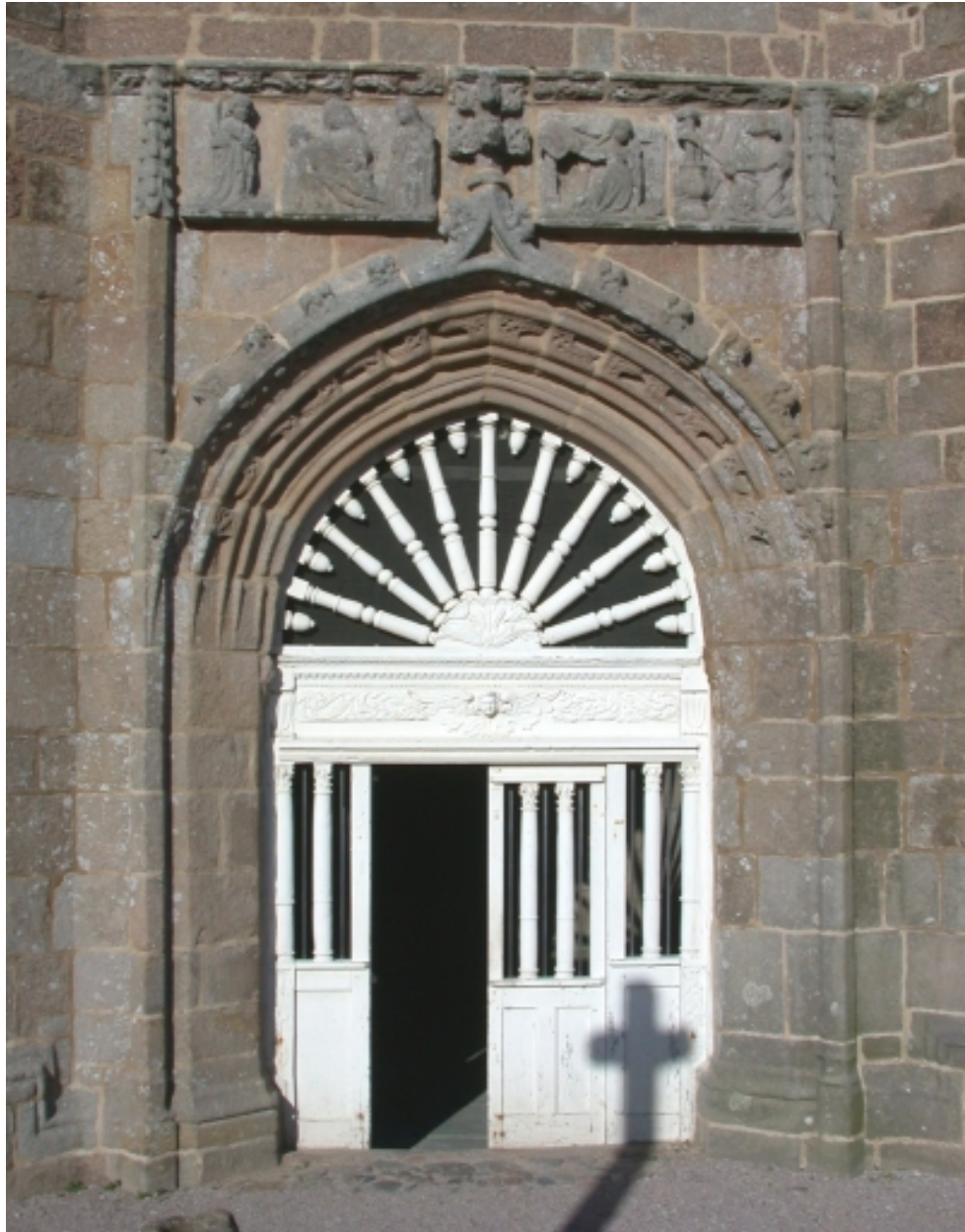
Porche sud (détail)