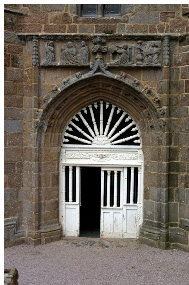
Porche sud, vue rapprochée