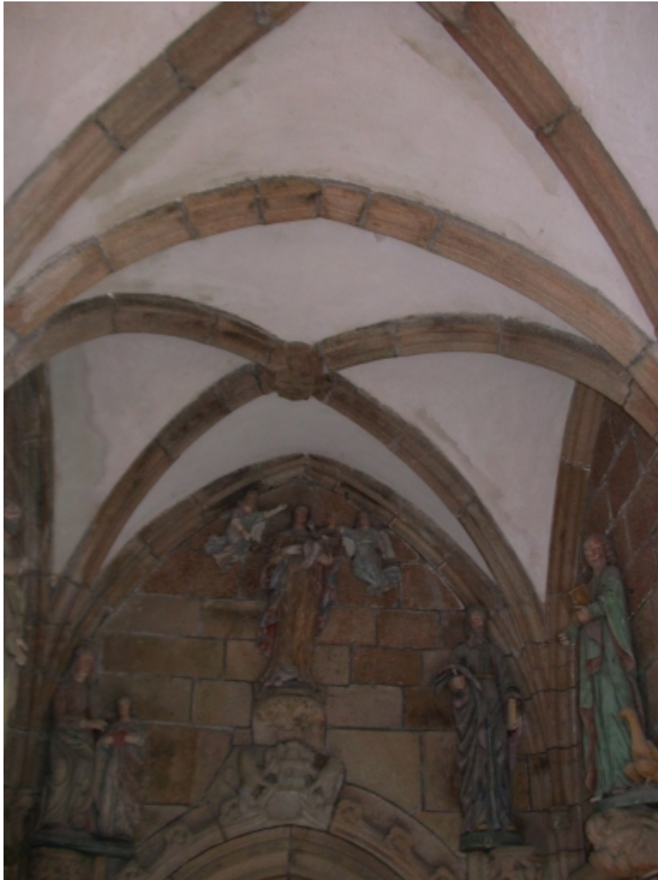
Porche sud (couvrement)