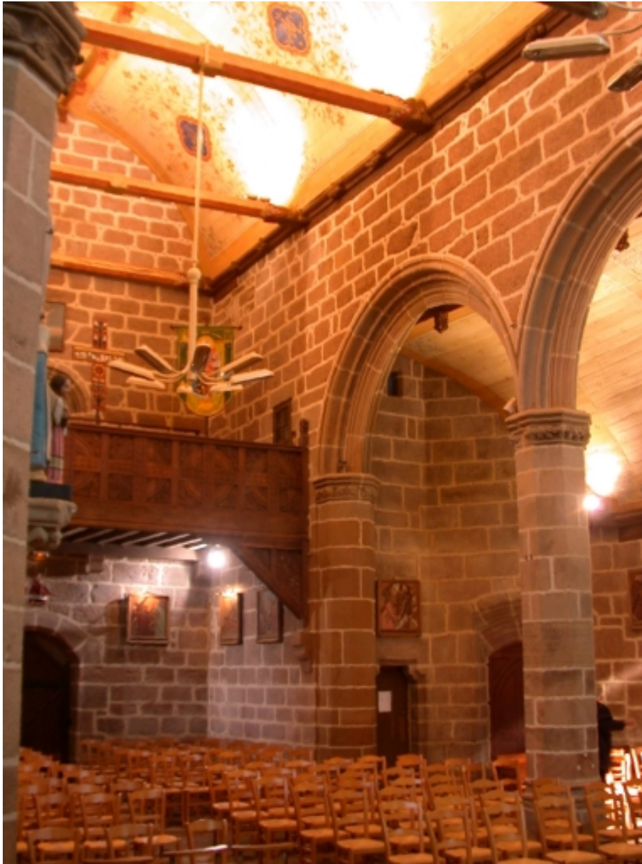
Espace intérieur : vue vers le bas de la nef et sa tribune