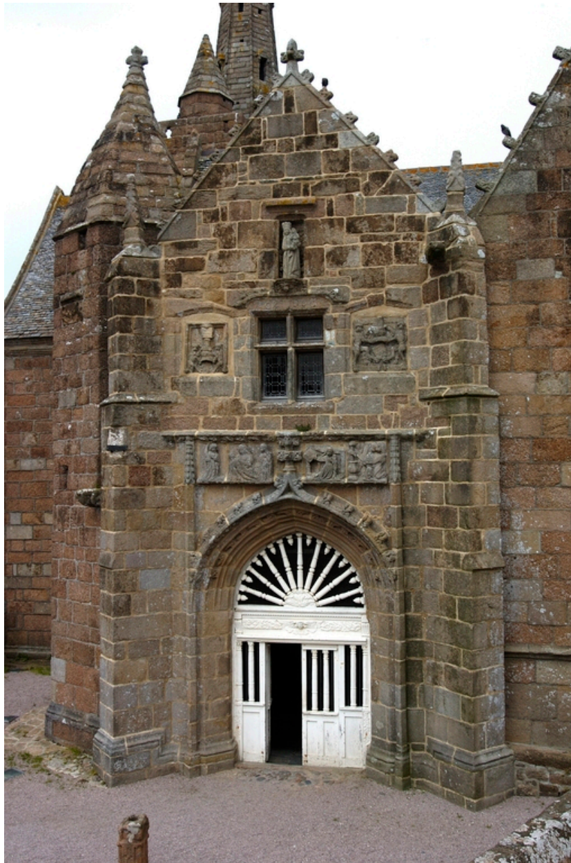
Porche sud, vue générale