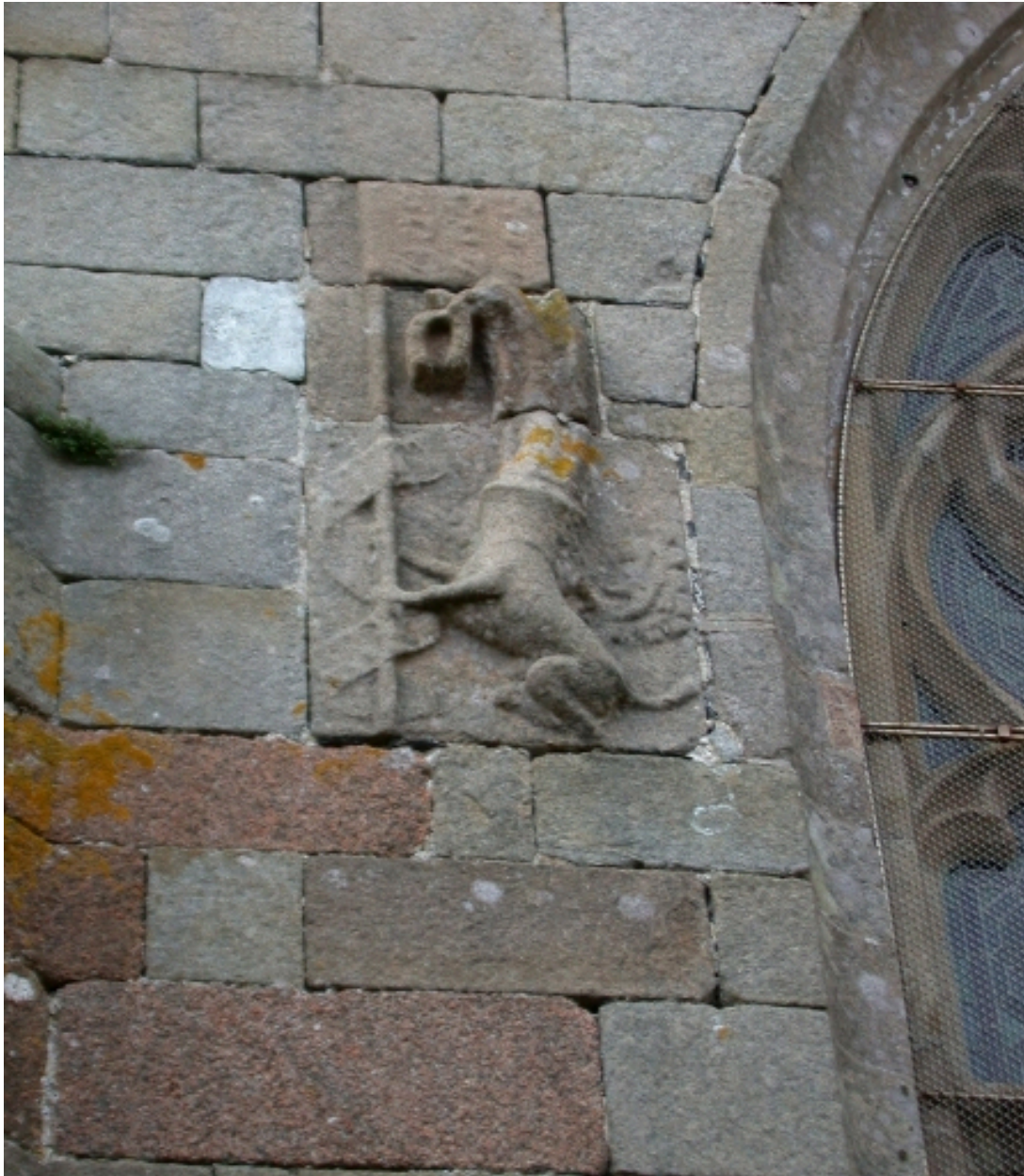
Chevet, armes de Rolland IV de Coëtmen