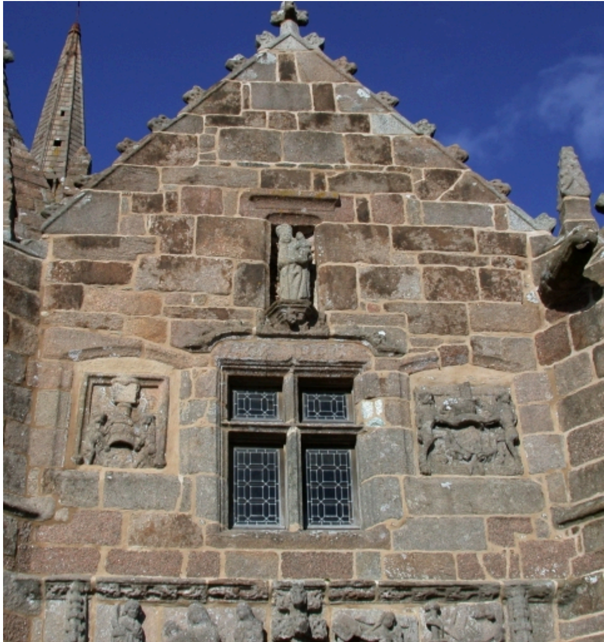
Porche sud (détail)