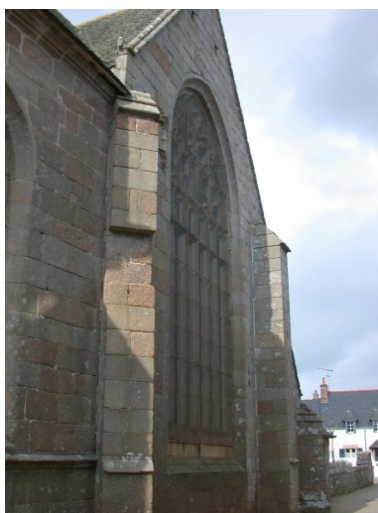
Chevet