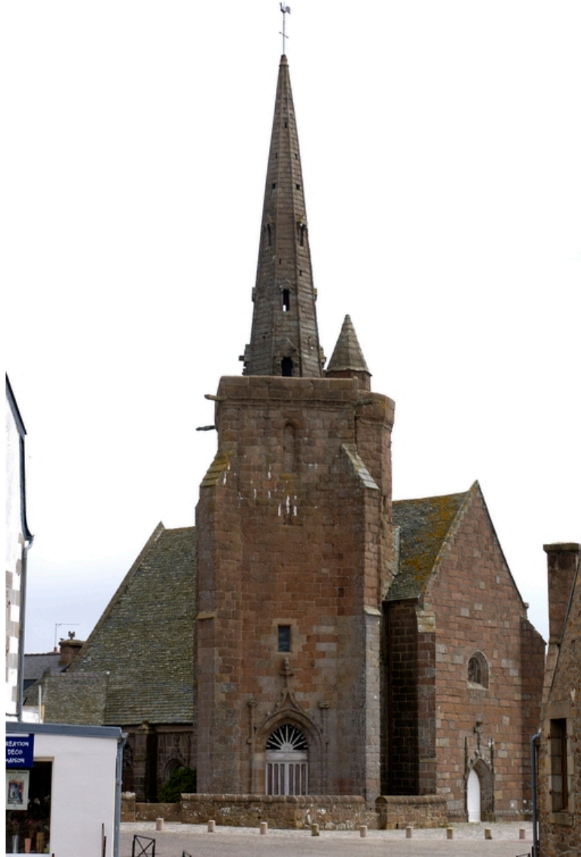
Vue générale du clocher