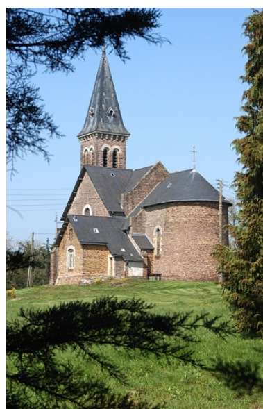
Vue générale est IVR53_20023502789NUCA