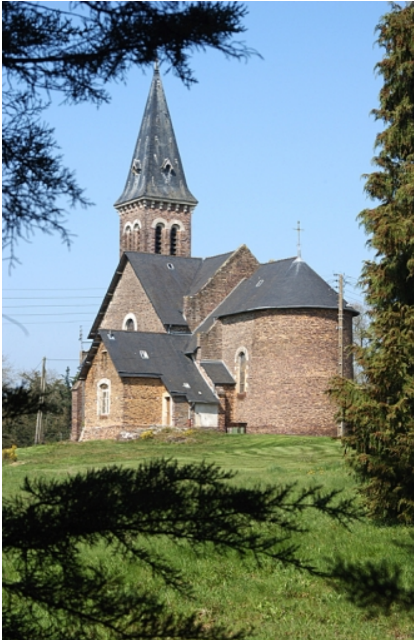
Vue générale est