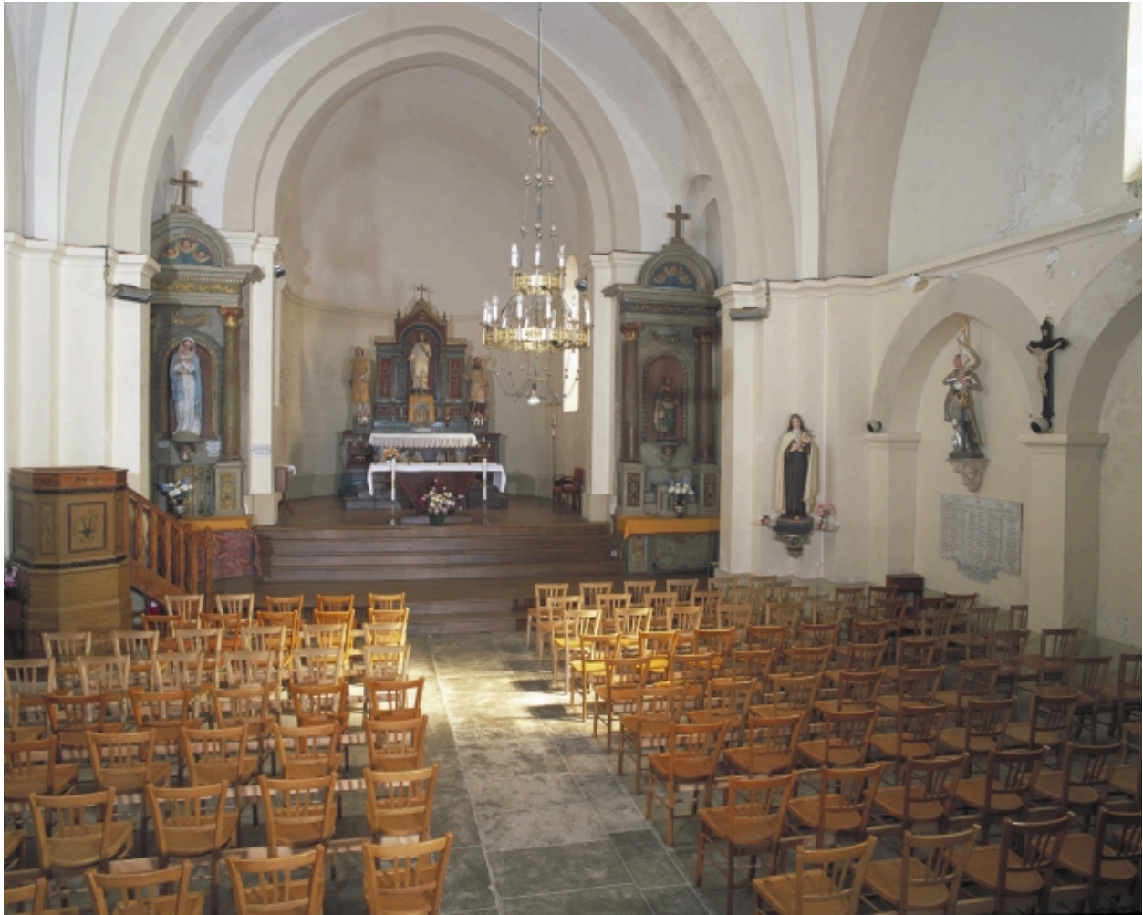
Vue intérieure prise de la nef vers le chœur