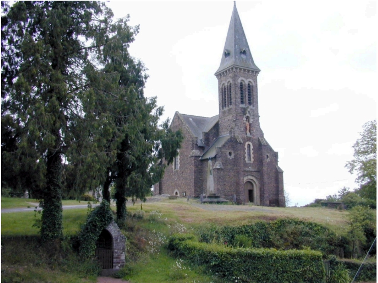
Vue générale ouest