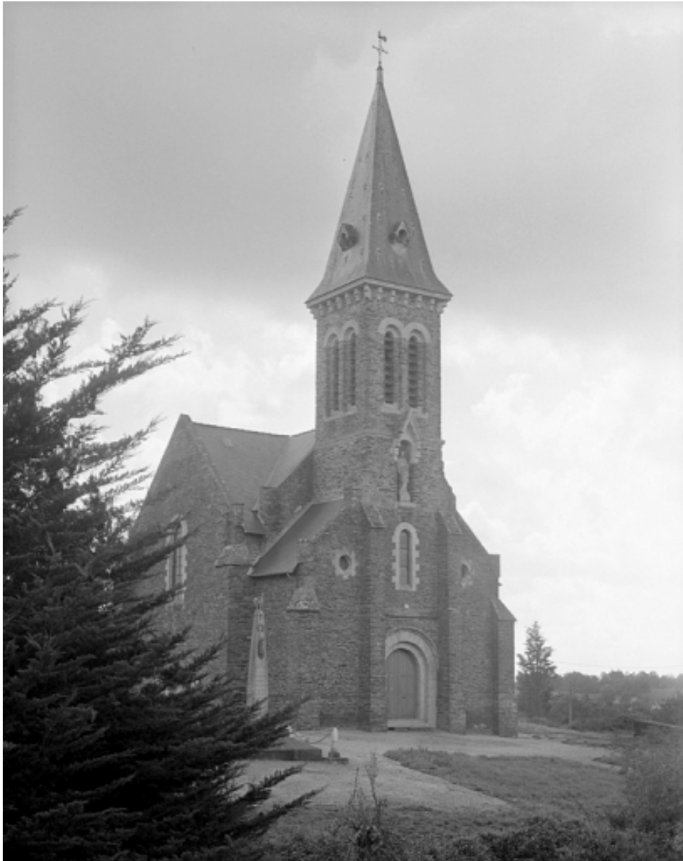
Vue générale ouest