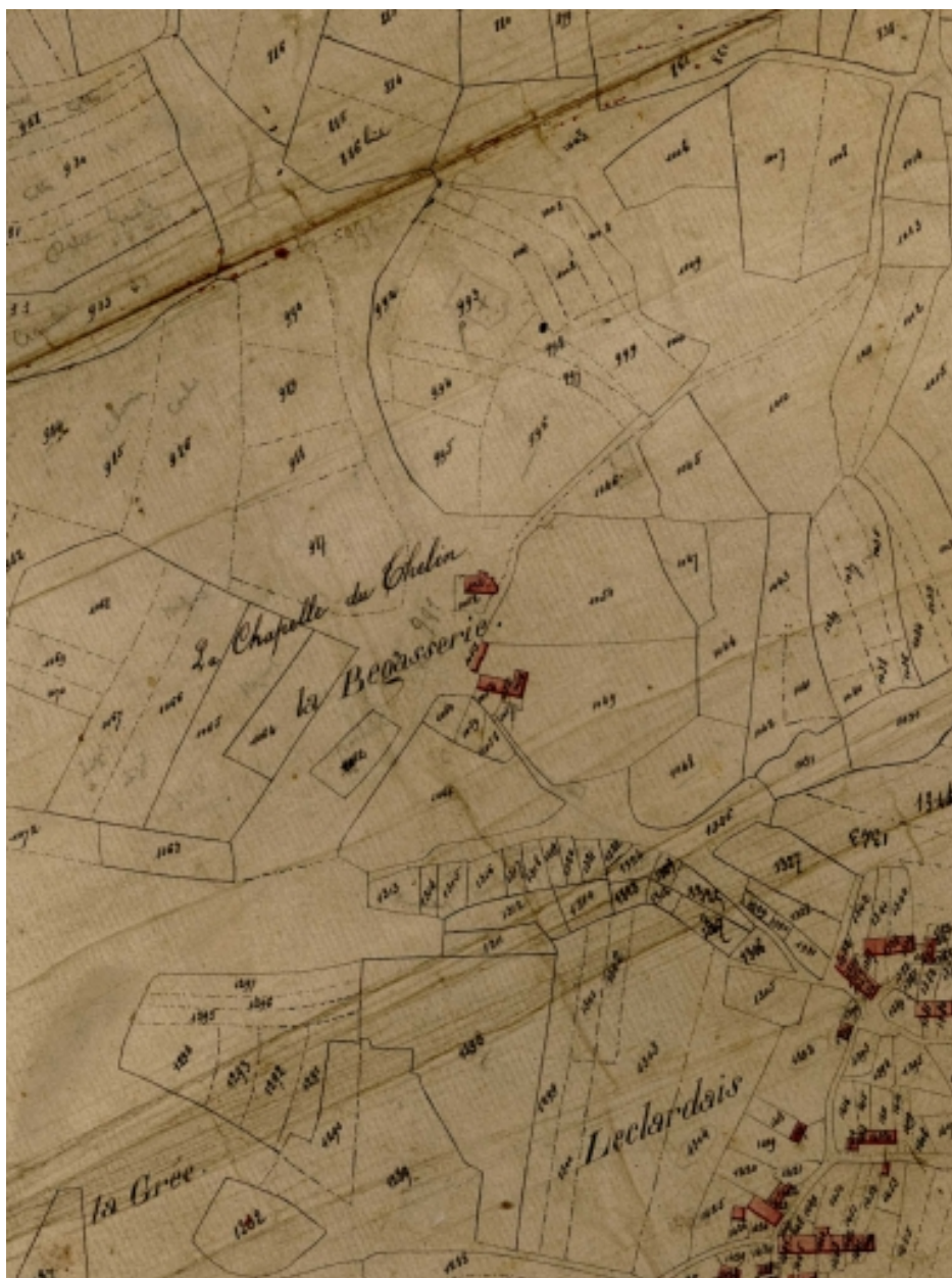
Extrait du cadastre de 1823 ; la chapelle au centre de l'image, le plan de l'église en haut de l'image