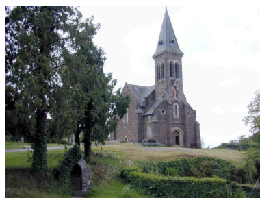
Vue générale ouest IVR53_20023513880NUCA