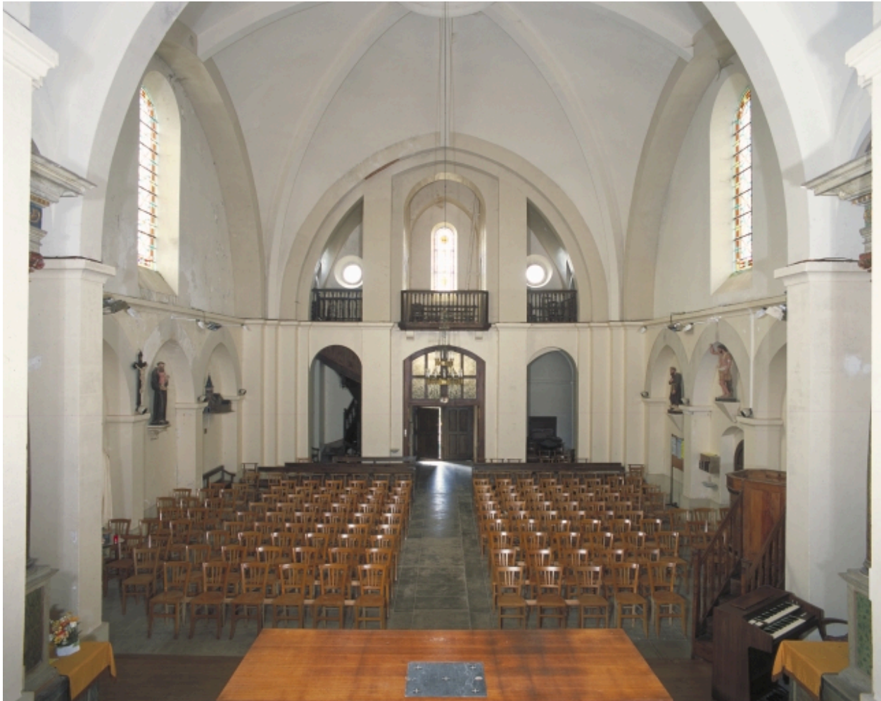
Vue intérieure prise du chœur vers la nef