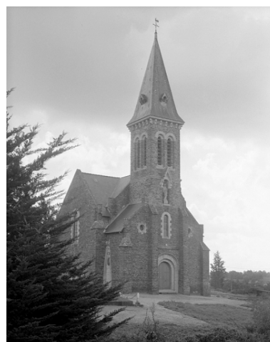
Vue générale ouest