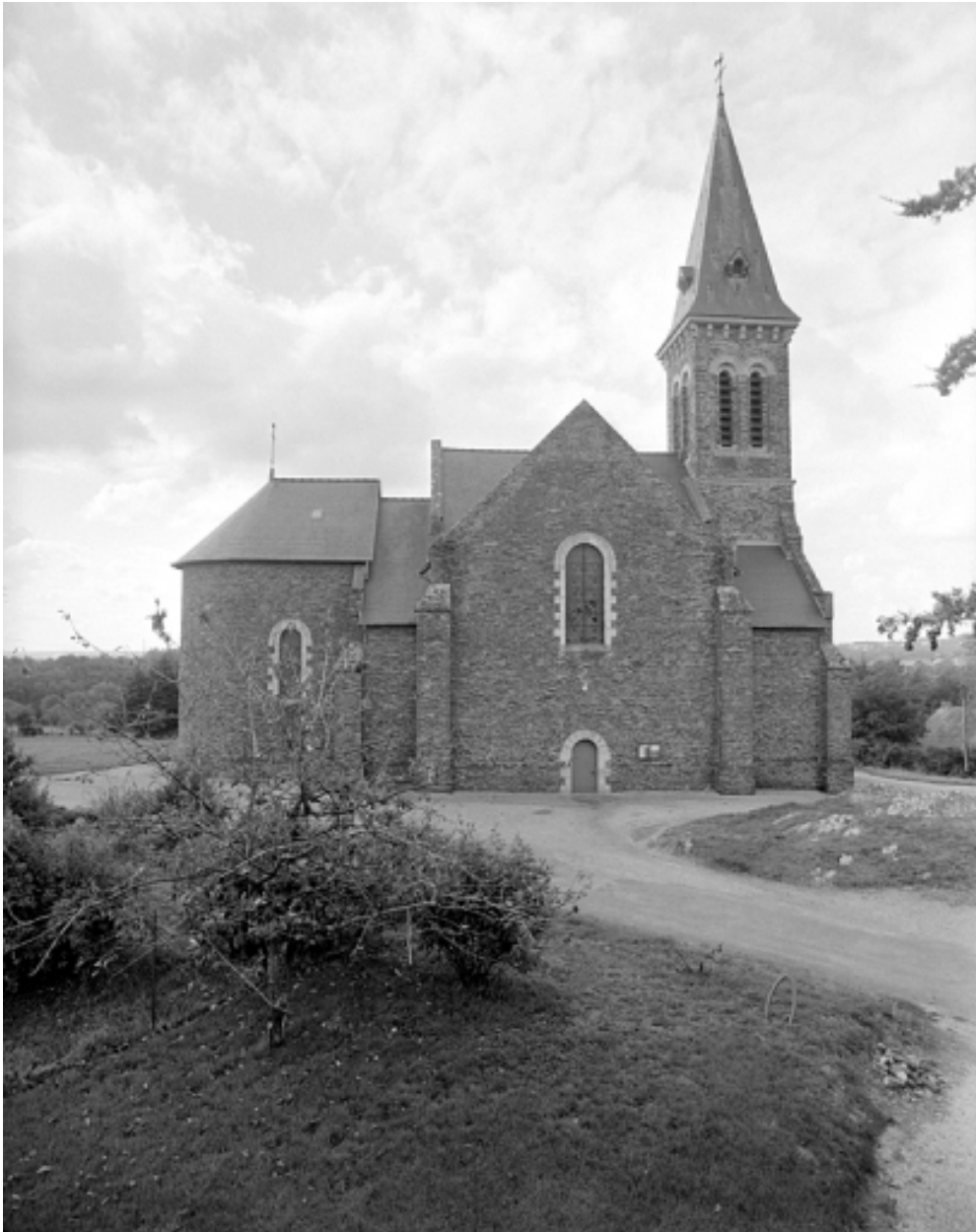
Vue générale nord