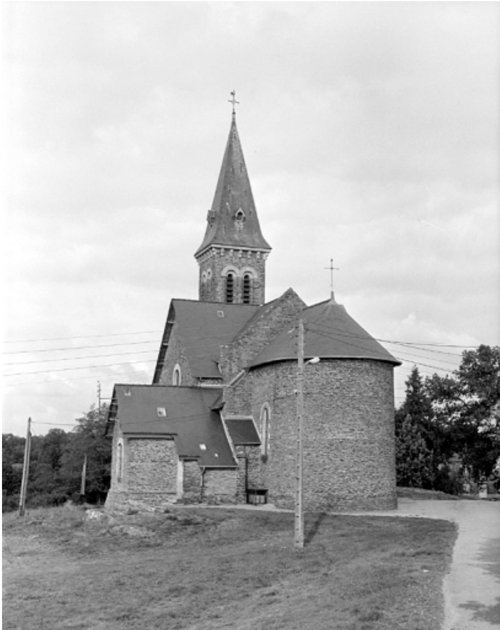
Vue générale est