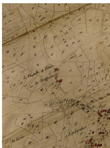
Extrait du cadastre de 1823 ; la chapelle au centre de l'image, le plan de l'église en haut de l'image