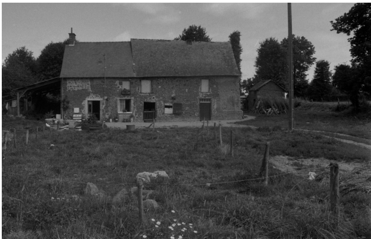
Bâtiment de la Cour Huet en 1975