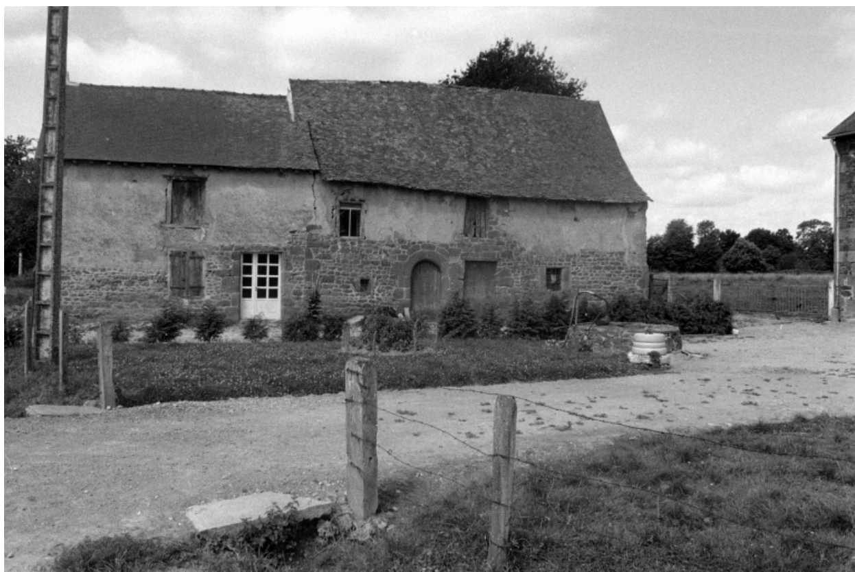
Bâtiment de la Cour Bausset en 1975