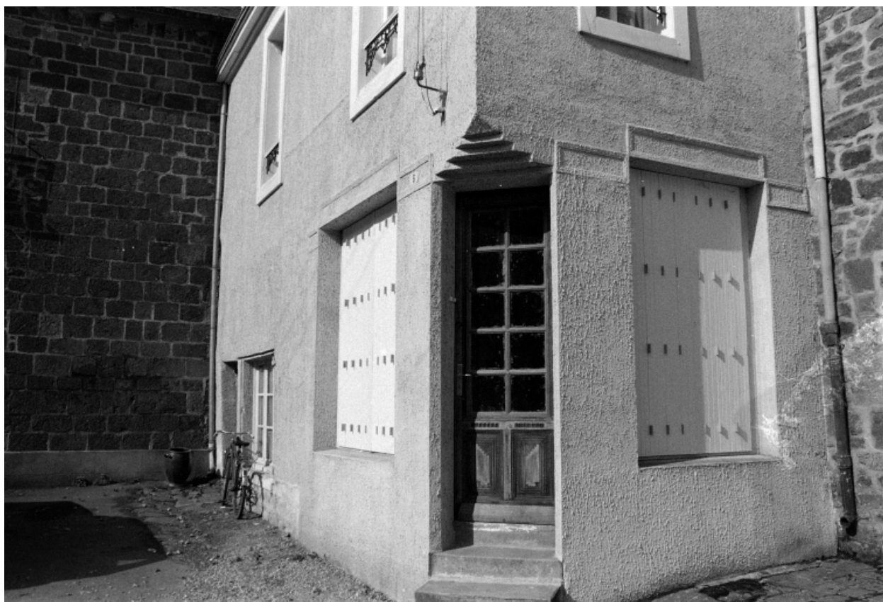
Le numéro 6 place de la Mairie en 1975