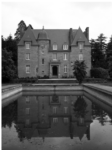
Vue générale : état en 1986