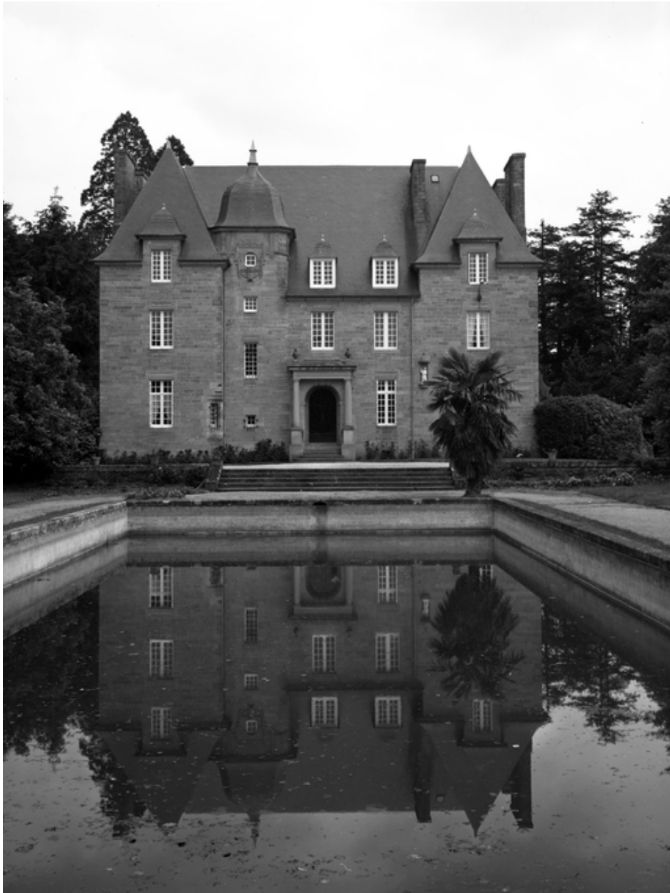
Vue générale : état en 1986