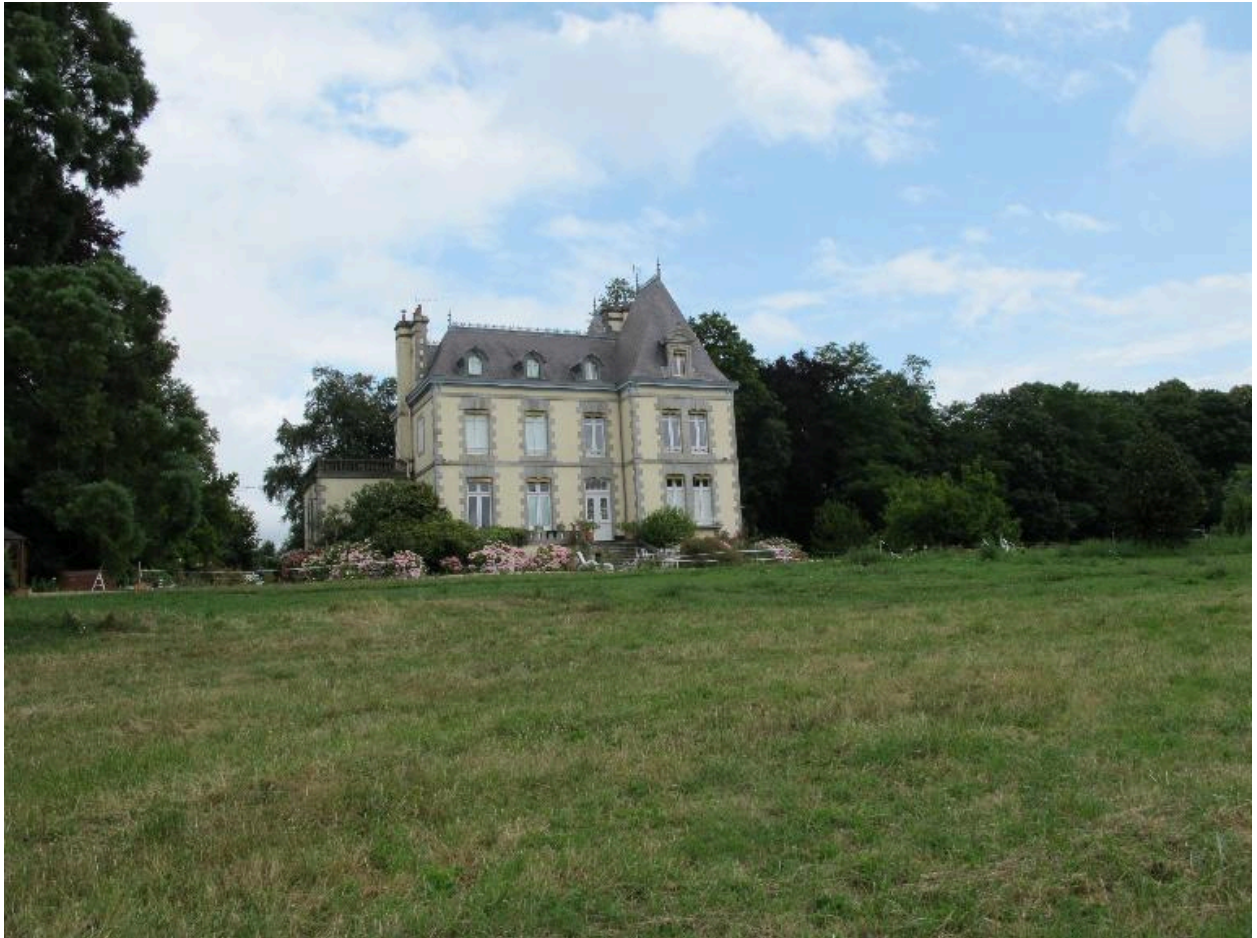
Villa-Château construite en 1884 par A. Jousseaume