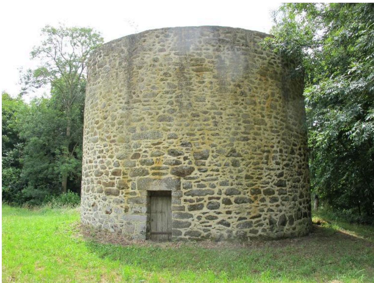
Colombier, vue générale