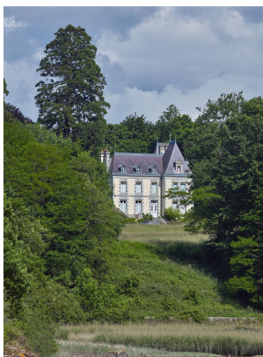
Le château depuis l'étang du moulin du Prat IVR53_20222200723NUCA