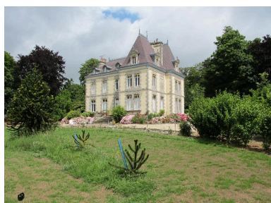
Vue générale prise de trois quart, depuis le jardin IVR53_20162206961NUCA