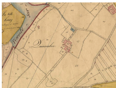
Extrait du cadastre de 1844, section J IVR53_20162206959NUCA