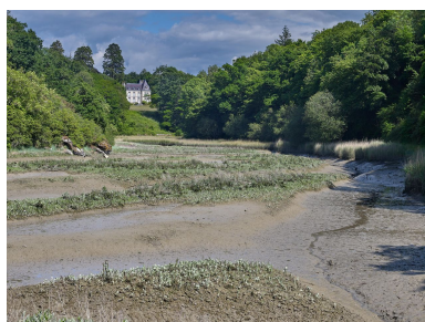
Le château depuis l'étang du moulin du Prat