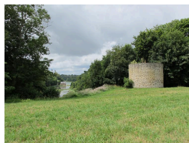
Colombier, date portée 1718 IVR53_20162206963NUCA