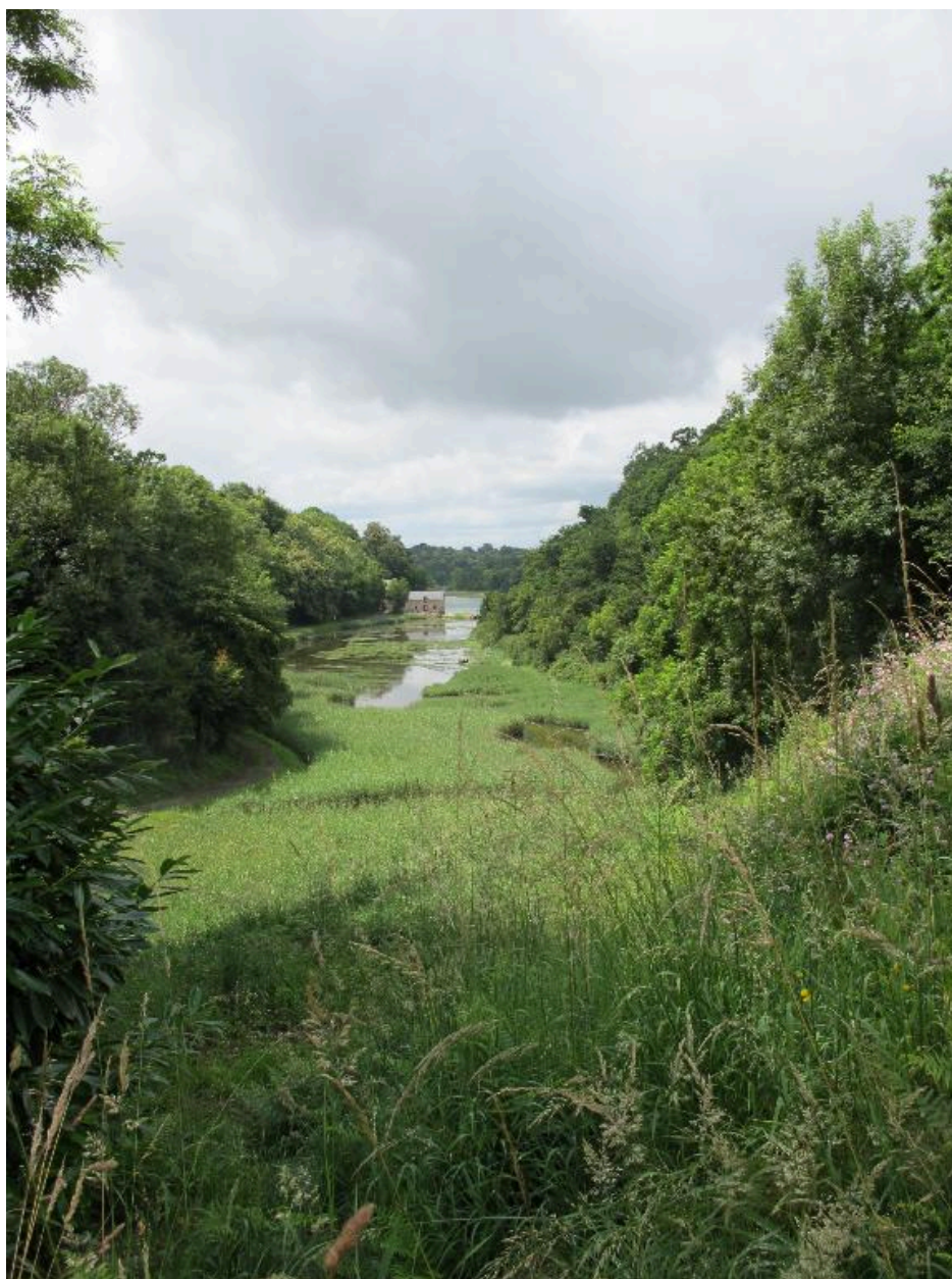
Vue paysagère, vers le moulin du Prat