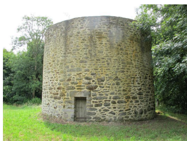
Colombier, vue générale IVR53_20162206965NUCA