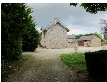
Ancien logis de Quincoubre transformé en ferme