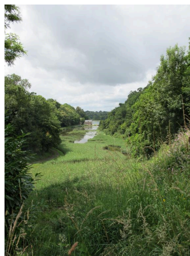
Vue paysagère, vers le moulin du Prat