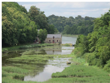
Vue paysagère, vers le moulin du Prat IVR53_20162206970NUCA