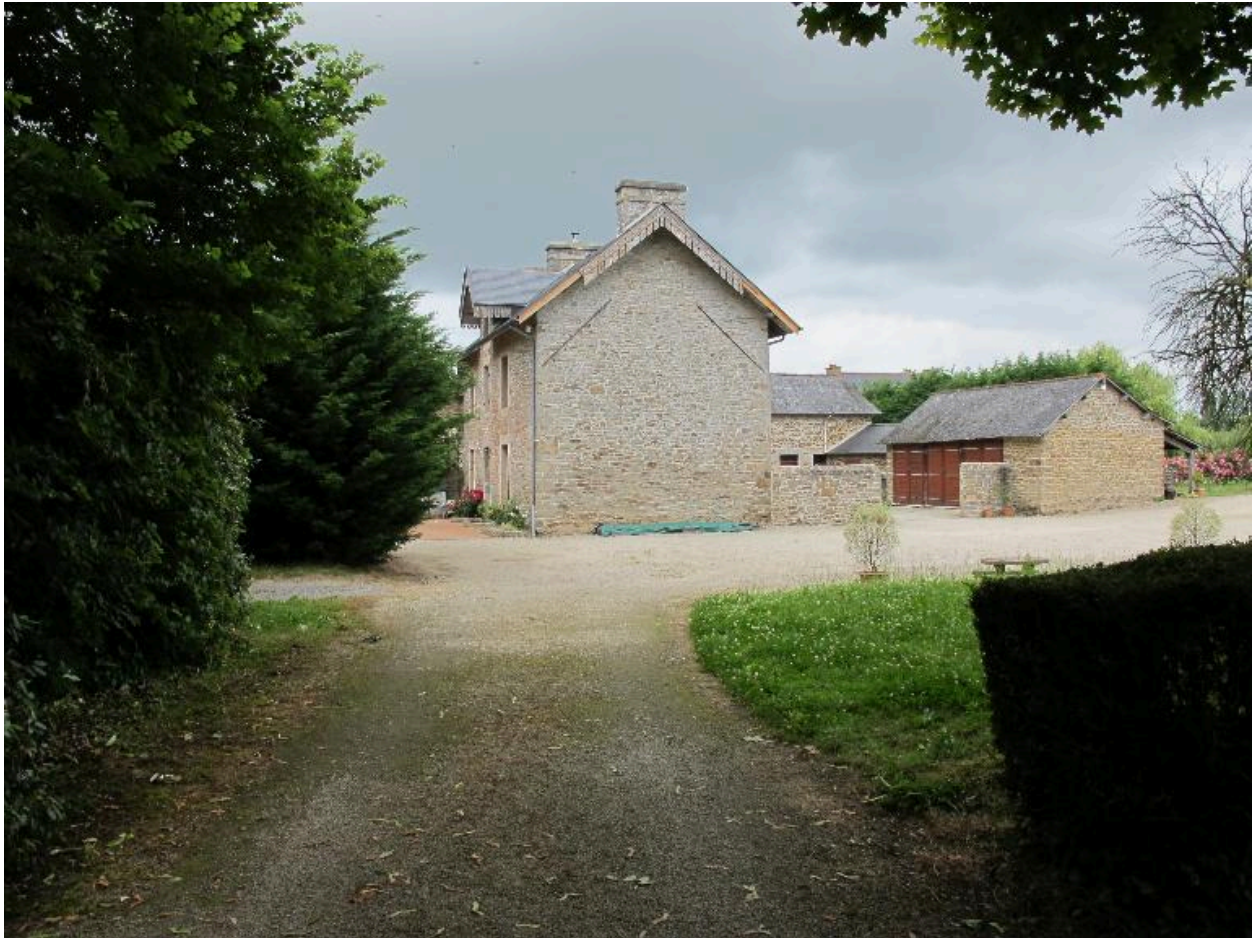
Ancien logis de Quincoubre transformé en ferme