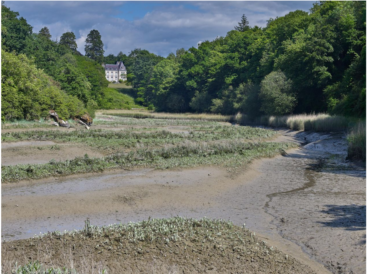
Le château depuis l'étang du moulin du Prat