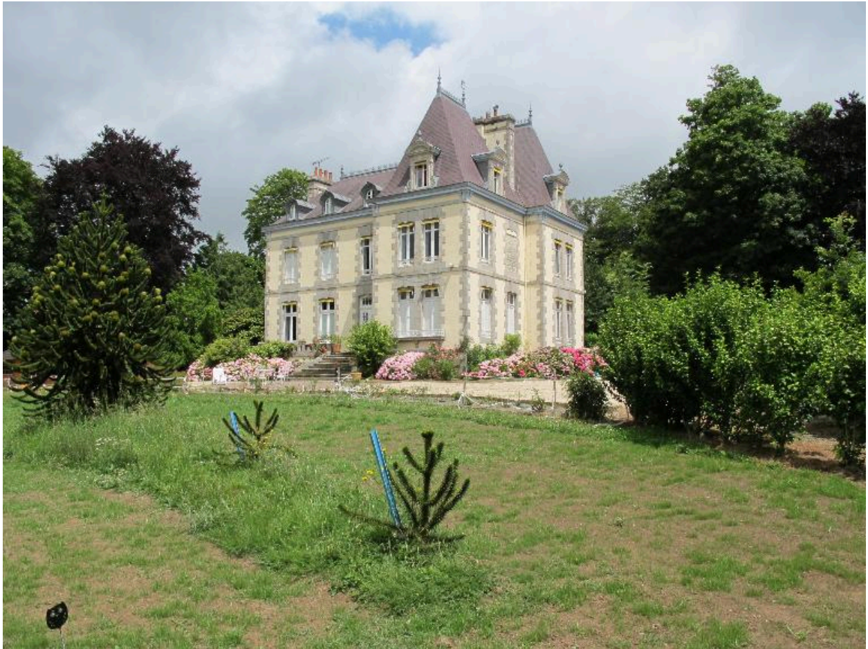
Vue générale prise de trois quart, depuis le jardin