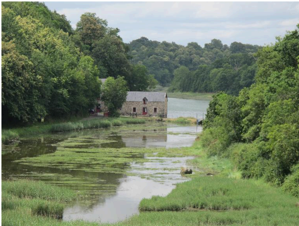
Vue paysagère, vers le moulin du Prat