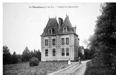
Carte postale vers 1900, l'élévation postérieure