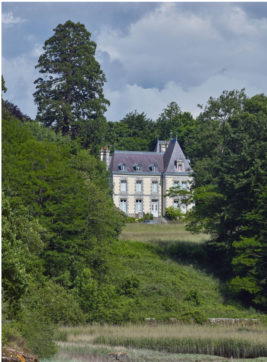
Le château depuis l'étang du moulin du Prat