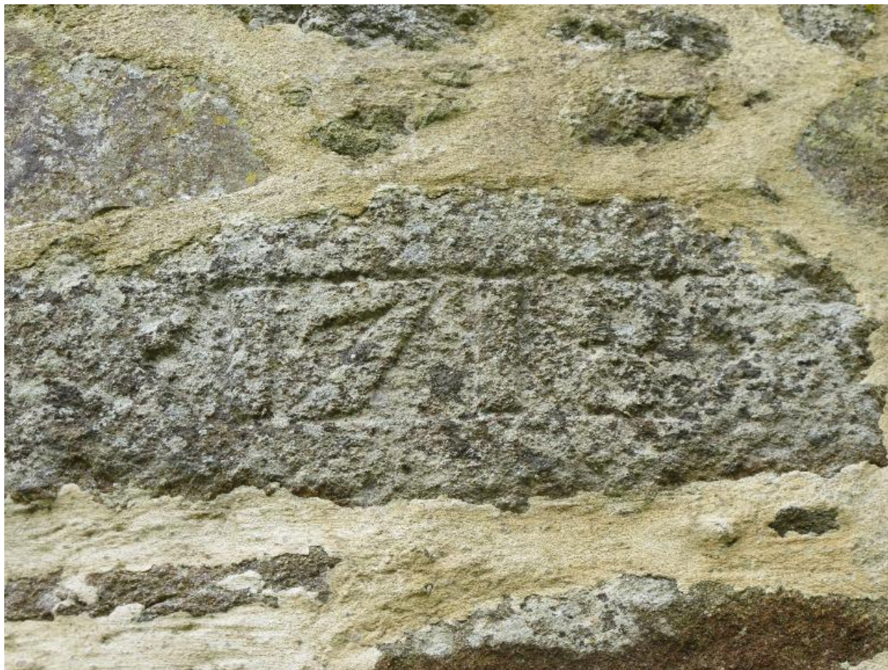
Colombier, date portée 1718