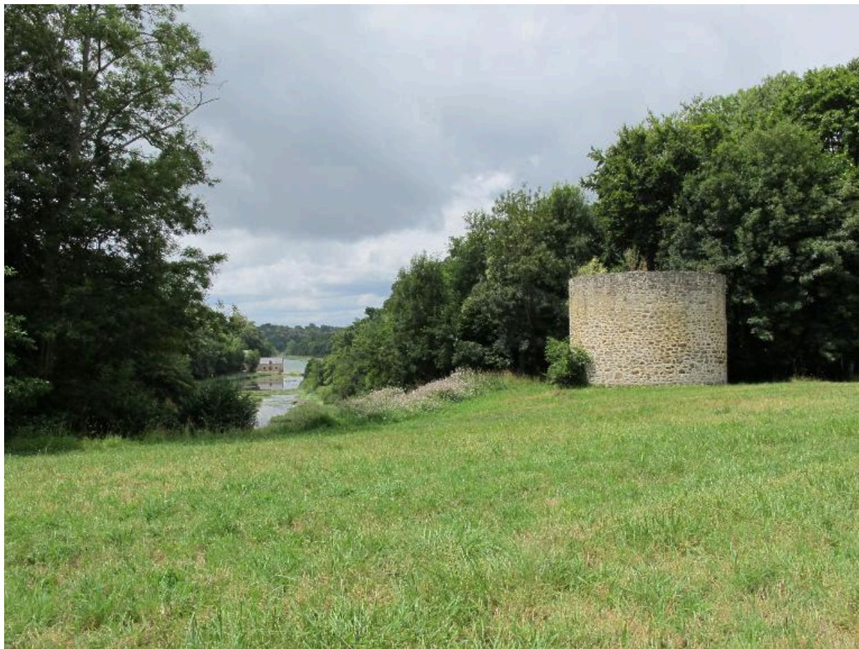
Colombier, date portée 1718