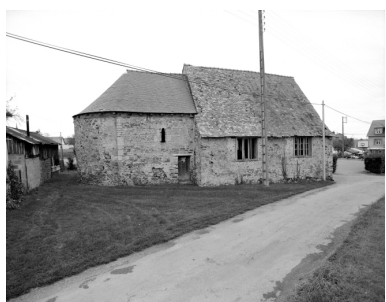
Vue générale nord ; état en 1992 IVR53_19923500865X