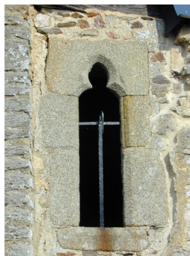
Détail ; fenêtre IVR53_20023518587NUCA