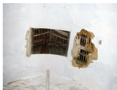
Vue intérieure ; détail IVR53_20023518580NUCA