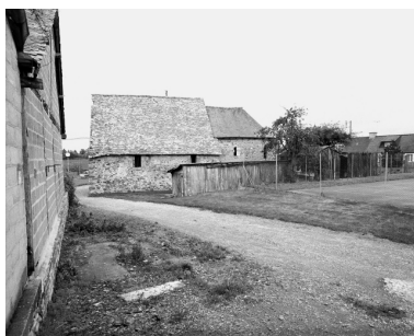
Vue de situation sud ; état en 1992 IVR53_19923500870X