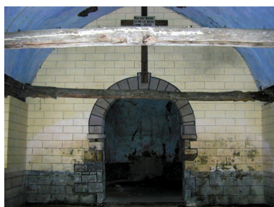
Vue intérieure ; détail IVR53_20023518585NUCA