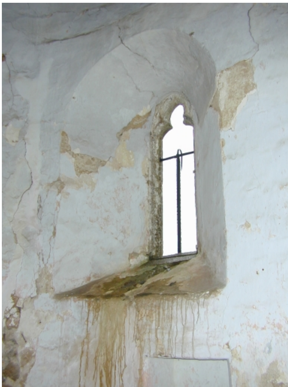
Vue intérieure ; détail