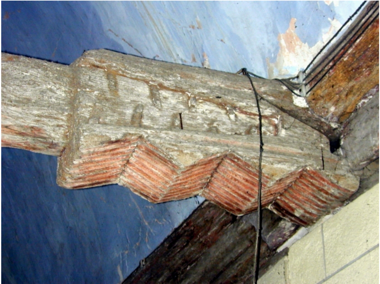
Vue intérieure ; détail