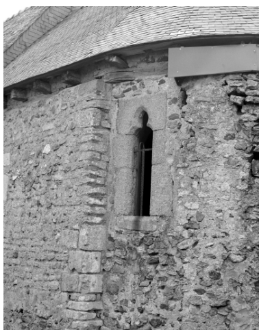
Détail ; fenêtre sud est IVR53_19923500867X