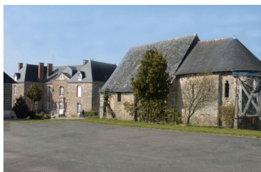
Vue de situation sud est IVR53_20033500704NUCA