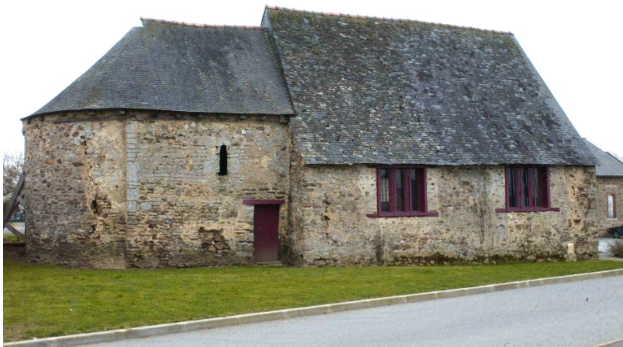
Vue générale nord