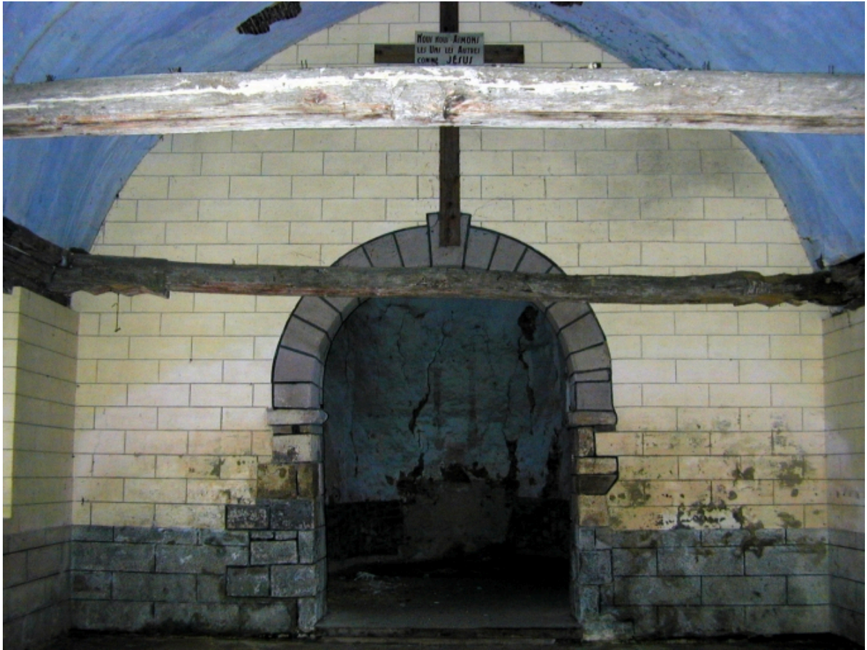
Vue intérieure ; détail