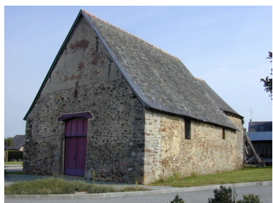
Vue générale sud ouest IVR53_20023518586NUCA