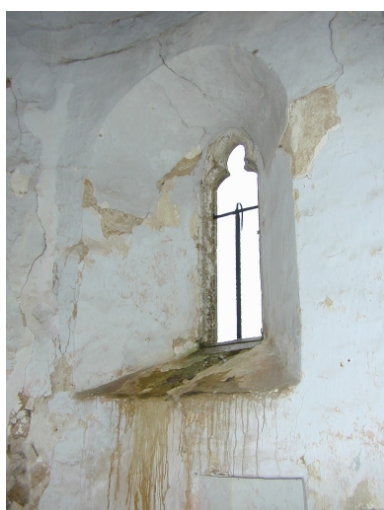
Vue intérieure ; détail IVR53_20023518581NUCA