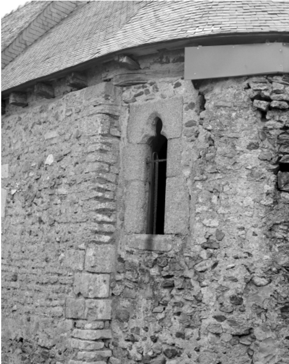
Détail ; fenêtre sud est