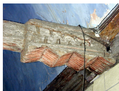
Vue intérieure ; détail IVR53_20023518584NUCA