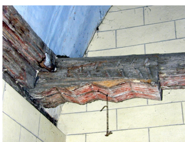
Vue intérieure ; détail IVR53_20023518583NUCA