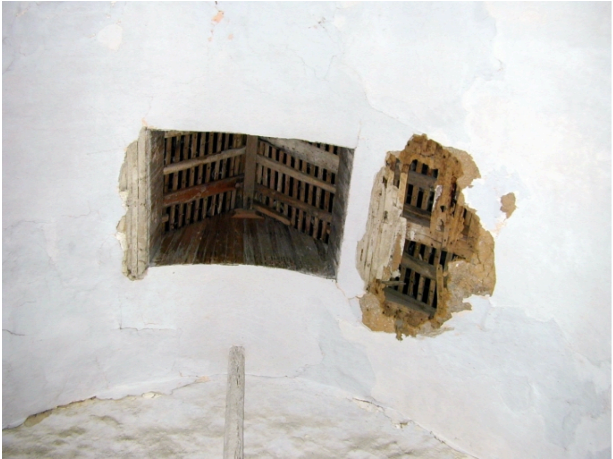
Vue intérieure ; détail