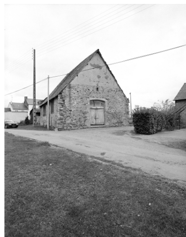
Vue générale ouest ; état en 1992, IVR53_19923500869X