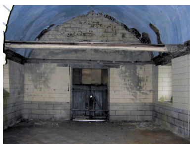
Vue intérieure IVR53_20023518582NUCA