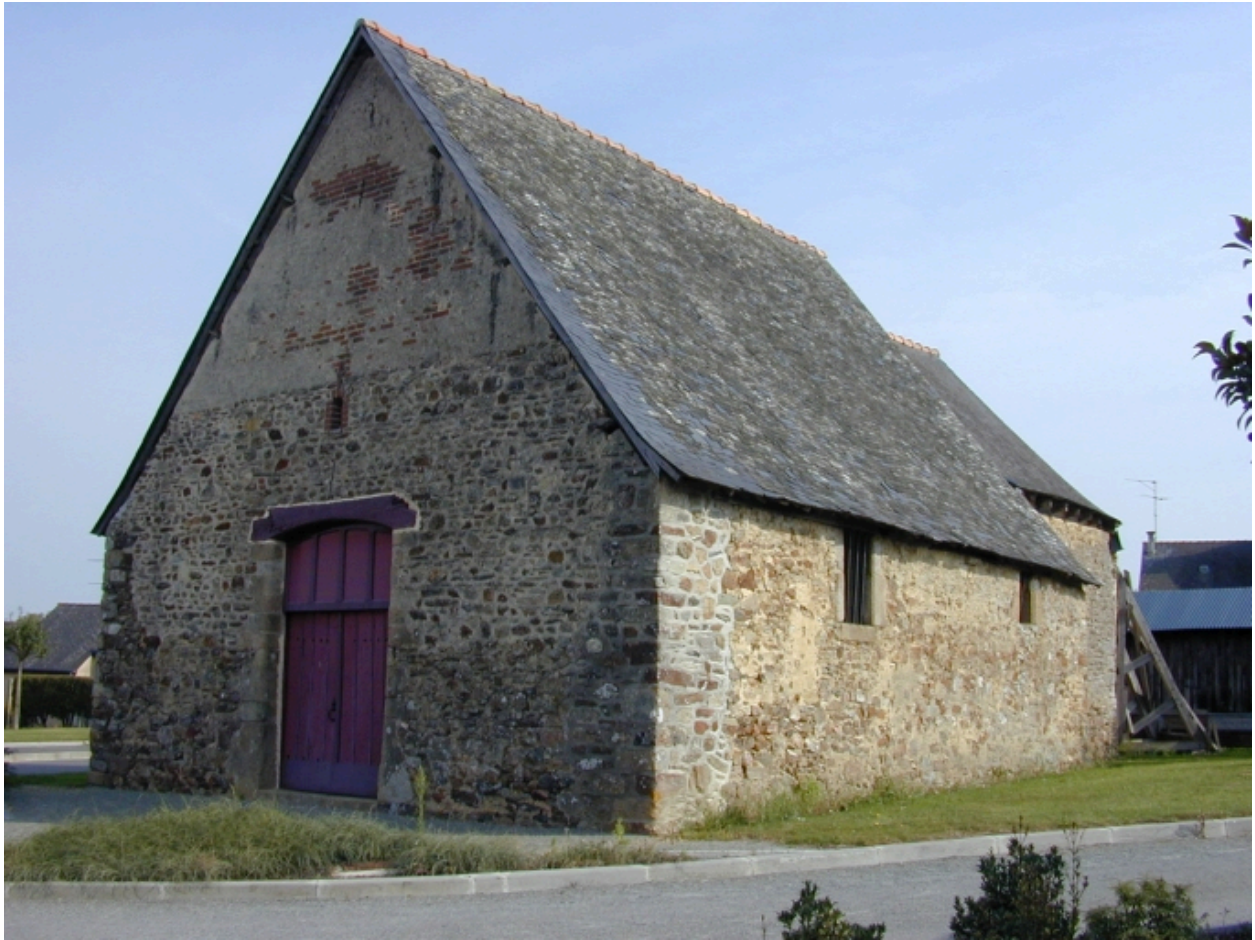
Vue générale sud ouest