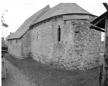
Vue générale sud est ; état en 1992 IVR53_19923500866X