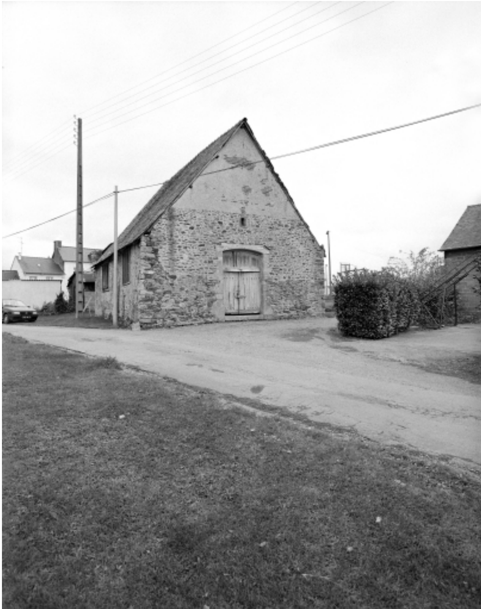
Vue générale ouest ; état en 1992