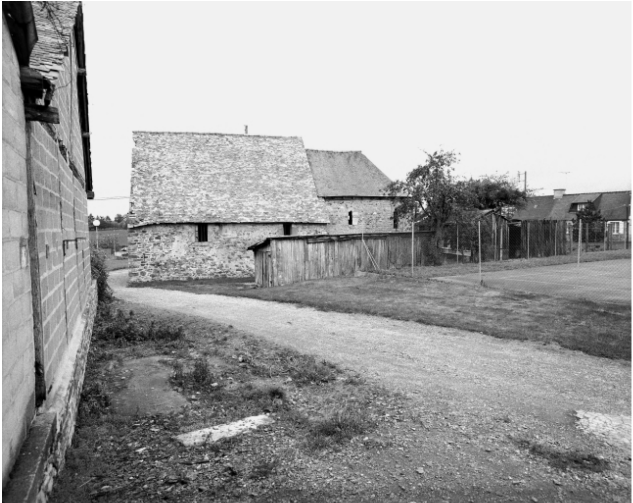
Vue de situation sud ; état en 1992