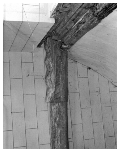
Vue intérieure ; détail, entrait sculpté IVR53_19923500872X