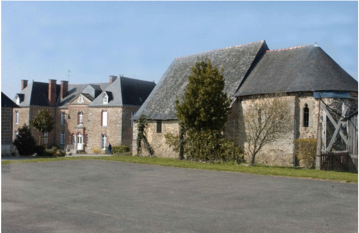
Vue de situation sud est