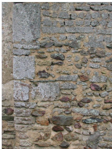
Détail ; chaînage d'angle en calcaire coquillier IVR53_20033508260NUCA