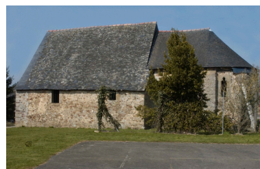
Vue générale sud IVR53_20033500703NUCA