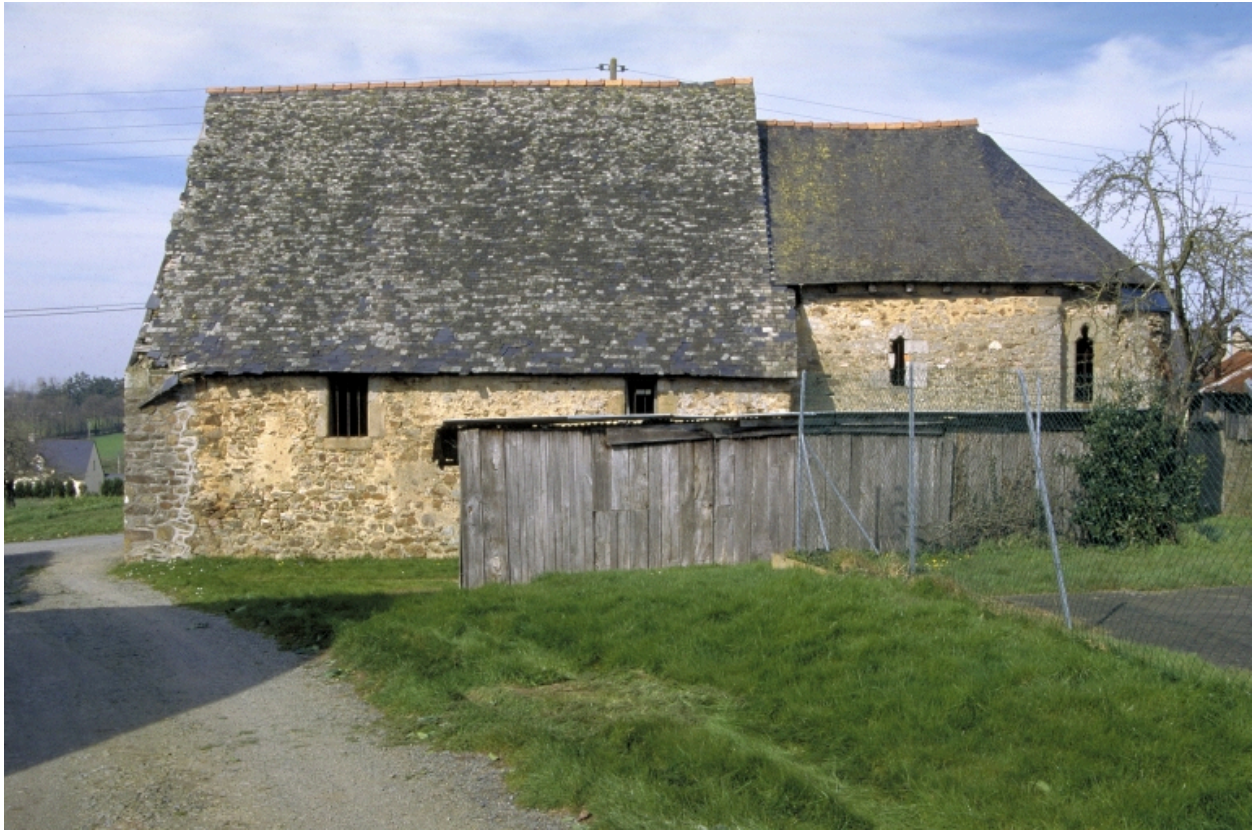
Vue générale sud ; état en 1994