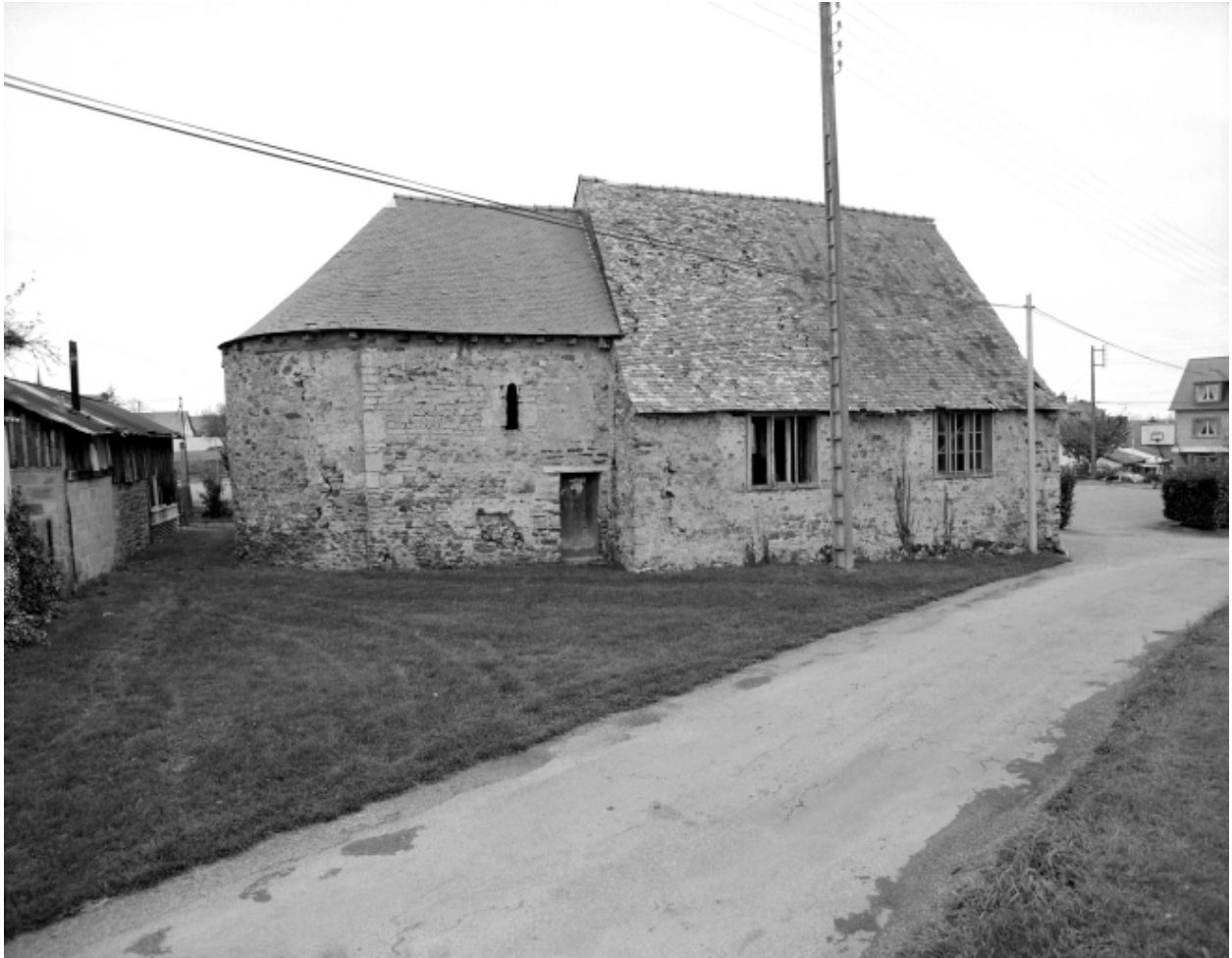
Vue générale nord ; état en 1992