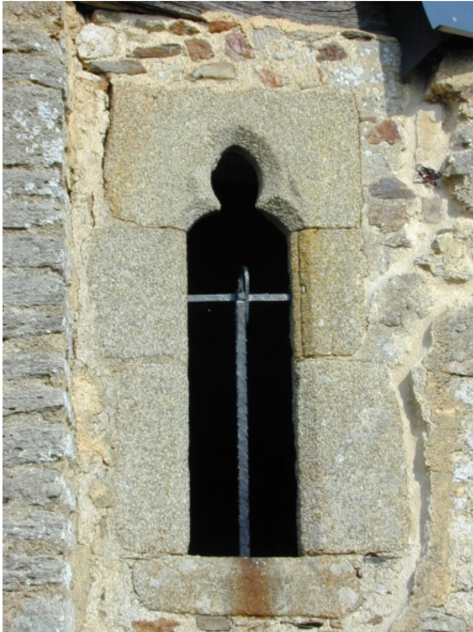
Détail ; fenêtre