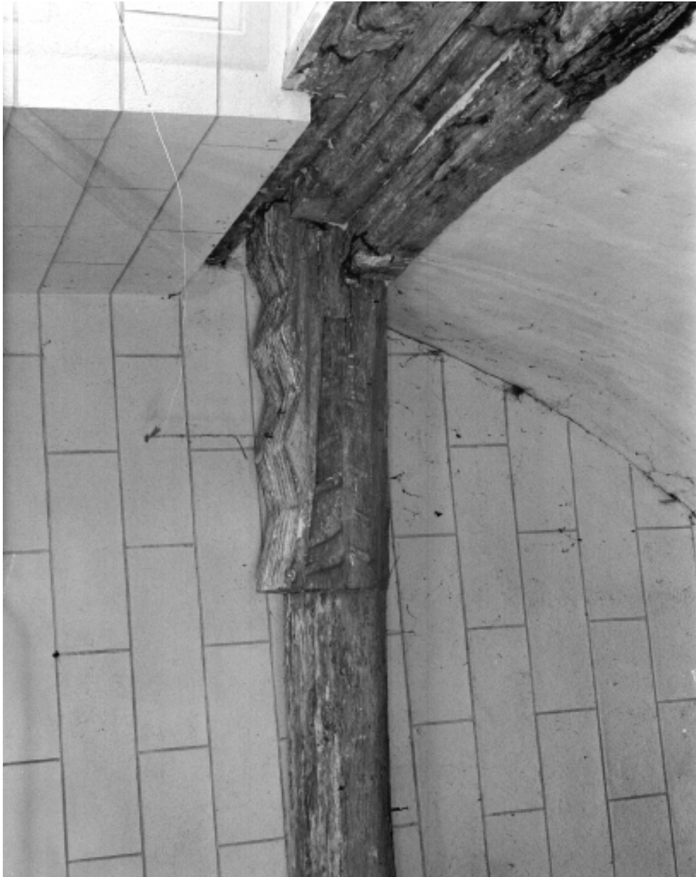
Vue intérieure ; détail, entrait sculpté