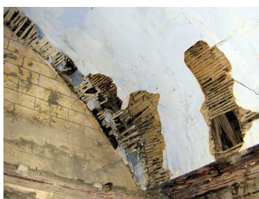
Vue intérieure ; détail IVR53_20023518579NUCA