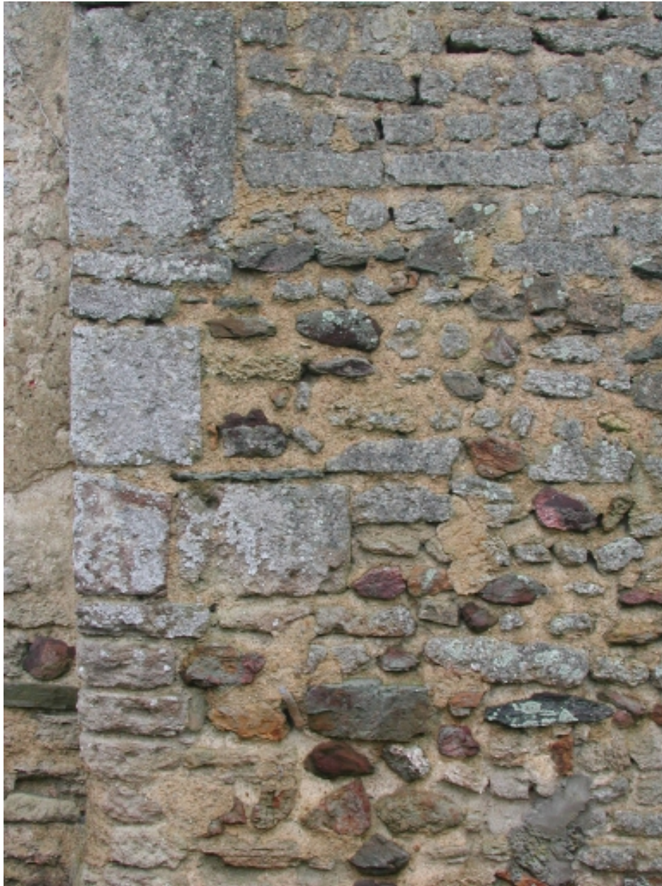
Détail ; chaînage d'angle en calcaire coquillier