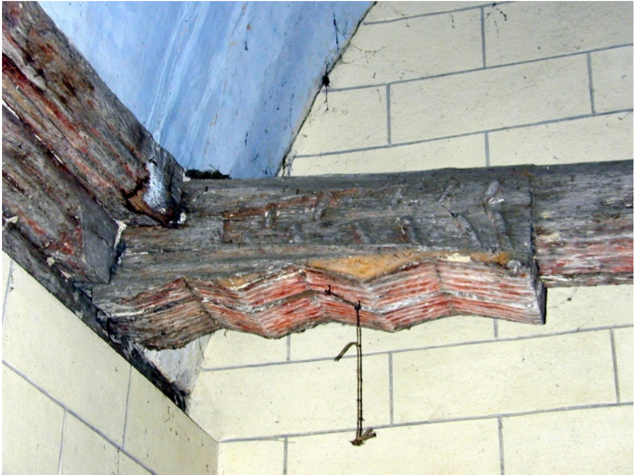
Vue intérieure ; détail