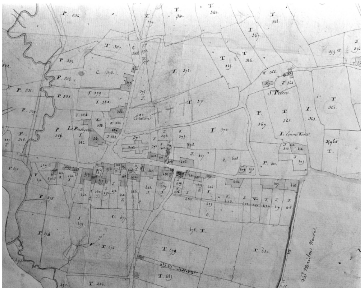
Le cadastre de 1810