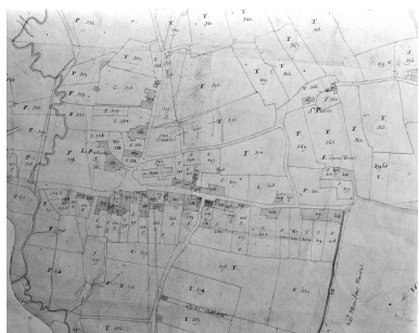
Le cadastre de 1810