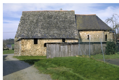
Vue générale sud ; état en 1994 IVR53_19943502452ZA