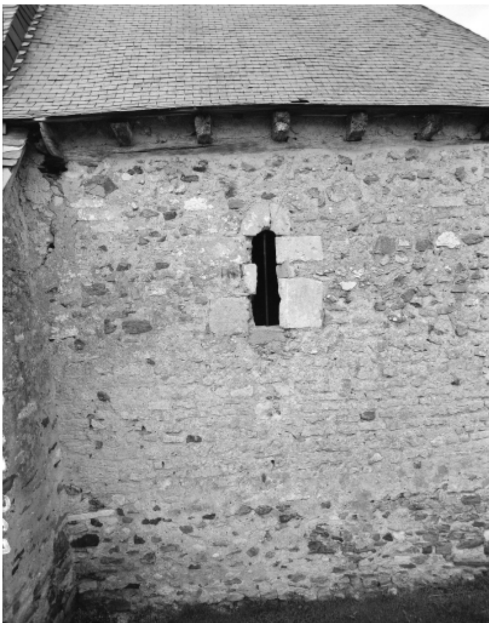
Détail ; mur nord, fenêtre romane