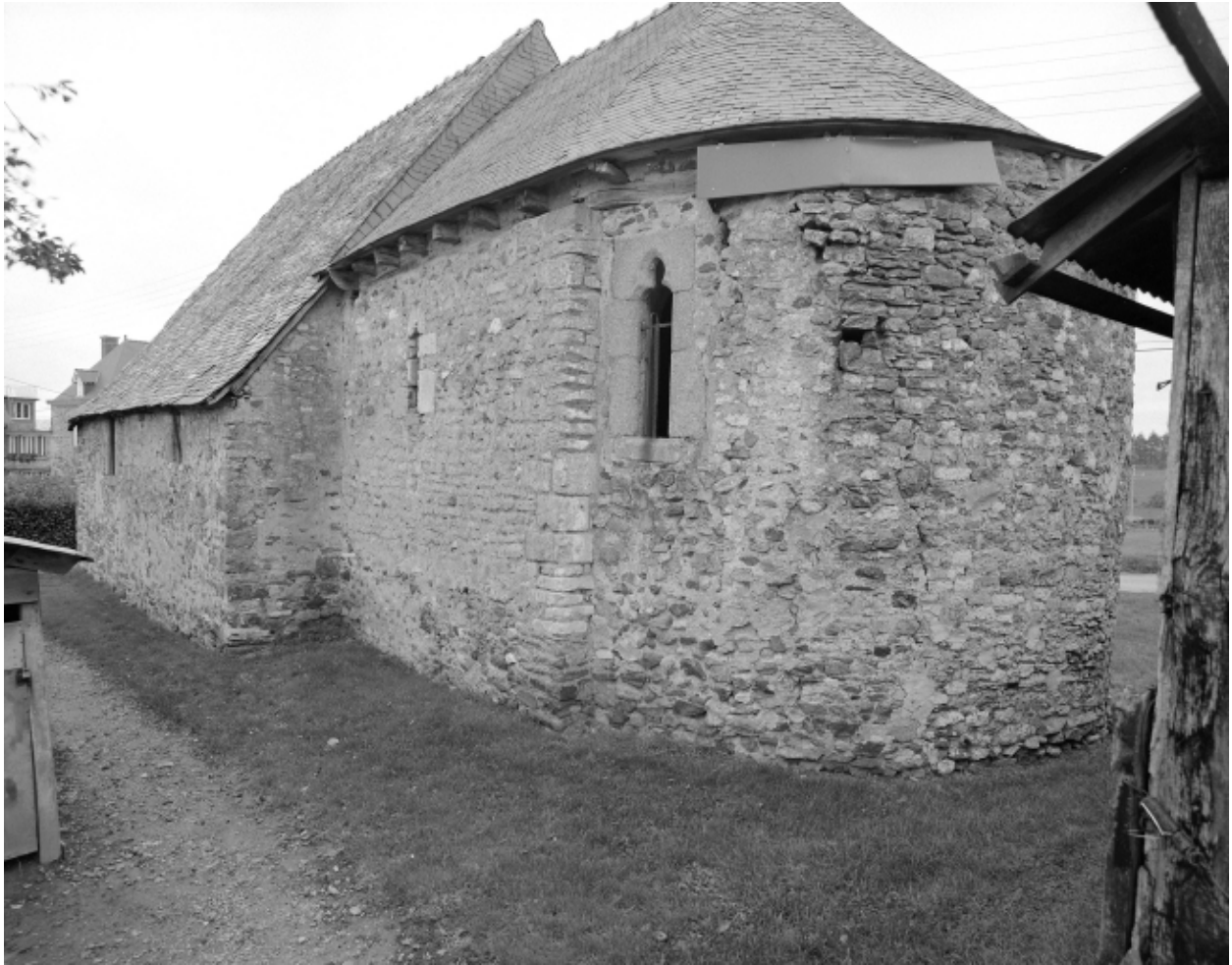
Vue générale sud est ; état en 1992