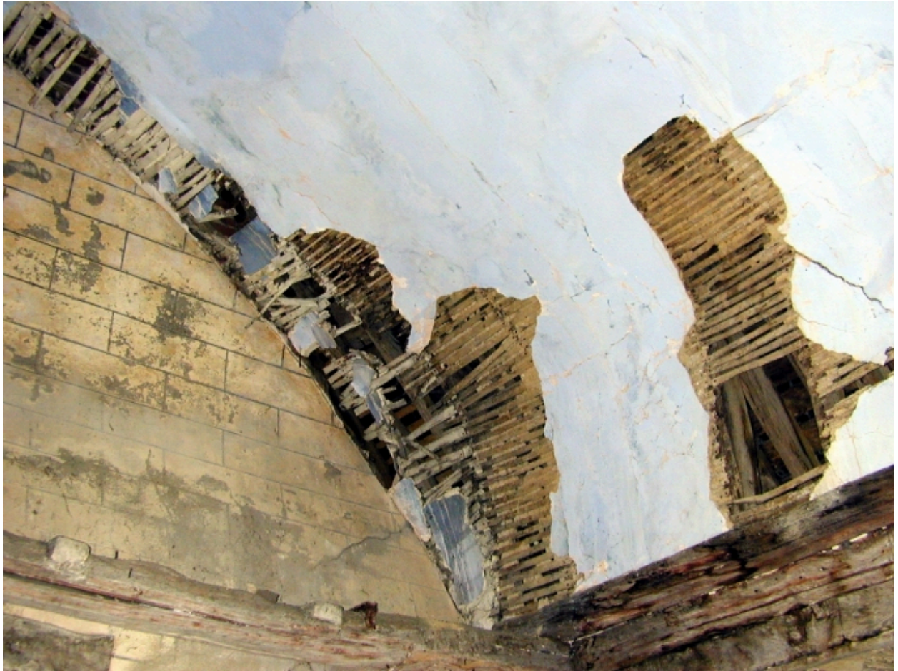
Vue intérieure ; détail