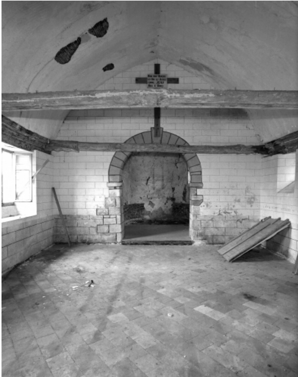
Vue générale vers le choeur