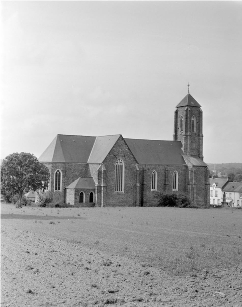
Vue générale nord-est