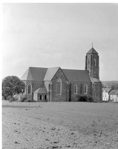
Vue générale nord-est IVR53_19943501032X