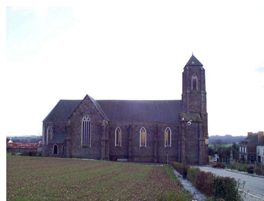
Vue générale nord IVR53_19993503901NUCA