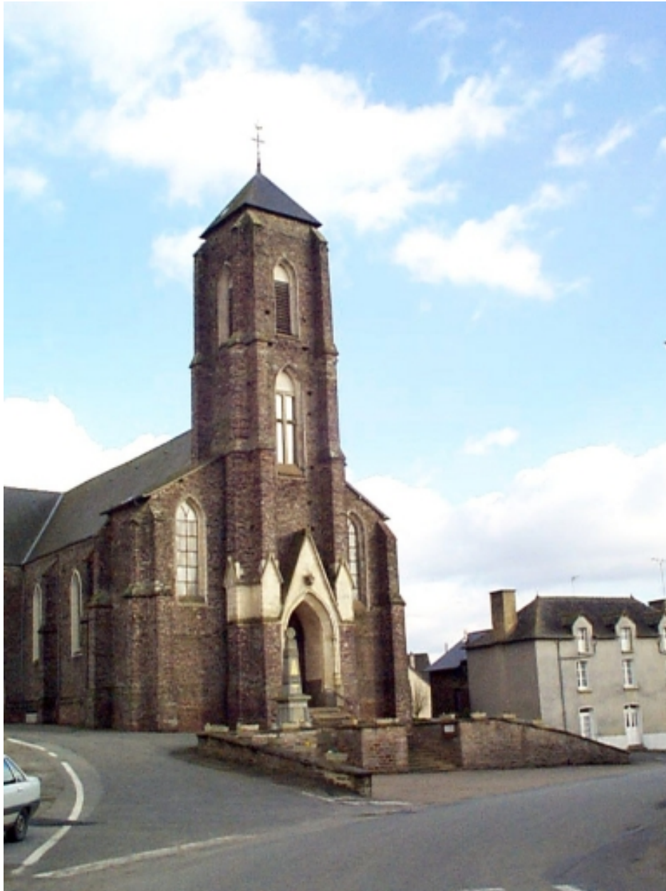
Le clocher : vue générale nord-ouest