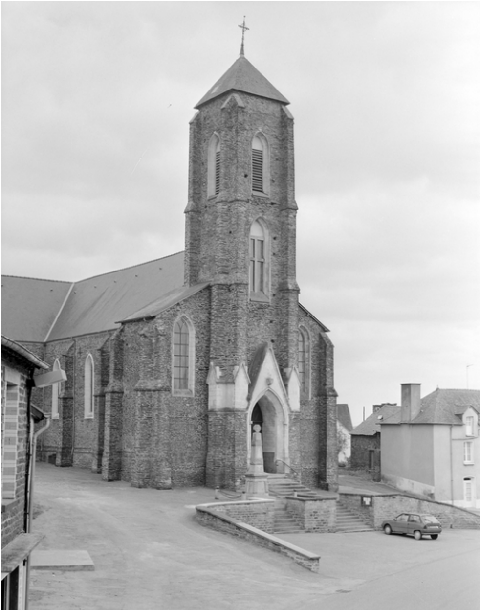
Le clocher : vue générale nord-ouest