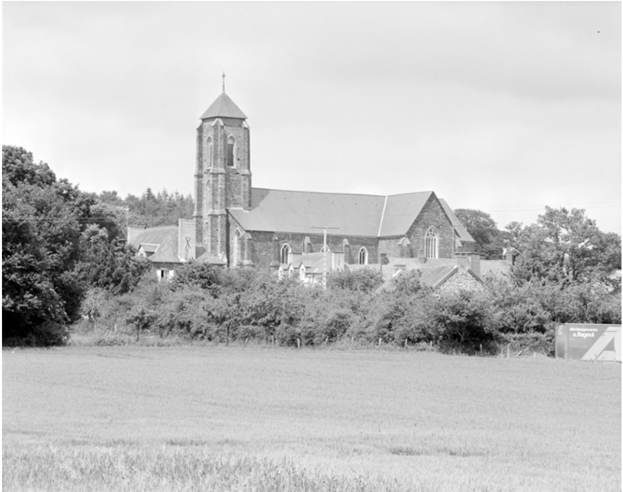
Vue de situation sud-ouest