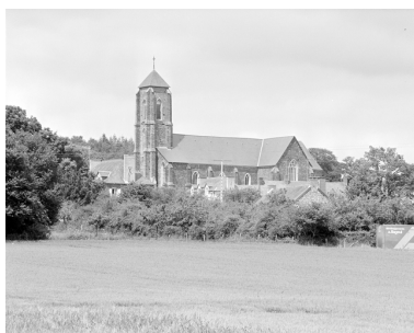
Vue de situation sud-ouest IVR53_19943501053X