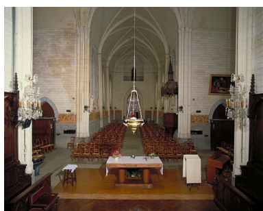
Vue intérieure prise du chœur vers la nef IVR53_19993502545XA