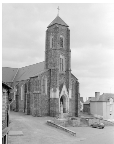
Le clocher : vue générale nord-ouest IVR53_19943501054X