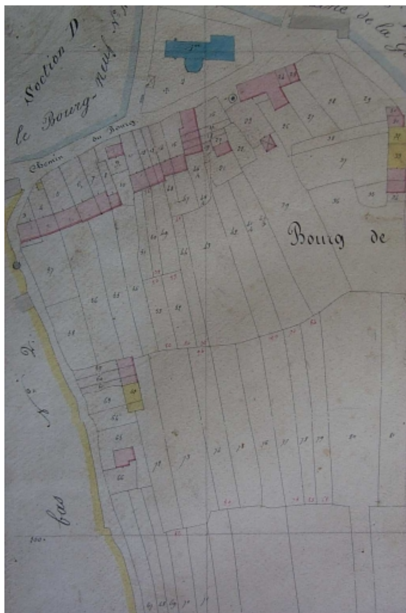
L'ancienne église sur le cadastre napoléonien