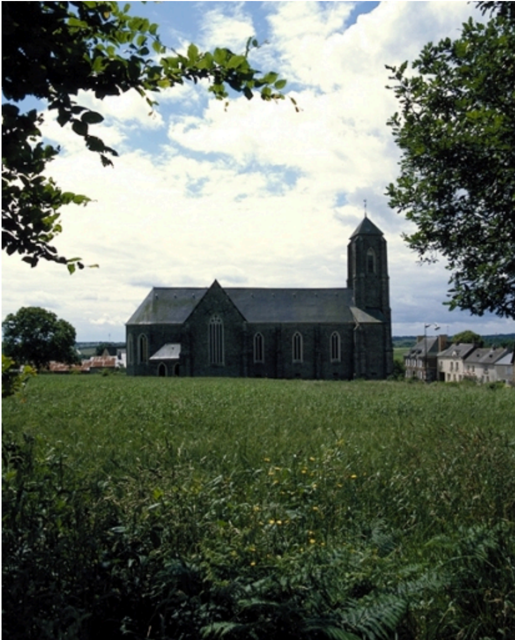
Vue générale nord