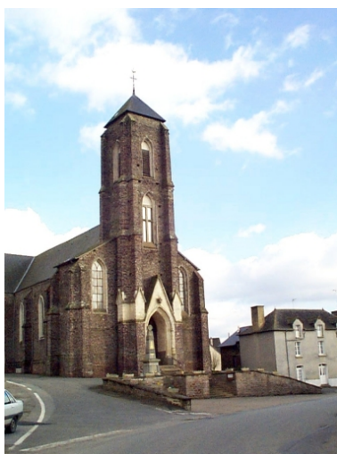
Le clocher : vue générale nord-ouest IVR53_19993503905NUCA