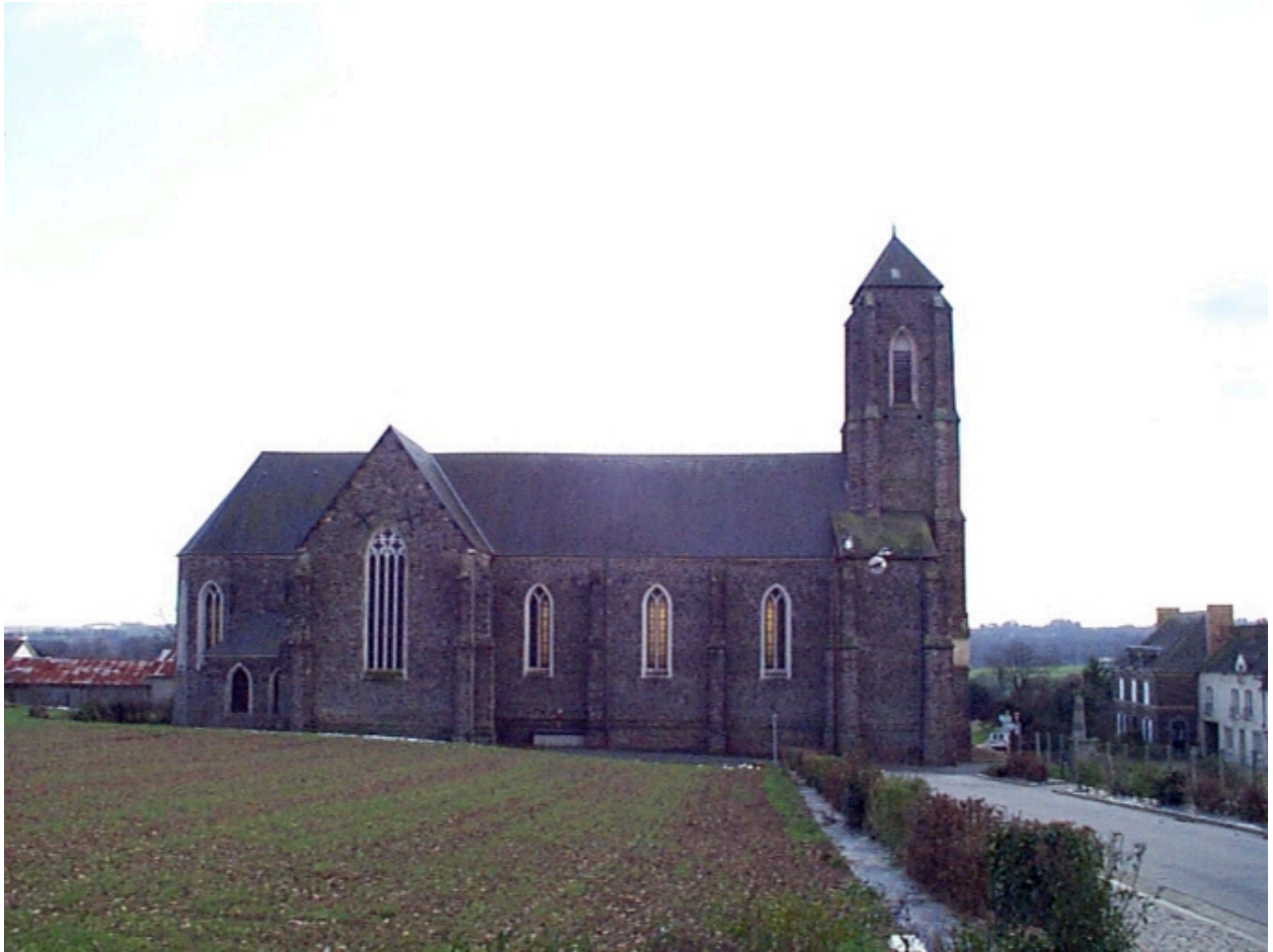
Vue générale nord