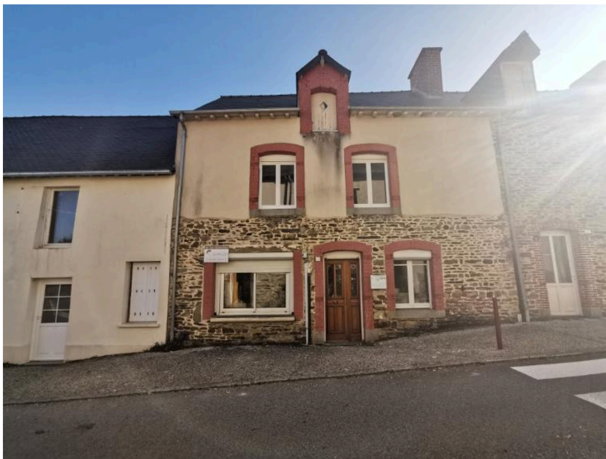
5 Rue du Vieux Bourg