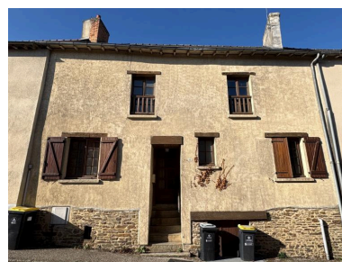
Rue du Vieux bourg IVR53_20253531932NUCA