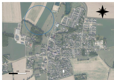
Carte zone humide IVR53_20263510436NUCA