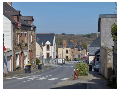
Rue des calvaires IVR53_20263500228NUCA