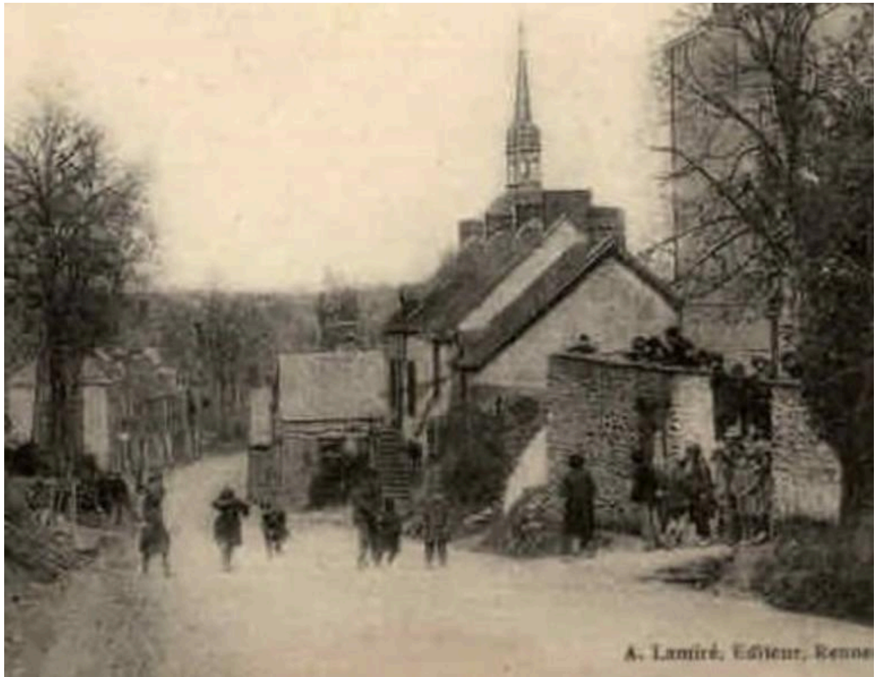
Carte postale rue des Calvaires