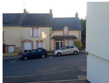
9 rue des Calvaire IVR53_20253531384NUCA