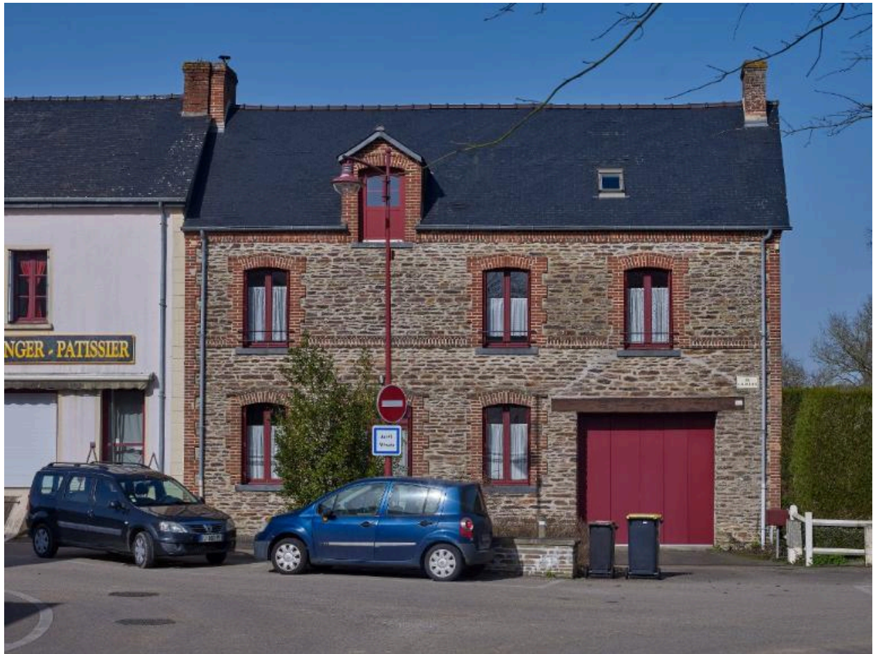
Maison 15 rue du vieux bourg