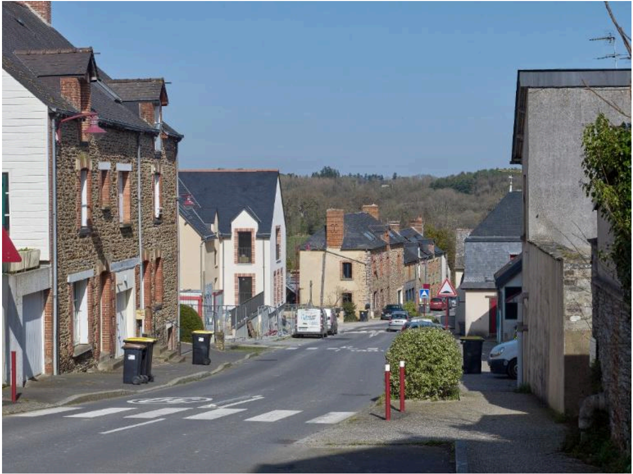
Rue des calvaires