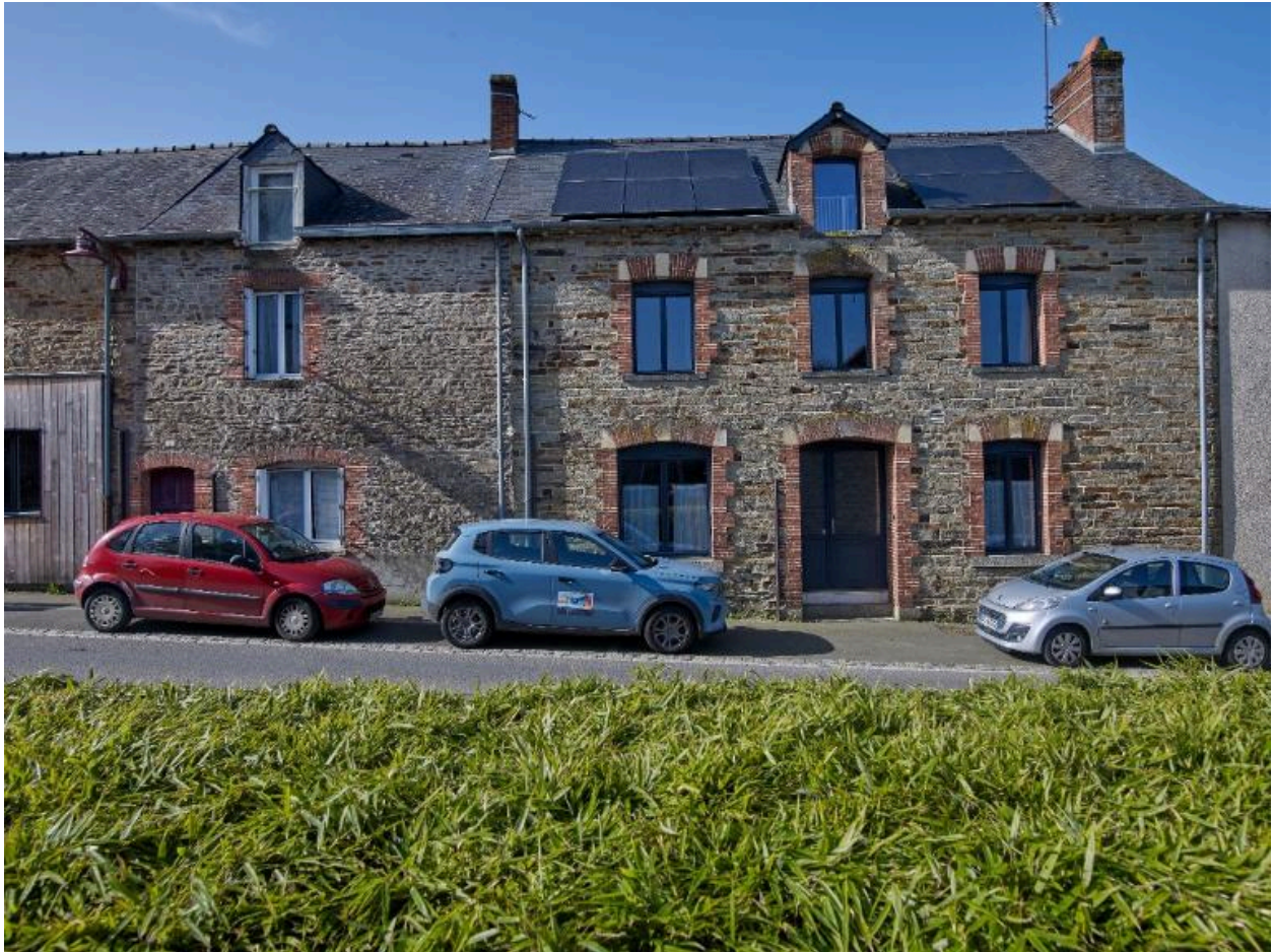
Façade ouest de l'alignement de maisons