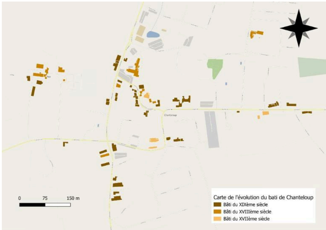
Evolution du Bati dans le bourg de Chanteloup