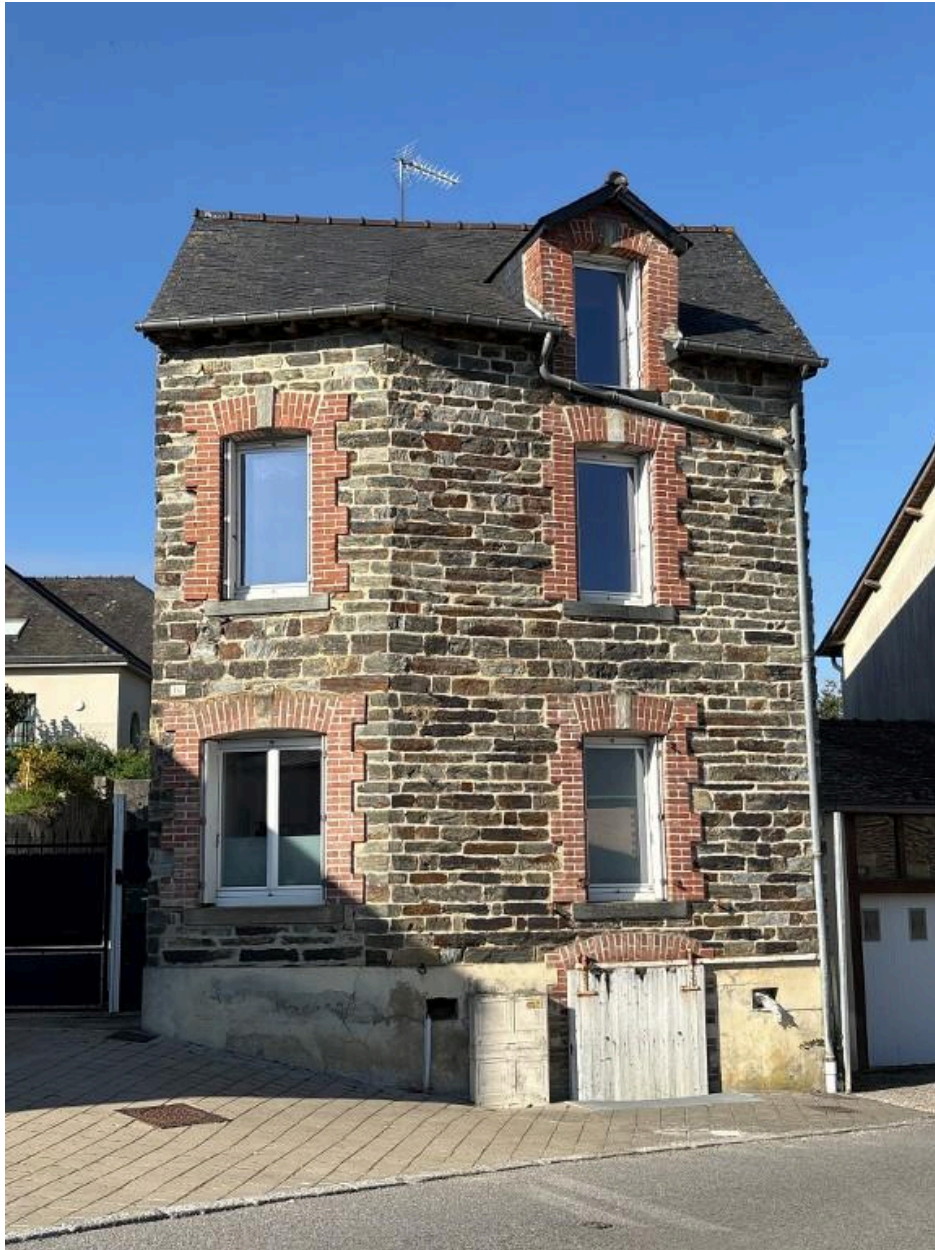
16 rue du Vieux Bourg