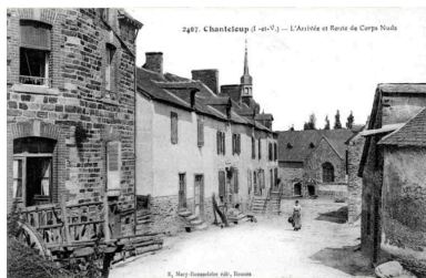
Vue du bourg IVR53_20263510437NUCA