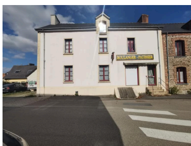
13 rue du Vieux bourg IVR53_20263520017NUCA