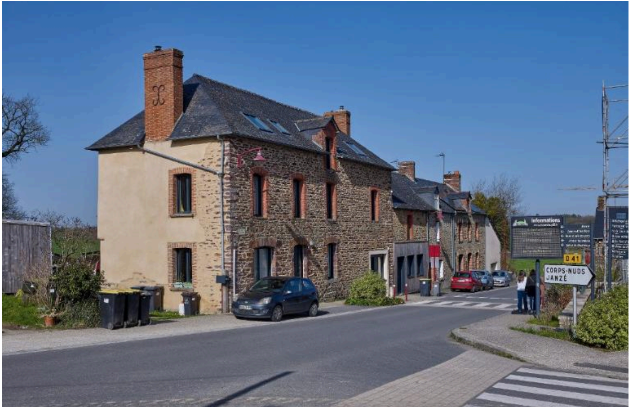
alignement rue des calvaires