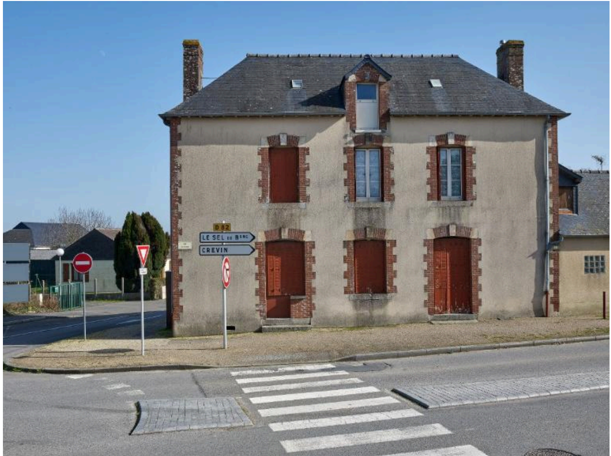
Maison construite au départ de la rue de Bellevue