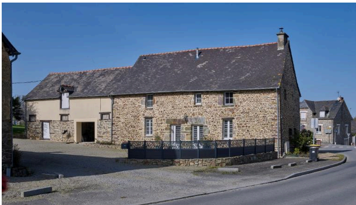
Ferme du bourg