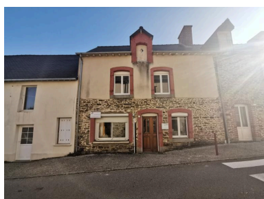
5 Rue du Vieux Bourg IVR53_20253531929NUCA