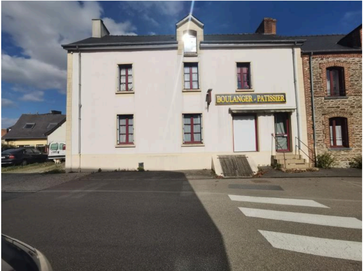
13 rue du Vieux bourg