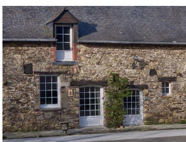
Détail ferme du bourg IVR53_20263500249NUCA