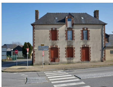
Maison construite au départ de la rue de Bellevue IVR53_20263500227NUCA