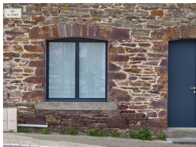
Détail arc segmentaire IVR53_20263500523NUCA