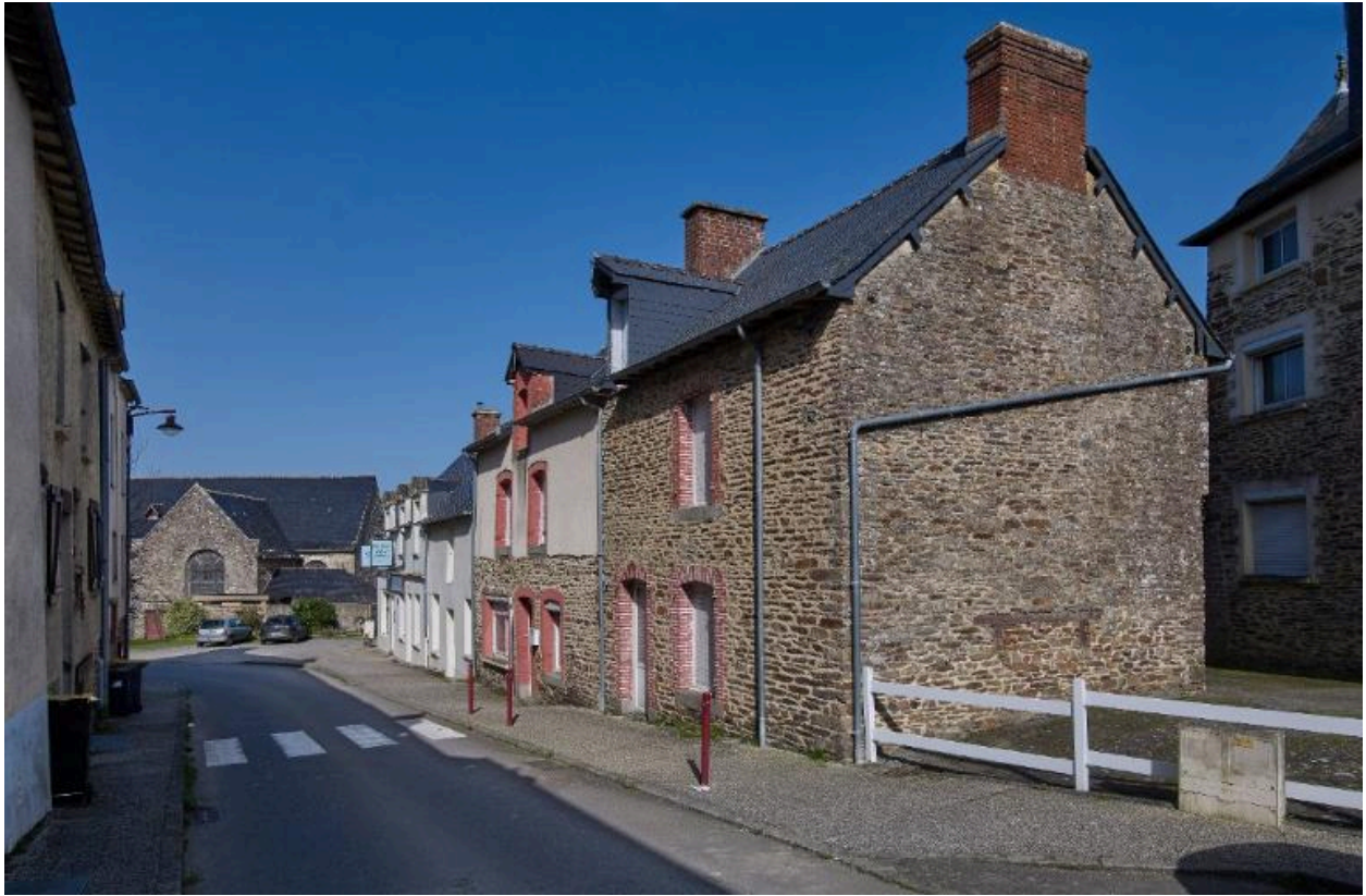
Alignement de maisons de la rue du Vieux Bourg