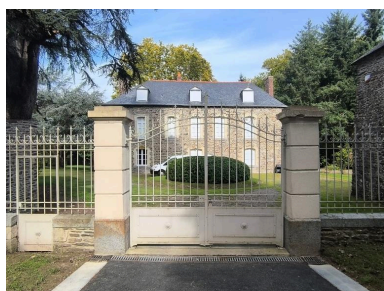
Manoir de la Retenue IVR53_20263520041NUCA