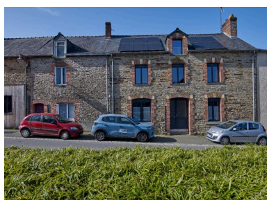
Façade ouest de l'alignement de maisons IVR53_20263500232NUCA