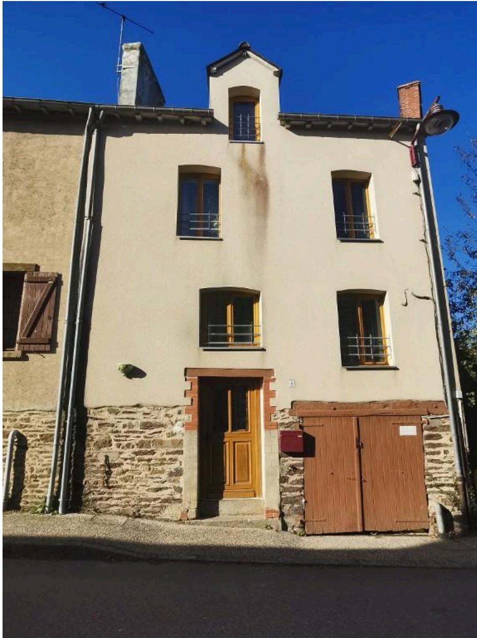
8 rue du Vieux Bourg