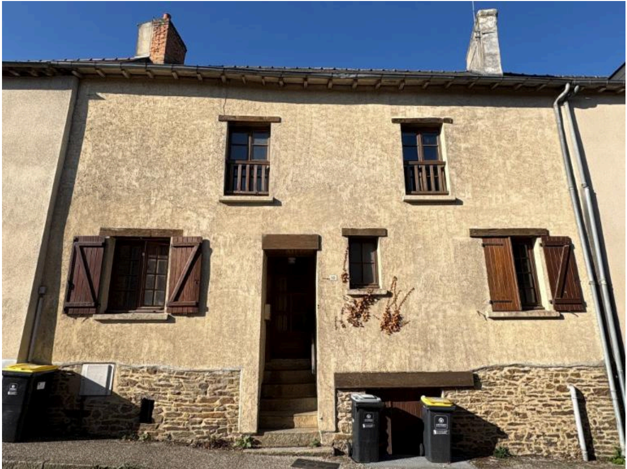
Rue du Vieux bourg