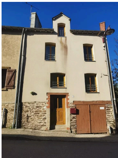
8 rue du Vieux Bourg