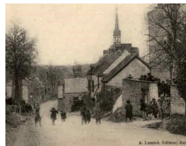
Carte postale rue des Calvaires