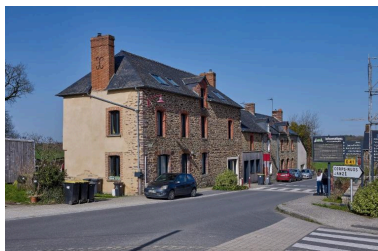
alignement rue des calvaires IVR53_20263500229NUCA