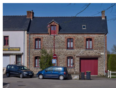
Maison 15 rue du vieux bourg IVR53_20263500236NUCA