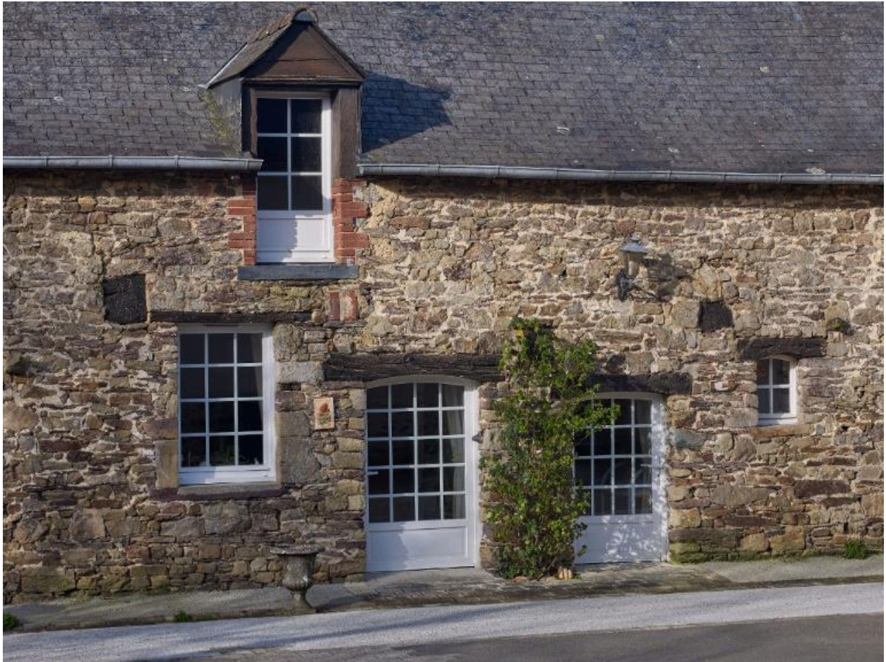
Détail ferme du bourg