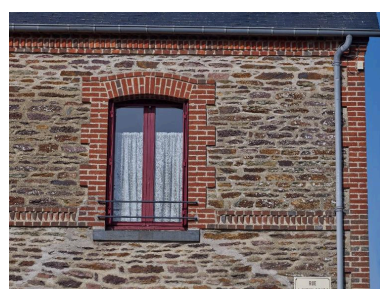
Détail encadrement de fenêtre en brique IVR53_20263500238NUCA