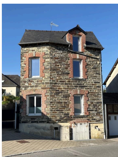
16 rue du Vieux Bourg IVR53_20253531935NUCA