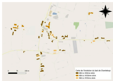
Evolution du Bati dans le bourg de Chanteloup