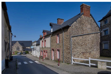
Alignement de maisons de la rue du Vieux Bourg IVR53_20263500235NUCA