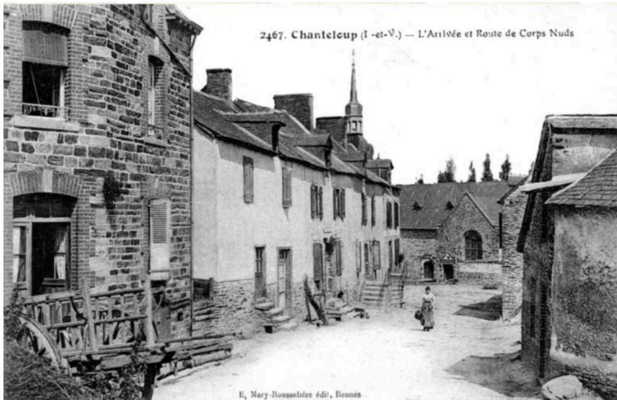
Vue du bourg