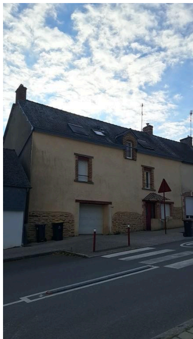
5 rue des calvaires