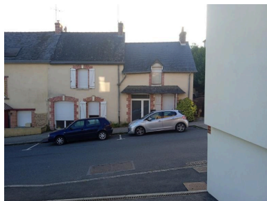
Rue des calvaires