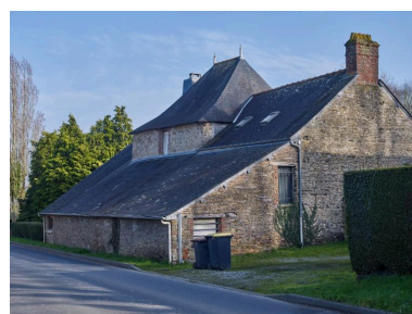
Manoir de la retenue IVR53_20263500250NUCA