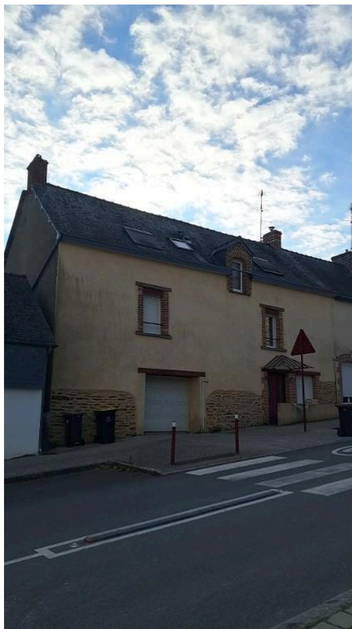
5 rue des calvaires