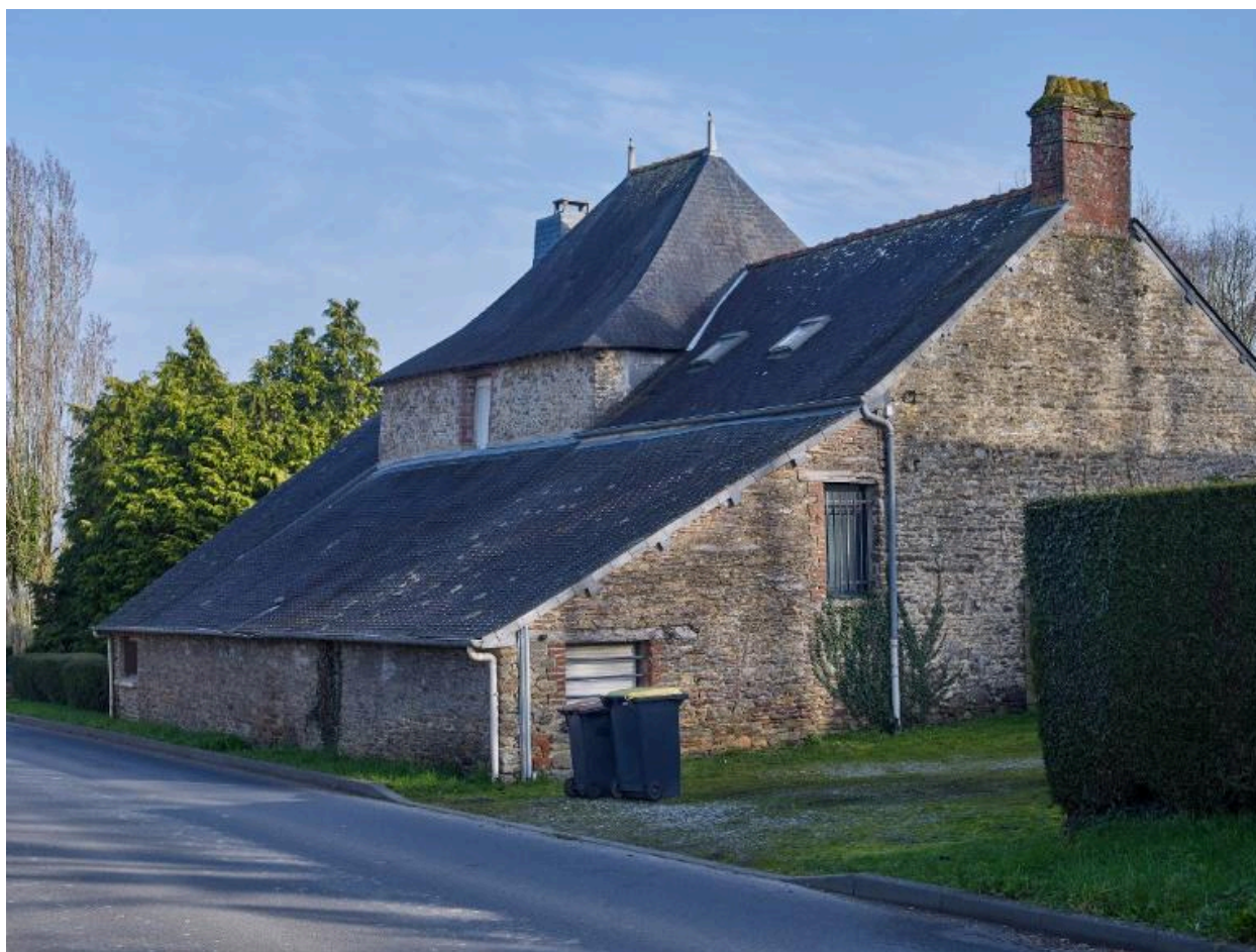
Manoir de la retenue