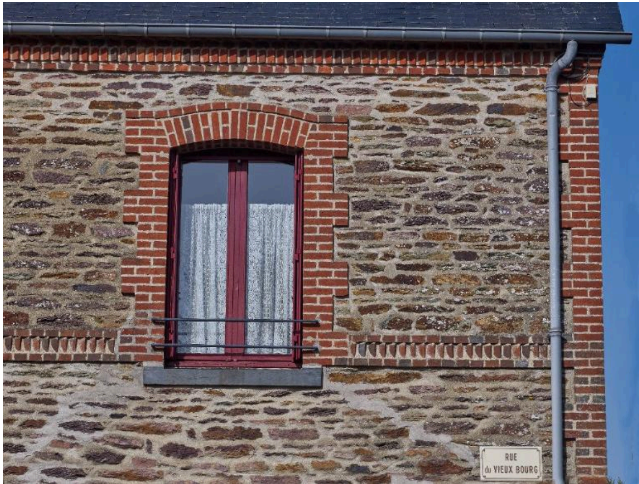
Détail encadrement de fenêtre en brique