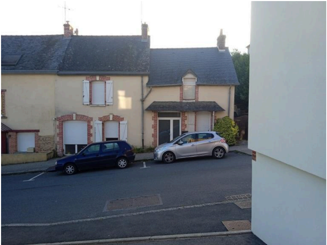
Rue des calvaires