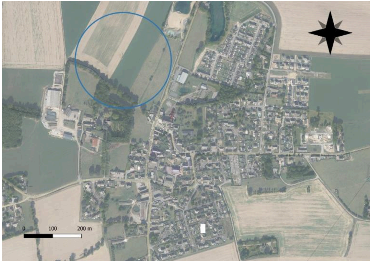
Carte zone humide