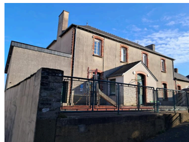
Mairie IVR53_20253531389NUCA