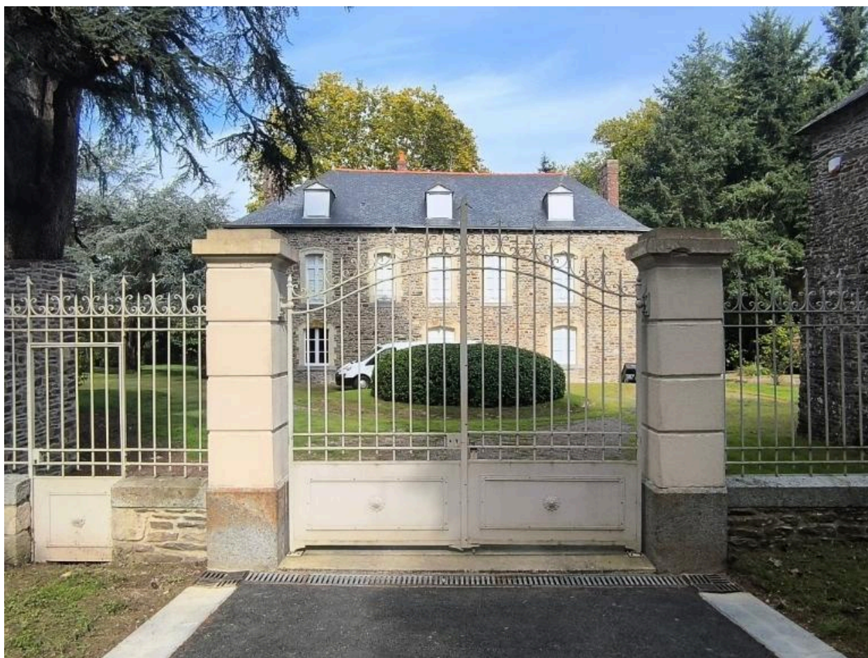
Manoir de la Retenue