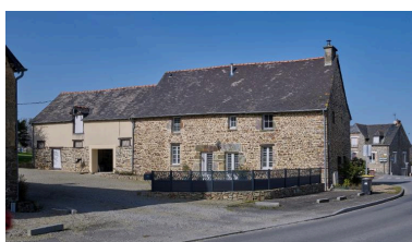
Ferme du bourg IVR53_20263500254NUCA