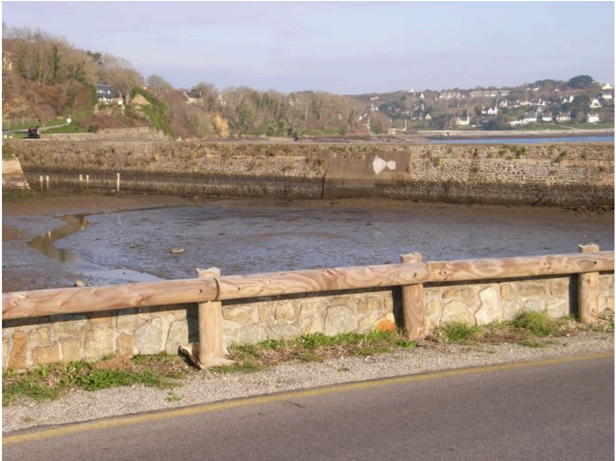
Digue-route de Quéléren