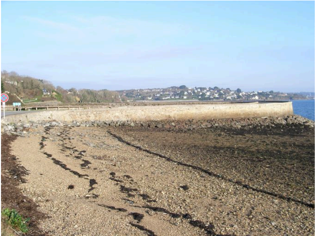
Vue vers le nord de la digue-route de Quéléren