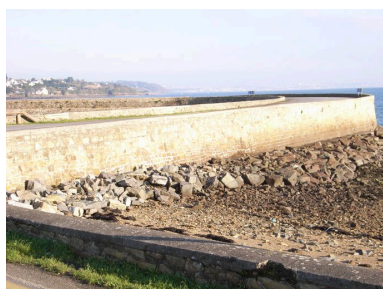
Vue générale de la digue-route de Quéléren