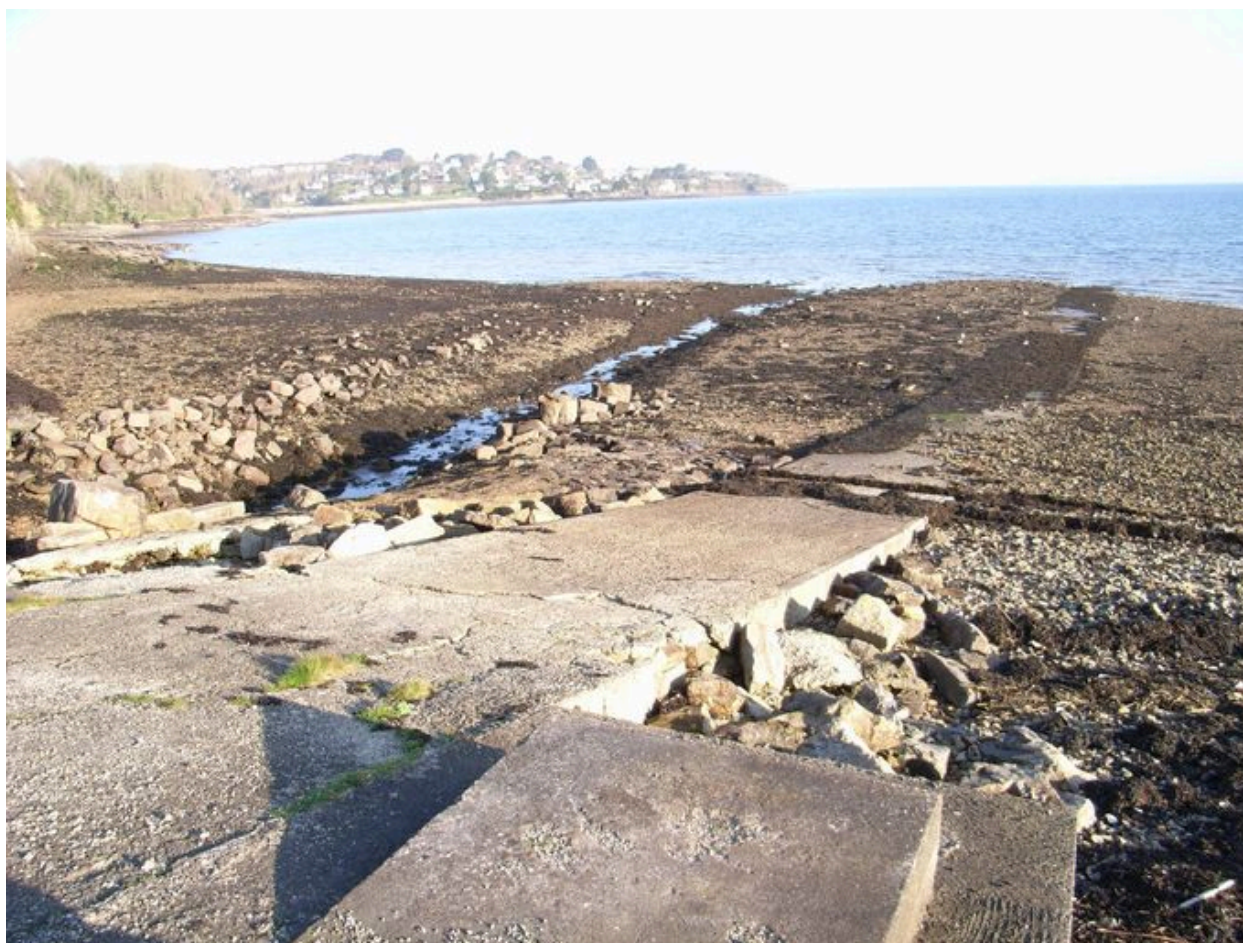
Cale récente au bout de la digue-route de Quéléren