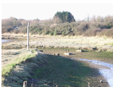
etang de Pen-ar-Poul