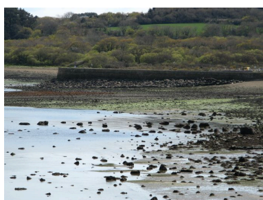
Vue vers le sud de la digue-route de Quéléren