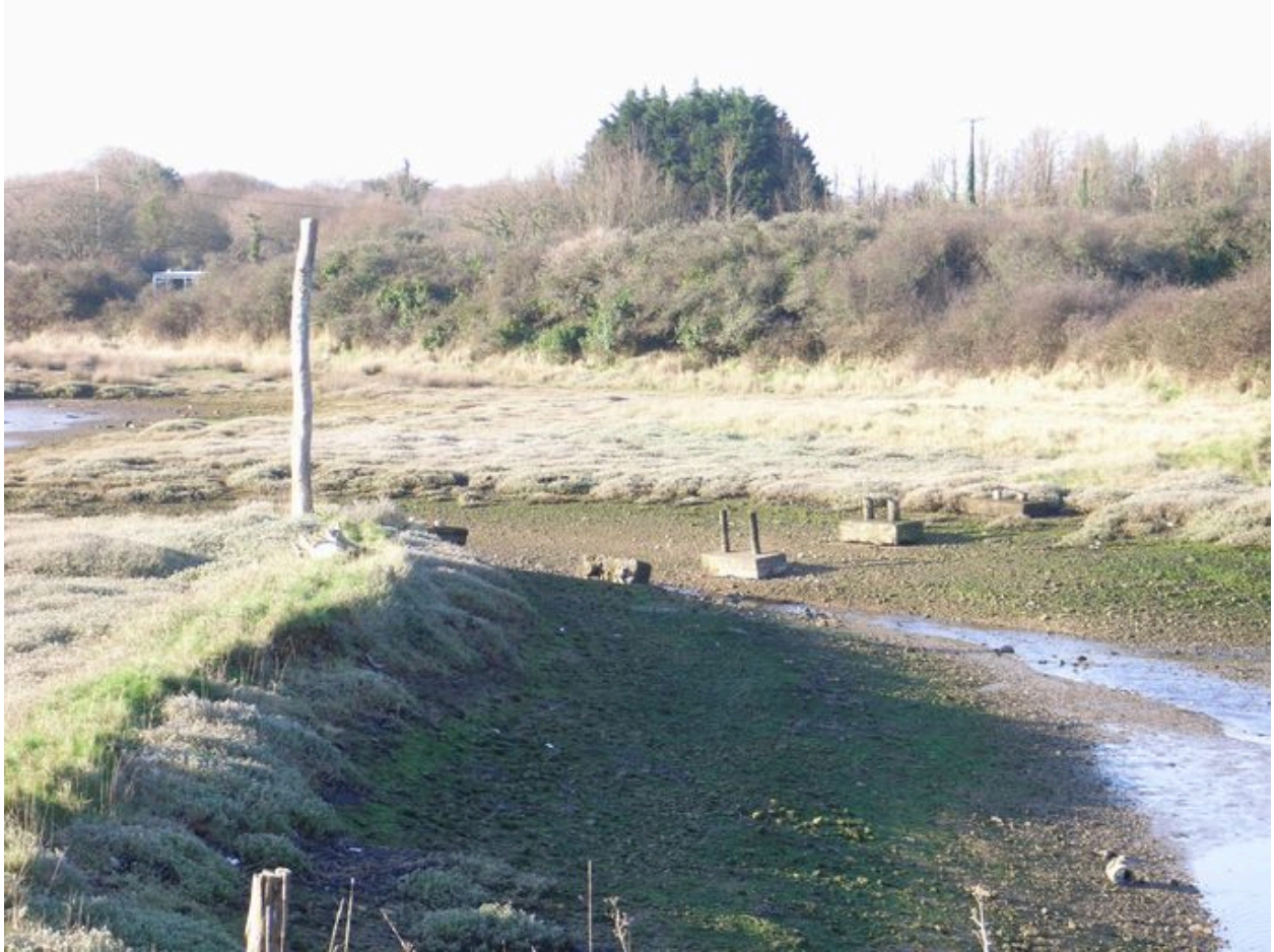
etang de Pen-ar-Poul