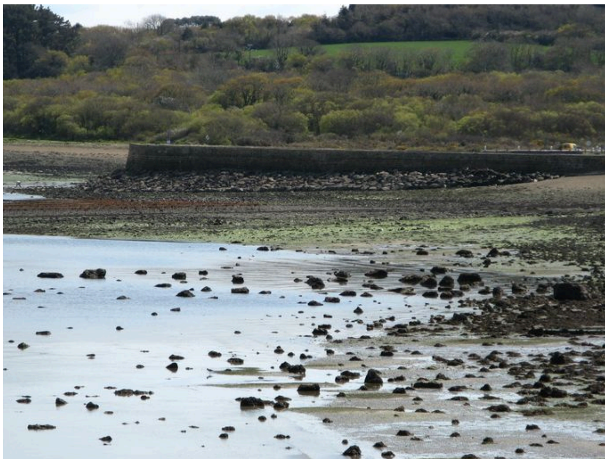
Vue vers le sud de la digue-route de Quéléren