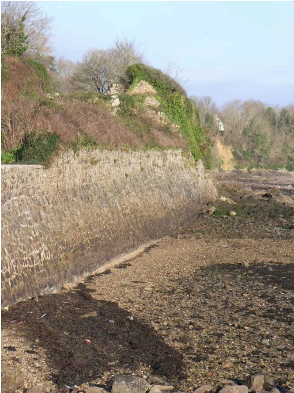
Mur de soutènement dans la continuité de la digue-route de Quéléren