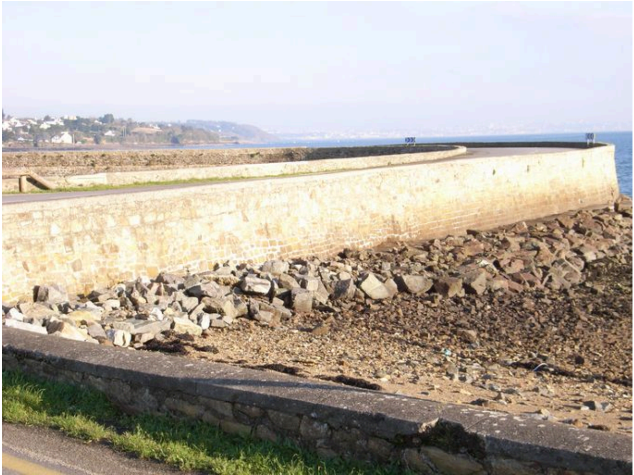
Vue générale de la digue-route de Quéléren