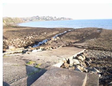
Cale récente au bout de la digue-route de Quéléren