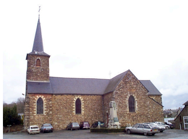
Vue générale sud-ouest IVR53_19993505144NUCA