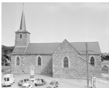
Vue générale sud-ouest IVR53_19943501766X