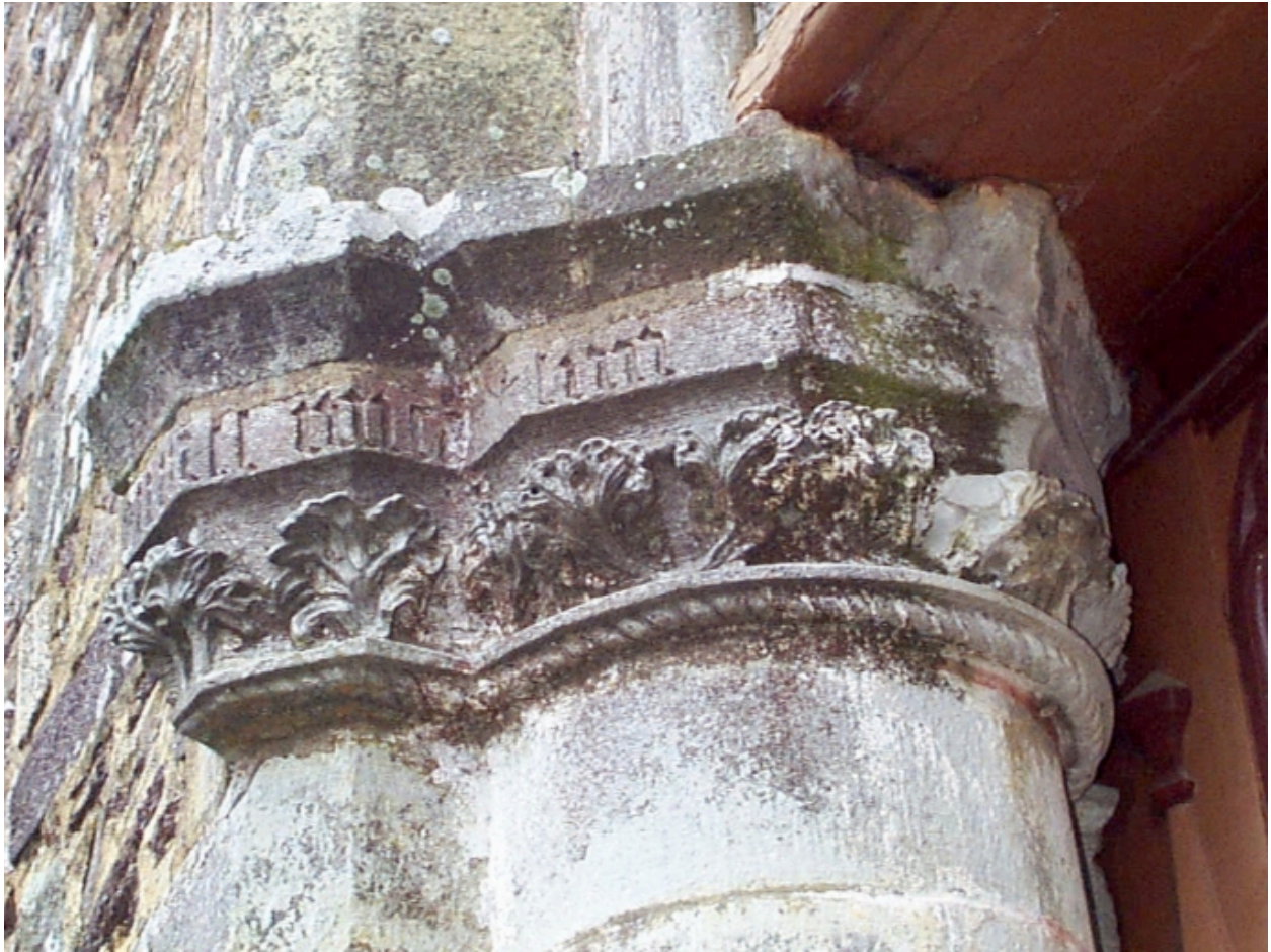
Porche occidental, chapiteau nord portant une inscription en lettres gothiques : détail