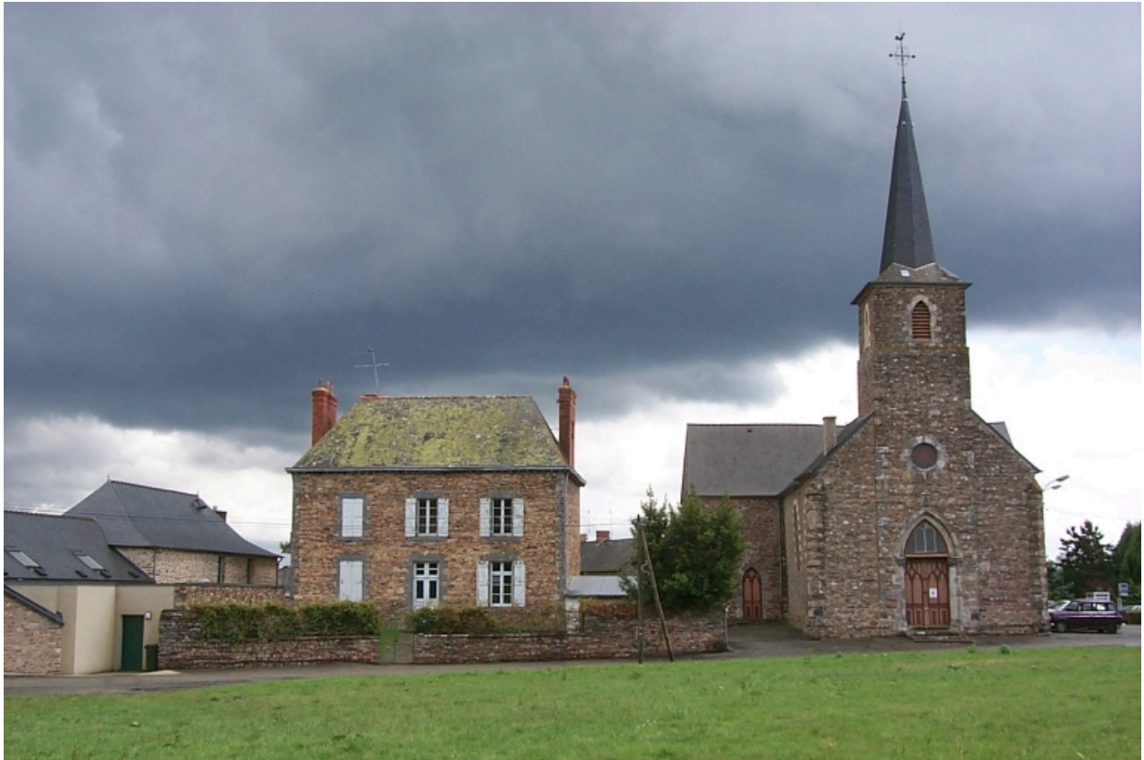
L'église et le presbytère : vue de situation ouest