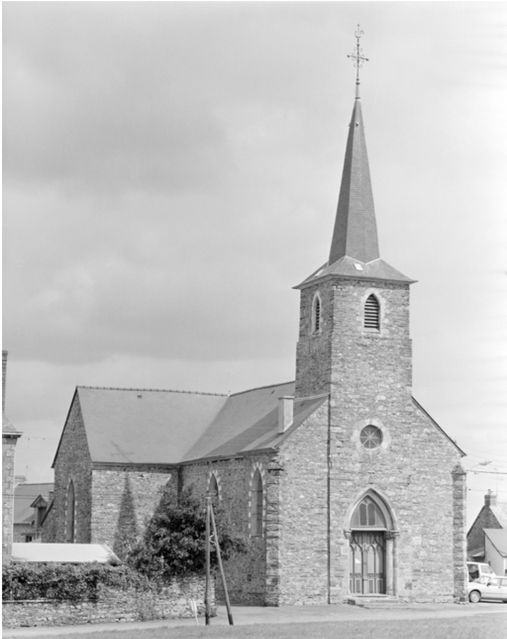
L'église et le presbytère : vue de situation ouest