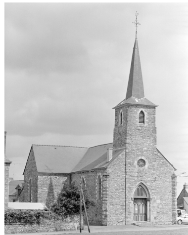
L'église et le presbytère : vue de situation ouest