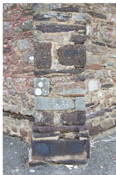
Contrefort sud-ouest, poudingues dits roussards provenant de l'ancienne église : détail IVR53_19993505225NUCA