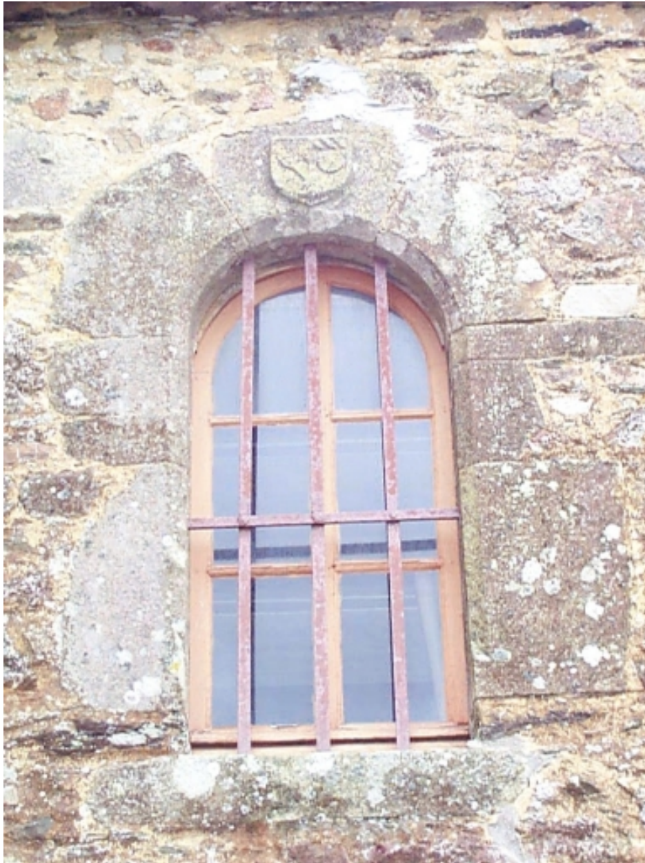
Sacristie nord, fenêtre du 16e siècle sculptée d'un blason : détail