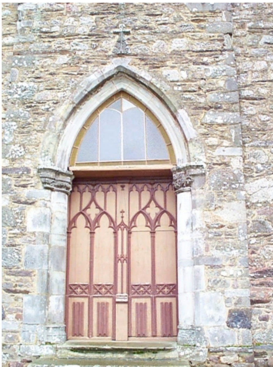
Arcature du 15e siècle réemployée en guise de porche : vue générale ouest