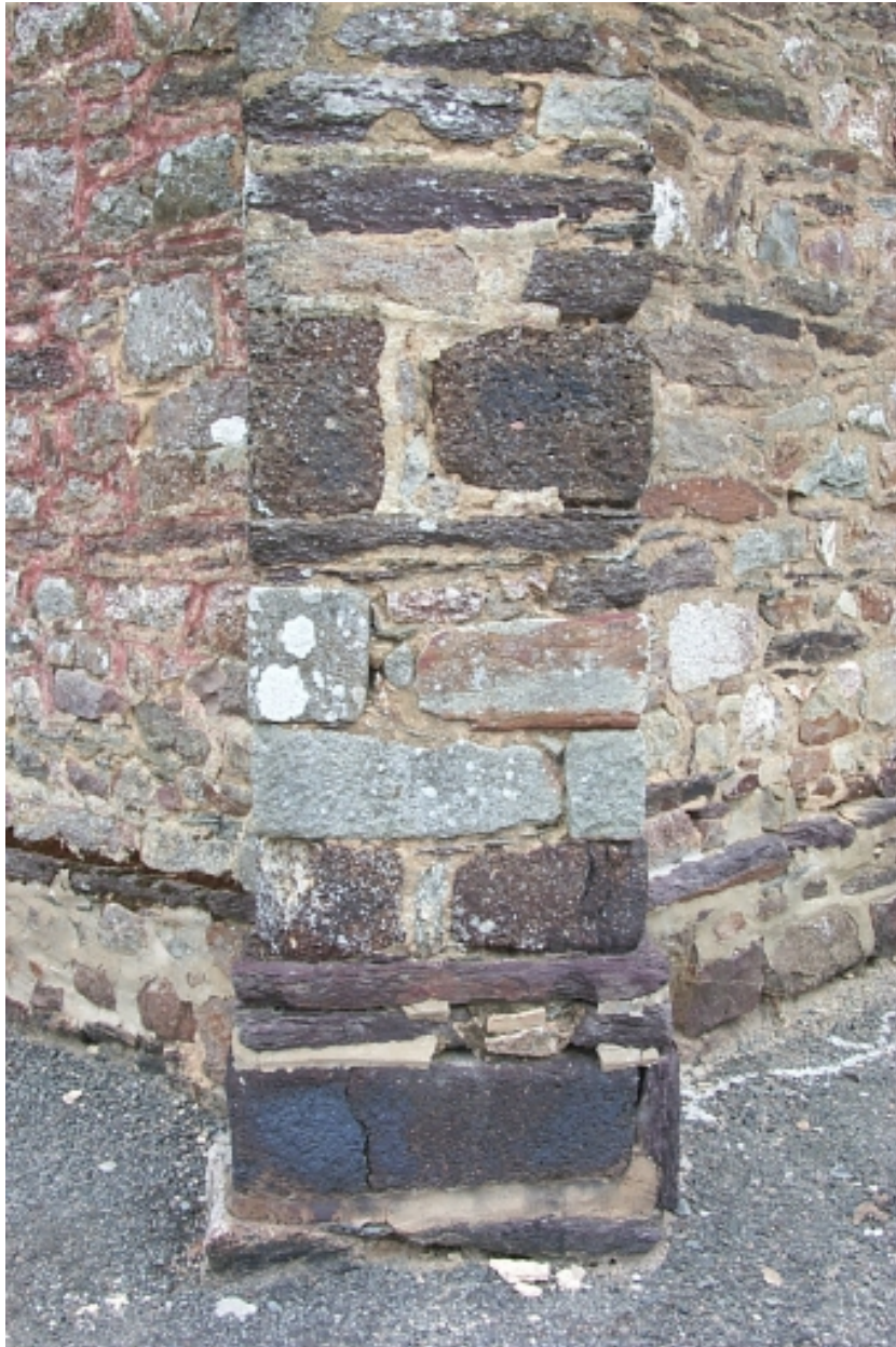
Contrefort sud-ouest, poudingues dits roussards provenant de l'ancienne église : détail