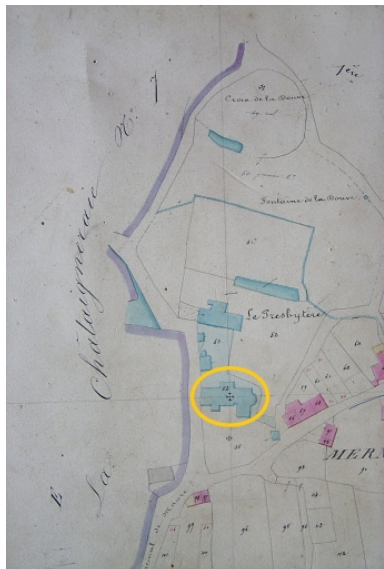
L'ancienne église sur le cadastre napoléonien (cerclée en orangée)