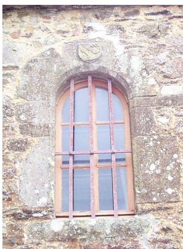
Sacristie nord, fenêtre du 16e siècle sculptée d'un blason : détail IVR53_19993505148NUCA