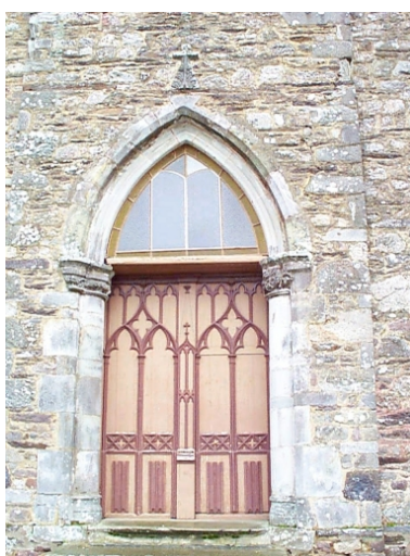
Arcature du 15e siècle employée en guise de porche : vue générale ouest