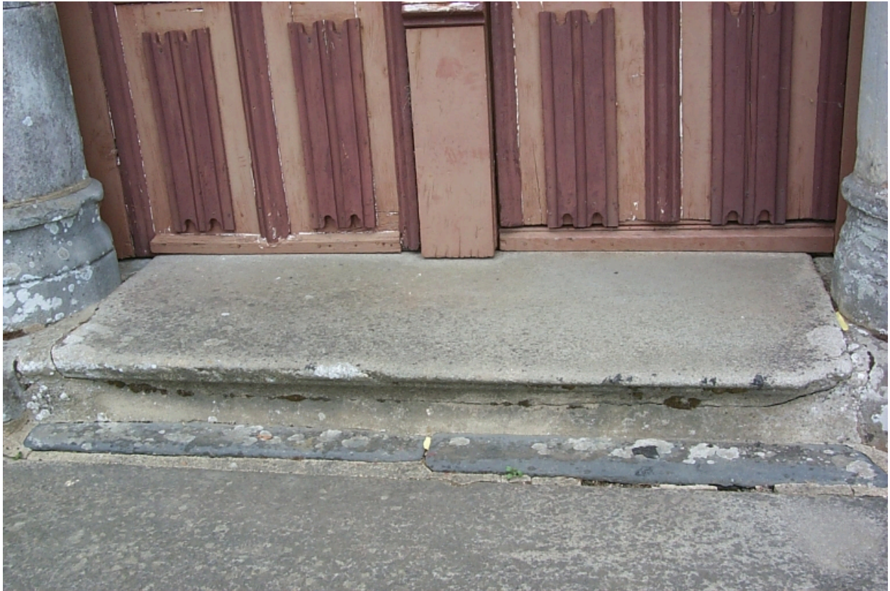
Porche occidental, ancien autel remployée comme pierre de seuil : vue générale ouest