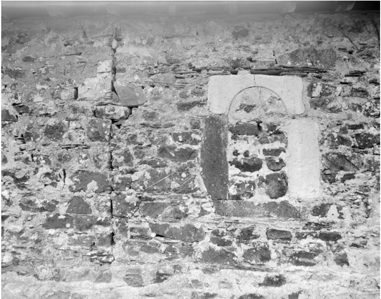
Sacristie nord, porte du 16e siècle en remploi : détail