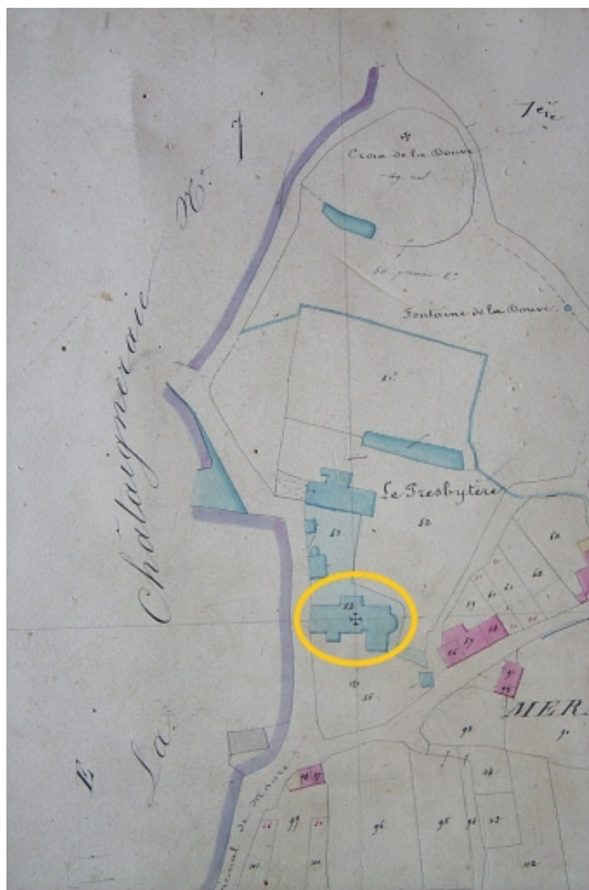
L'ancienne église sur le cadastre napoléonien (cerclée en orangée)