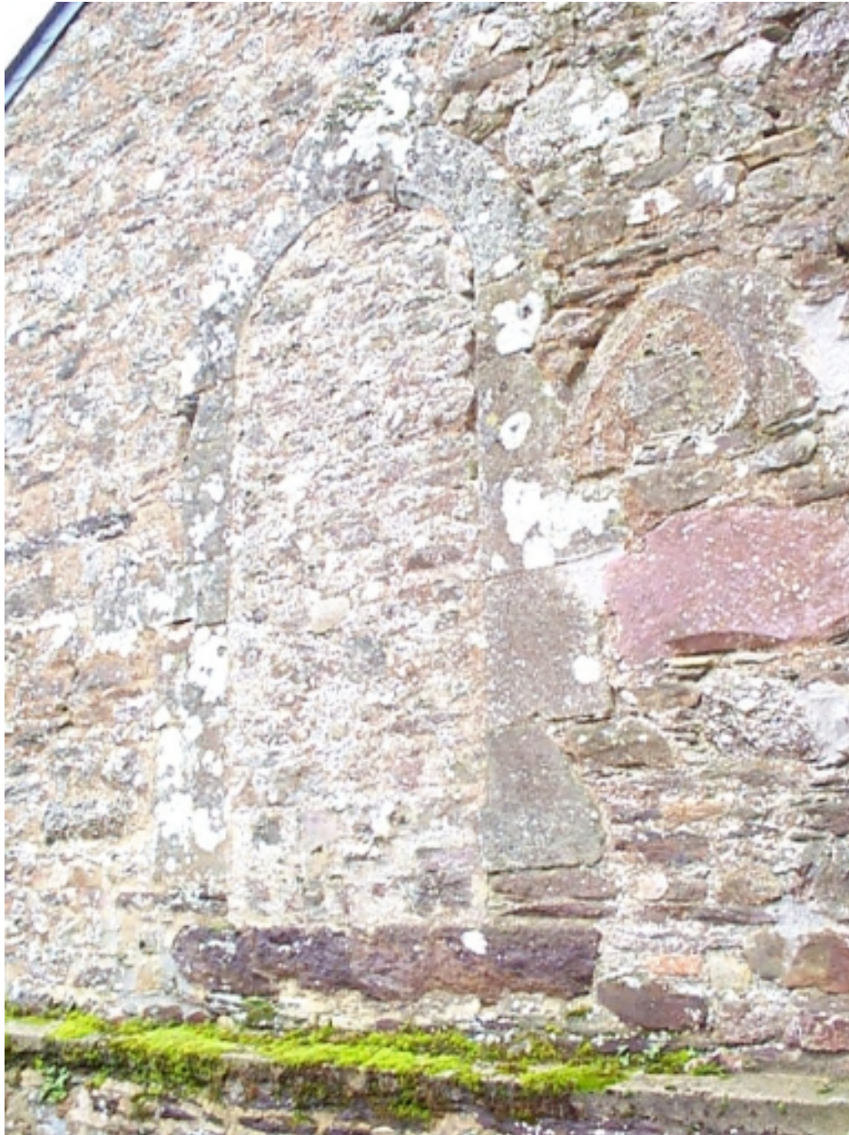
Sacristie nord, porte du 16e siècle en remploi : détail