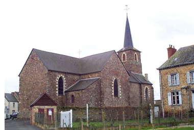
Vue générale nord-est IVR53_19993505145NUCA