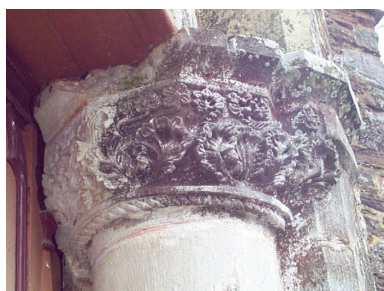
Porche occidental, chapiteau sud : détail IVR53_19993505147NUCA