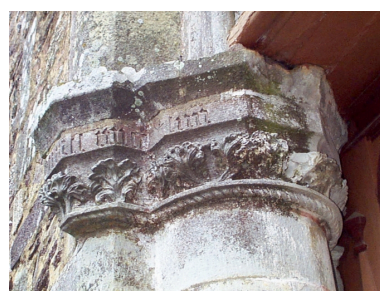
Porche occidental, chapiteau nord portant une inscription en lettres gothiques : détail IVR53_19993505146NUCA