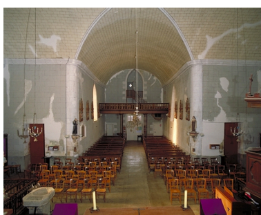
Vue intérieure prise du chœur vers la nef IVR53_19993502543XA