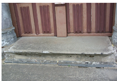
Porche occidental, ancien autel remployée comme pierre de seuil : vue générale ouest IVR53_19993505224NUCA