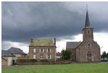
L'église et le presbytère : vue de situation ouest IVR53_19993505143NUCA