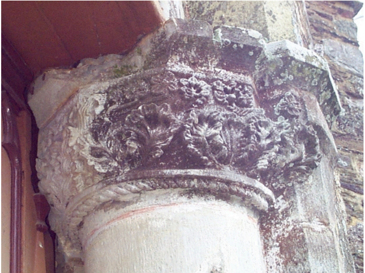
Porche occidental, chapiteau sud : détail