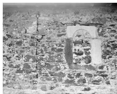
Sacristie nord, porte du 16e siècle en remploi : détail IVR53_19933500014X