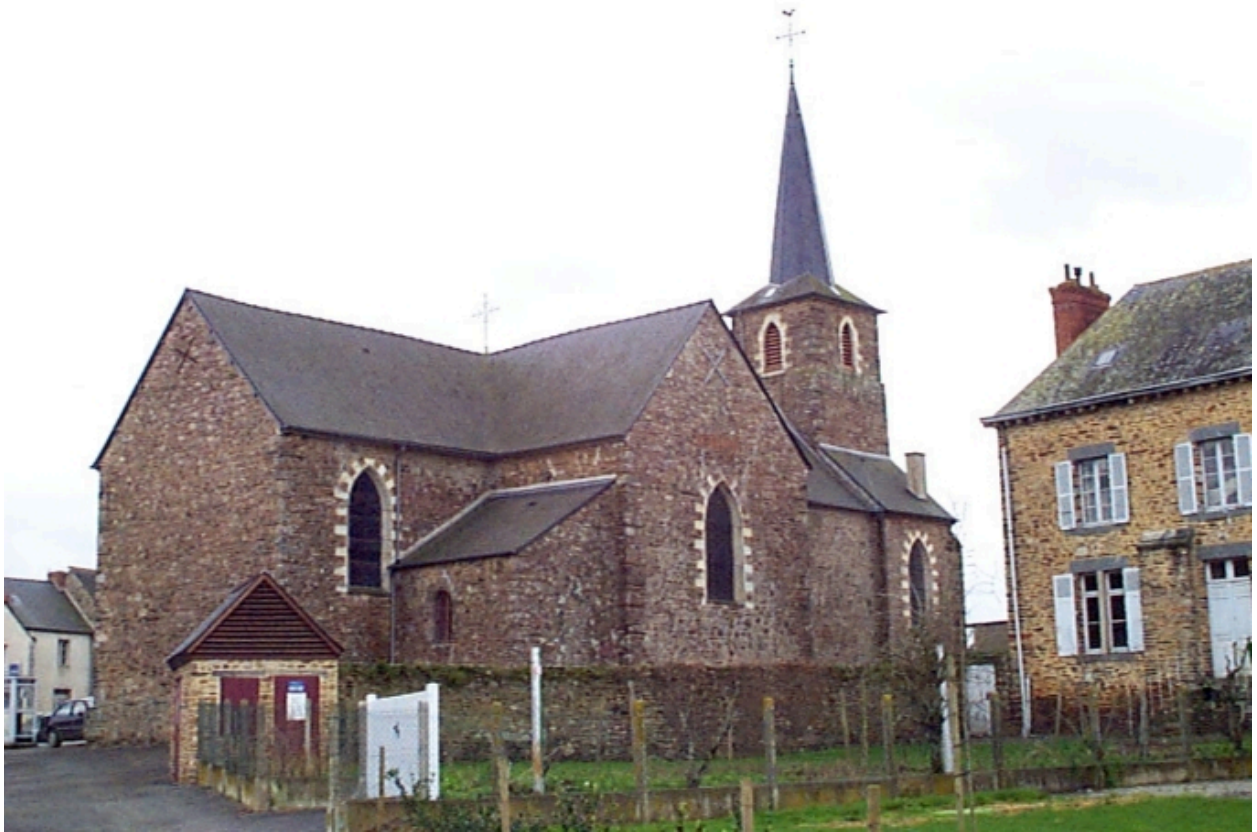
Vue générale nord-est