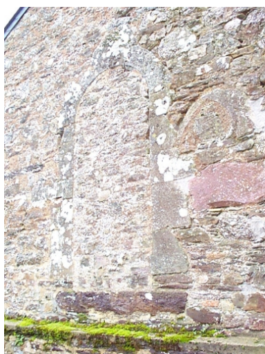
Sacristie nord, porte du 16e siècle en remploi : détail IVR53_19993505232NUCA