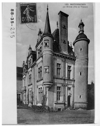
Vue générale du pignon sud IVR53_19883500215X