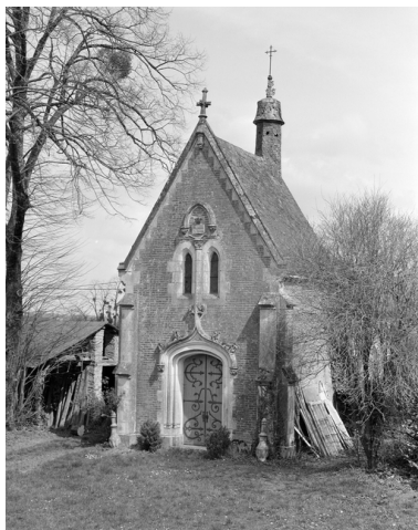
Vue de la chapelle IVR53_19963500764X