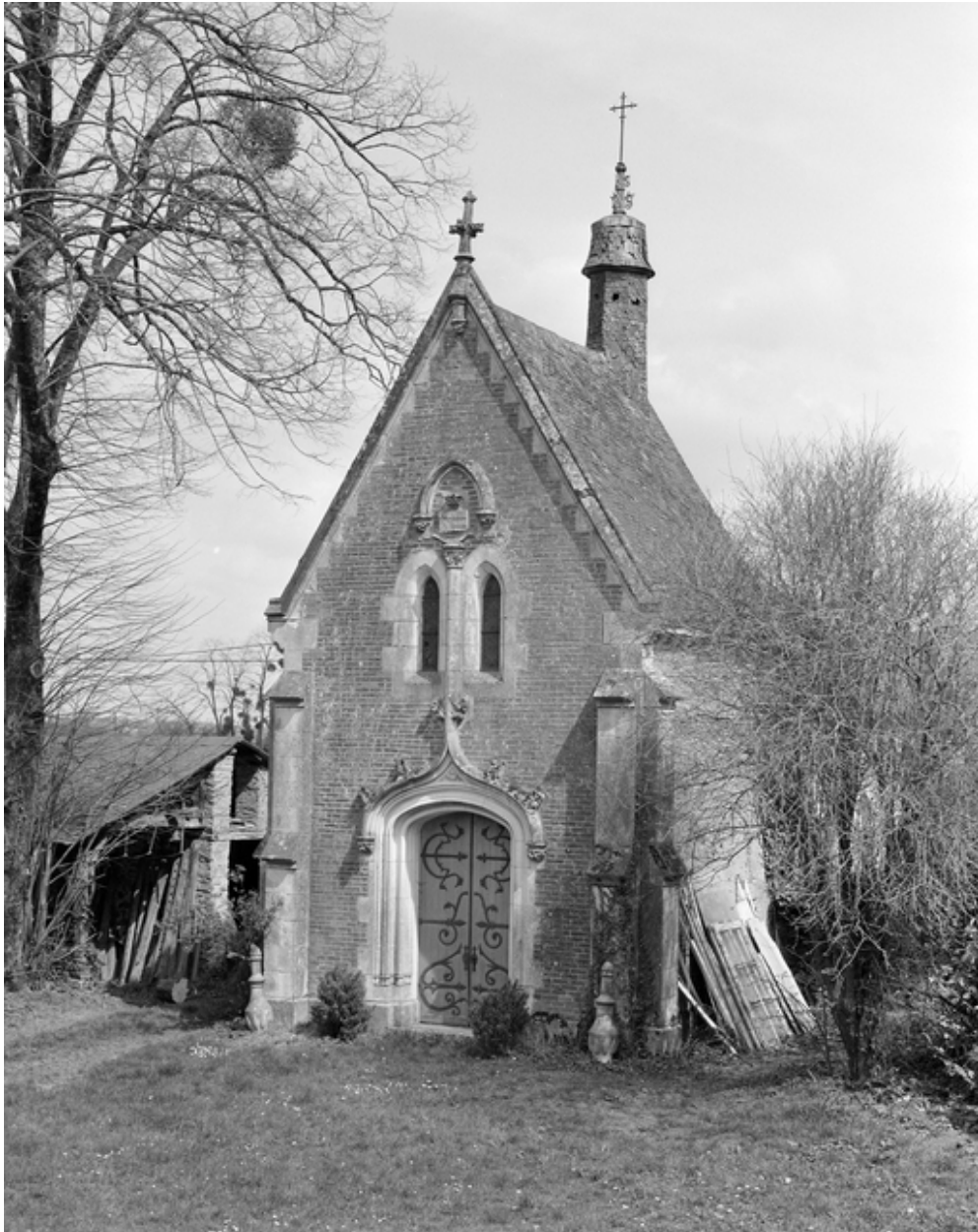
Vue de la chapelle