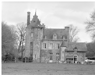
Vue générale IVR53_19963500766X