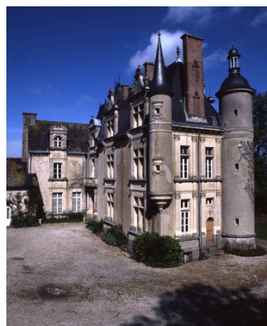
Vue générale du pignon est IVR53_19973500706XA