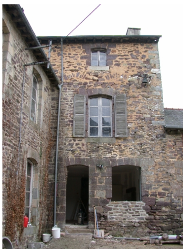
Façade arrière et départ de l'aile en retour d'équerre