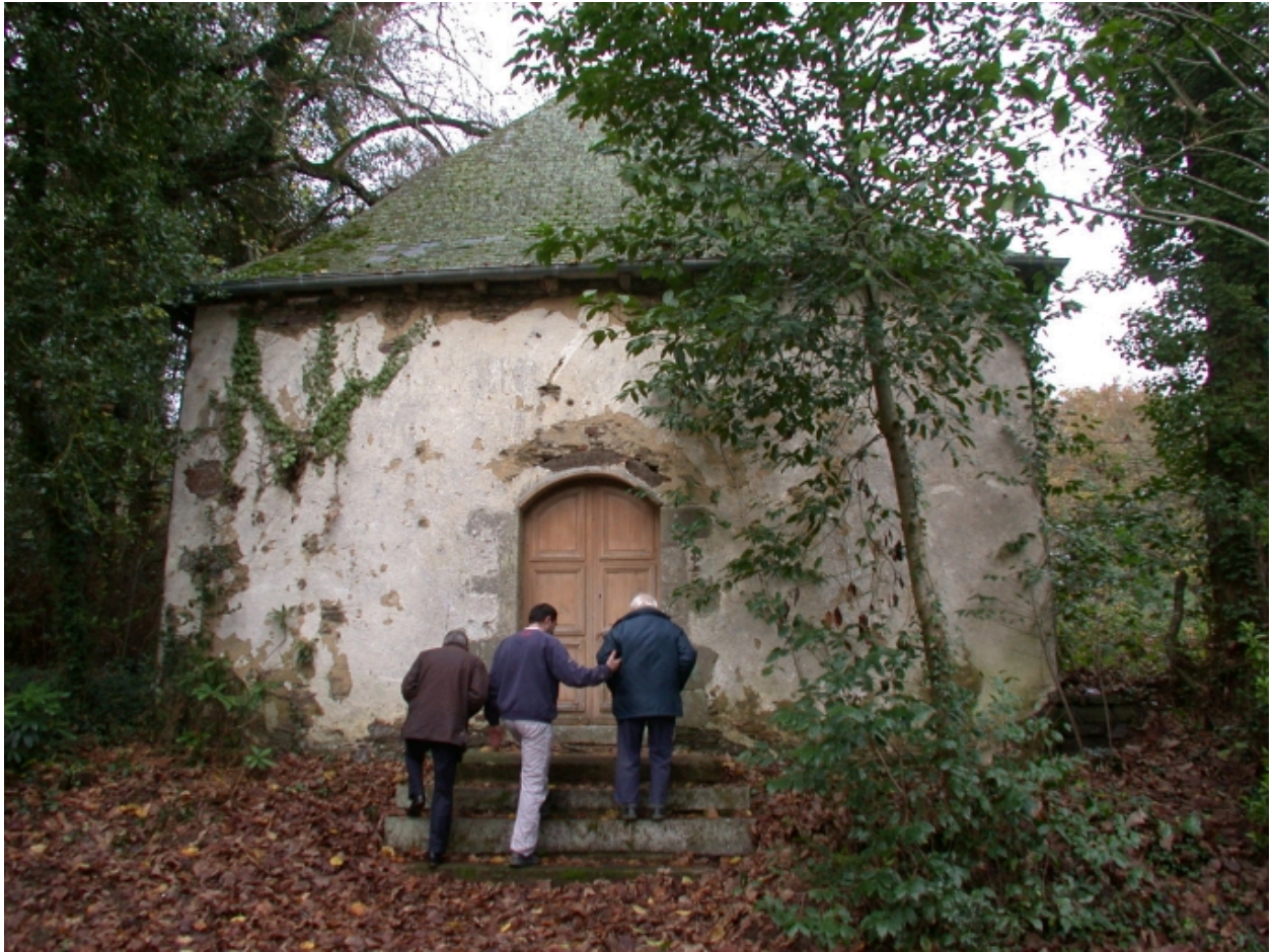
Entrée de la chapelle