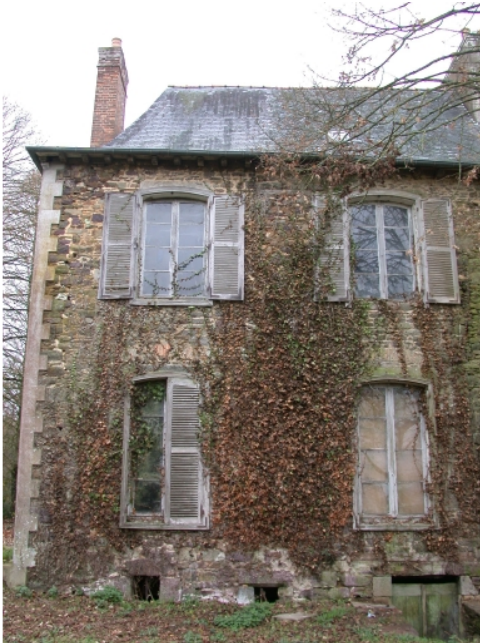
Façade arrière, détail deux premières travées du logis à gauche de la tour