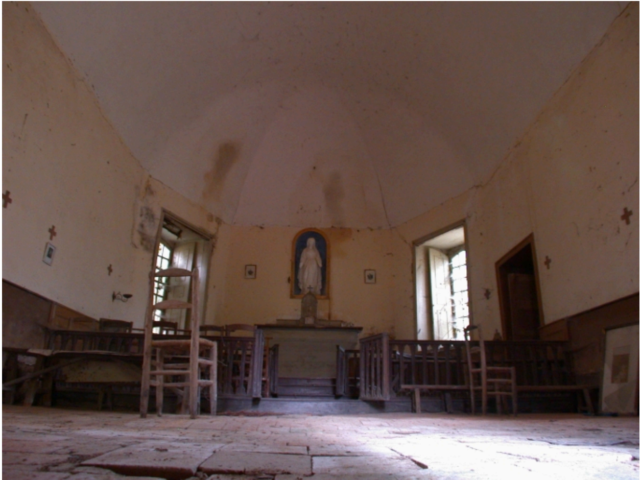
Intérieur de la chapelle