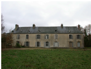
Vue générale de la façade avant