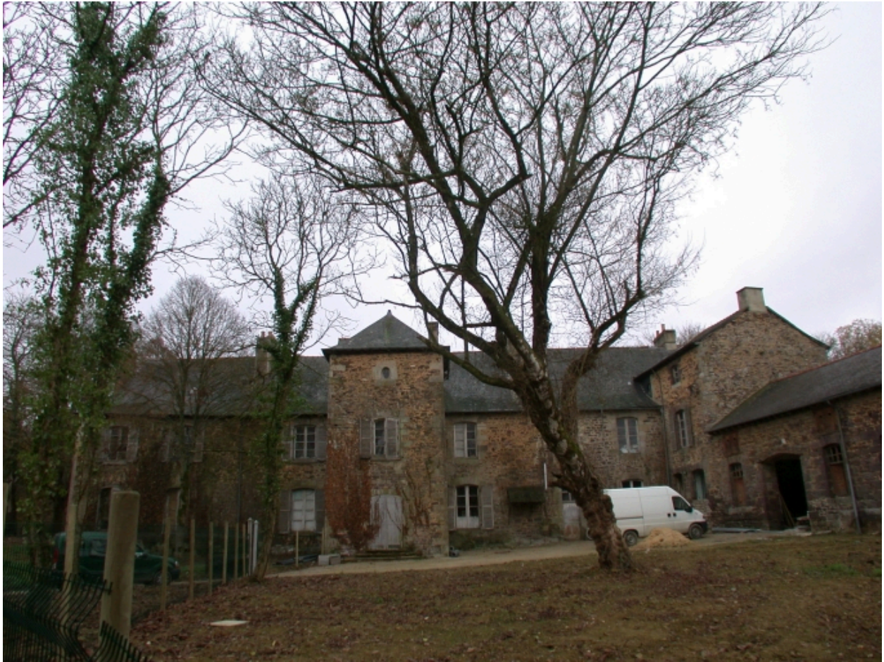
Vue générale de la façade arrière