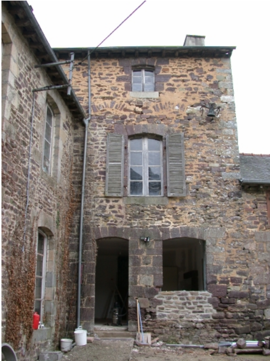
Façade arrière et départ de l'aile en retour d'équerre