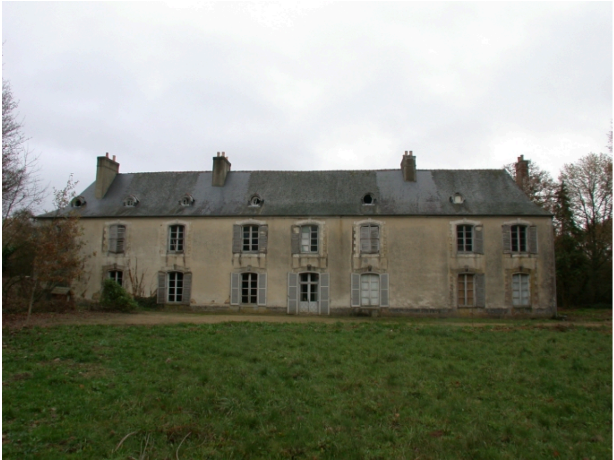
Vue générale de la façade avant