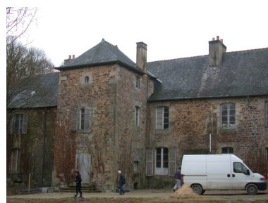
Vue rapprochée de la façade arrière IVR53_20033515673NUCA