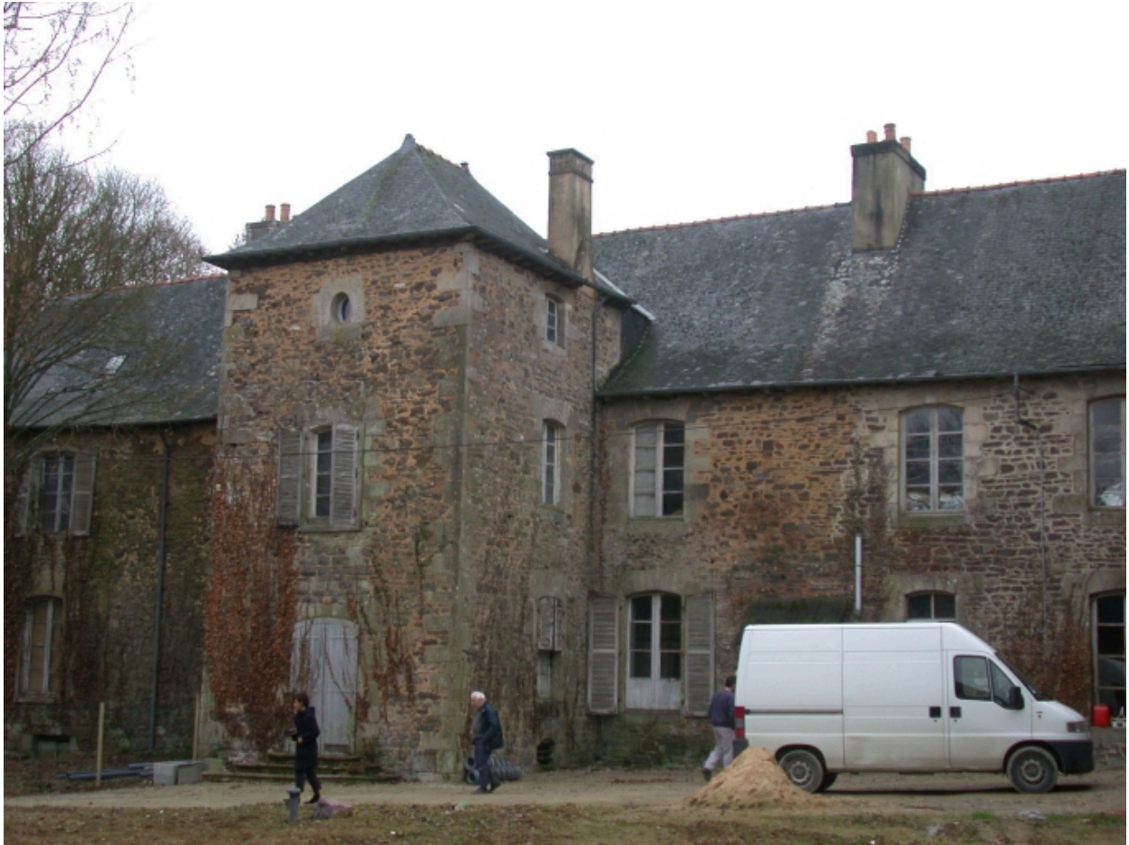
Vue rapprochée de la façade arrière