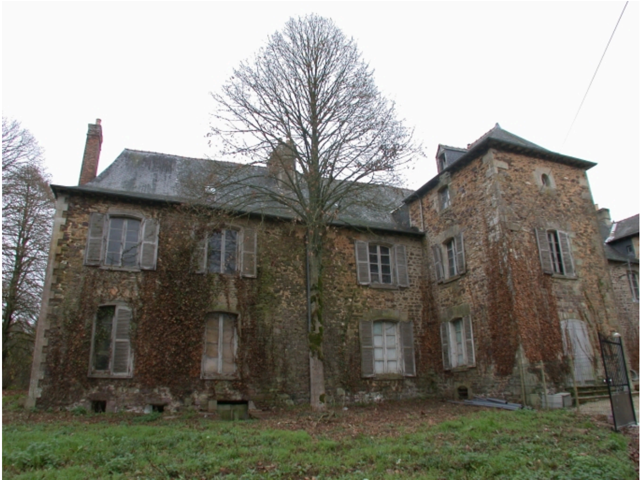
Vue générale de la façade arrière