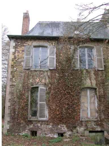
Façade arrière, détail deux premières travées du logis à gauche de la tour