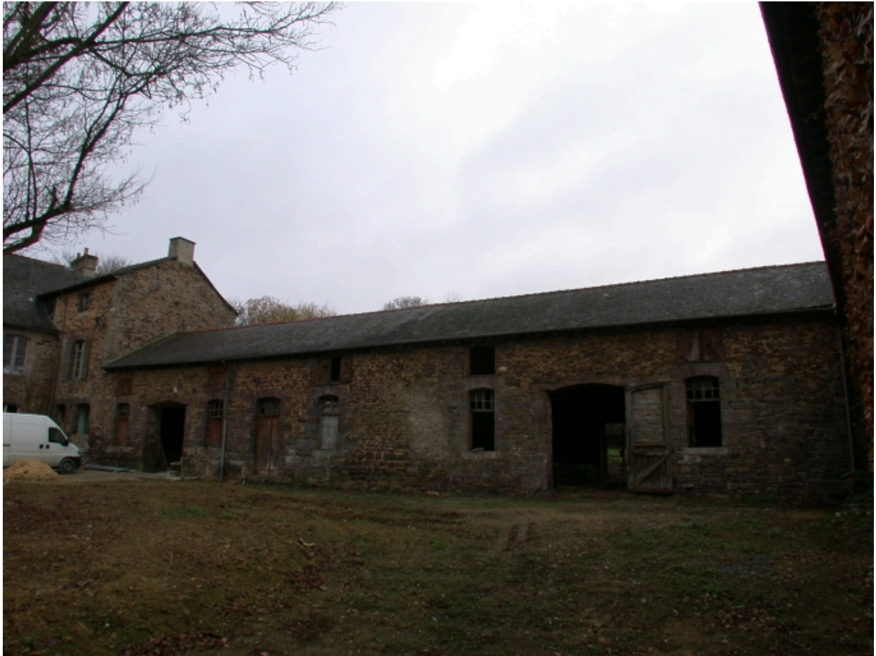
Aile de communs perpendiculaire au logis