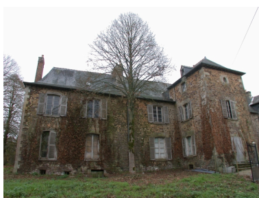
Vue générale de la façade arrière