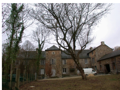
Vue générale de la façade arrière