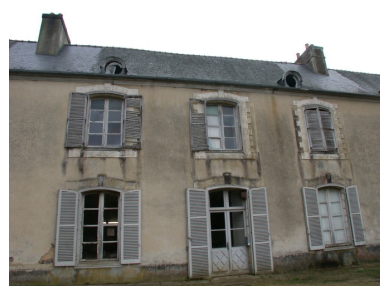
Façade avant, travées centrales du logis