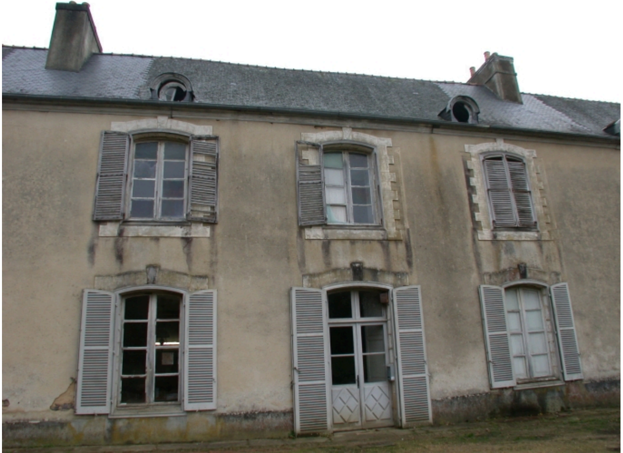
Façade avant, travées centrales du logis