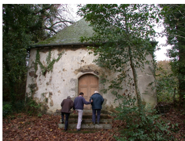
Entrée de la chapelle