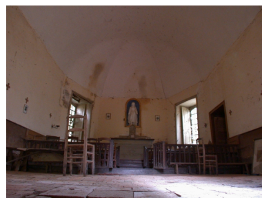
Intérieur de la chapelle