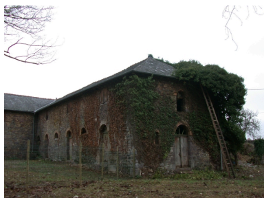
Les écuries