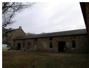
Aile de communs perpendiculaire au logis IVR53_20033515676NUCA