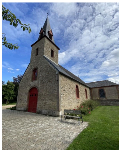
Vue sud-ouest IVR53_20265610425NUCA