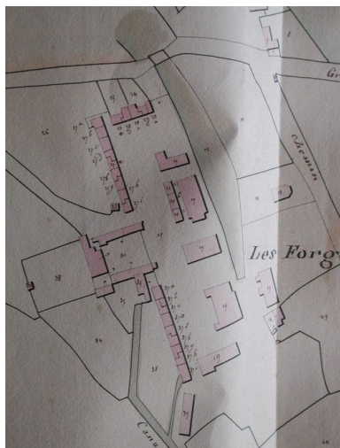
La chapelle sur le cadastre de [1830] Autr. Quermeleuc IVR53_20045606182NUCA