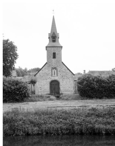
Chapelle : vue générale prise de l'ouest IVR53_19915600477X