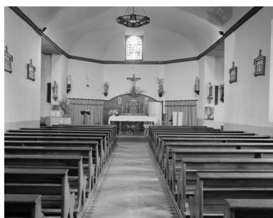
Chapelle : vue générale vers le chœur IVR53_19925602066X