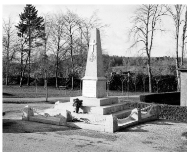
Monument aux morts : vue générale IVR53_19925602080X