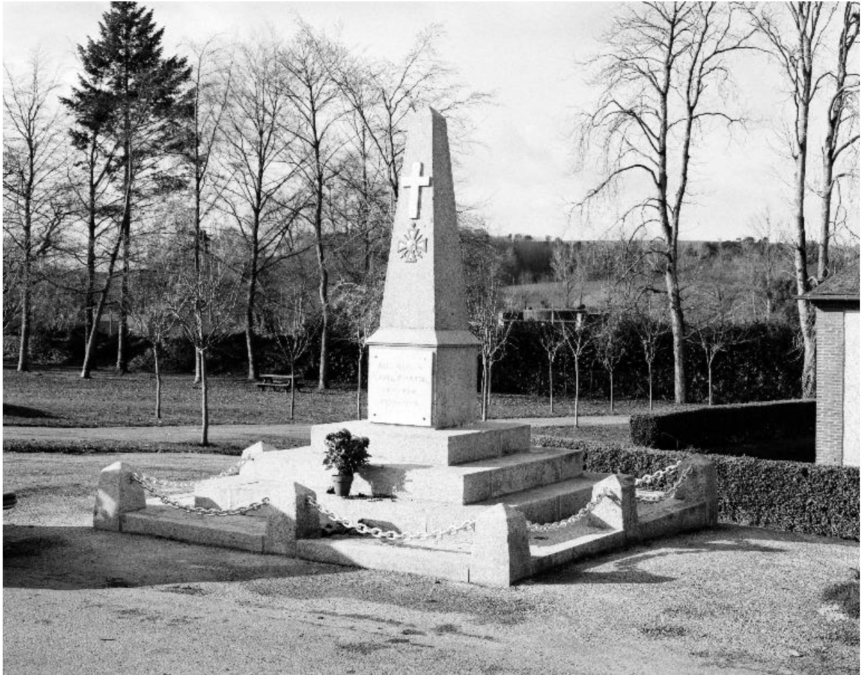
Monument aux morts : vue générale