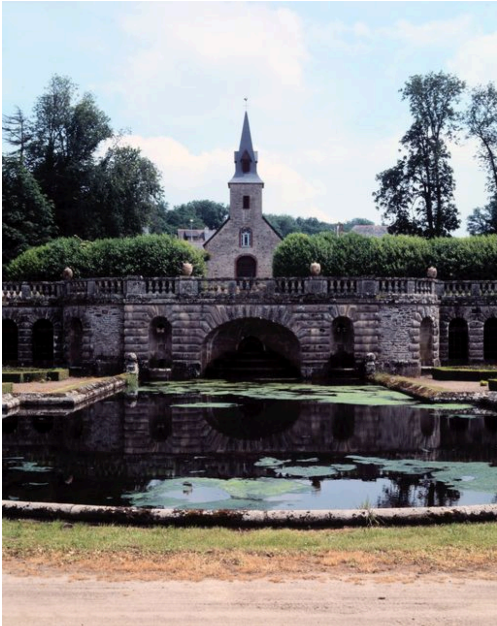
Chapelle : élévation ouest