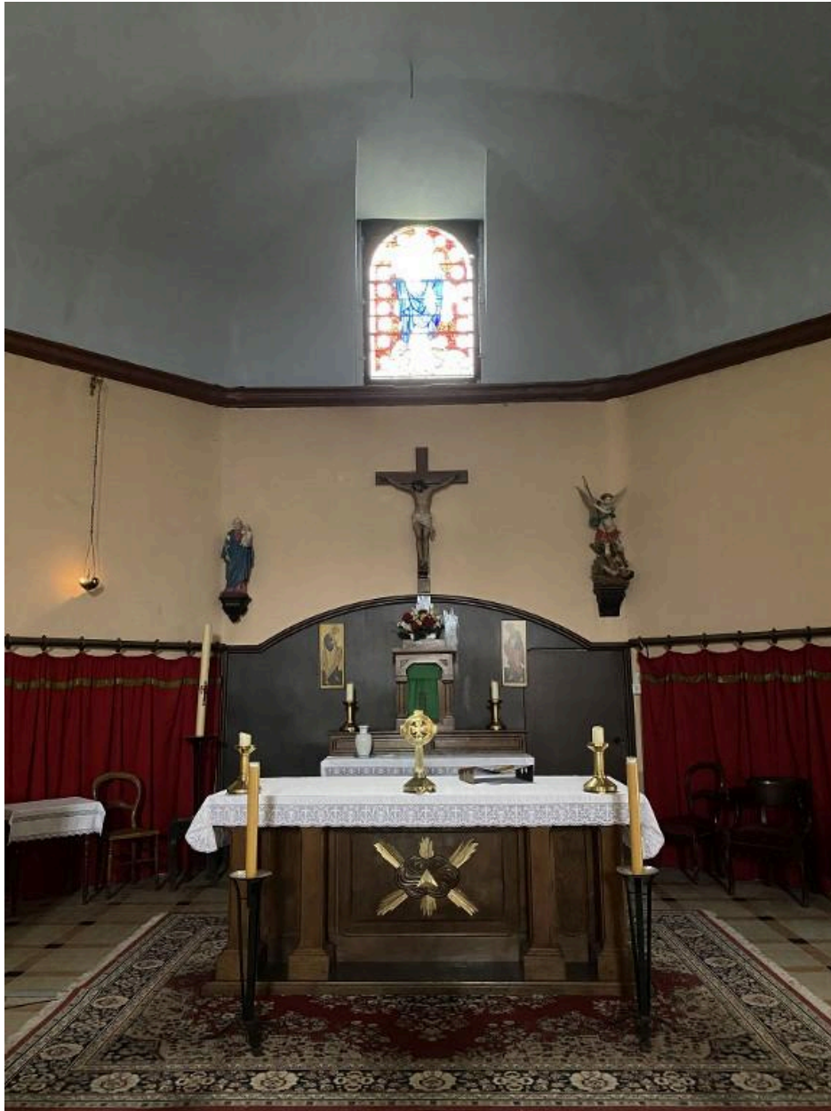
Vue de l'autel et du ch#ur