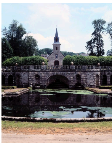
Chapelle : élévation ouest IVR53_19945600692XA