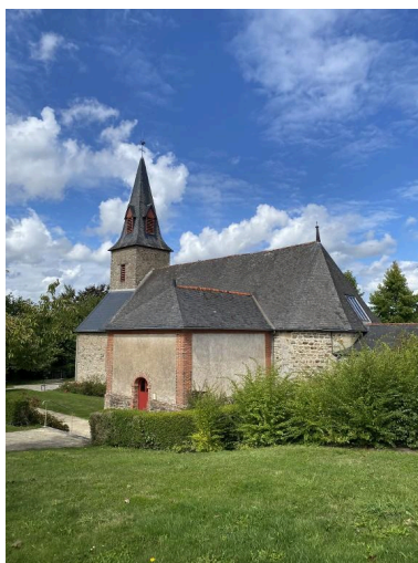
Vue sud-est IVR53_20265610415NUCA