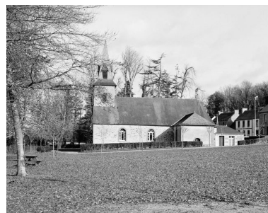
Chapelle : élévation sud IVR53_19925602082X