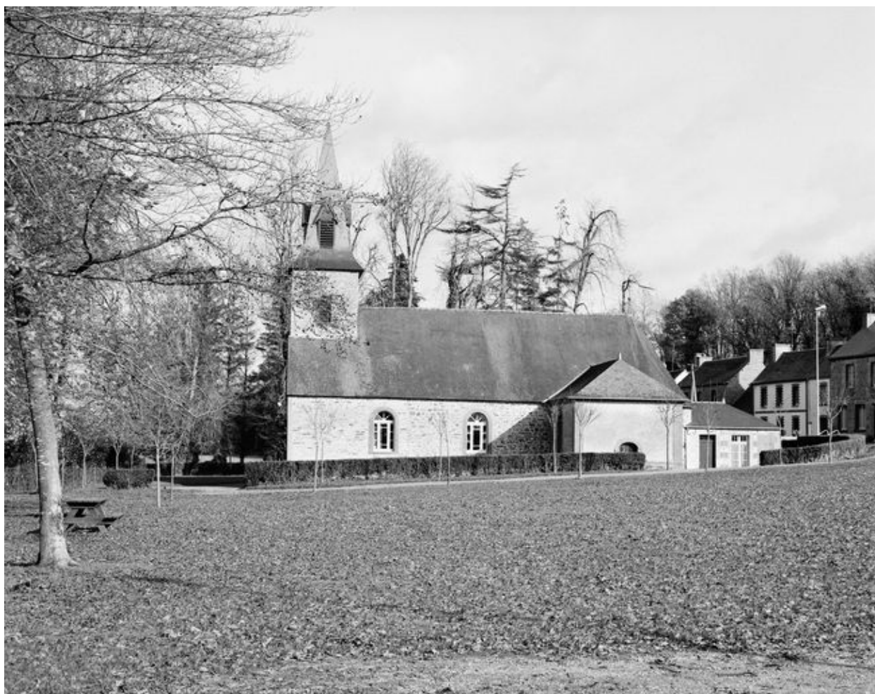
Chapelle : élévation sud