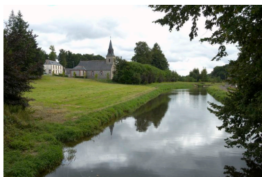
Chapelle : vue de situation prise du nord-ouest