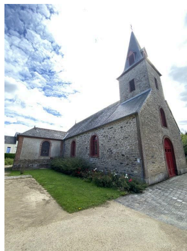
Vue nord-ouest IVR53_20265610419NUCA