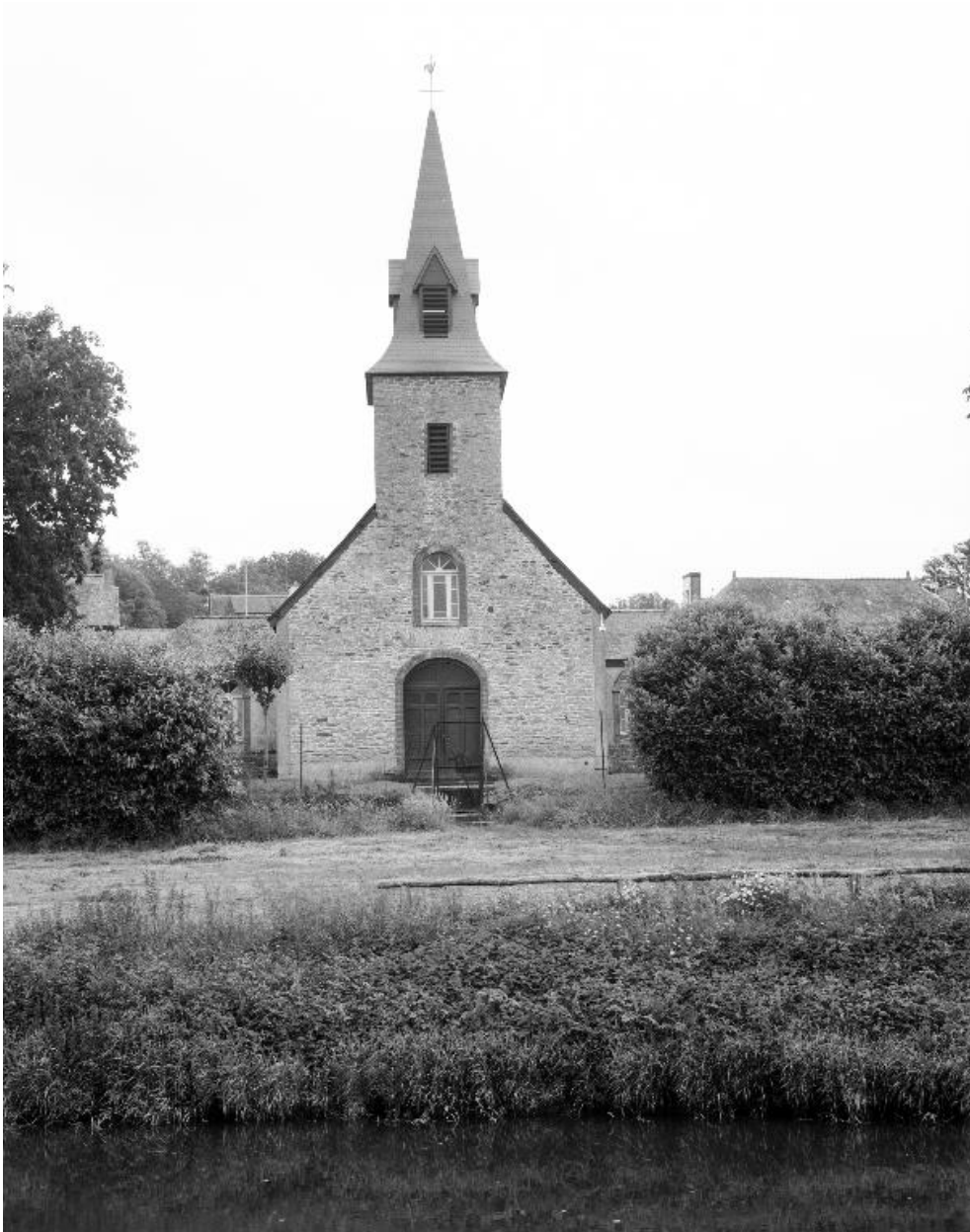
Chapelle : : vue générale prise de l'ouest