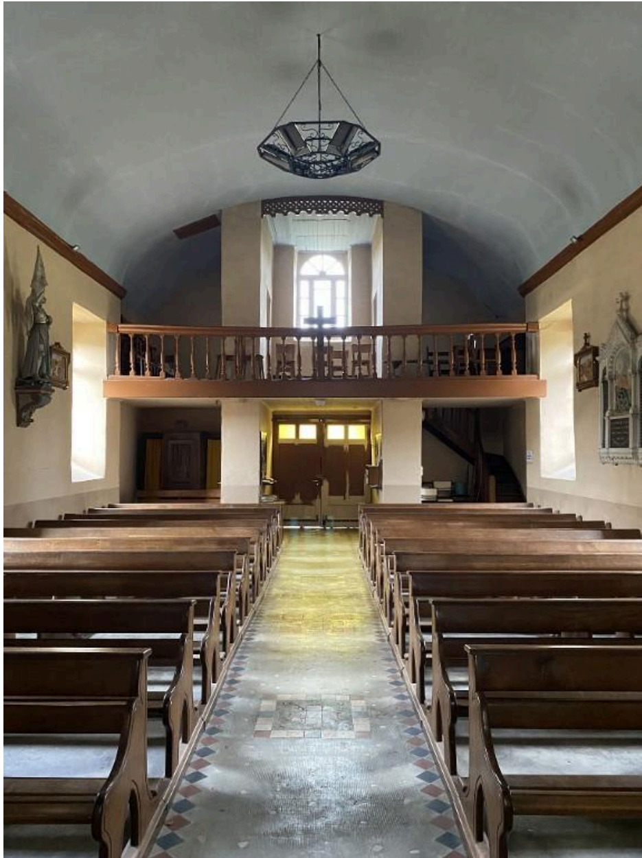
Vue générale de l'intérieur