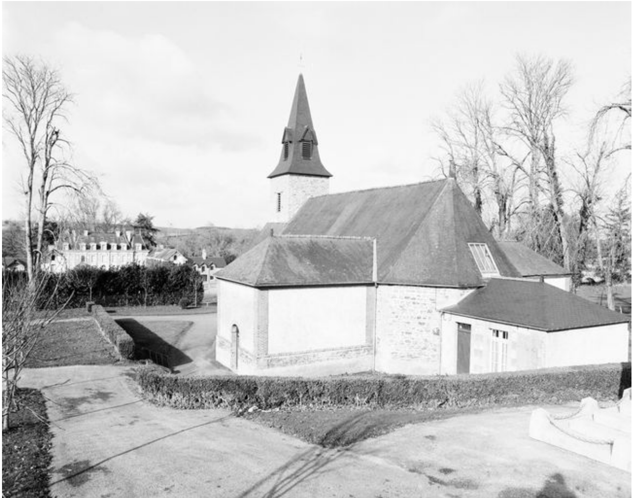
Chapelle : vue générale prise du sud-est