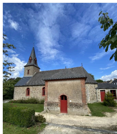
Vue sud IVR53_20265610424NUCA