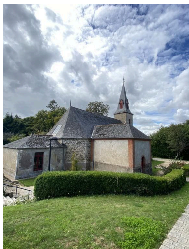
Vue nord-est IVR53_20265610420NUCA