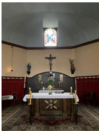
Vue de l'autel et du chœur