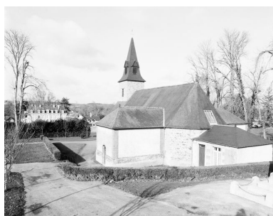
Chapelle : vue générale prise du sud-est