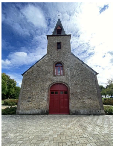
Élévation ouest IVR53_20265610423NUCA