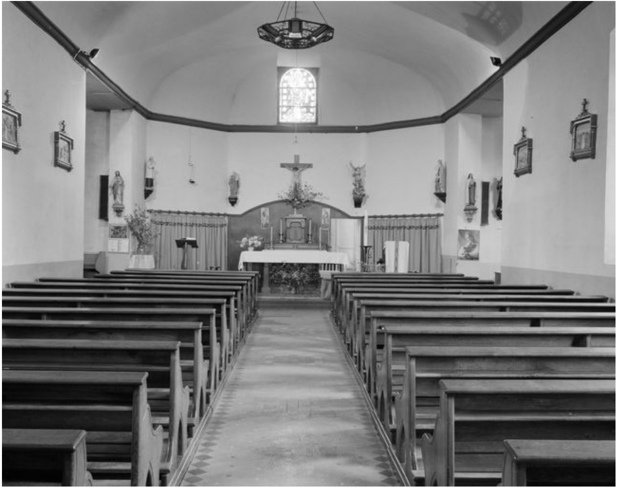
Chapelle : vue générale vers le chœur