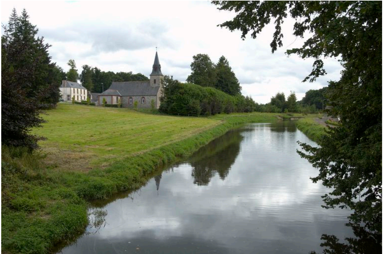
Chapelle : vue de situation prise du nord-ouest