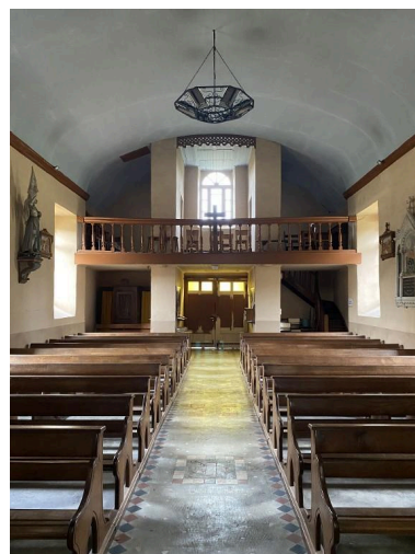
Vue générale de l'intérieur IVR53_20265610422NUCA