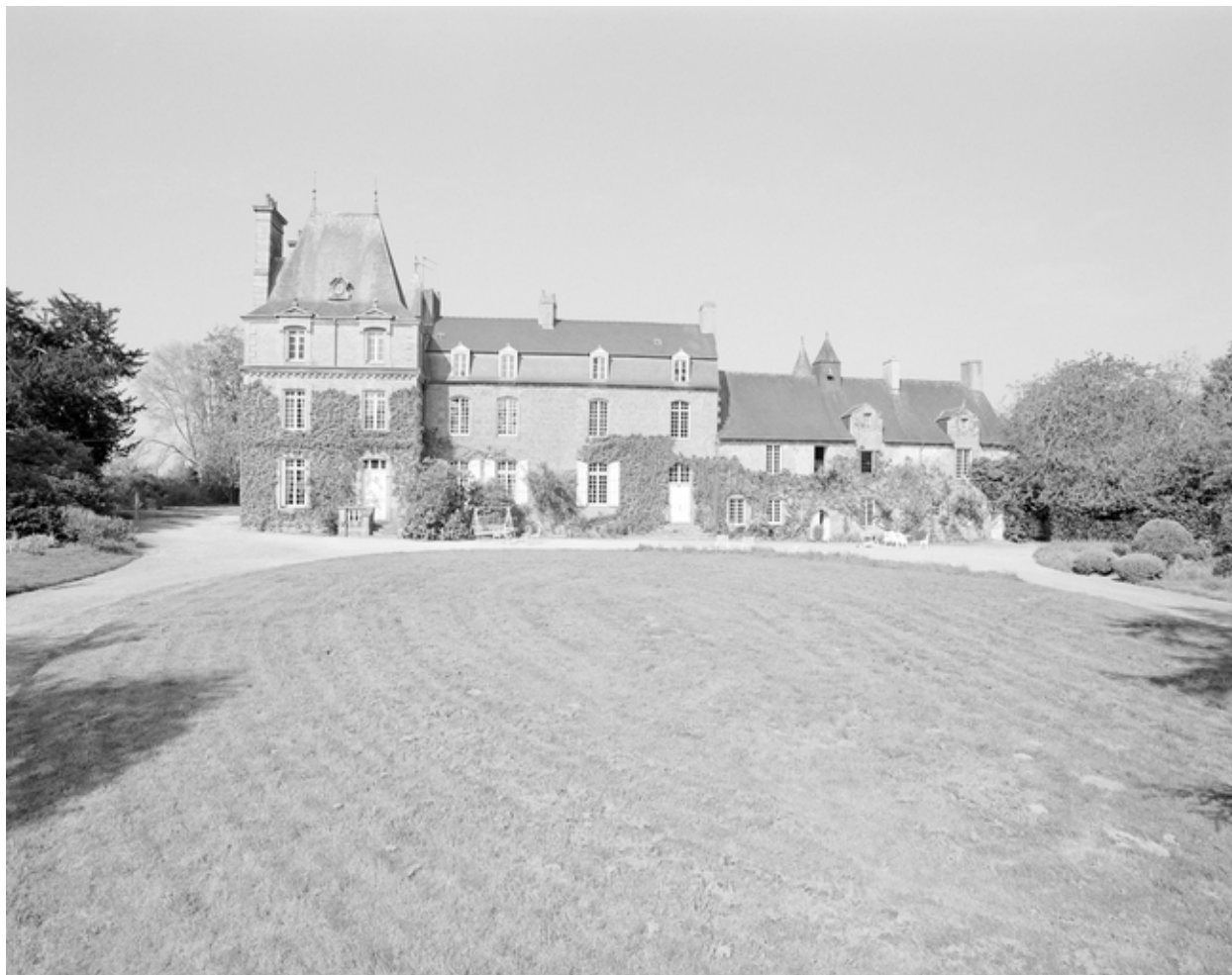
Vue générale de la façade principale