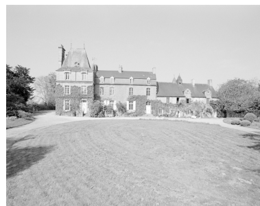
Vue générale de la façade principale IVR53_19963500978X