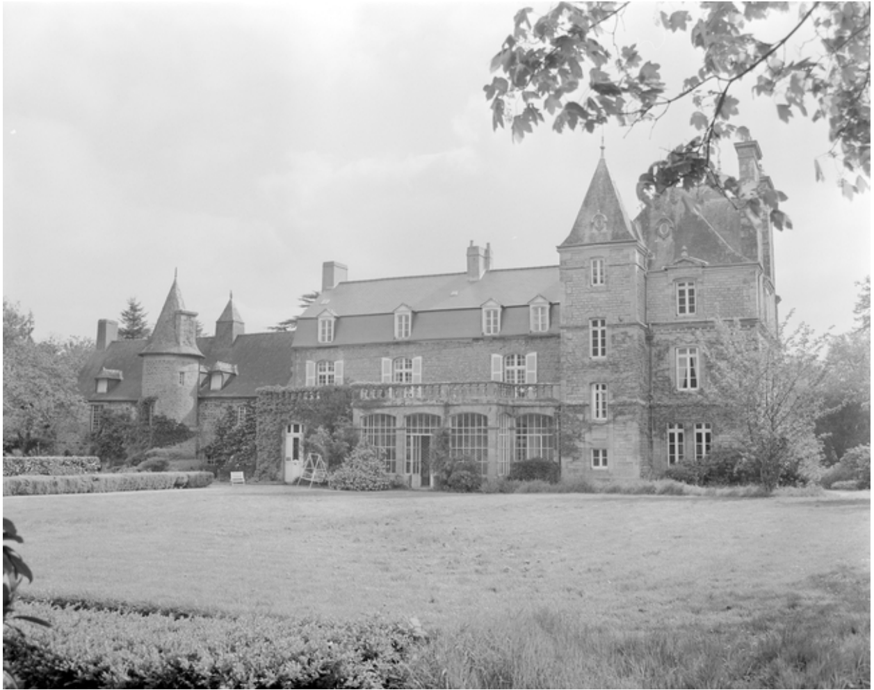
Vue générale de la façade postérieure