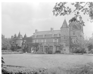
Vue générale de la façade postérieure