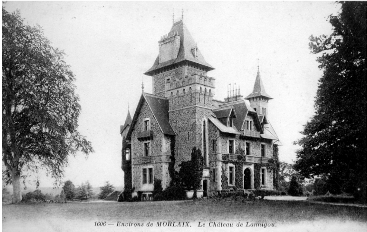
Vue générale de la façade antérieure