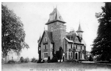
Vue générale de la façade antérieure IVR53_20042905558NUCB