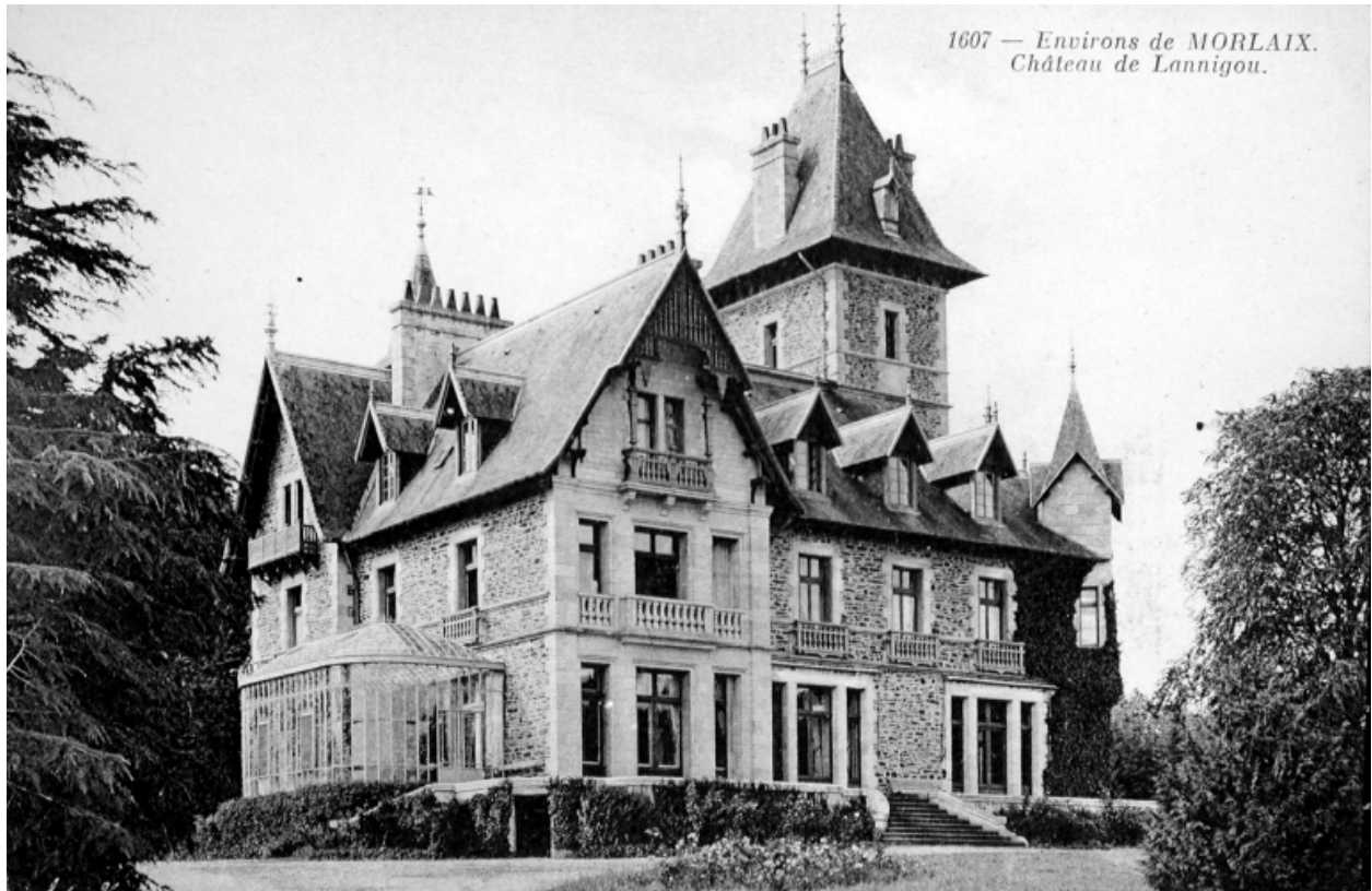
Vue générale de la façade postérieure