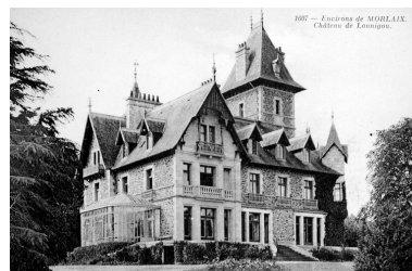
Vue générale de la façade postérieure