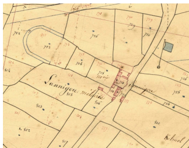
Le manoir de Lannigou sur la cadastre ancien