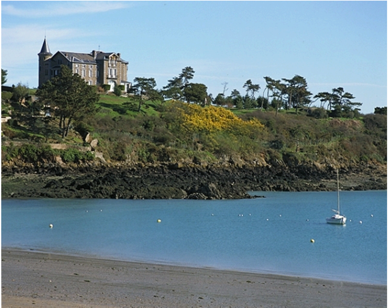
Vue de situation depuis le sud-est