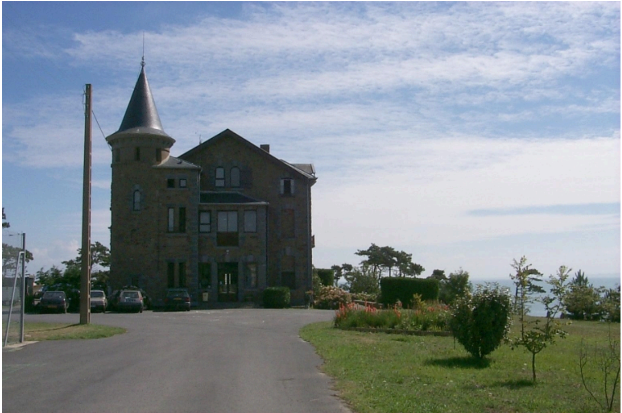
Vue générale : la façade est