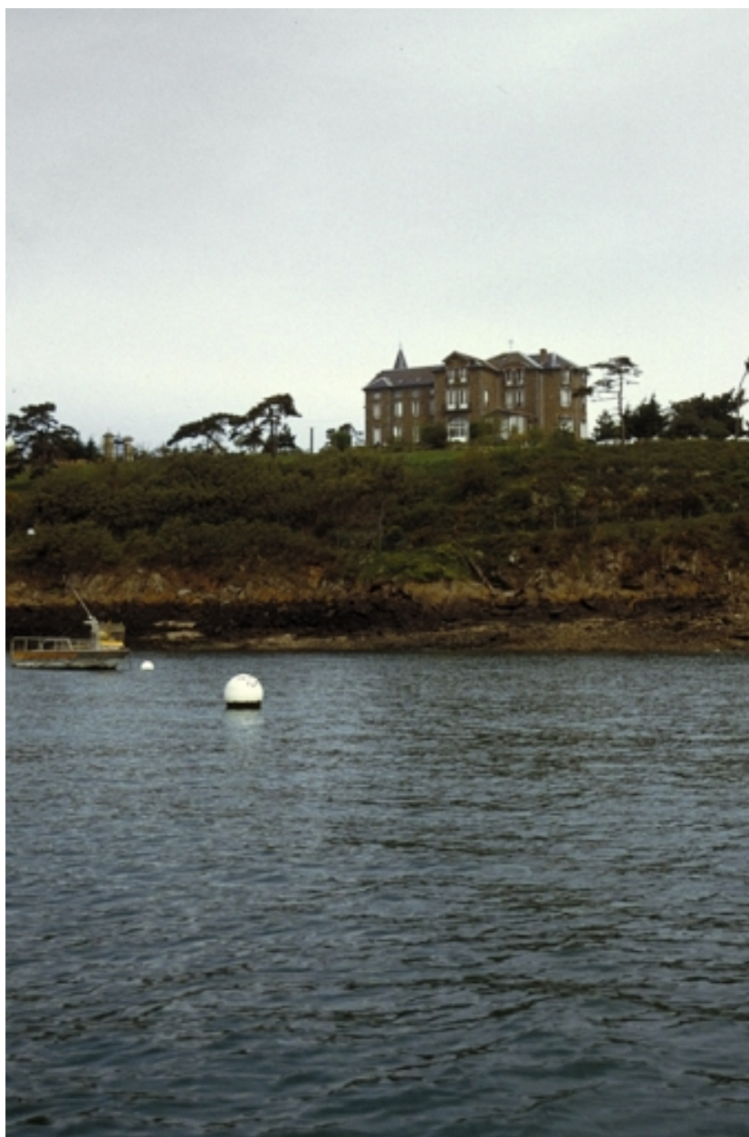
Vue de situation depuis le sud-est