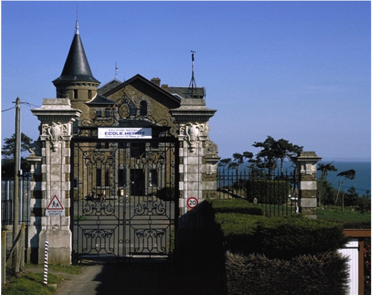
Le portail d'entrée : vue générale est