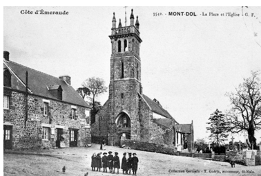
L'église : vue ouest (début 20e siècle) IVR53_19933500760X