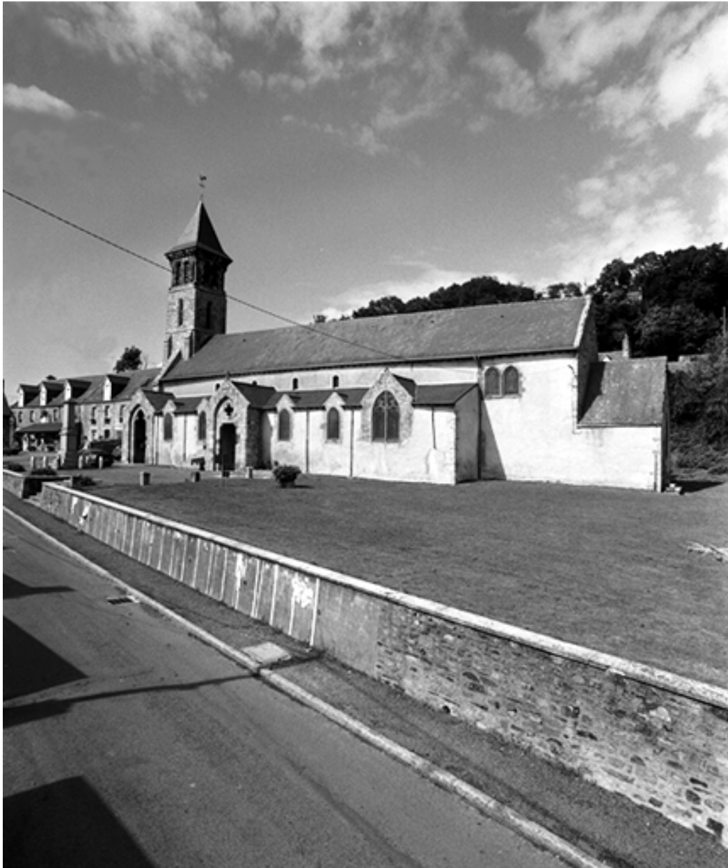
Vue générale sud-est