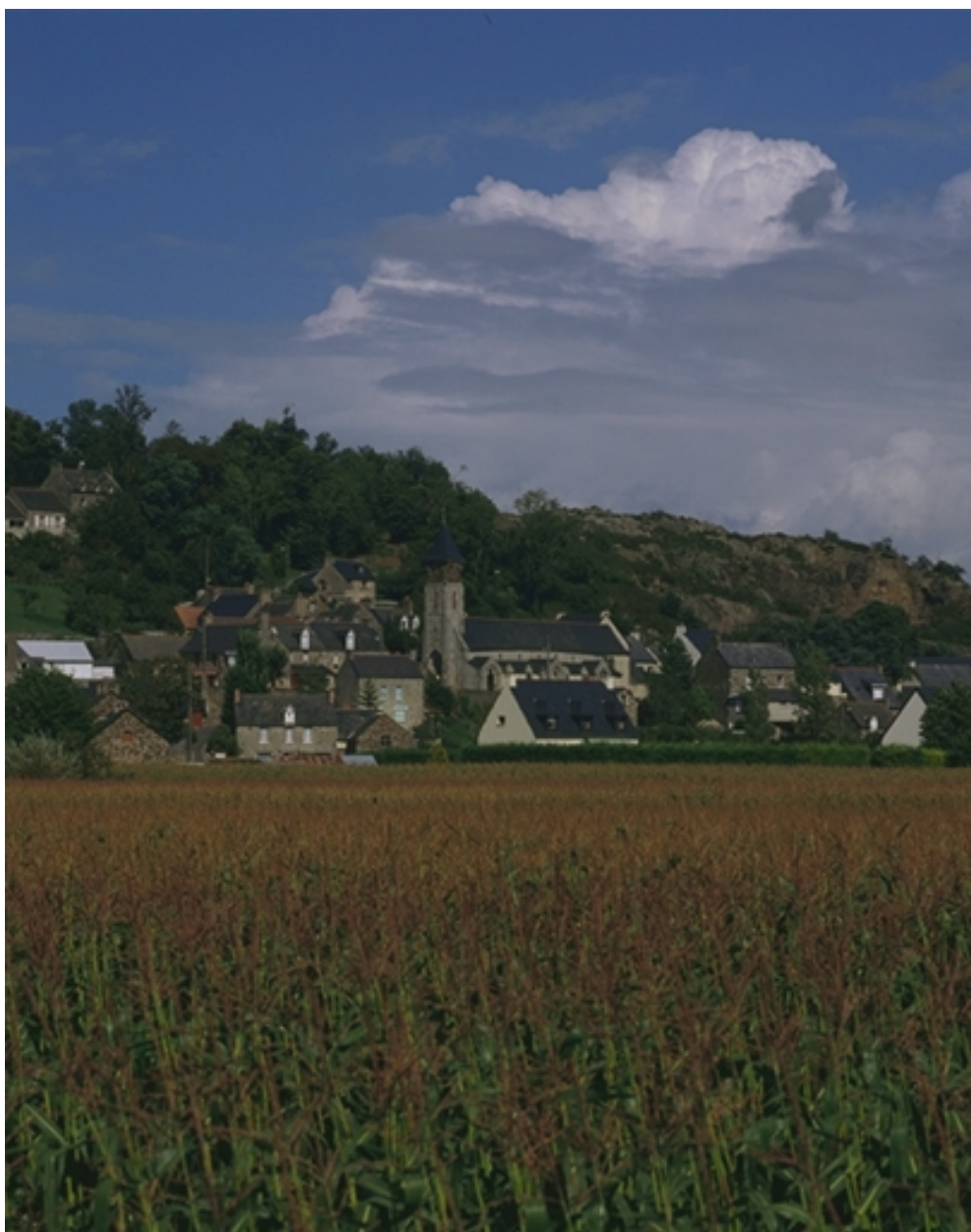
Vue de situation sud-ouest