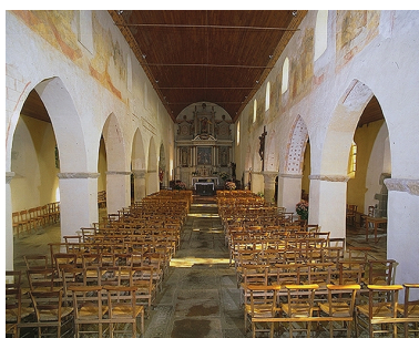
Vue générale vers le chœur