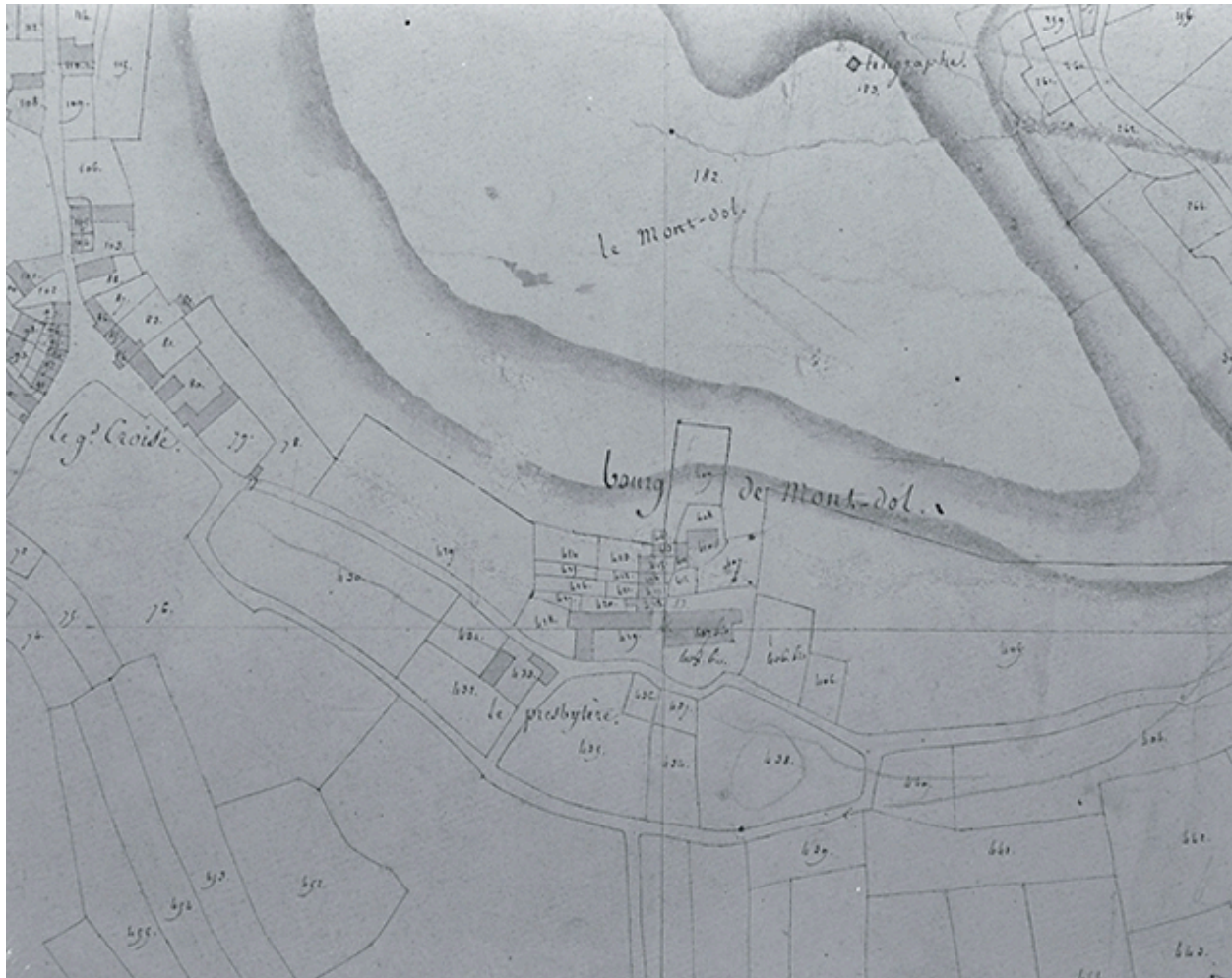
Plan de situation (cadastre de 1812)