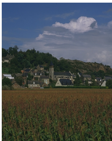
Vue de situation sud-ouest, IVR53_19943501835XA