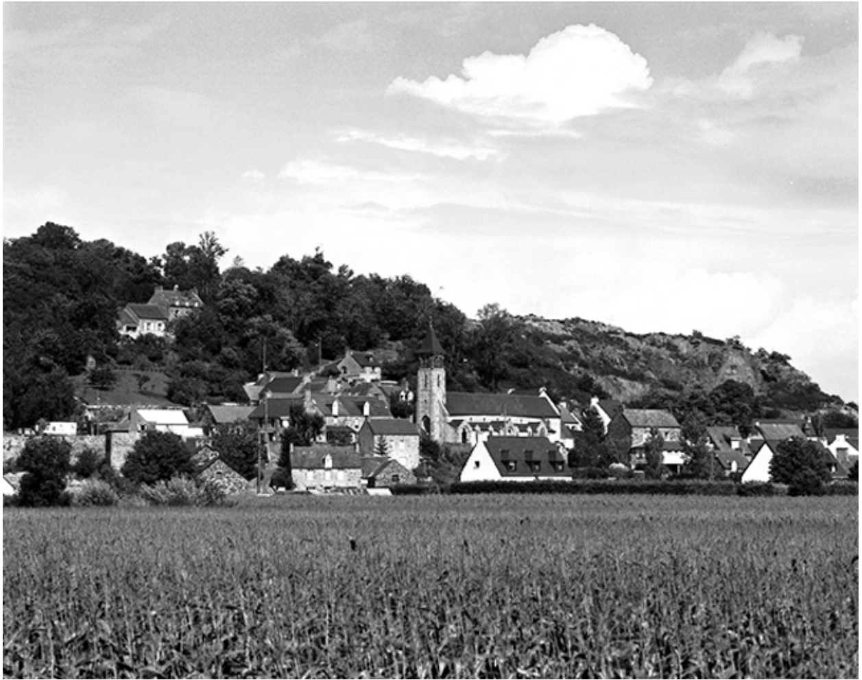
Vue de situation sud-ouest