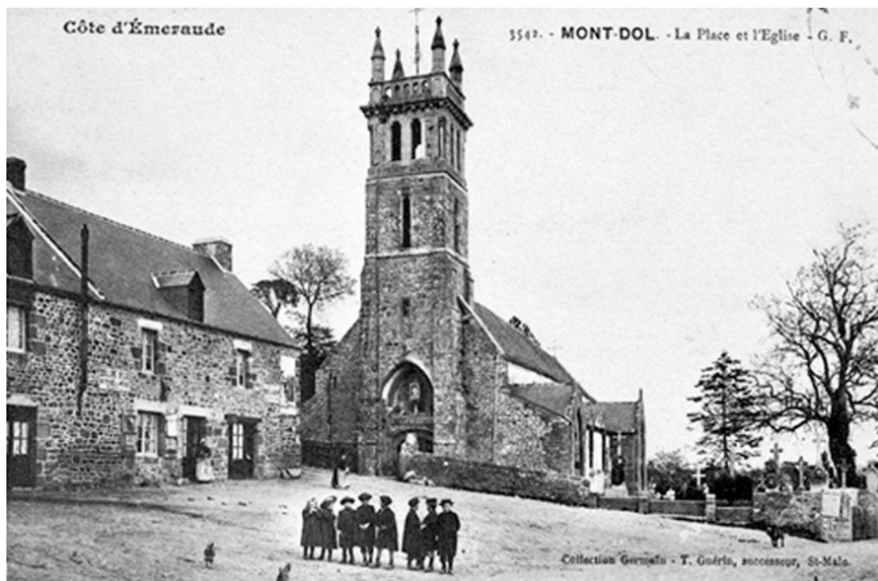
L'église : vue ouest (début 20e siècle)