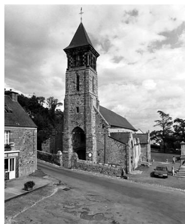
Vue générale sud-ouest IVR53_19943501808X