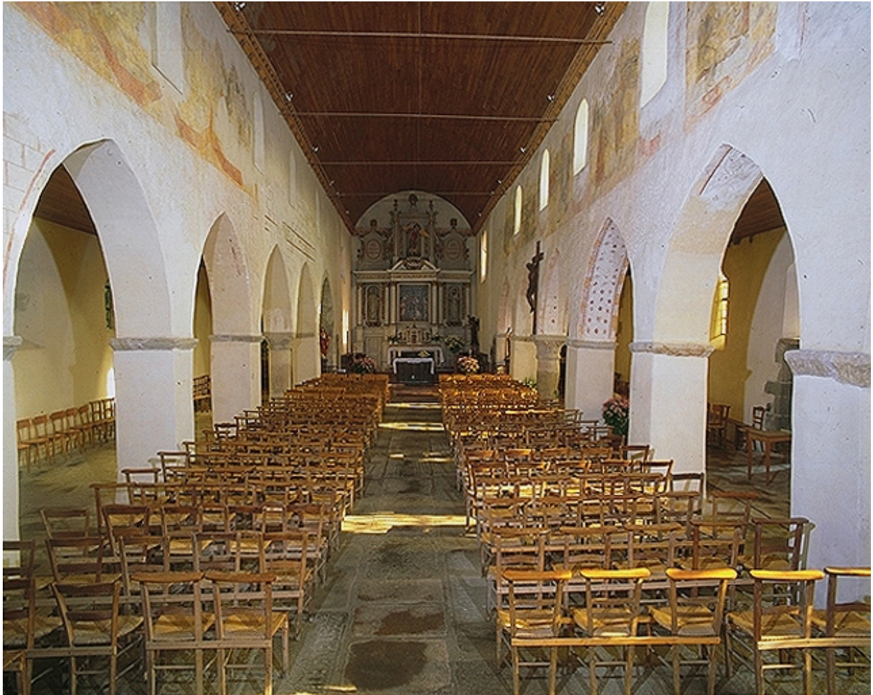
Vue générale vers le chœur