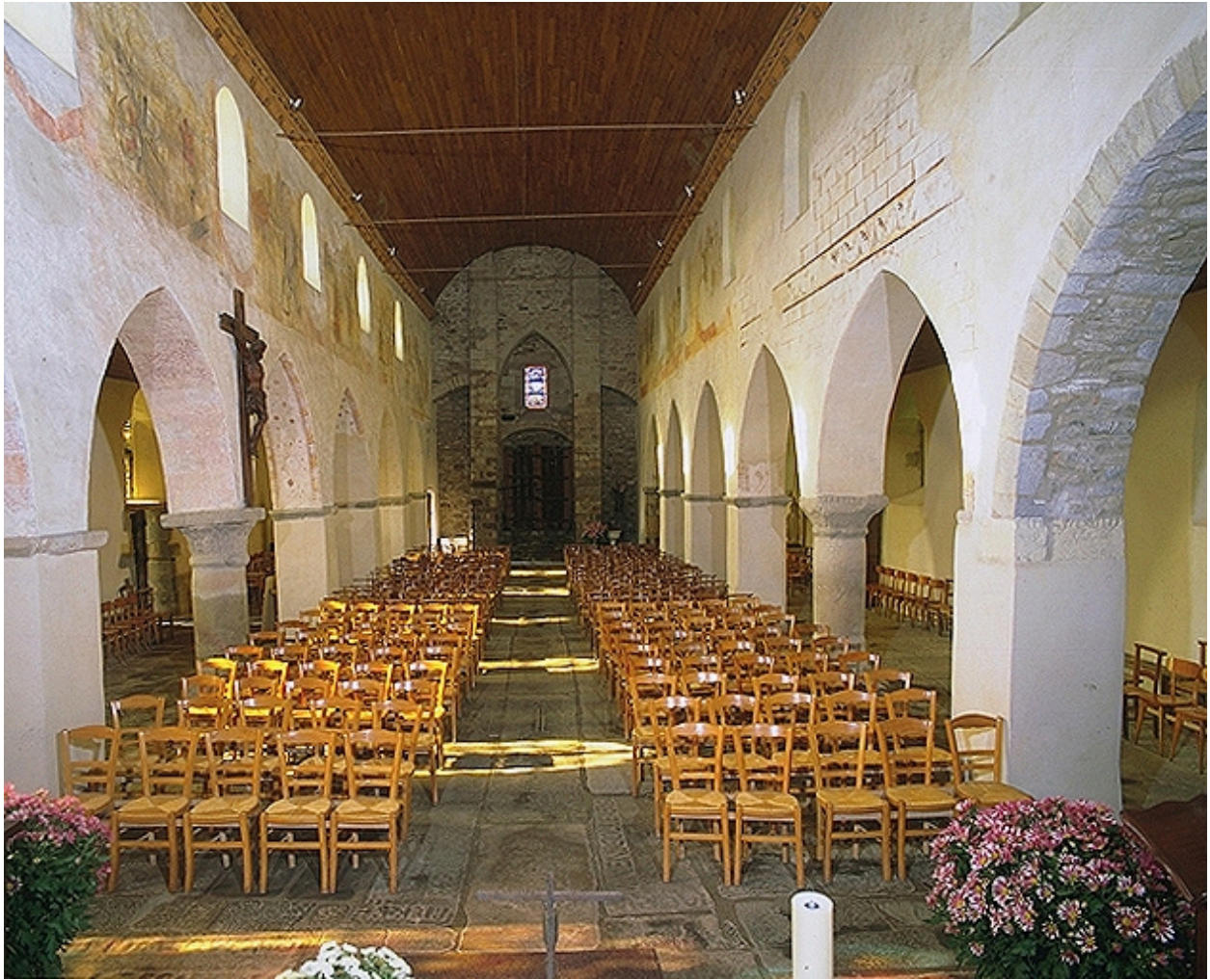
Vue générale vers la nef