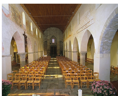
Vue générale vers la nef IVR53_19973501879XA