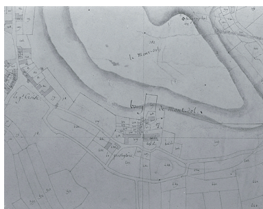
Plan de situation (cadastre de 1812)