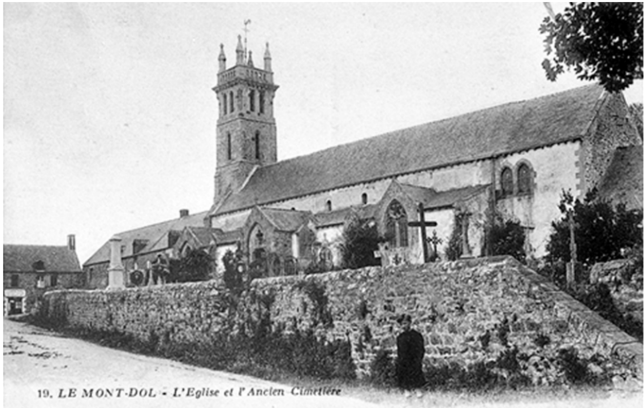
L'église : vue sud-est (début 20e siècle)