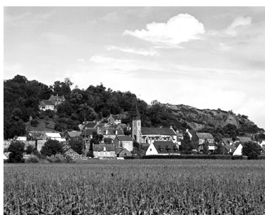
Vue de situation sud-ouest IVR53_19943501810X