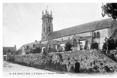
L'église : vue sud-est (début 20e siècle), IVR53_19933500761X