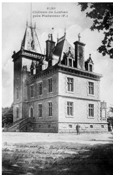
Vue générale IVR53_20042905614NUCB