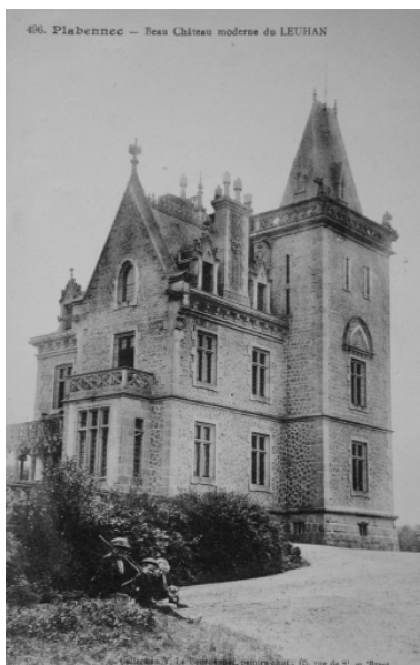
Vue latérale IVR53_20052904389NUCB