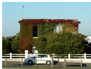
Villa Les Bleuets