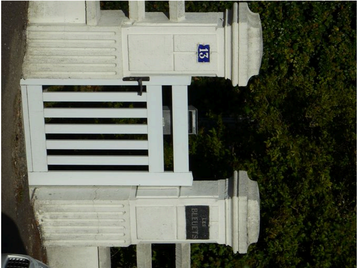
Mur de clôture avec piliers d'entrée cannelés de la villa Les Bleuets