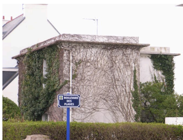
Façade nord de la villa Les Bleuets