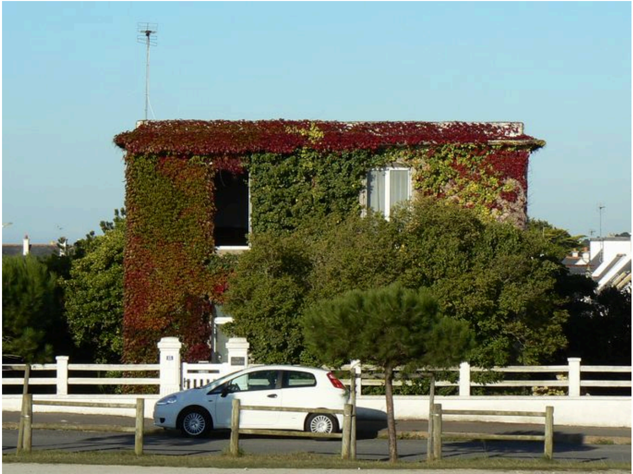
Villa Les Bleuets