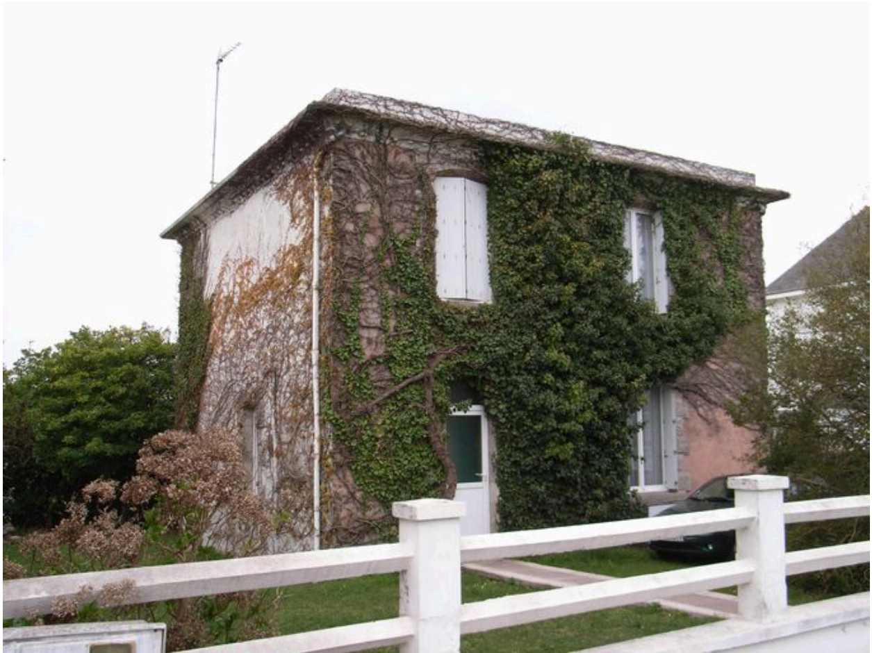
Vue générale de la villa Les Bleuets