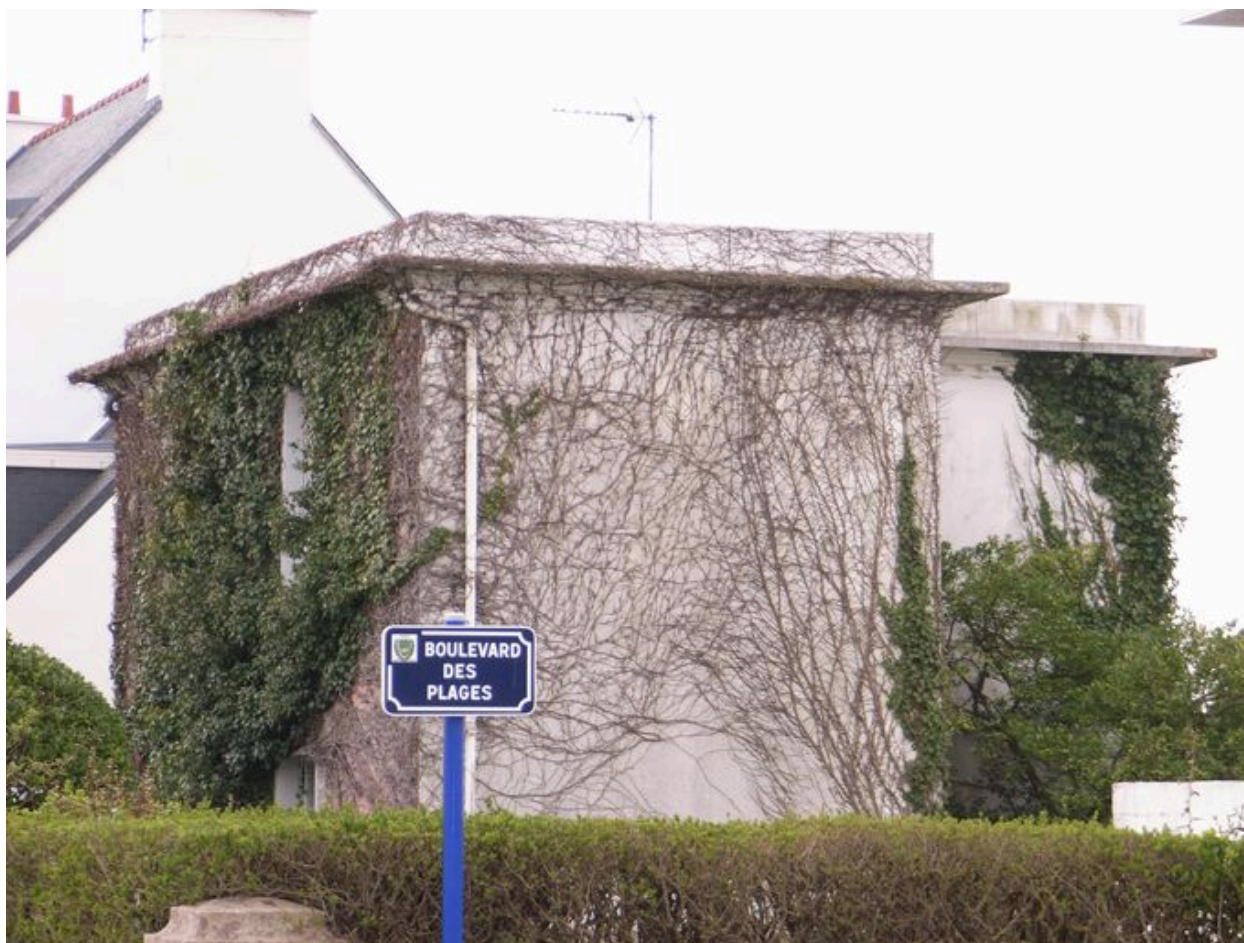
Façade nord de la villa Les Bleuets