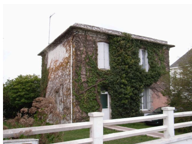
Vue générale de la villa Les Bleuets IVR53_20072909088NUCA