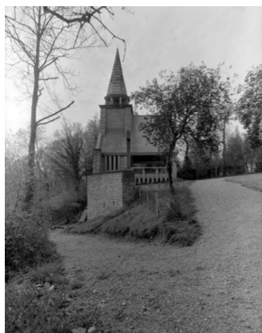
Elévation nord IVR53_19933500383X