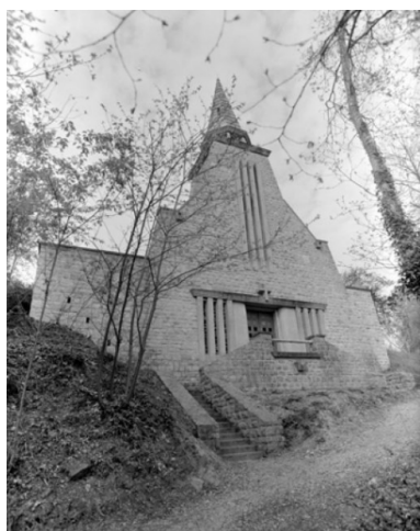
Elévation est : vue générale IVR53_19933500380X