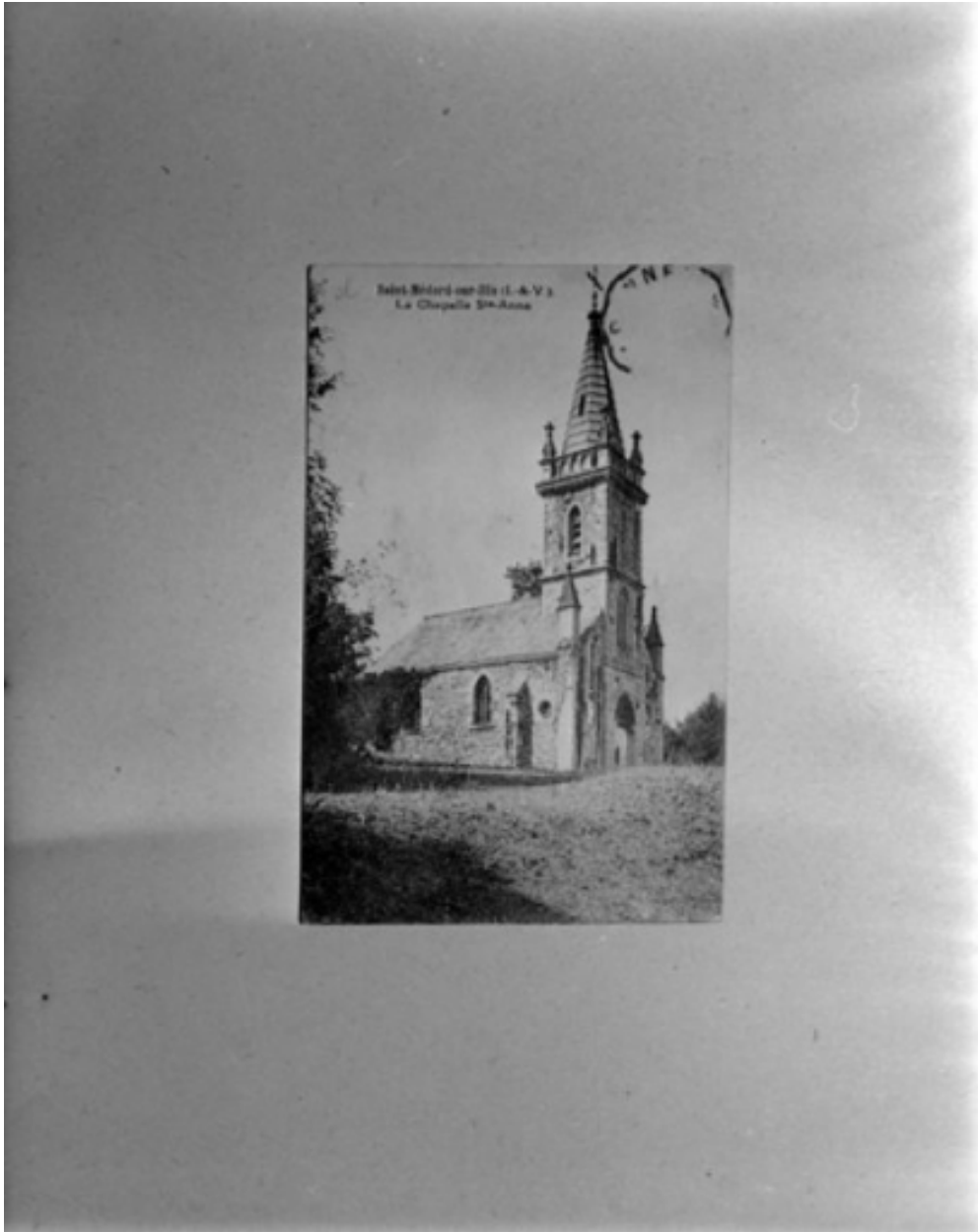
L'ancienne chapelle Sainte-Anne sur une carte postale