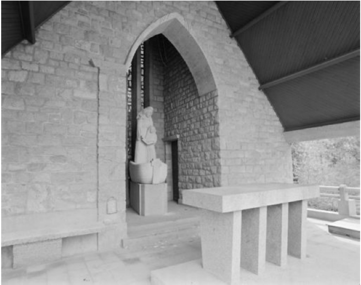
Intérieur chœur : vue générale