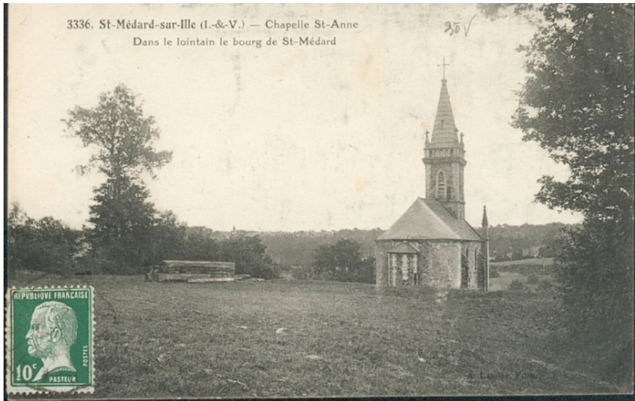
L'ancienne chapelle Sainte-Anne