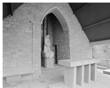
Intérieur chœur : vue générale IVR53_19933500382X