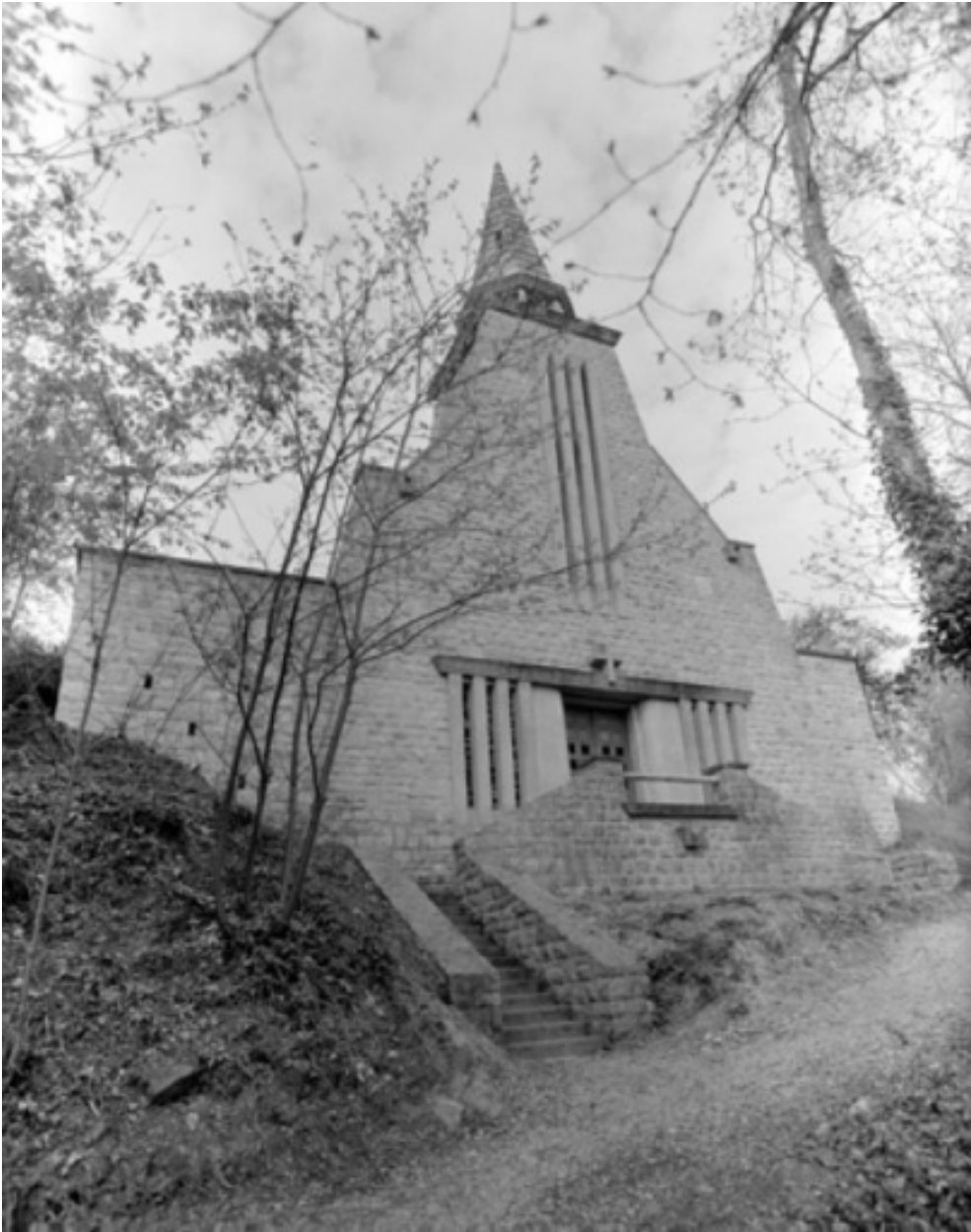
Elévation est : vue générale