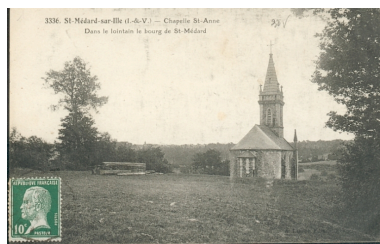
L'ancienne chapelle Sainte-Anne