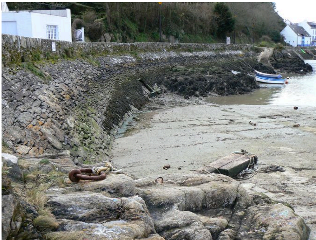
Quai du Vieux Doëlan et bas de la cale