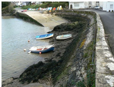
Vue générale du quai du Vieux Doëlan