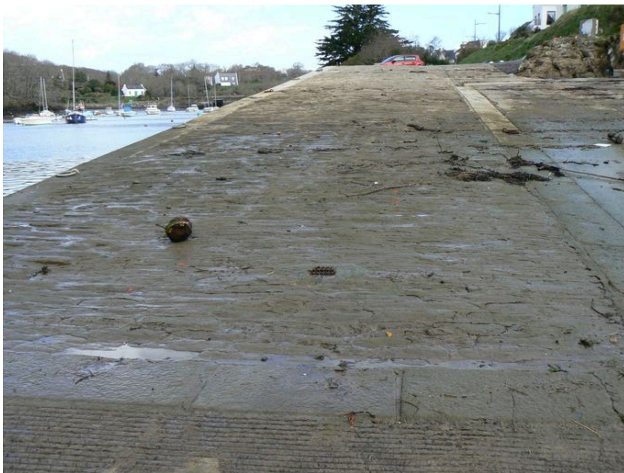
Parement de la cale du Vieux Doëlan