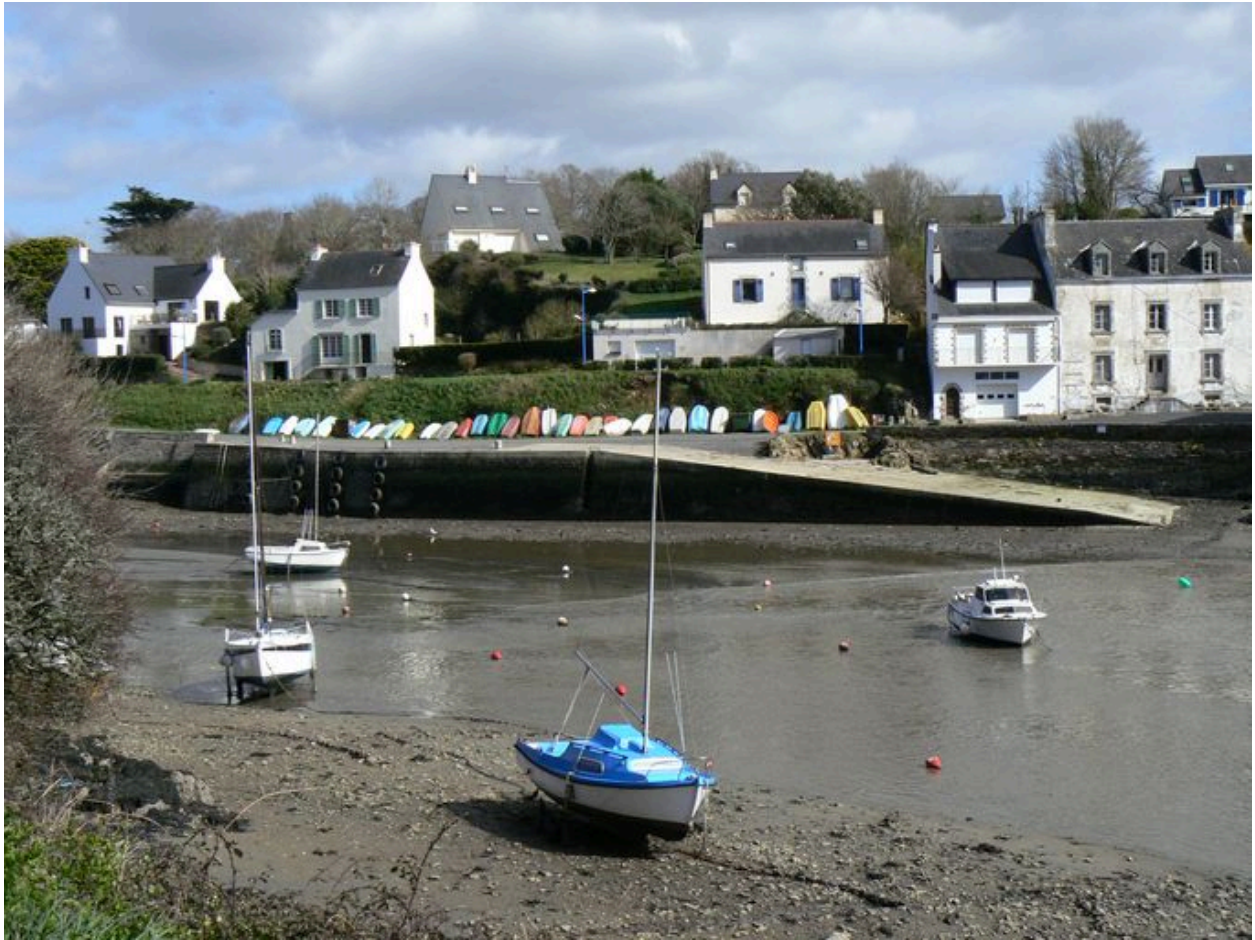
Quai et cale du Vieux Doëlan vus de la rive droite