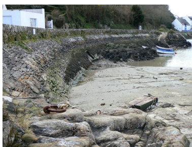
Quai du Vieux Doëlan et bas de la cale IVR53_20082908594NUCA