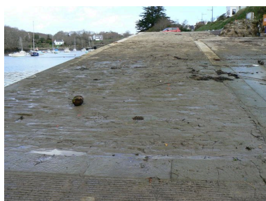
Parement de la cale du Vieux Doëlan IVR53_20082908593NUCA