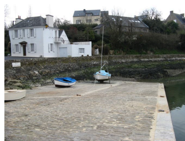
Vue du haut de la cale du Vieux Doëlan IVR53_20072909007NUCA