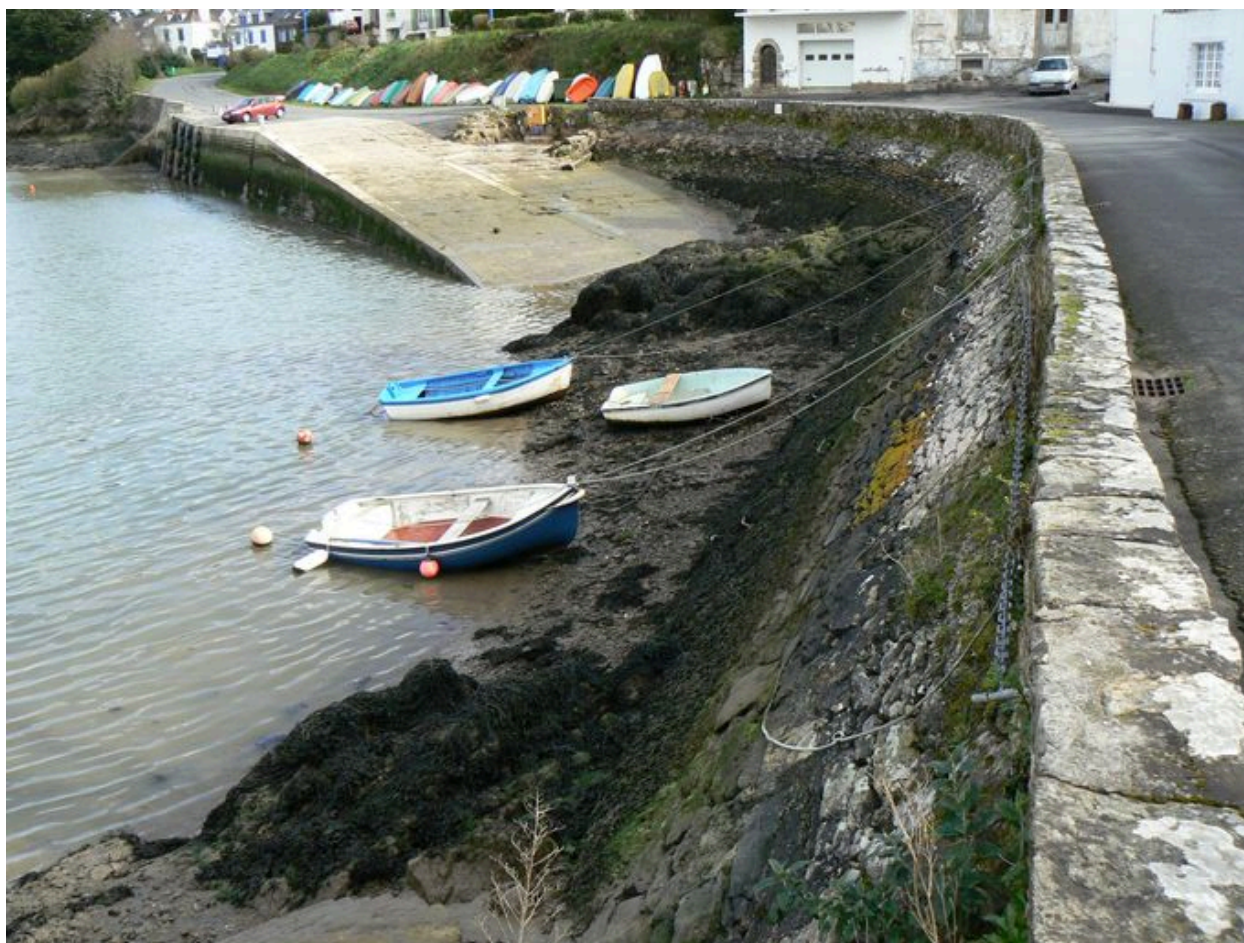
Vue générale du quai du Vieux Doëlan