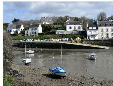
Quai et cale du Vieux Doëlan vus de la rive droite