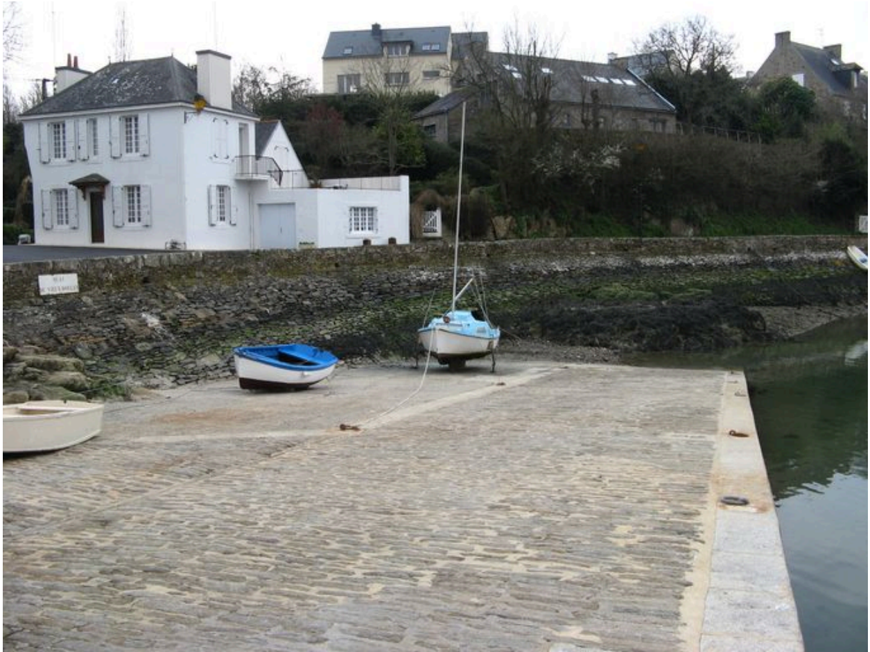
Vue du haut de la cale du Vieux Doëlan