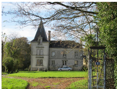
Logis, élévation antérieure est, état en 2015 IVR53_20155606968NUCA