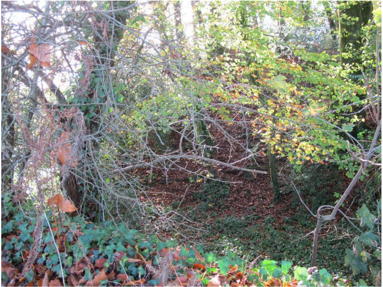
Motte et fossé, vue prise du nord-est, état en 2015