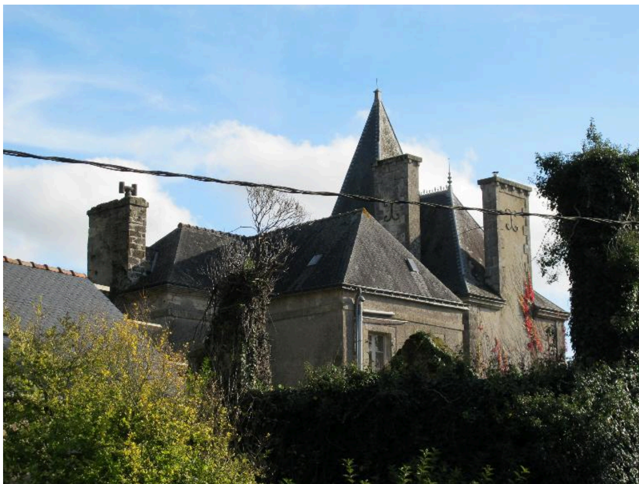
Logis, vue générale nord-ouest des toitures, état en 2015