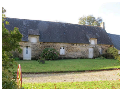
Ferme, élévation antérieure est, état en 2015 IVR53_20155606970NUCA