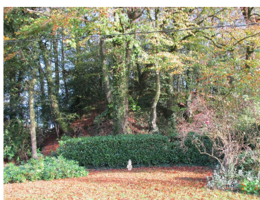
La motte prise de la cour de la ferme (ouest), état en 2015