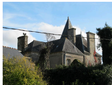
Logis, vue générale nord- ouest des toitures, état en 2015 IVR53_20155606972NUCA