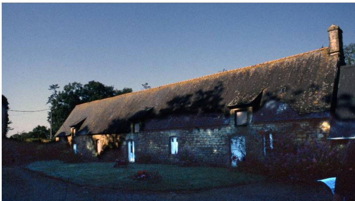
Ancienne ferme à l'est du château datée 1778, état en 1999