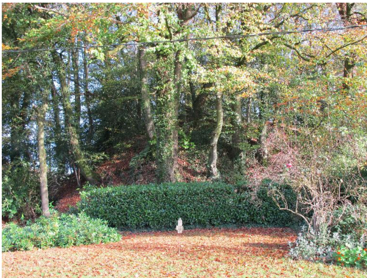
La motte prise de la cour de la ferme (ouest), état en 2015