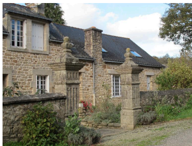
Piliers limitant l'accès à l'allée sud, déplacés à Malachappe, 18e siècle ?