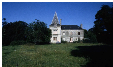
Logis, état en 1999 IVR53_20135602471ZA