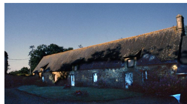
Ancienne ferme à l'est du château datée 1778, état en 1999