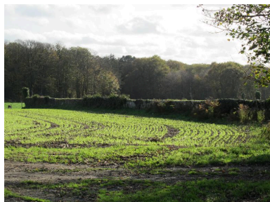
Enclos du parc du château, état en 2015 IVR53_20155606974NUCA