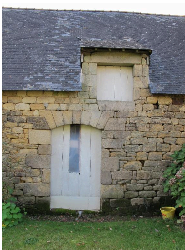
Ferme, détail de la porte de l'étable et de la fenêtre de grenier datée 1778, état en 2015 IVR53_20155606971NUCA