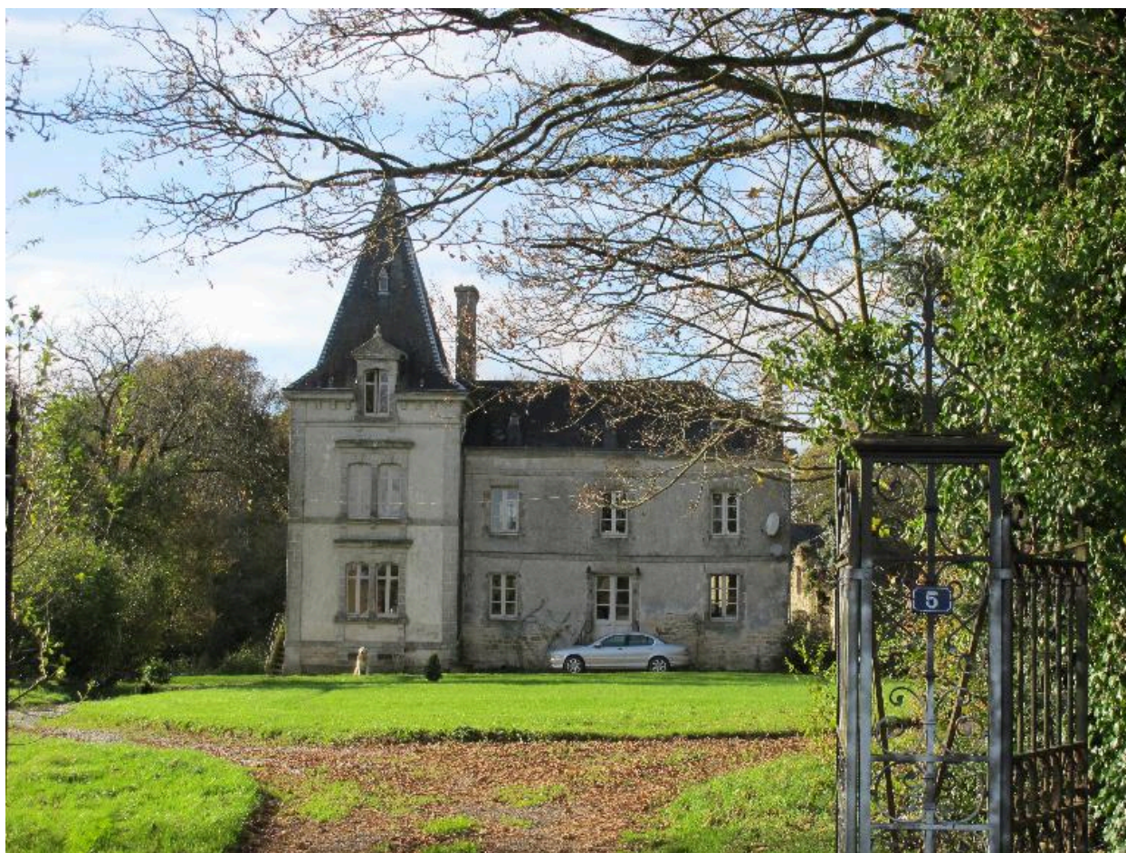
Logis, élévation antérieure est, état en 2015