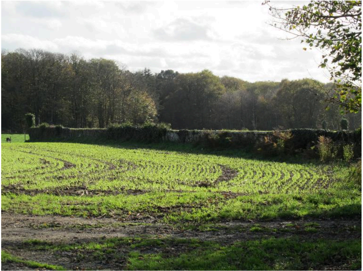
Enclos du parc du château, état en 2015