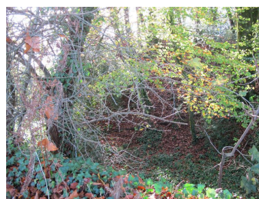
Motte et fossé, vue prise du nord-est, état en 2015