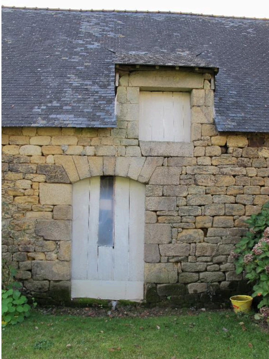
Ferme, détail de la porte de l'étable et de la fenêtre de grenier datée 1778, état en 2015