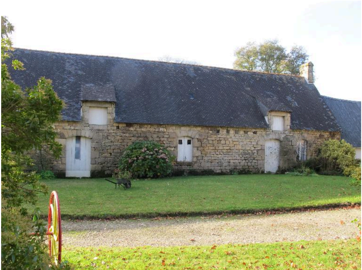
Ferme, élévation antérieure est, état en 2015