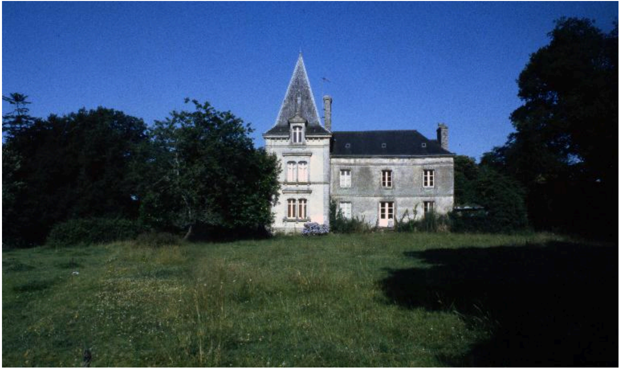
Logis, état en 1999