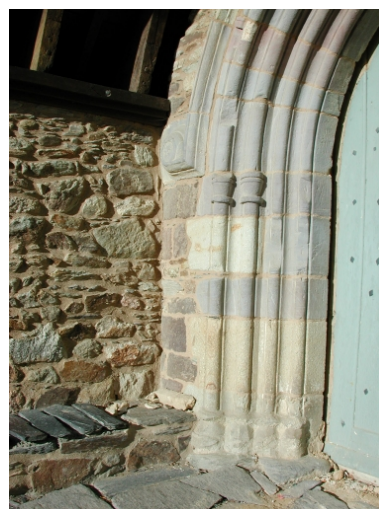
Détail : porte sud IVR53_20003510643NUCA