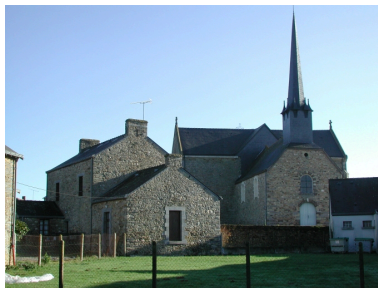
Vue de situation ouest IVR53_20003510648NUCA