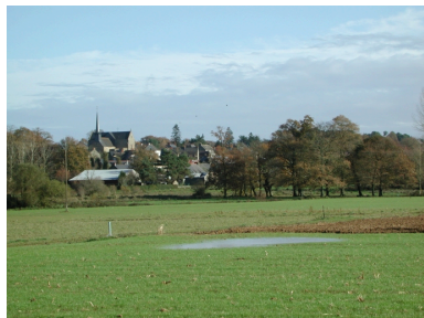
Vue de situation sud ouest