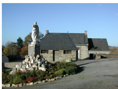
Ossuaire, vue de situation est IVR53_20003510639NUCA