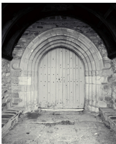
Porte sud