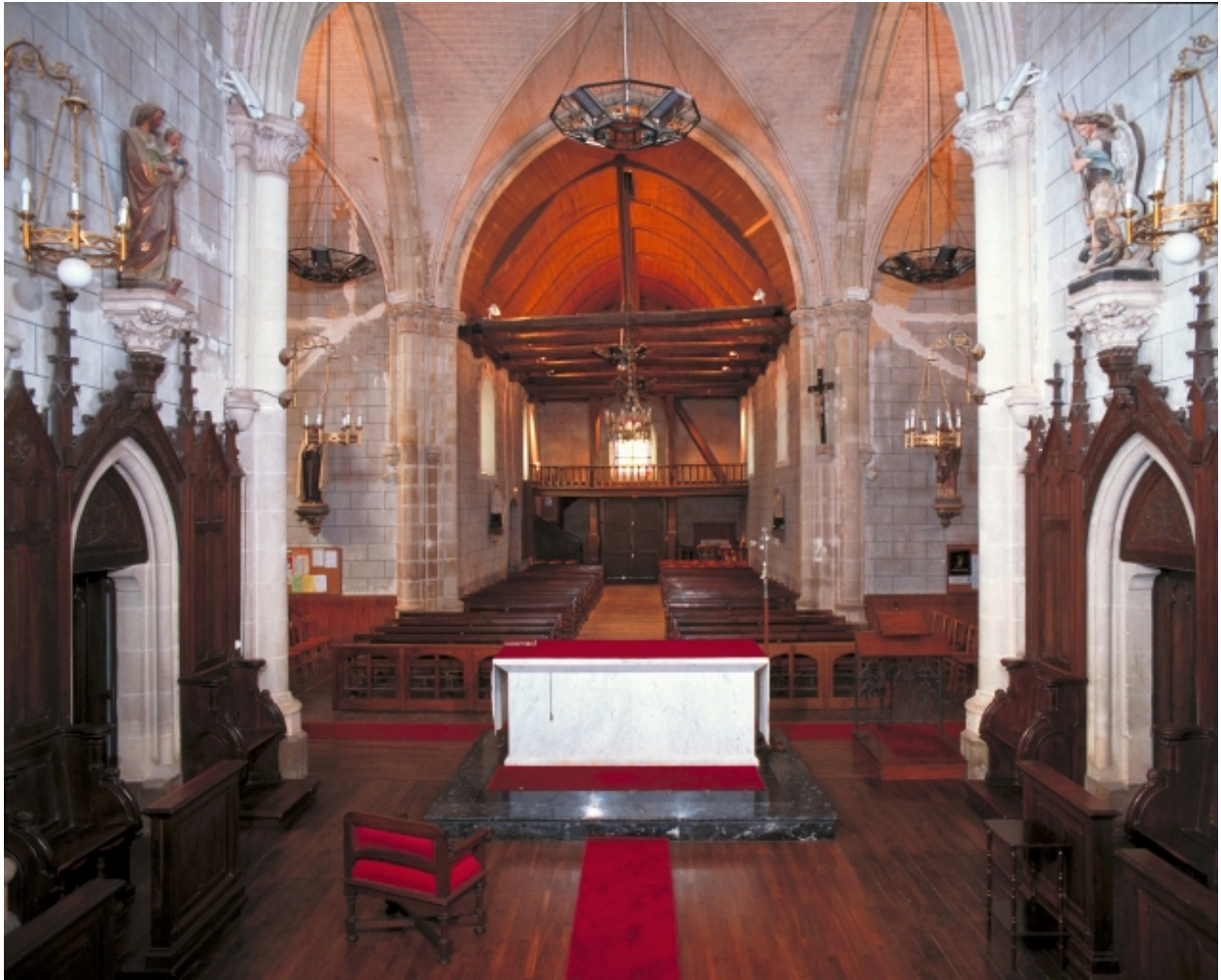
Vue intérieure prise du chœur vers la nef