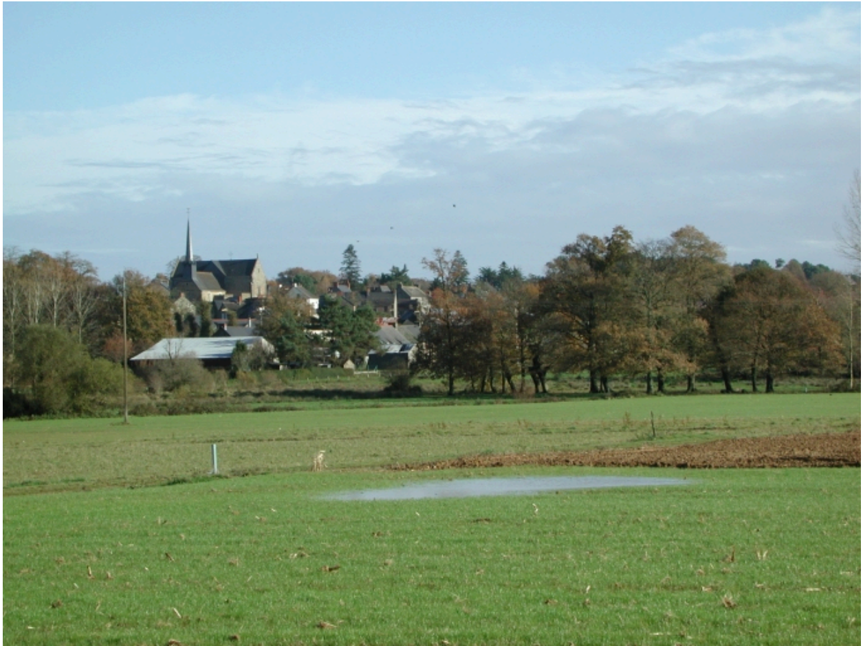
Vue de situation sud ouest