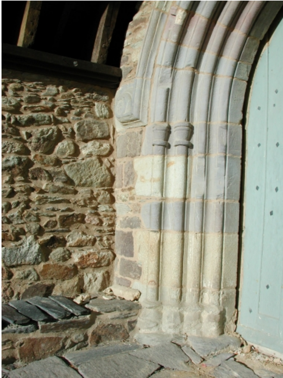
Détail : porte sud