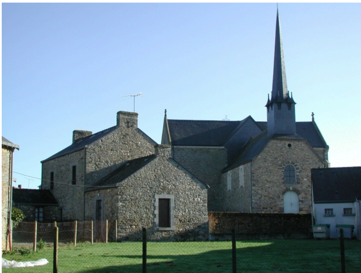
Vue de situation ouest