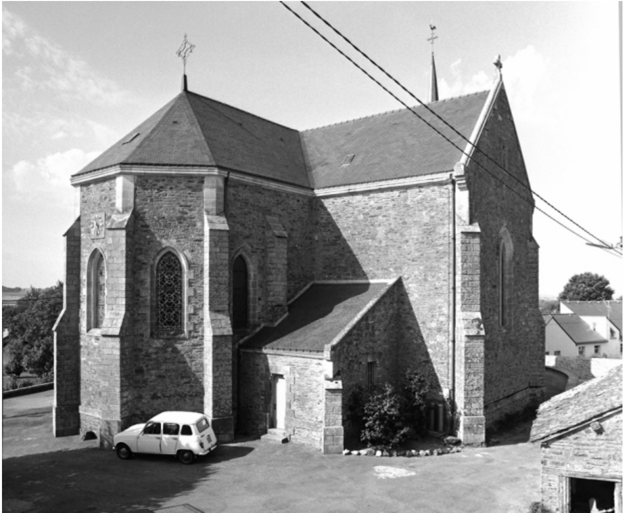
Vue générale est