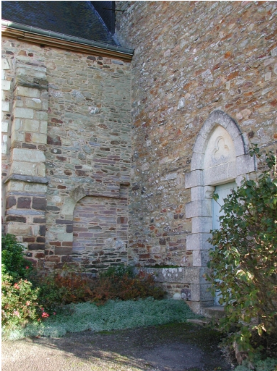
Raccord nef et transept