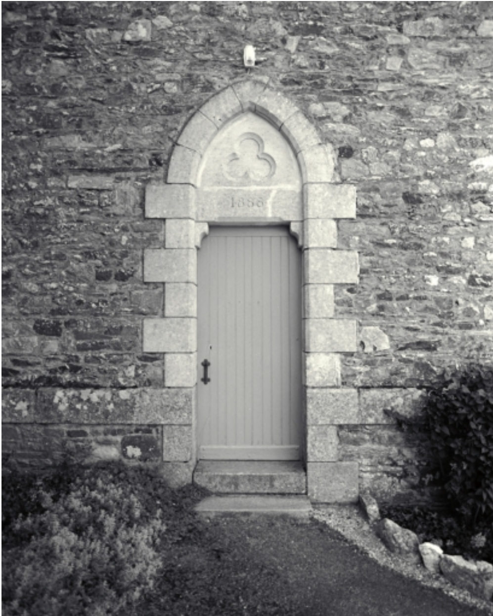
Porte du bras sud du transept