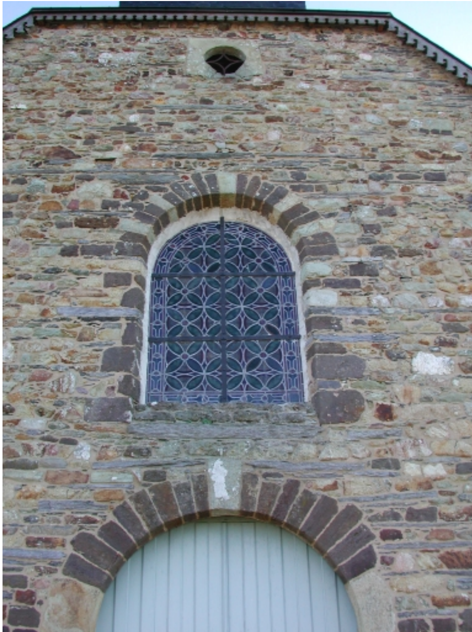
Détail : façade occidentale