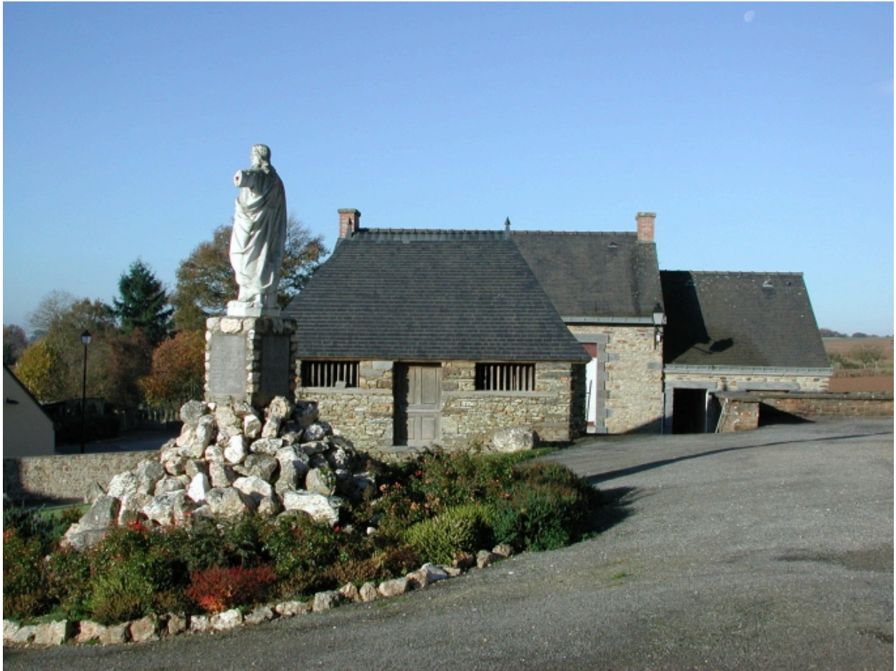
Ossuaire, vue de situation est