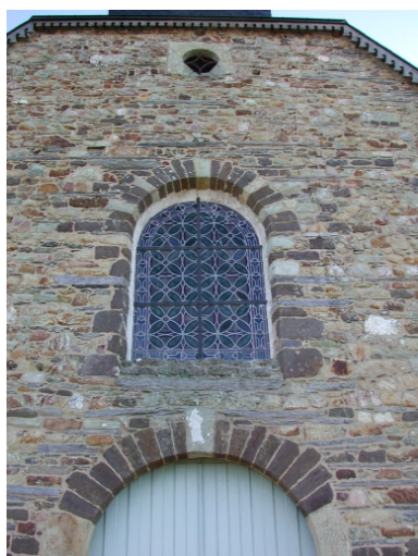
Détail : façade occidentale IVR53_20003510641NUCA