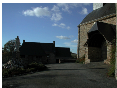
Porche sud, monument aux morts, ossuaire