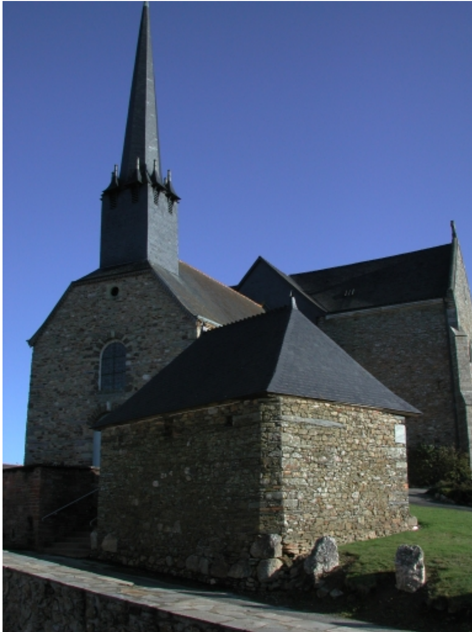
Vue générale sud ouest