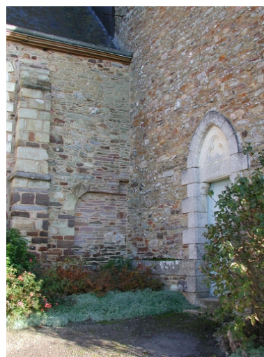
Raccord nef et transept IVR53_20003510640NUCA