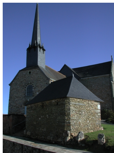
Vue générale sud ouest IVR53_20003510650NUCA