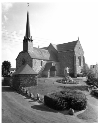
Vue générale sud IVR53_19943501757X