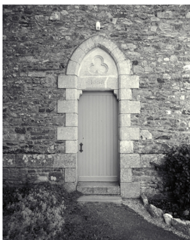
Porte du bras sud du transept