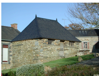
Ossuaire IVR53_20003510638NUCA