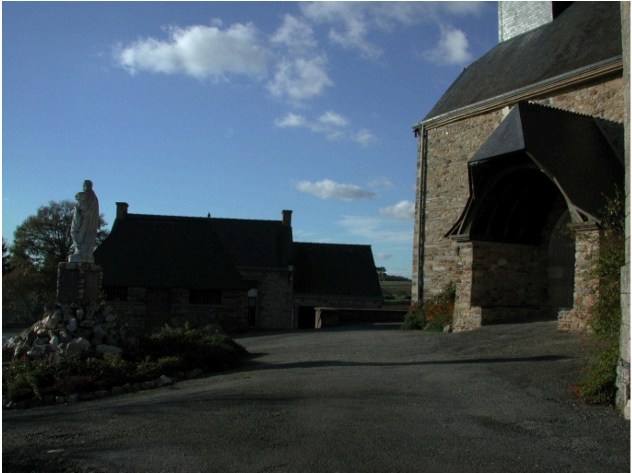
Porche sud, monument aux morts, ossuaire