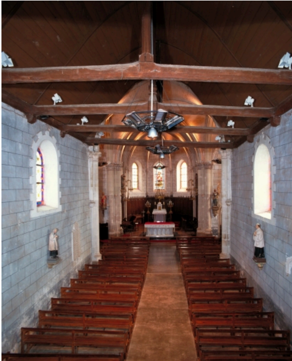
Vue intérieure prise de la nef vers le chœur