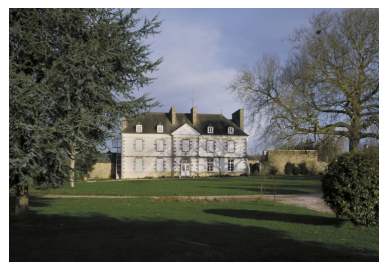
Vue générale sud IVR53_19992200007XA