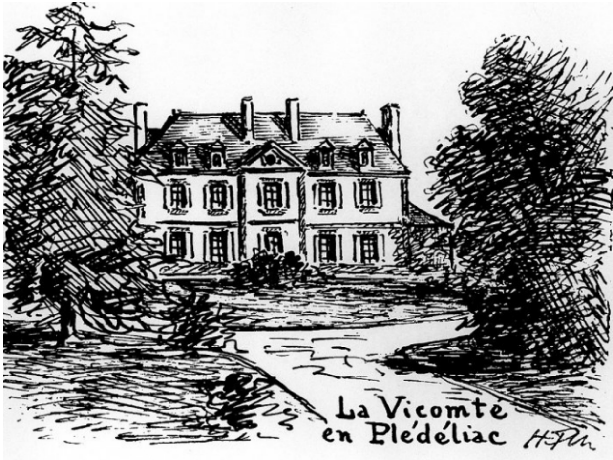
Repro. Dessin de Frotier : vue générale